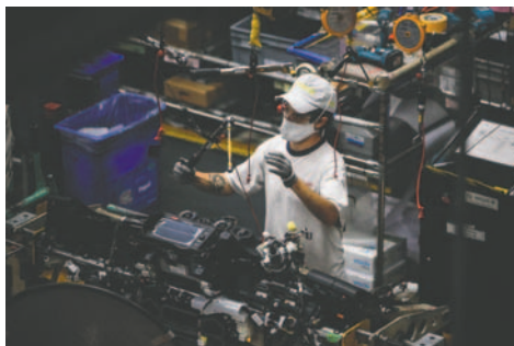
La Unión Industrial de Argentina (UIA), advirtió este martes de que la actividad industrial permanece en caída y alertó por la pérdida de empleos en el sector industrial

los representantes sectoriales y regionales señalaron la preocupación por la caída de la actividad, el aumento de los costos y el impacto del contexto económico en el sector productivo, así como también el incremento de