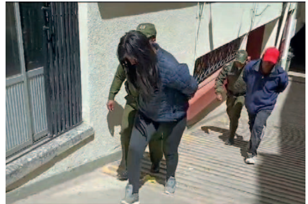
Madre cumple prisión preventiva

El 8 de enero de este año, un niño de dos años murió en