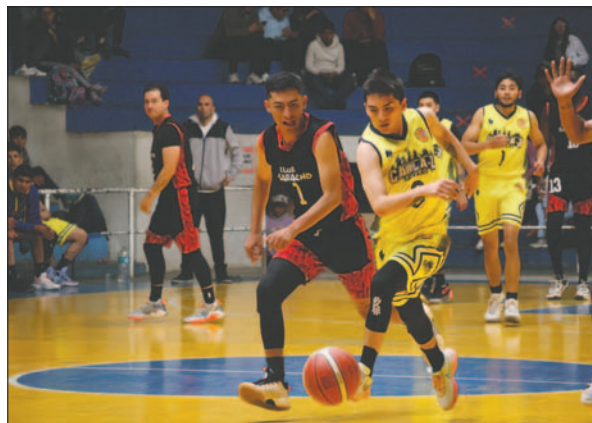
Saracho no frenó el objetivo de Carl A-Z de llevarse la victoria

En el segundo partido, el Club Atlético Nacional (CAN) se enfrentó a Litoral. El primer cuarto terminó con un marcador de 23 a 13 a favor de los celestes. En el segundo cuarto, los "caninos" ampliaron su ventaja con un parcial de 11 a 4, llegando a un marcador global de 34 a 17. El elenco marítimo intentó revertir el marcador en el tercer cuarto, pero CAN se mantuvo firme, cerrando el parcial 34 a 27 y aumentando el glo-