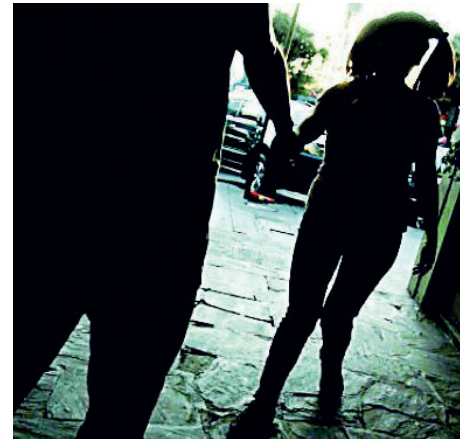
El hecho se registró en el municipio de Quillacollo / PARIONA