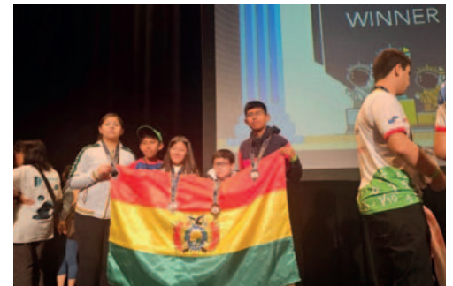
La delegación de estudiantes orureños que asistió a la competencia matemática

Los padres de familia jugaron un papel fundamental al asumir los costos económicos asociados al viaje y estadía de los estu-