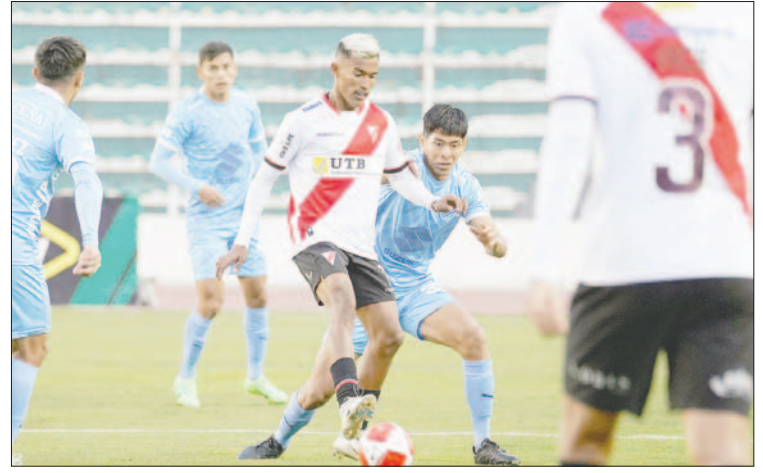
La actuación de Always Ready deja más dudas de cara su partido de Copa Sudamericana