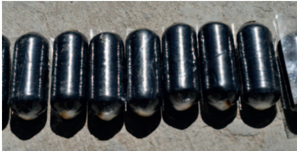
Sujeto ingirió 60 cápsulas de cocaína

de relieve los peligros extremos a los que se enfrentan las personas involucradas en el tráfico de drogas. Las autoridades continúan investigando el caso para determinar más detalles sobre el origen y destino de la droga.