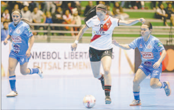
Las refuerzos respondieron a las exigencias del partido