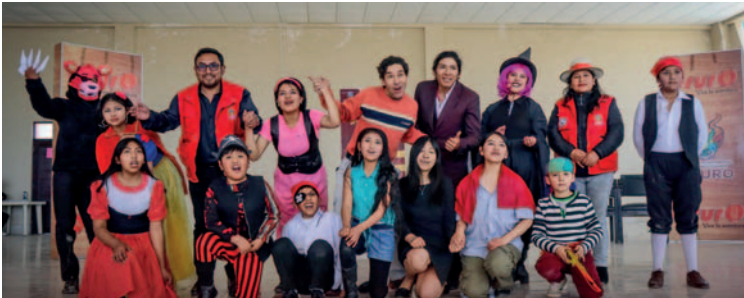
Clausura con entrega de certificados y demostraciones /SDCT-GADOR