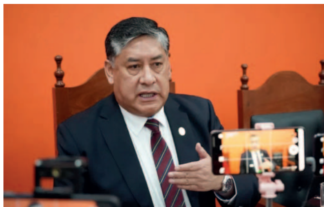
El Fiscal General del Estado, Juan Lanchipa Ponce

Asimismo, indicó que la falta de suficientes fiscales de materia y la extensa geografía del país di-