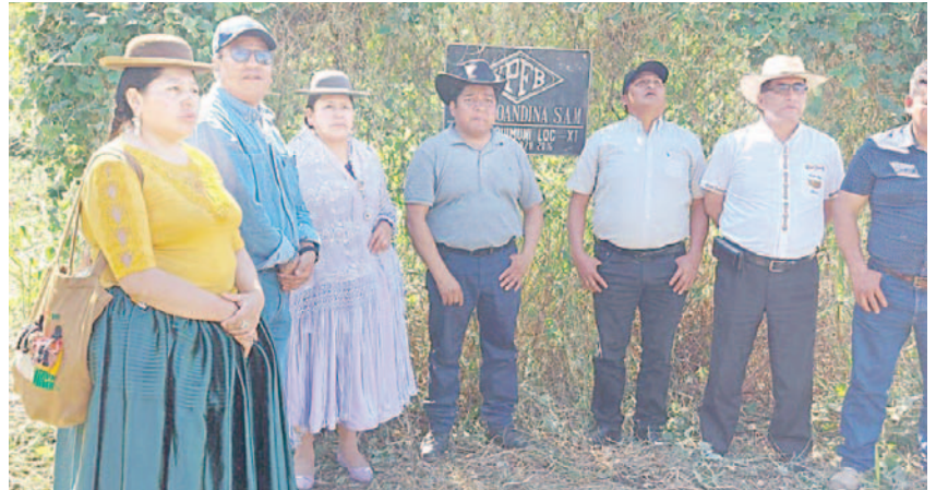
Legisladores en el pozo Lliquimuni Centro X1/RPOS