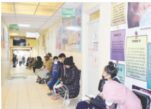
Mediante proyecto de ampliación, se busca mejorar la atención de los pacientes

de Infraestructura Educación, Salud y Deportes (Diesd) y la planificación del Gobierno Municipal para realizar una inspección y encaminar la ampliación del centro.