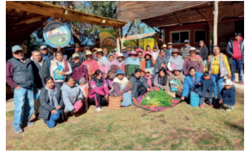
Encuentro de Productores de huertos familiares /CISEP

La productora compartió que en su experiencia, introdujo una alimentación más saludable con la producción de sus huertos. En el encuentro, varios de los productores destacaron