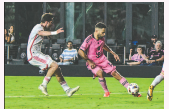
El Inter sigue en la cima esperando la recuperación del astro argentino

El Sporting Kansas City y el Saint Louis FC se repartieron los puntos (1-1). El choque del Real Salt Lake del colombiano Christian 'Chicho' Arango en el campo del Colorado Rapids fue interrumpido al descanso por razones climáticas, cuando los locales estaban ganando 2-1.