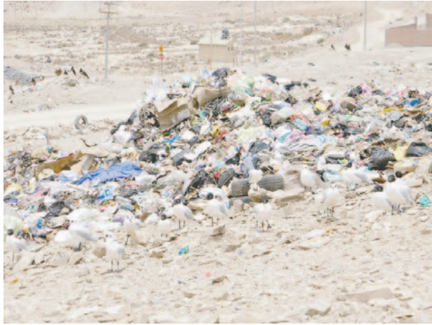
El relleno sanitario ya cumplió su vida útil

“Ya tenemos ocho posibles sectores en los cuales se puede establecer un nuevo Relleno Sanitario, una vez que se defina el lugar a través de un estudio a diseño final, el cual se está trabajando con el Ministe-