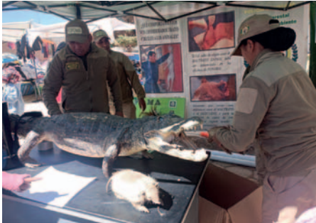
En la ocasión también se destacó el comercio ilegal de partes y animales salvajes