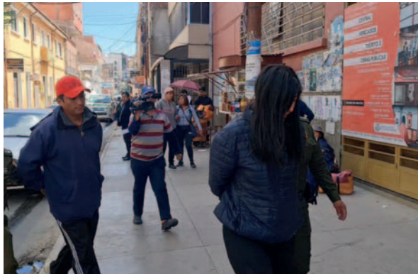
Madre y padrastro implicados en la muerte de un niño

"El fiscal tiene conocimiento de que existen elementos de convicción para ratificar la primera imputación, ya que la mamá era consciente de los malos tratos