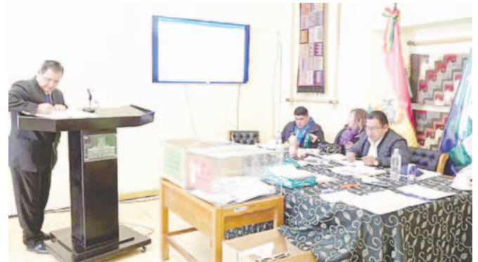
Un postulante al TCP rinde su examen ante una subcomisión de Constitución

“Con ese nuevo escenario, probablemente vamos a concluir hasta las 3 de la madrugada. Tenemos una cantidad superior a los 150 postulantes