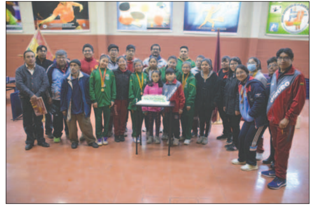
La familia del tenis de mesa orureño se proyecta a nuevos desafíos

Además, se llevó a cabo la premiación del campeonato Aniversario, el cual se realizó en dos cate-