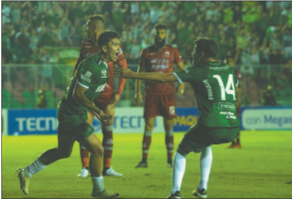
Oriente Petrolero deja atrás los problemas y sigue sumando triunfos