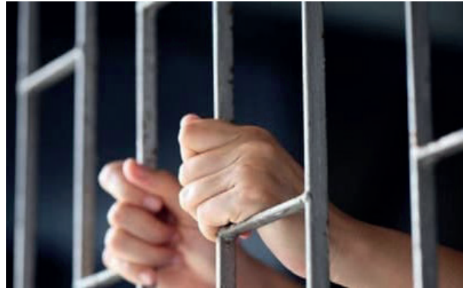
Condenan a sujeto por violar y dejar embarazada a una adolescente

maestra de la adolescente alertó a la Defensoría de la Niñez y Adolescencia sobre el probable embarazo de una de sus estudiantes. Esto llevó a la Fiscalía a abrir el proceso penal que culminó con la condena del sujeto.