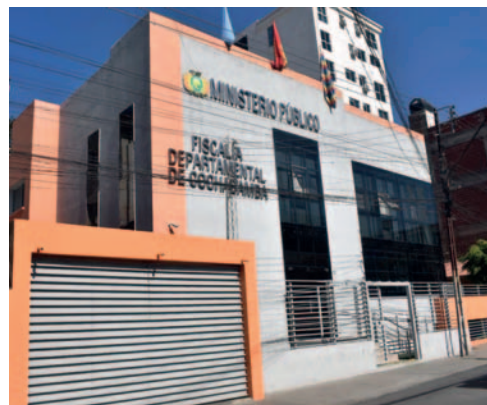
Edificio del Ministerio Público /FISCALÍA

Ese día, la niña, en horas de la noche, mientras se dirigía al baño, fue interceptada por su tío, quien