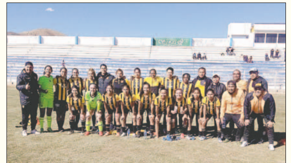
The Strongest va sumando victorias y se acerca a la clasificación

Independiente se queda con 4 unidades y deberá ganar todos los partidos restantes para tener posibilidades de clasificación.