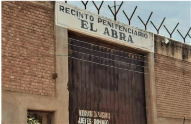
Recinto penitenciario de El Abra