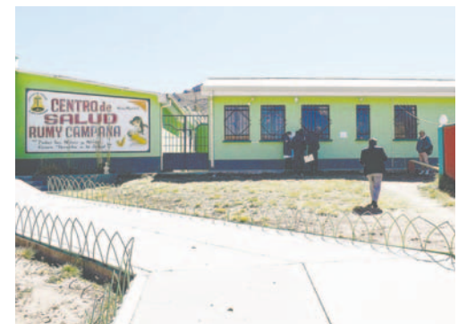
Centro de Salud Integral Rummy Campana necesita ampliarse / CMO

El centro de salud ya cuenta con el perfil del proyecto y la ampliación se emplazaría en el sector del frontis de dicho establecimiento de salud. Se coordinará con la Dirección