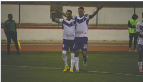
Sanguinetti y Tarasco una dupla que promete en el plantel orureño

Las palabras del técnico Rolando Carlen después del partido del sábado son fundamentales para que el equipo y los aficionados puedan manejar el resultado ante The Strongest con calma. Teniendo en cuenta que el camino para alcanzar el objetivo de la clasificación aún es largo, se debe avanzar paso a paso.