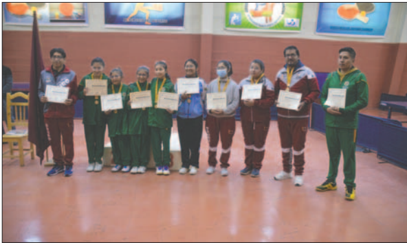
Deportistas consagradas a nivel nacional y entrenadores fueron reconocidos

La celebración culminó con números musicales realizados por los propios deportistas para deleite de los asistentes.