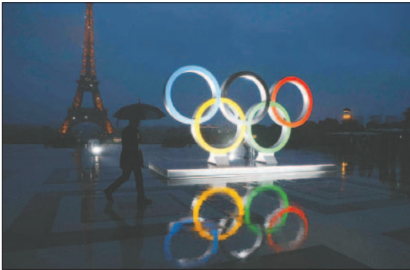
Restan pocos días para el inicio del evento deportivo mundial

El presidente del comité organizador de París 2024 destacó además el récord de venta de billetes para unos Juegos, batiendo a Atlanta 1996, al alcanzar los 8,8 millones y recordó que aún hay 20 deportes con entradas disponibles.