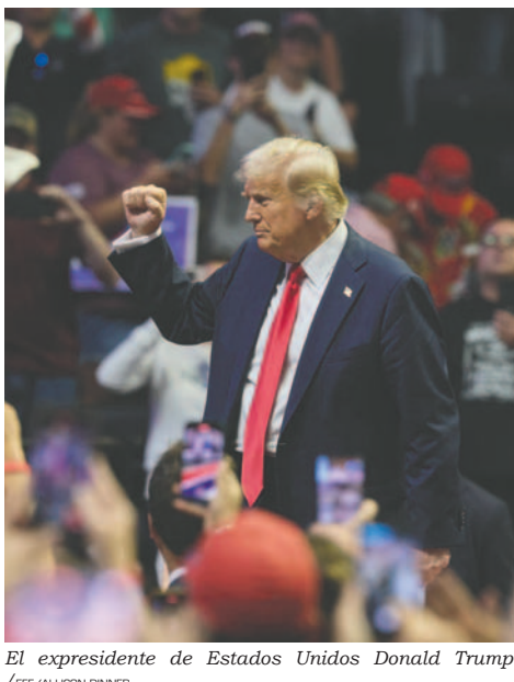
El expresidente de Estados Unidos Donald Trump