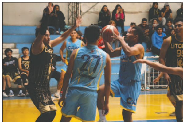
Los caninos se impusieron ante Litoral

Como dato adicional, el torneo de 2022 también vio a Carl A-Z y CAN enfrentarse en la final, donde el cuadro azul y amarillo se llevó el título. Este antecedente añade un nivel extra de emoción y rivalidad a la próxima final. Los partidos de ida y vuelta se llevarán a cabo el 28 de julio y el 1 de agosto, respectivamente, y prometen ser encuentros electrizantes que mantendrán a los aficionados al borde de sus asientos.