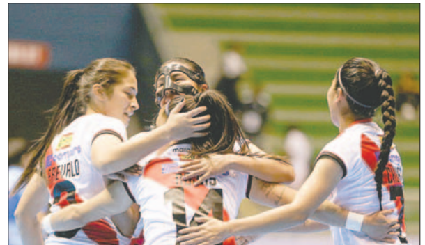
El elenco boliviano se coloca como firme candidato a la clasificación

tre el brasileño Stein Cascavel, vigente campeón de la Copa Libertadores, y el colombiano Llaneros. Las brasileñas no tuvieron piedad de sus rivales y las golearon 11-0, posicio-