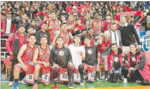
Pichincha selló su clasificación venciendo a la "U" / CLUB PICHINCHA

El partido de desempate será el miércoles a las 19:00 en la ciudad de Potosí. El vencedor de la ronda jugará contra Nacional Potosí en las semifinales.