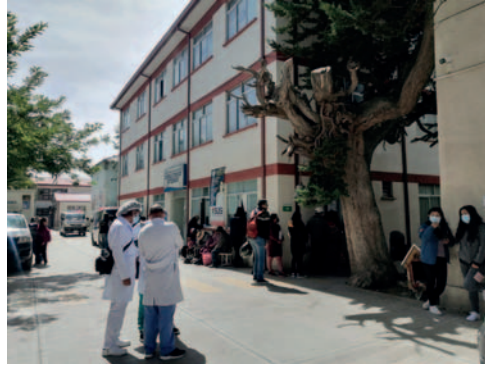
Hospital General realiza el proyecto de un Hospital Oncológico

"Administrativamente, la capacidad instalada actual no satisface nuestras necesidades. Además, el recurso humano disponible tampoco es suficiente, a pesar de nuestro crecimiento. Realizamos qui-