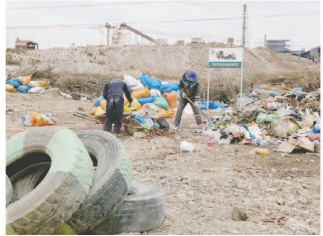
Hasta el 2026 se debe trabajar el cierre del relleno de Huajara

Según el plan de establecido, todo este proceso tiene que acompañarse de un monitoreo periódico en un lapso de aproximadamente 10 años, hasta garantizar que el Relleno Sanitario se haya cerrado definitivamente.