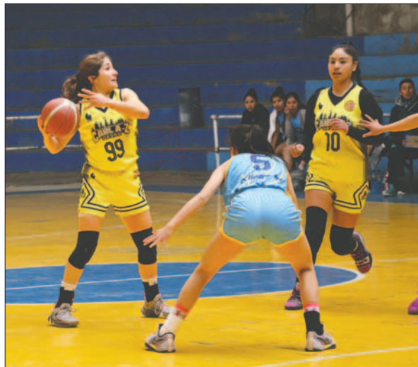
Carl A-Z buscará la revancha por el título contra Alemán

Alemán no bajó el ritmo en el tercer cuarto, obteniendo un parcial de 13 a 9 y un marcador glo-