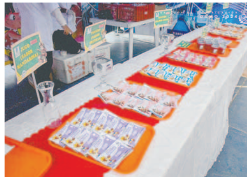
Alimento Complementario se entrega a los estudiantes

“Este año hemos tenido temperaturas incluso más bajas que el año pasado y