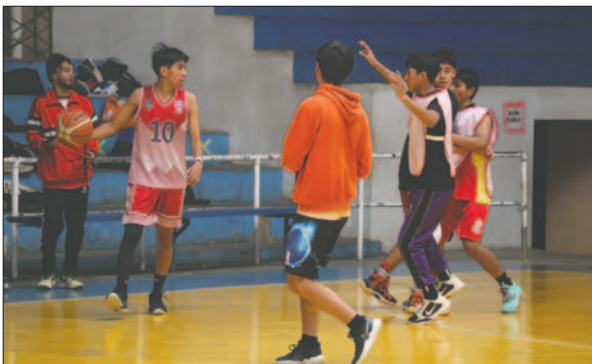
Intenso entrenamiento de los jugadores de la selección U-16