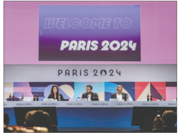
El Comité Organizador tiene un plan de contingencia ante la amenaza del Covid