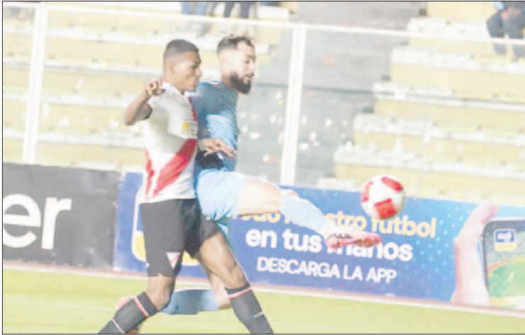
Bolívar mostró un nivel bajo que causó el enojo de sus aficionados