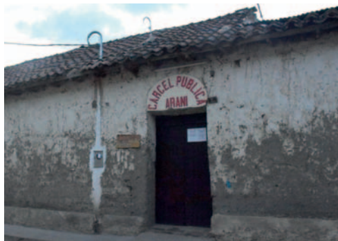
La carcelita de Arani en Cochabamba