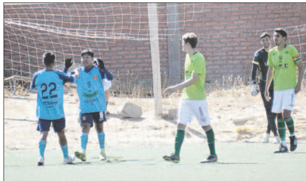
Deportivo Rosario se hizo fuerte ante Sur-Car