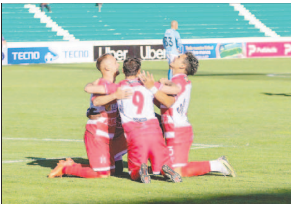
El cuadro sucrense se hace fuerte en su reducto