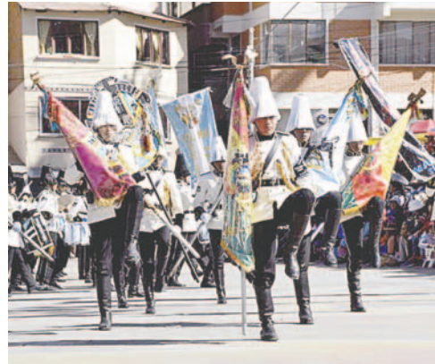
Unidades Educativas se preparan para los desfiles del 6 Agosto

Para el jueves 1 de agosto a las 09:00 horas se realizará el desfile escolar nivel inicial en familia comunitaria y el punto