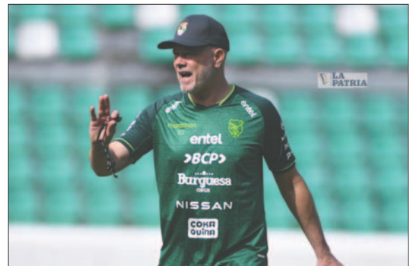
Tras ocho meses en el cargo, Zago le dice adiós al combinado nacional

El reemplazante de Zago todavía está bajo análisis. Entre los nombres se encuentran profesionales bolivianos y extranjeros. En los siguientes días se dará a conocer al nuevo cuerpo técnico, que comenzará a trabajar recién los últimos días de agosto, de cara a los partidos contra Venezuela, el 5 de septiembre en La Paz, y ante Chile, el 10 de septiembre en Santiago.