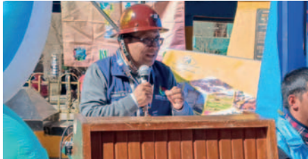
El Defensor del Pueblo, Pedro Callisaya Aro, en el municipio orureño de Huanuni