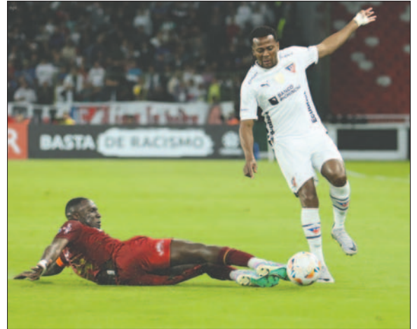
La clasificación está cuesta arriba para Always Ready