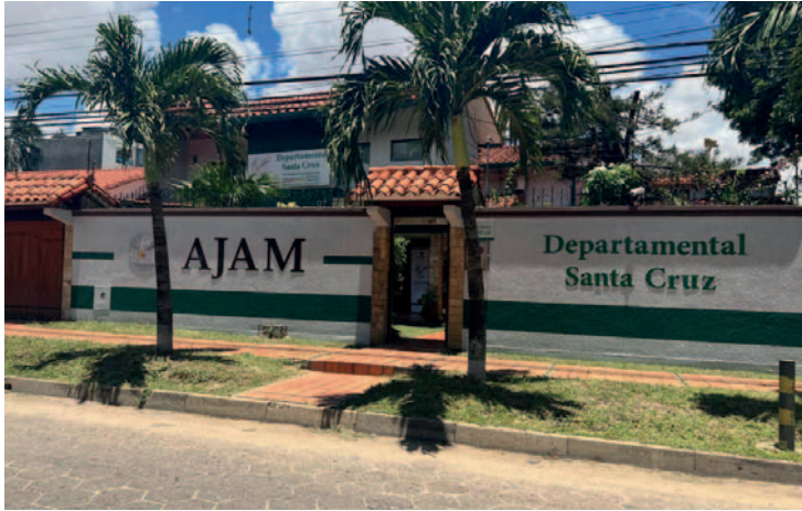
AJAM aclara que autorizaciones para prospección no dan vía libre a la explotación /AJAM

En respuesta a esto, la AJAM enfatizó que las licencias de Prospección y Explotación