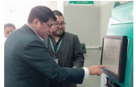
En el Paisé Candelaria, implementan equipo para la digitalización de fichas /CNS