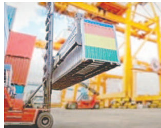
Exportaciones bolivianas caen y déficit aumenta en los primeros cinco meses de este año / REFERENCIAL

A todo esto, se suma la caída del 15% de las importaciones. En detalle, de enero a mayo de este año se registraron importaciones por $us 3.958 millones en comparación con el mismo periodo del 2023, que llegó a $us 4.676 millones: una