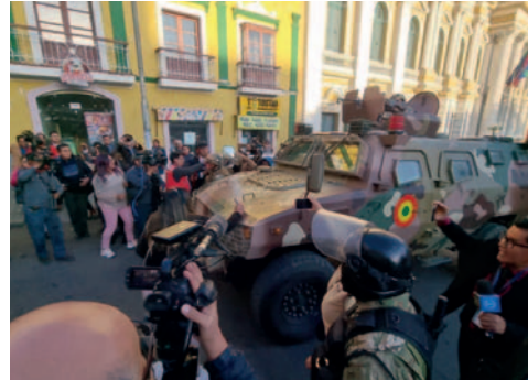
Distintos medios cubrieron el alzamiento militar el 26 de junio

riodistas recordaron que el trabajo de la prensa es público y se refleja en cientos de videos, despachos de radio, transmisiones en vivo y publicaciones de medios impresos y portales digitales.