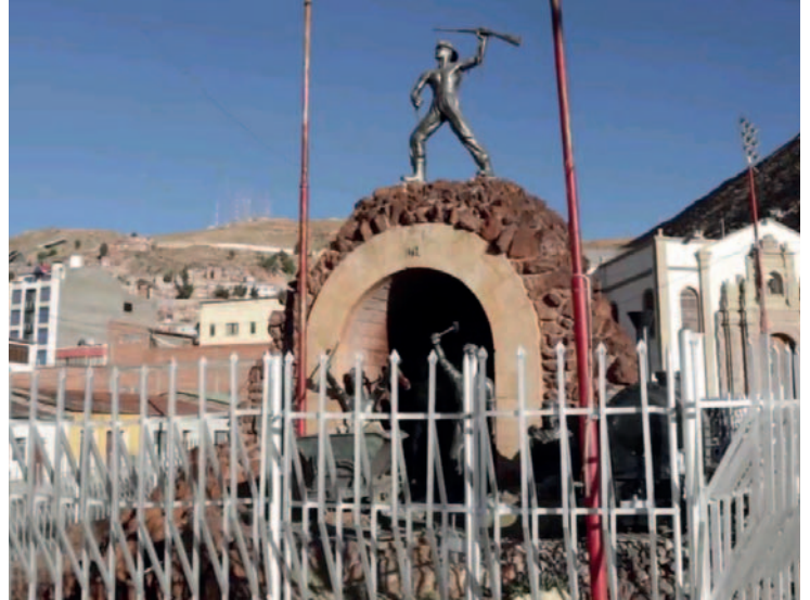
La ruta turística recorrerá seis centros mineros