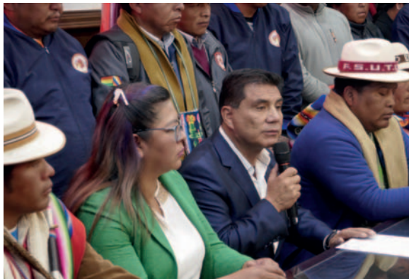
Instituciones piden audiencia con el Ministerio de Salud

Para la jornada de ayer, el Gobierno Nacional, a través del Ministerio de Salud, tenía programado realizar la entrega de ítems de médicos especialistas y subespecialistas de varios departamentos del país.