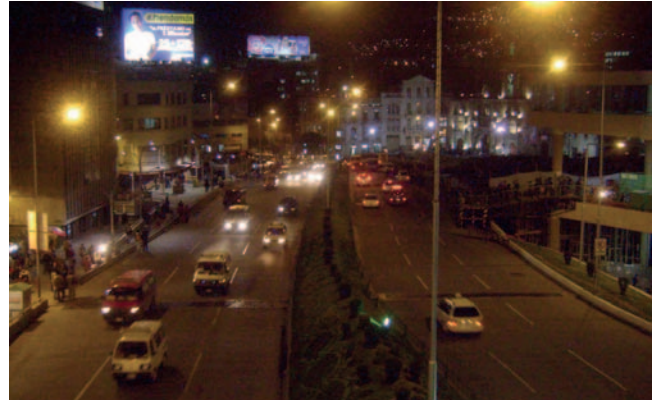
Oficial de policía acusado de dopar y agredir sexualmente a joven tras verbena

La joven fue encontrada en una cancha de la zona de Chuquiaguillo