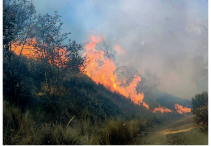
Investigan las causas de los incendios en el Parque Nacional Tunari