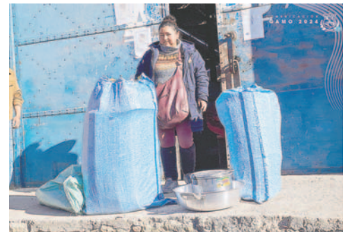
Comerciantes recuperaron su mercadería

“Se concluyó con la devolución de todos los bienes que fueron parte de los decomisos y las personas fueron notificadas de que por única vez se está procediendo a esta devolución, previo al pago de la multa correspondiente. La misma irá a parar a las arcas del municipio y seguramente será dispuesta para otros fines”, informó Canqui.