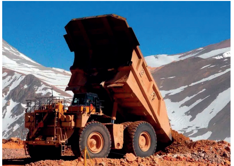
La minería fue clave en el crecimiento de exportaciones chilenas