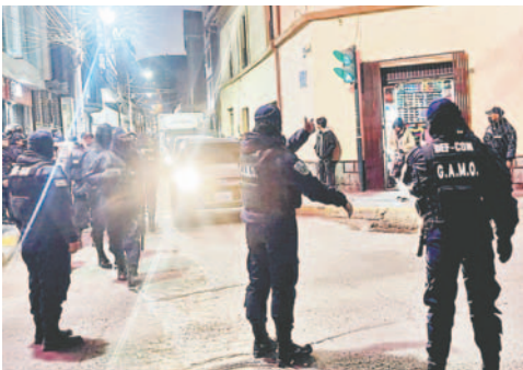
Operativo en calles céntricas decomisó productos que obstaculizaban la circulación vehicular y peatonal

“Bajo ningún criterio se pretende restringir el derecho al trabajo, pero debemos entender que la población tiene derecho a poder desplazarse y el derecho a transitar, algo que es obstruido por el excesivo comercio informal ambulante, principalmente en el centro de la ciudad”, finalizó.