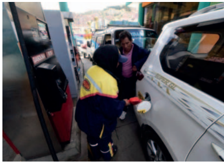
Largas filas de vehículos en busca de diésel se formaron en varios surtidores de la capital