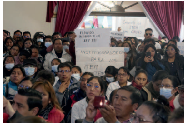
Acto de entrega de ítems en Oruro fue suspendido