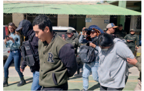
Tras el informe policial ambos aprehendidos fueron trasladados vía terrestre hasta Cochabamba