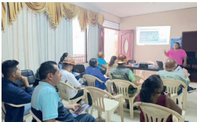
La capacitación sirvió para que cooperativistas conozcan sus obligaciones tributarias