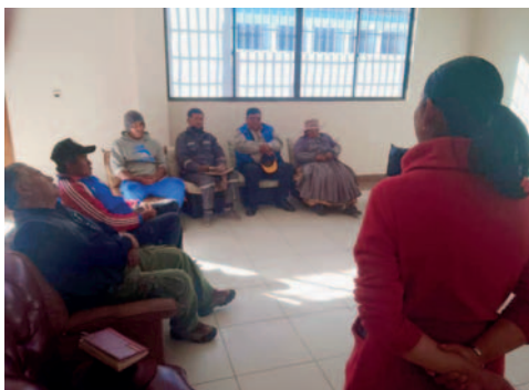
Trabajadores del Cementerio durante la capacitación