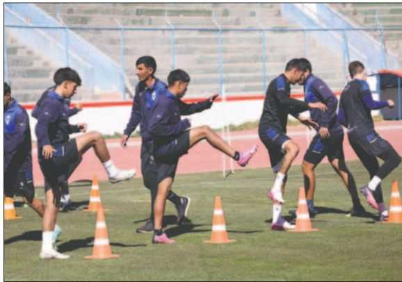
Los jugadores cumplieron una sesión exigente en el escenario deportivo