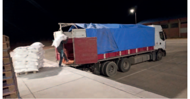
Productos nacionales ganan terreno, pero sigue preocupando situación económica del país afirman los fabriles

Según detalló el representante de los fabriles, el contrabando a Bolivia ingresa por todas las fronteras, pero aseguró que la disminución por el lado Sur con Argentina, dio una oportunidad a otros productos nacionales.