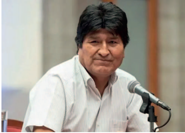
El expresidente de Bolivia, Evo Morales, pretende postularse a la presidencia en 2025

problema, eh? Sin primarias no hay democracia en el partido. Por eso son tan importantes. Me someto a primarias, si me gana voy a hacer campaña por él. Si yo gano, que haga campaña para mí”, afirmó el expresidente.