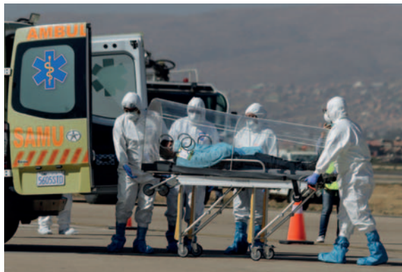
Simulacro sanitario en el aeropuerto Jorge Wilstermann

El simulacro de emergencia sanitaria fue coordinado con autoridades del Servicio Departamental de Salud, de la Gobernación de Cochabamba y de la Navegación Aérea y Aeropuertos Bolivianos (Naabol).