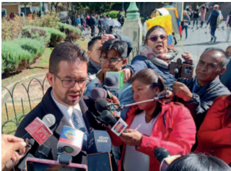
El embajador venezolano en Bolivia señala que Nicolás Maduro encabeza las preferencias electorales para el 28 de julio

encuestas dan a Maduro entre el 56% y el 57% del electorado, seguido por los otros nueve candidatos de oposición. Además, precisó que los diez aspirantes a la presidencia se enfrentarán en un