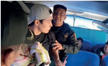
Agentes de la Policía de Oruro sorprendieron a la pareja que intentaba llegar hasta la ciudad de El Alto, para luego intentar salir del país