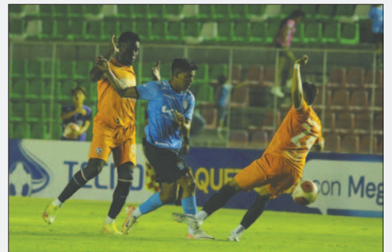
El cuadro orureño quiere luchar contra la adversidad y lograr el triunfo