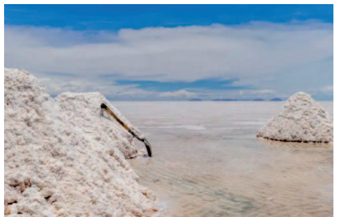
Argentina es el cuarto productor mundial de litio, tiene cuatro proyectos en producción

El potencial de producción en Argentina pasó de 37.500 toneladas de LCE en 2022 a 136.500 toneladas, consolidando al país como el cuarto productor mundial de litio. Con cuatro proyectos en producción, incluyendo Centenario Ratones, Argentina busca aumentar su presencia en el mercado