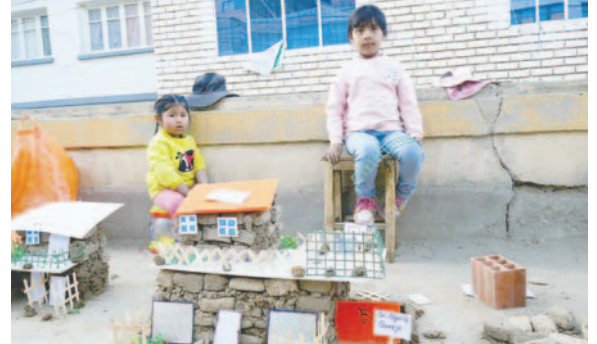
Niños construyen casitas de barro como parte de una tradición ancestral

"Tengo 10 años y he hecho esta casa solito, pero con un poco de ayuda de mi mamá, mi casita tenía dos dormitorios, sala baño, piscina, jardín y para los que creen en la Virgen del Carmen (una capilla), además cancha, garaje y parrillero. Estaba ofreciendo mi casita a 60.000, pero he rebajado a 50.000 porque ya era tarde y como es la casa que ha ganado el tercer lugar lo he