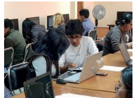
La iniciativa está dirigida a estudiantes universitarios bolivianos /UMSA