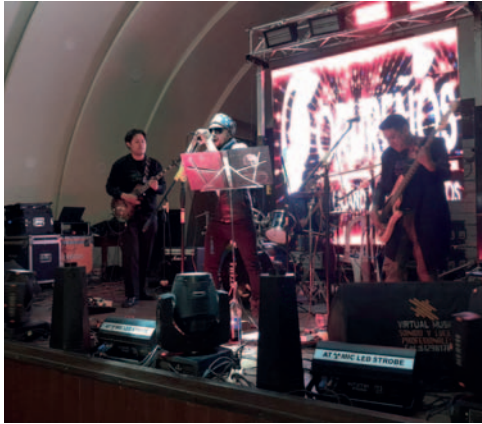
Presentación de grupos de rock en la primera fecha

Anoche, el espacio tuvo mucha afluencia de personas que gustan del género musical y disfruta-