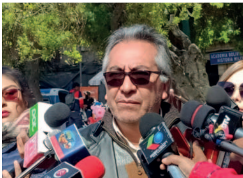
El viceministro de Coordinación Gubernamental, Gustavo Torrico

Según su criterio, lo que busca es un clon de