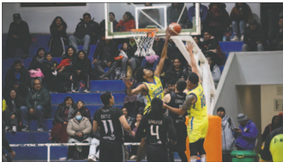
La "U" de Vinto y Real Santa Cruz saltarán a la cancha en pos de las unidades

Este encuentro marcará el regreso de Real Santa Cruz a la competencia en este segundo se-