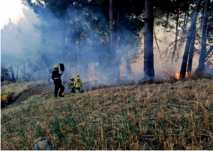
Bomberos tratan de contener las llamas en el Tunari