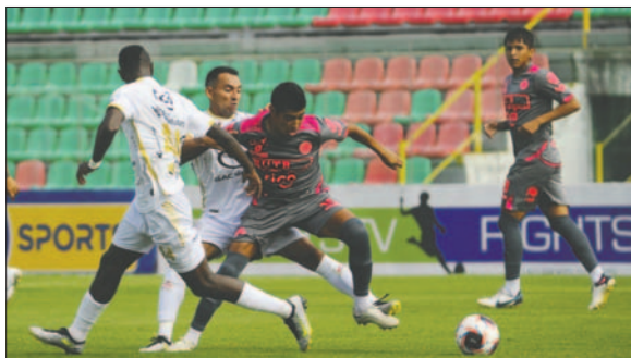
Los dos elencos cruceños necesitan sumar para no quedar rezagados