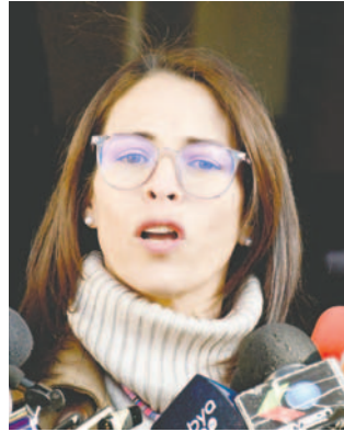
La viceministra descartó que se trate de un acuerdo entre el vocal Campero y el Gobierno

La vicepresidencia indicó que el trabajo de un administrativo en la OEA es ad honorem y no es incompatible con la función pública. Además, el puesto tiene como función principal resolver problemas laborales de los miembros de la OEA. Si existe una denuncia entre los miembros de la organización, acudirán