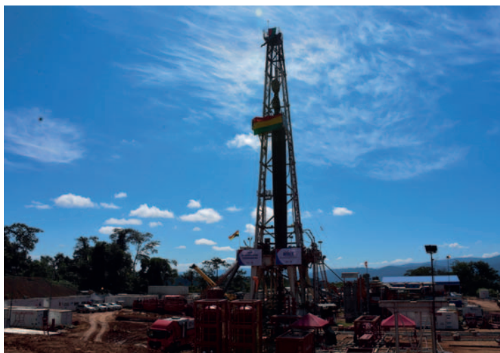
YPFB invertirá aproximadamente 400 millones de dólares