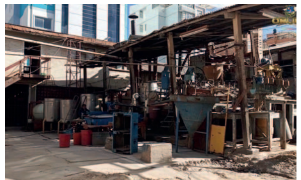
Instalaciones de Sergeomin /CMO

Se tiene previsto que autoridades del CMO se reúnan con el director nacional de Sergeomin para discutir detalladamente el posible proceso de transferencia de los terrenos y las implicaciones legales y administrativas.