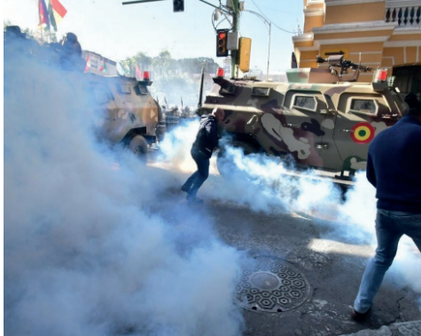
El alzamiento militar se registró el pasado 26 de junio en Plaza Murillo

Del Castillo indicó que posiblemente otras autoridades sean citadas a declarar por el Ministerio Público la próxima semana, en calidad de testigos de los