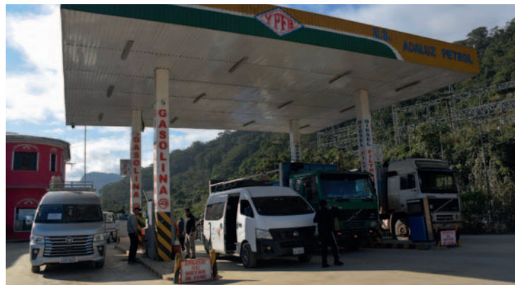
El pozo Mayaya Centro-X1 podría ser una solución ante los problemas de diésel que vive el país