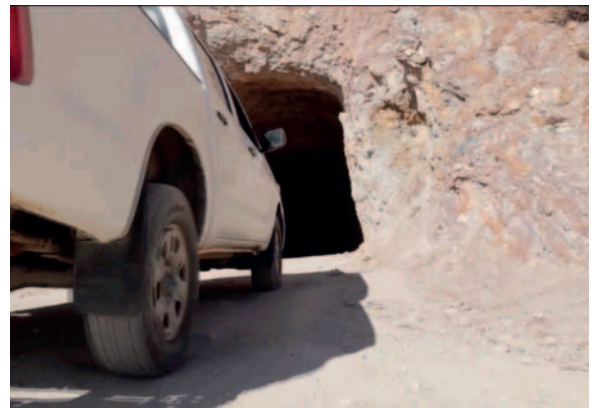
Ingreso al túnel La Colorada

La Gobernación anunció que la actividad es gratuita y se contará con un vehículo para trasladarse a los distintos centros mineros.