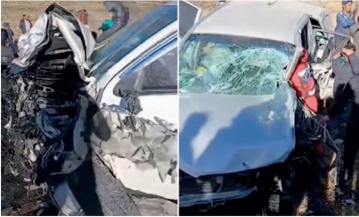
De esta manera terminó el vehículo que conducía el juez y otro afectado