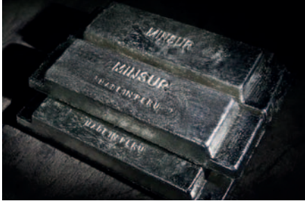
Barras de estaño de Minsur