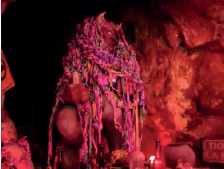
Durante la ruta, los visitantes podrán observar al tío de la mina /GADOR