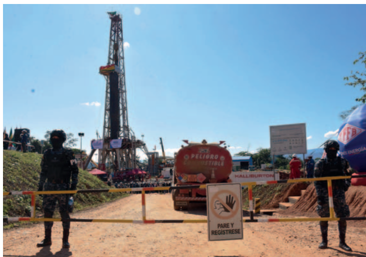
El "megacampo" Mayaya está ubicado en el Norte de La Paz