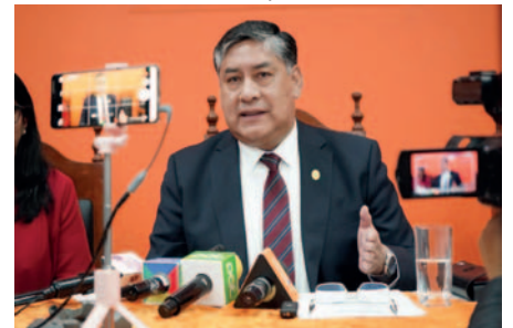
El Fiscal General del Estado, Juan Lanchipa, anunció que llamarán a declarar al Presidente Arce