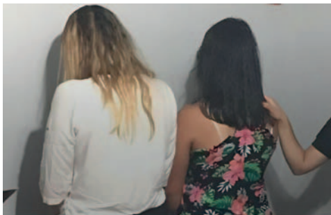
Dos jóvenes proxenetas fueron arrestadas por su participación en la captación de adolescentes con fines de prostitución /CAPTURA

Según la policía esta actividad ilícita se desarrollaba a través de redes sociales desde un internet público