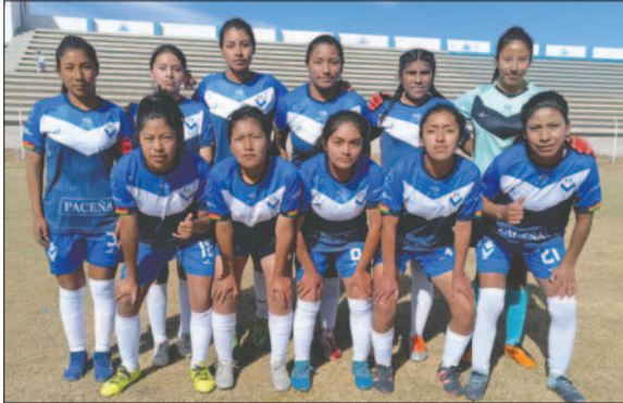
GV San José quiere mostrar una nueva fisonomía en esta etapa del torneo