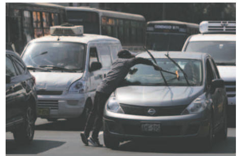
Una persona trabaja limpiando vidrios en una calle de Lima (Perú)

Moreira agregó que se "busca transformar la dura realidad de la informalidad a través de un marco integrado de políticas, que incluyan intervenciones innovadoras" que tengan entre sus componentes un enfoque de igualdad de género.