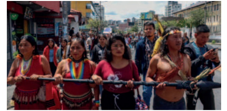
Un grupo de indígenas amazónicos de Ecuador participa en una manifestación ante el Tribunal Constitucional