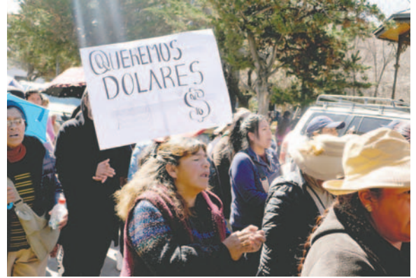
Comerciantes preocupados ante la escasez del dólar

En ese sentido, la Súper Feria convocó a otras organizaciones a unirse a la lucha y solicitar una explicación al Gobierno Central acerca de la escasez de dólares, sin descartar la posibilidad de tomar medidas de presión de manera escalonada.