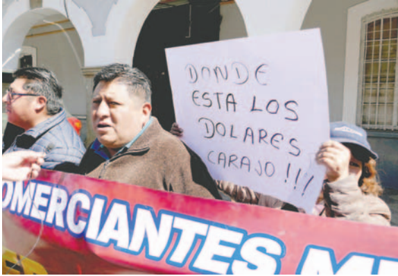
Comerciantes de la Súper Feria protagonizaron marcha de protesta

“La economía del sector gremial, así como la de los importadores, está cayendo gradualmente y es preocupante. Por eso, pedimos una explicación clara sobre cómo podemos obtener dólares y qué podemos hacer para obtener