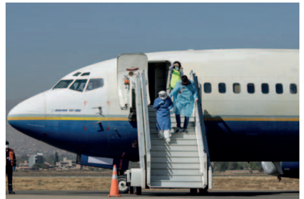
Los aeropuertos internacionales son puntos críticos debido a la entrada y salida de viajeros, que tiene el riesgo de exponerse a enfermedades

puntos críticos debido a la entrada y salida de población viajera, que tiene el riesgo de exponerse a enfermedades infecciosas provenientes del exterior, según detalla ABI.