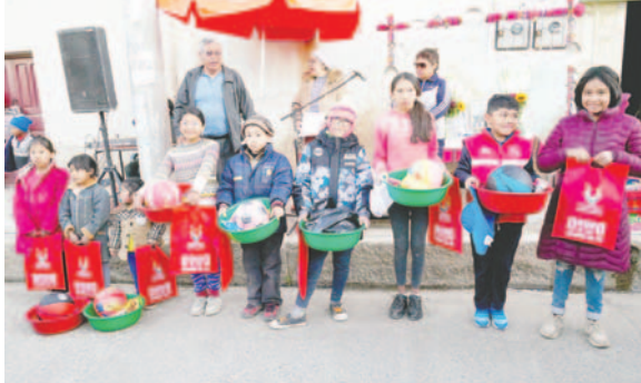
Ganadores del Concurso Casitas de Barro 2024