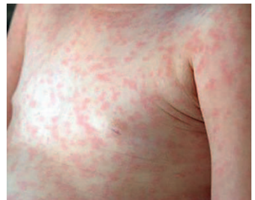
Oruro reportó 8 casos sospechosos de sarampión

Hasta la fecha, las brigadas de vacunación han sido desplegadas en todos los establecimientos