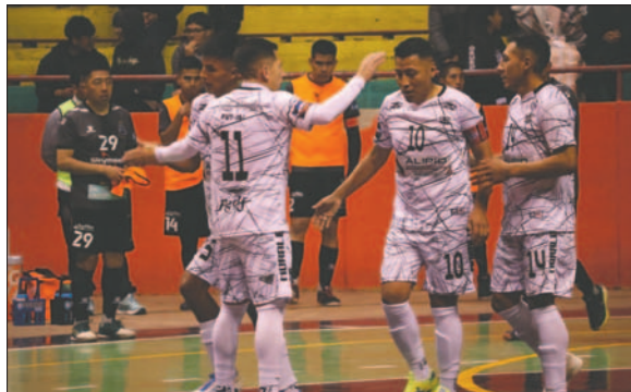
El cuadro orureño va en procura de sus primeros tres puntos

Se espera un buen espectáculo deportivo en el cierre de la segunda fecha de la Liga Nacional de Fútbol, grupo "B".