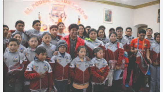
La delegación orureña en pos de cumplir una buena campaña