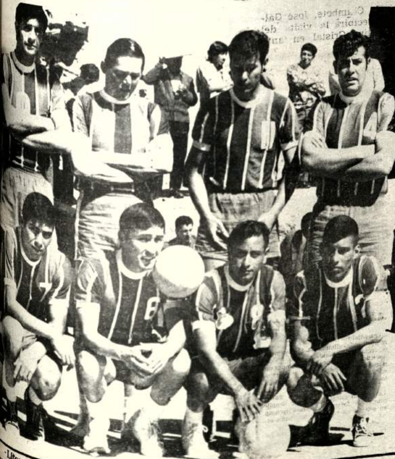
Litoral, conjunto aspirante a liderar la tabla de posiciones del campeonato de volibol, enfrentará hoy a Simón Bolívar en el encuentro más importante de la jornada.

LOS ANGELES, 16 (ANSA).— El mexicano Erubey Carmona conquistó el título mundial de pesos ligeros de boxeo, batiendo al estadounidense Mando Ramos por suspensión del combate en el octavo round. El match estaba previsto a 15 rounds. La victoria del mexicano causó impresión, porque Ramos, el cual al término de la pelea acusaba mareos, fue conducido al hospital donde quedó internado en observación.