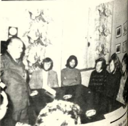
Las fotos muestran varias escenas del acto combinatorio en el club Andino Boliviano. Fue cuando los miembros de la comisión inglesa recibieron los certificados que acreditan su permanencia en el país. En la foto de arriba, el grupo visitante...