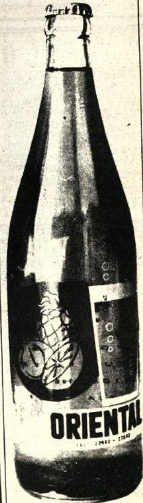
PEDIDOS COLOMBIA 520