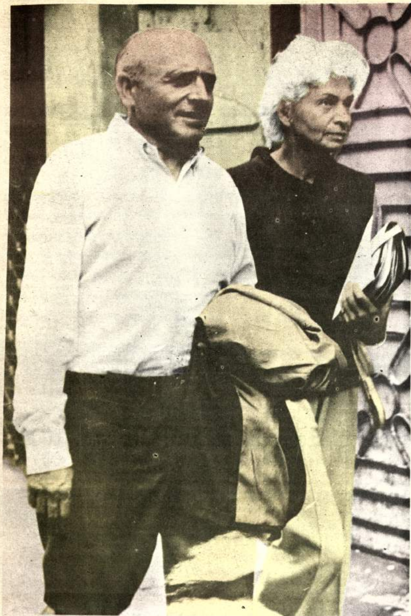
• • • - Habrá gente que se "encargue" de él (según dijo Hardy). Es Klaus Altmann o Barbie que, además del problema que enfrenta al ser perseguido por cazadores de nazis y sosteniendo otro asunto con la justicia boliviana por suplantación de personalidad, agravó otra situación granjeándose la enemistad de René Hardy.