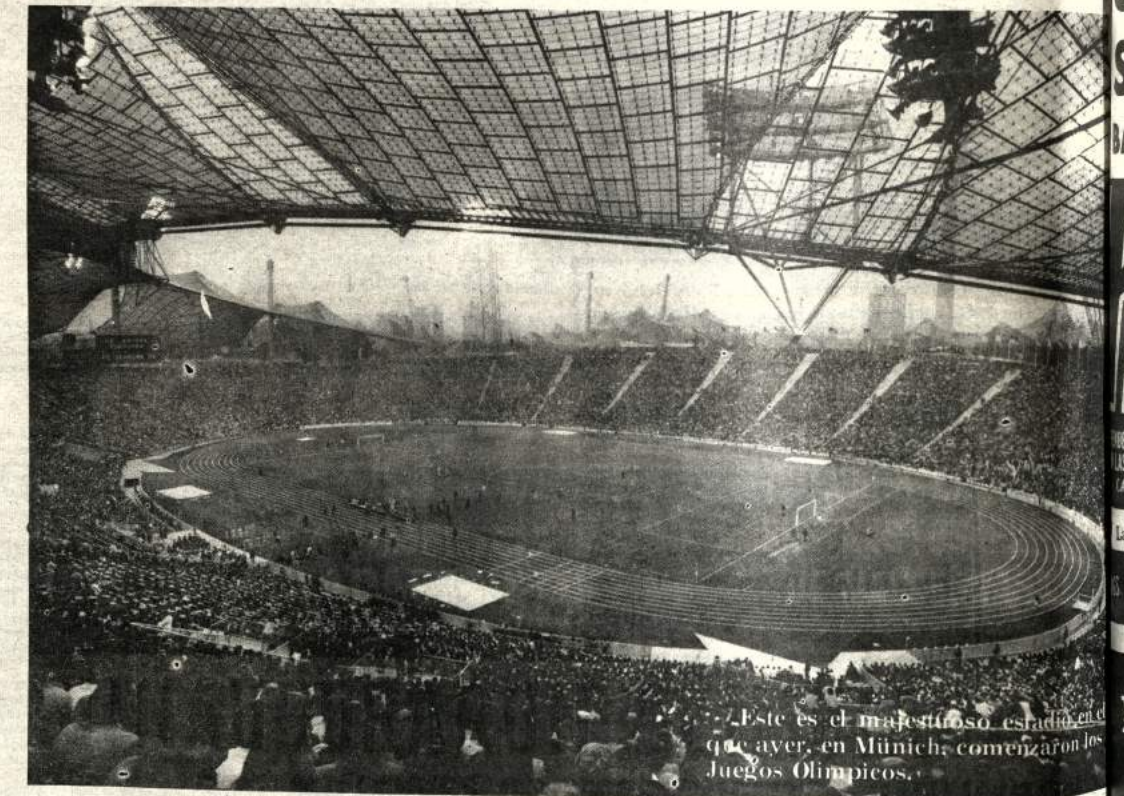
Este es el majestuoso estadio en el que ayer, en Múnich, comenzaron los Juegos Olímpicos.

Primero sería necesario terminar con las guerras y dejar libres a los presos políticos de todo el mundo de Oriente y Occidente. Primero sería necesario