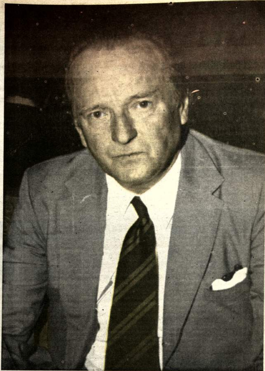
René Hardy, el ex jefe de sabotajes de la Resistencia francesa durante la ocupación nazi, dice que esperará a Altmann para efectuar el careo, mediante el cual pretende aclarar ciertos aspectos relativos a su actuación durante la Segunda Guerra Mundial, ya que fue sindicado de traidor.

Ayer, luego de la conferencia de prensa realizada en el octavo piso del hotel Crillon, el escritor René Hardy y los franceses que lo acompañan se reunieron en el bar de la planta baja donde brindando con whisky el tema de conversación era el caso Altmann. Esperaré a que se decida a sostener la entrevista, dijo. Se estima que permanezca en La Paz hasta el lunes. Su espera, la inició en ese bar fumando un habano, en el ambiente de oscuridad que brinda ese recinto.