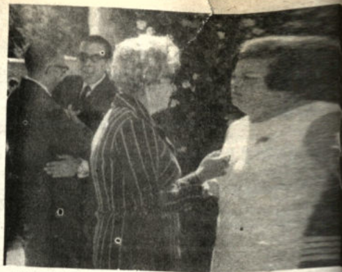
El Embajador del Perú y la señora ofrecieron una recepción con motivo de la ta nacional del Perú. En la foto el Embajador posa con algunos de sus invitados.

Que se oficiará en la Catedral Metropolitana de La Paz, el día de hoy a horas 10 y 30.