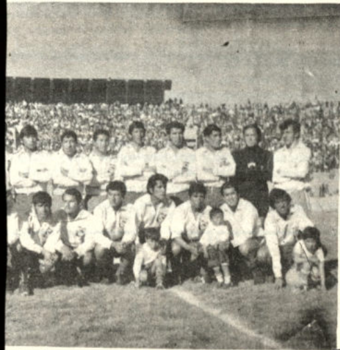
es el equipo de San José, actual líder del onato oficial de fútbol de la ciudad de Oru- guro representante de ese distrito en la co- nial "Simón Bolívar" que se efectuará po- nte la segunda quincena de octubre.

Existen players que para el campeonato local han respondi- do, pero en el Nacional con segu- ridad que tendrán dificultades.