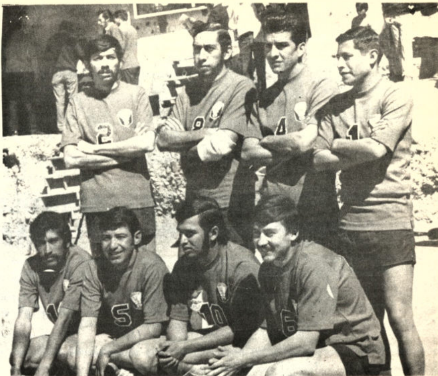
-Promoción 50, equipo volibolista que viajará mañana a la ciudad de Arica-Chile, para realizar una temporada internacional enfrentando a equipos de ese distrito portuario chileno.

En los encuentros preliminares de la categoría femenina, Saetas dio cuenta de Lealtad por dos canchales a cero, con marcadores de 15-9 y 15-11. Por su parte, el sexteto de Chaco Petrolero, sometió a Simón Bolívar por 2-1 (scores de 15-8, 15-17 y 15-10).