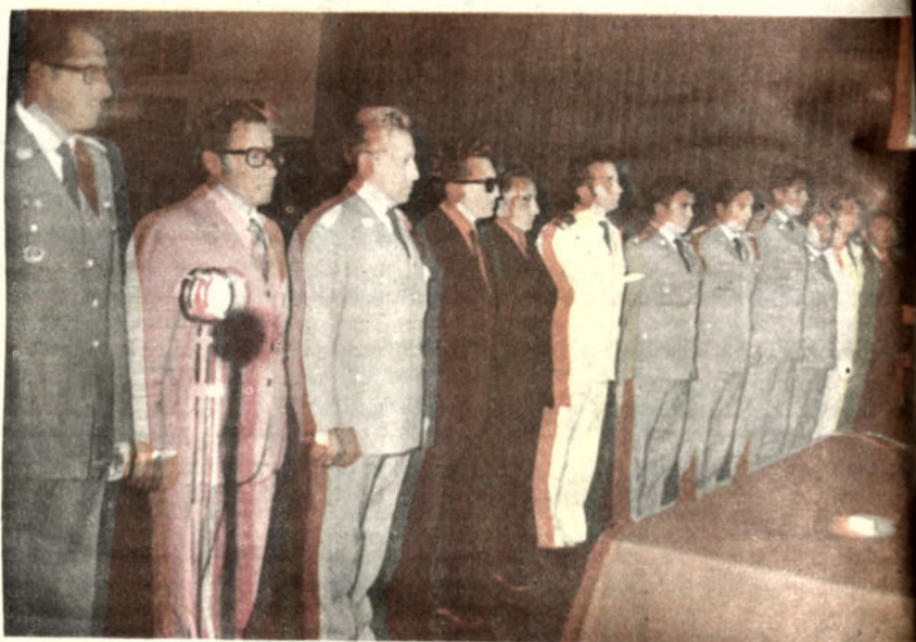
Estos son los nuevos dirigentes que ahora tienen a su cargo la conducción del club Mariscal Santa Cruz. El grupo de conductores en el momento en que presta el juramento.

La jornada, en ambos escenarios, se iniciará a las 19 horas.