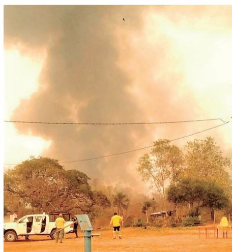
El fuego rodea a la comunidad San Lorenzo Nuevo, en Roboré

cesarios para realizar sus tareas de manera efectiva.