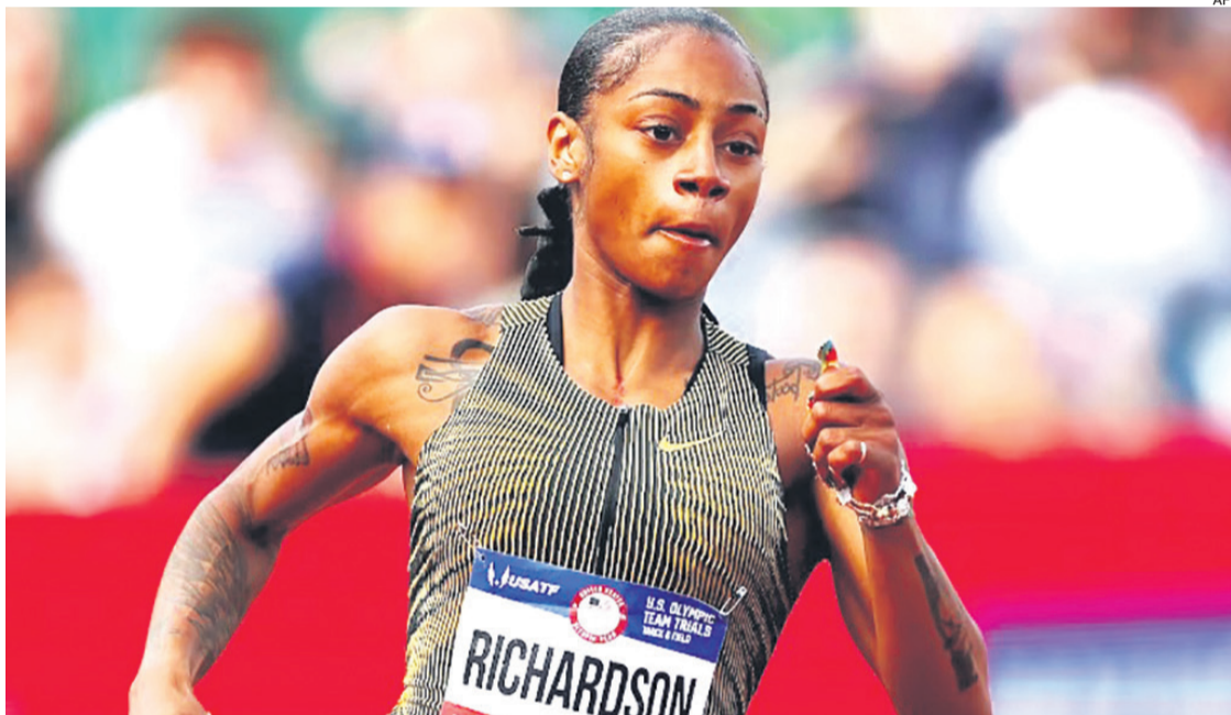
Sha'Carri Richardson va por su 'resurrección'. Llega a París 2024 en gran momento

Estas credenciales, sumadas a las dudas que envuelven a otras aspirantes, le brindan el estatus de favorita para ser la primera estadounidense en coronarse en la prueba, desde Gail Devers en 1996. Para llegar a este punto, Richardson tuvo que sobreponerse a varias desgracias que retrasa-