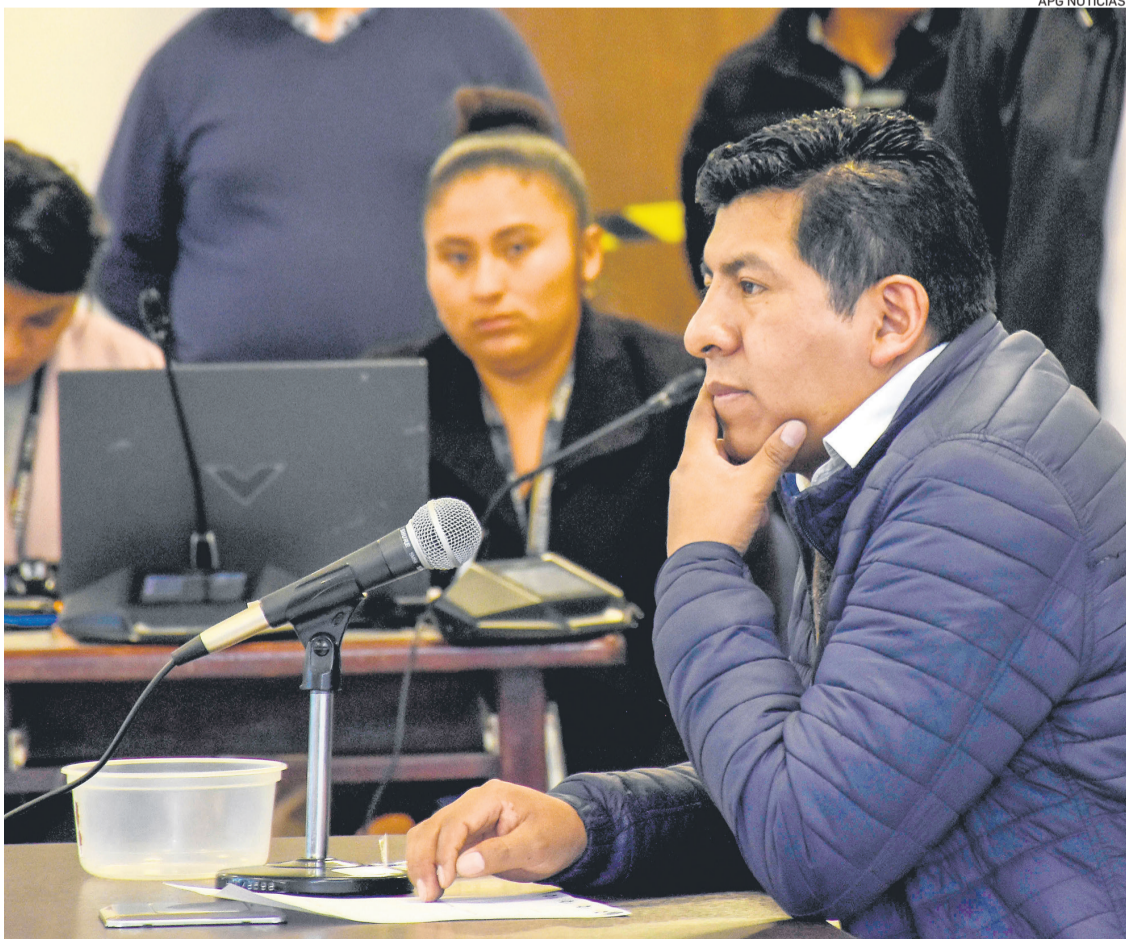
El vocal Tahuichi durante la prueba oral a la que se presentó el fin de semana en la Asamblea Legislativa.