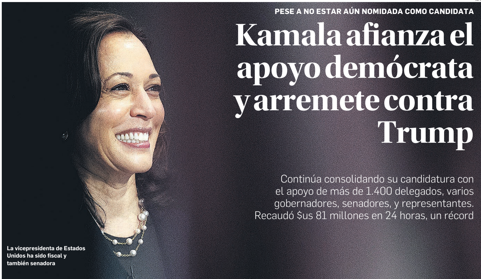
La vicepresidenta de Estados Unidos ha sido fiscal y también senadora

PESE A NO ESTAR AÚN NOMINADA COMO CANDIDATA