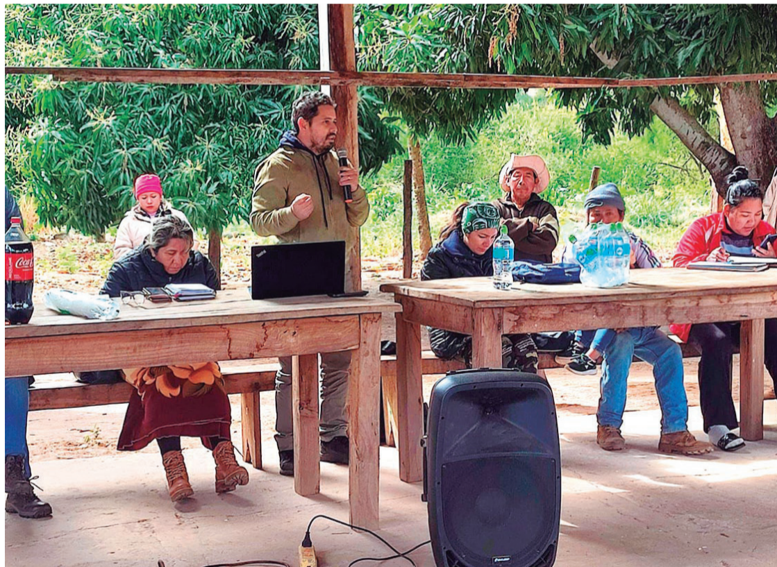
Comunarios y pobladores de la zona trataron el tema en una reunión realizada en Yororobá

el impacto ambiental. Rechazamos cualquier actividad minera que se puede generar, lo que puede implicar la destrucción de nuestros bosques y fauna, y sobre todo la contaminación de nuestras aguas”, indicó Velasco.