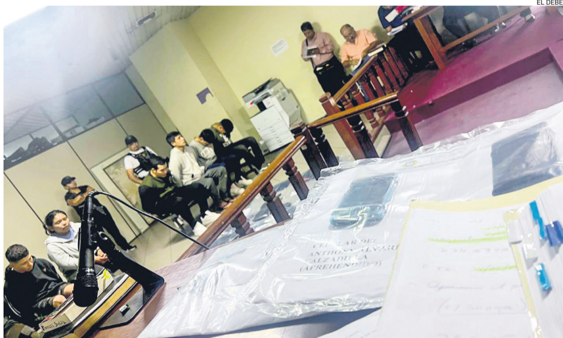
La maratónica audiencia en el Palacio de Justicia con los responsables del asesinato al taxista

En sus declaraciones, todos los imputados aseguran que estaban acostumbrados a hacer la jugada