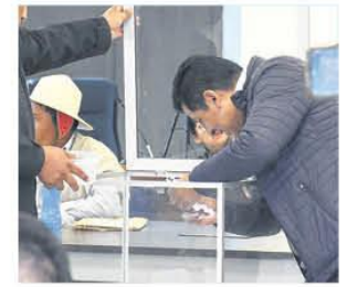
Los postulantes dan examen

gresos llega a 500 millones de bolivianos. Resurgió la necesidad de un nuevo pacto fiscal y alianzas público privadas. A2-3