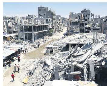
Bombardeos en el sur de Gaza

El mandatario israelí consideró, al dejar Israel, que se trata de un "viaje muy importante", en un momento de "gran incertidumbre política" por la decisión del presidente demócrata Joe Biden de no