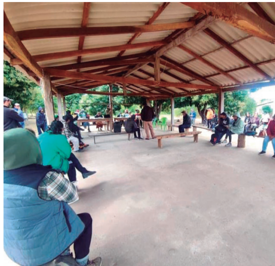
Hay preocupación por los riesgos ambientales