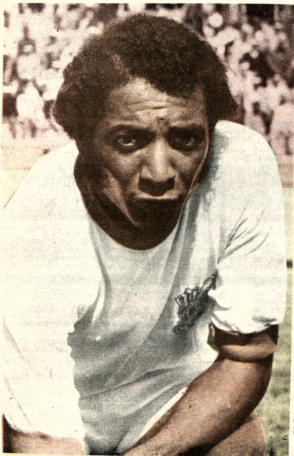
Este es el jugador de "La Bélgica", por el que surgió un nuevo conflicto en el fútbol. Ahora se discute su verdadera personalidad. Es Le Chingá o Fonseca, realmente...?