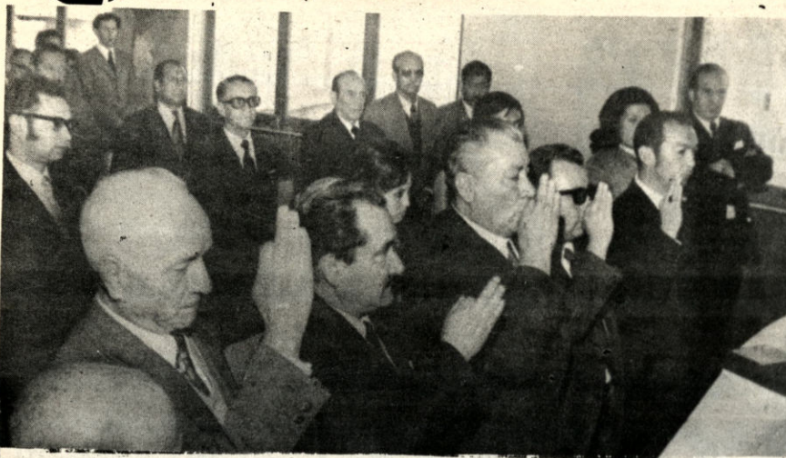
Los conjuces de la Corte Nacional de Minería, prestan juramento de rigor durante el acto de posesión, realizado ayer al iniciarse el Año Judicial Minero.