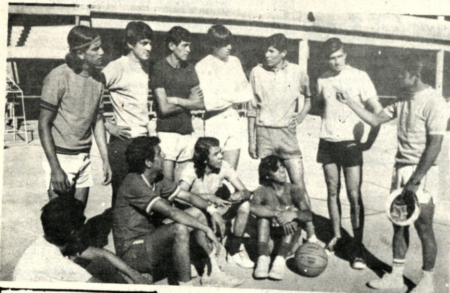
El combinado nacional juvenil de baloncesto, que intervendrá en los Cuartos Torneos Bolivarianos de básquetbol a realizarse en Táchira, en un momento de su adiestramiento que se lleva a cabo en la cancha principal del Coliseo "Ciudad de La Paz".

El año pasado los mismos premios lo habían logrado el pluricampeón mundial de motociclismo, Giacomo Agostini, en el sector nacional y Shane Gould, la nadadora australiana, en el sector mundial.