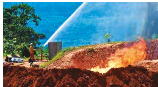
Combustión en el pozo de Mayaya, ayer.

Proyección. El Gobierno calcula que harán falta unos dos o tres años para posibilitar una explotación comercial del pozo