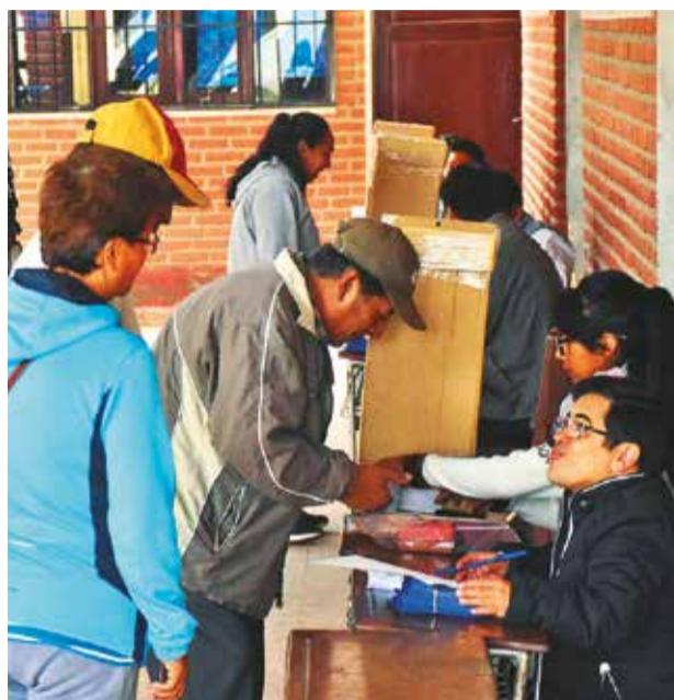
Votantes durante las primarias de 2019.