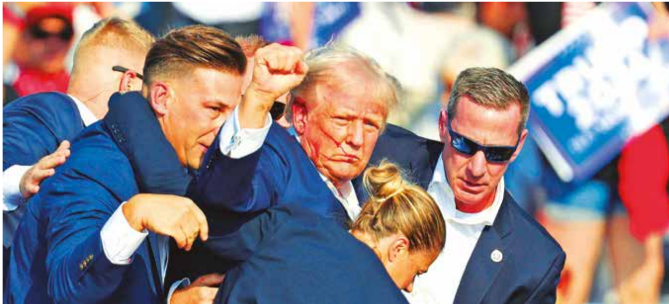
El expresidente estadounidense Donald Trump es sacado del escenario por el Servicio Secreto, tras resultar herido en la oreja derecha por un atentado contra su vida.

Alerta. Teherán amenazó en repetidas ocasiones con venganza por el asesinato de Qasem Soleimani, comandante del Cuerpo de la Guardia Revolucionaria Islámica, por parte de EEUU en enero de 2020