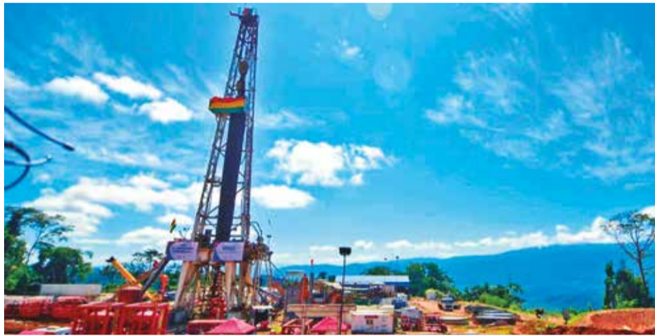
El pozo que permitió descubrir el yacimiento de hidrocarburos en La Paz.

La Constitución establece que los hidrocarburos “son de propiedad (...) del pueblo boliviano, y corresponderá al Estado su administración (...)”, pero está permitido que empresas privadas participen en el circuito productivo bajo reglas de fiscalización para que paguen tributos y regalías.