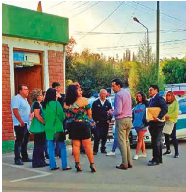
Los padres de los estudiantes del San Agustín, ayer.

“Cuando hicimos averiguaciones, nos enteramos de que la señora Morales no compró los servicios en Cancún. Eso indica que hubo un engaño. En las siguientes horas, vamos a formalizar una