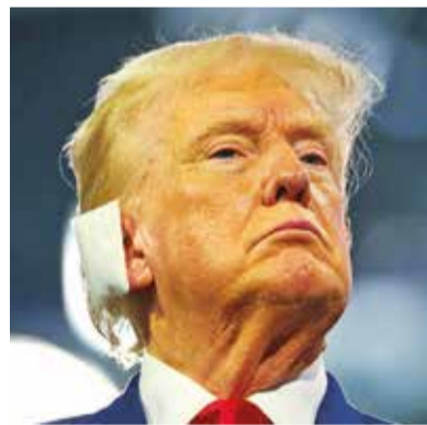
Trump en la Convención Nacional Republicana (RNC).