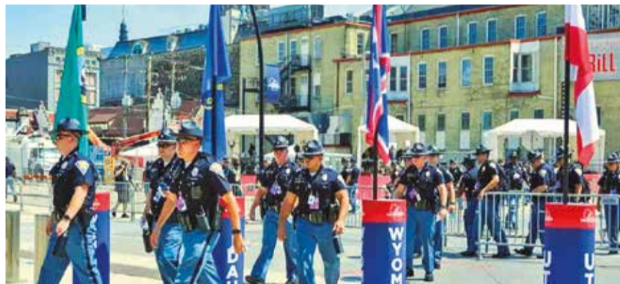
Agentes de la Policía en Milwaukee, Wisconsin.