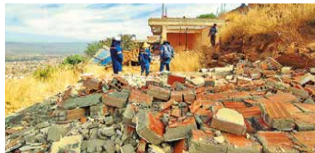
Los trabajos de intervención de la UGR, ayer.

En los últimos años, la cantidad de viviendas asenta-