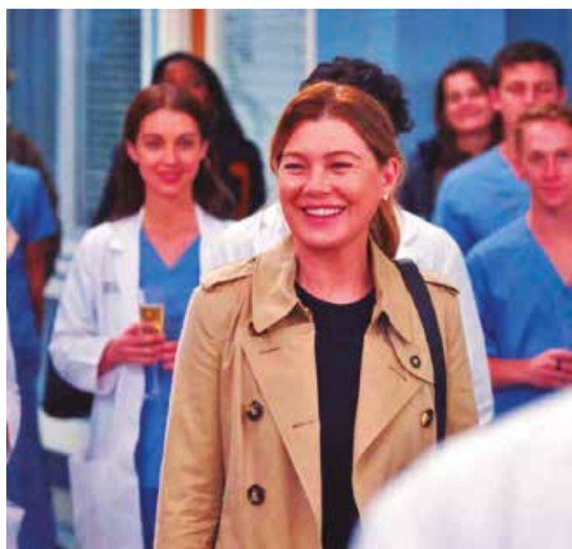
Pompeo ya no es protagonista en esta nueva entrega. ESPINOF

Pompeo continuará su vínculo con la serie más allá de la pantalla, manteniéndose como narradora y productora ejecutiva. Además, aparecerá