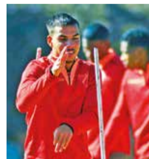
Entrenamiento de Always Ready. ALWAYS READY

“Creo que, si vas con el objetivo de empatar pierdes, uno tiene que apostar a lo mejor, y por eso lo mejor