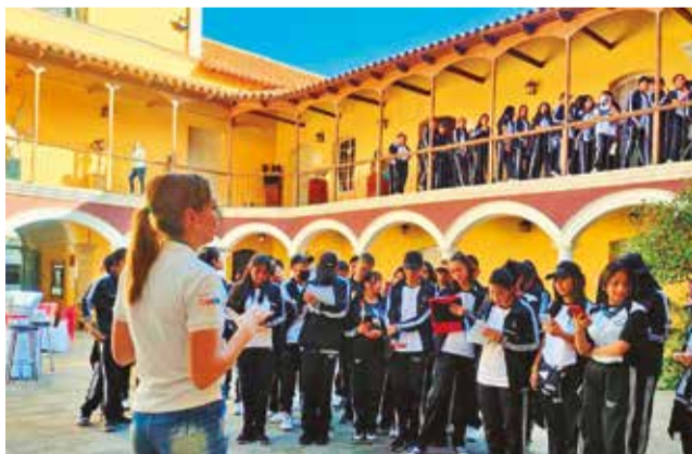
Visita guiada a la casona Santiviáñez, la semana pasada. GAMC

Asimismo, la población participó de los tours panorámicos, histórico-culturales y