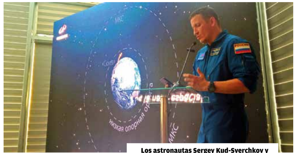
Los astronautas Sergey Kud-Sverchkov y Anastasia Stepanova.

La visita de los astronautas rusos a Bolivia es una inicia-