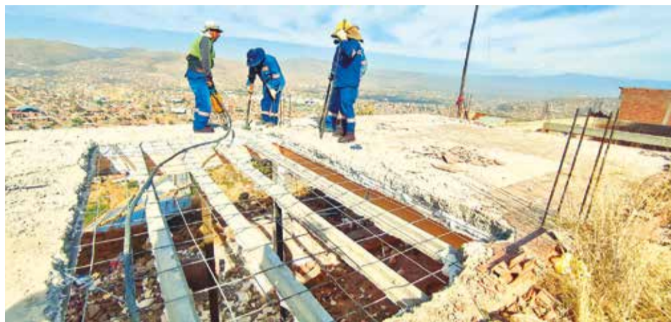
La demolición de una vivienda ubicada en un área verde, en la OTB Alto San José. DANIEL JAMES

En una revisión de la zona en Google Maps se identificó que, en 2007, había menos de 50 viviendas en las faldas de la serranía. En 2015 ya había varios caminos en la parte alta y en 2023 se ve más de un centenar de edificaciones no sólo