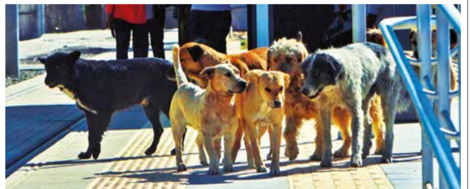
Algunos canes en situación de calle, en la ciudad de Cochabamba. DANIEL JAMES

terio de la obra continúa. Aunque se realizaron algunas reparaciones, existen grietas en las paredes y en el suelo, según verificaron autoridades municipales y departamentales. Además, el edificio presenta hundimientos en el sector sur y filtraciones de agua.