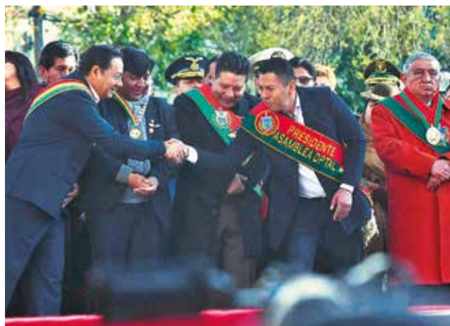
El presidente Arce y autoridades de La Paz, ayer.

En tanto, mediante sus redes sociales, el jefe de Estado mencionó que el aniversario de La Paz invita a recordar con gratitud a los héroes y heroínas que