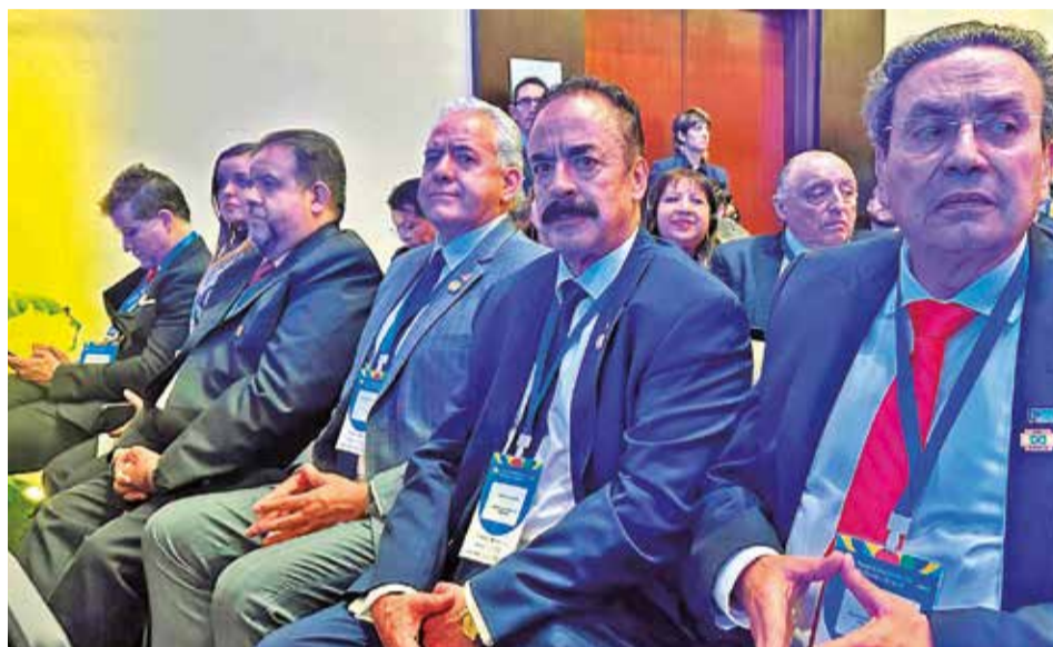
Empresarios cochabambinos en el Foro Empresarial Bolivia-Brasil, en Santa Cruz. LT

Para ese líder empresarial, es importante considerar los acuerdos con Brasil en la perspectiva de la integración regional. En ese sentido, “hemos planteado a las autoridades bolivianas generar una rueda de negocios del Mercosur para ver los requerimientos de los empresarios de otros países, qué podemos ofrecerles y qué pueden ofrecernos ellos.