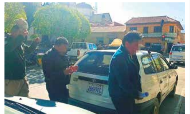
Los aprehendidos al ingresar a su audiencia.

en contra de su defendida y lo que se hará es devolver el dinero pagado por las actividades que no se realizaron. “Ya nos hemos reunido con todos”, enfatizó.