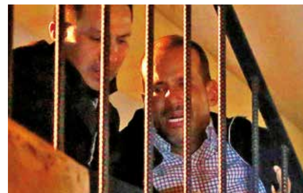
El gobernador de Santa Cruz, Luis Fernando Camacho.

La prioridad debe ser allanar el escenario y las condiciones para la realización de elecciones judiciales en este segundo semestre de 2024.