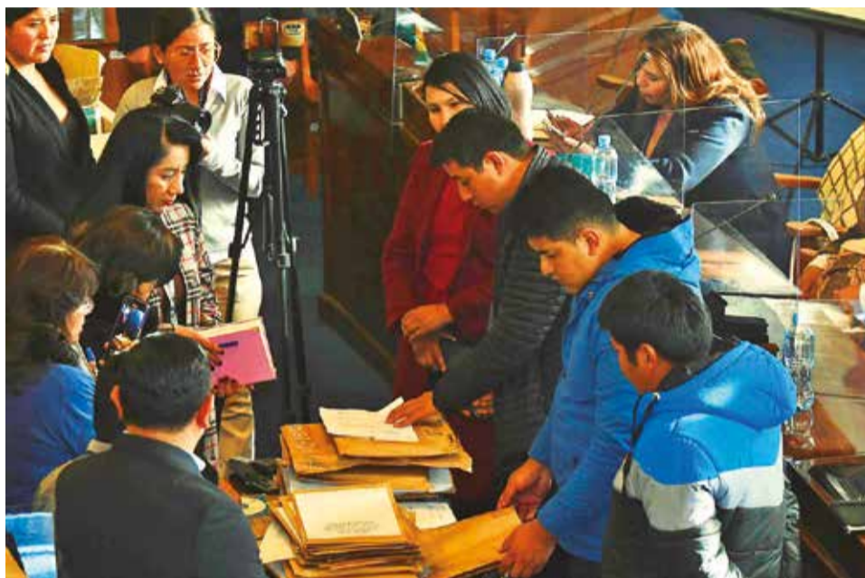
La Comisión de Constitución revisa los documentos de los postulantes a judiciales.