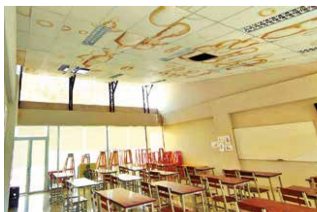
Los ambientes del Instituto de Artes Plásticas, ayer. D.J.

Tapia solicitó informes escritos sobre el estado de la infraestructura para garantizar la seguridad de los estudiantes y los docentes. Actualmente, sólo se imparten clases teóri-