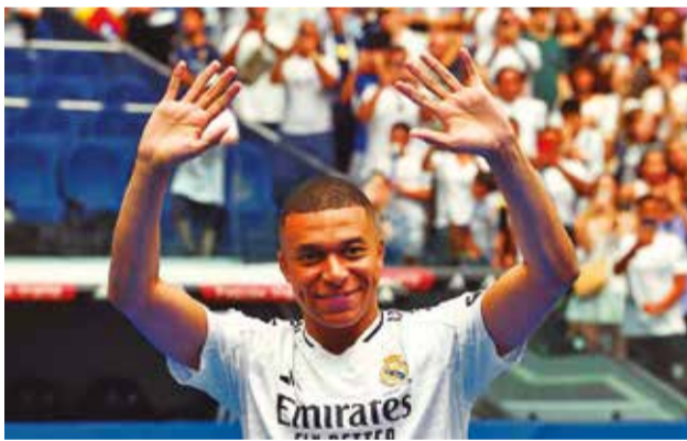
Los aficionados de Real Madrid le dan la bienvenida.

“Vengo con humildad porque tengo al mejor club del mundo. Y con ambición. Son los valores del club. Y ganar. La prioridad es adaptarme bien en el colectivo y cuando pase las cosas serán más fáciles”, dijo y resaltó la importancia de Florentino Pérez en su llegada al Real Madrid.