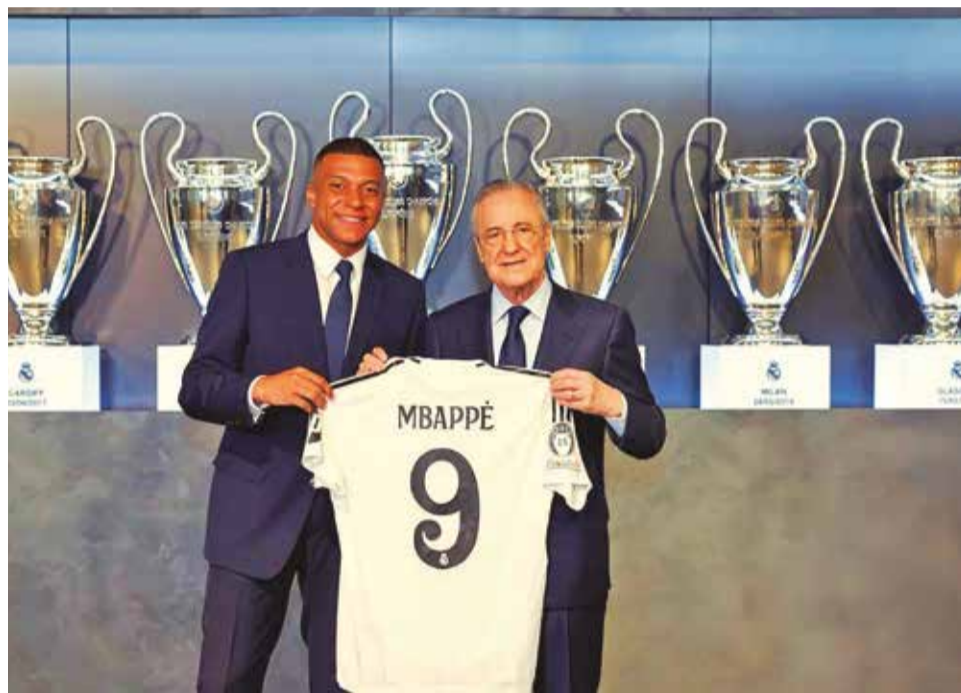
El delantero francés Kylian Mbappé es presentado por el Real Madrid.

“El amor que me han mostrado los aficionados es increíble. Me siento adoptado por todos los madridistas. Tengo