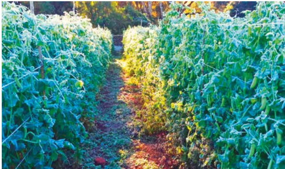
Efectos de las heladas en la provincia O'Connor de Tarija. RTABIGAIL

Las hortalizas y la papa son los cultivos más afectados por el fenómeno climático.