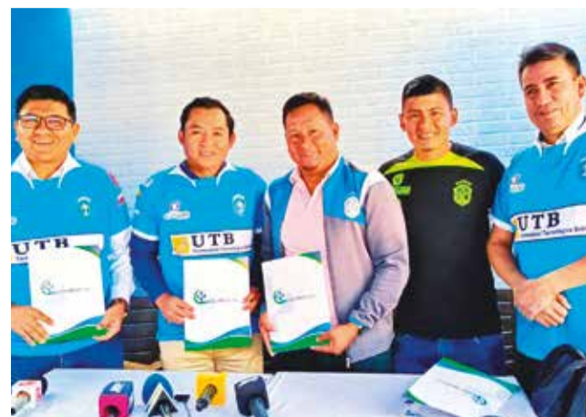
Firma del convenio con la clínica Los Lirios.

Alianza con Los Lirios El club San Antonio ayer firmó un convenio con la clínica Los Lirios, para el beneficio no sólo de los jugadores, sino