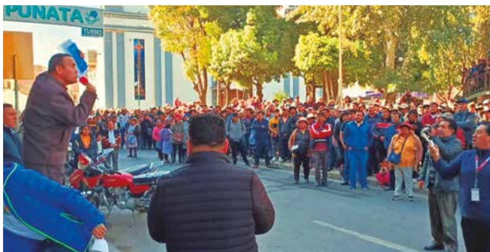
El cabildo que se llevó a cabo el lunes, en el municipio de Punata.

El pasado lunes, en un cabildo, pobladores y dirigentes