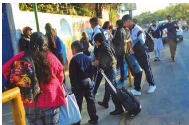
Estudiantes abrigados ante las bajas temperaturas.