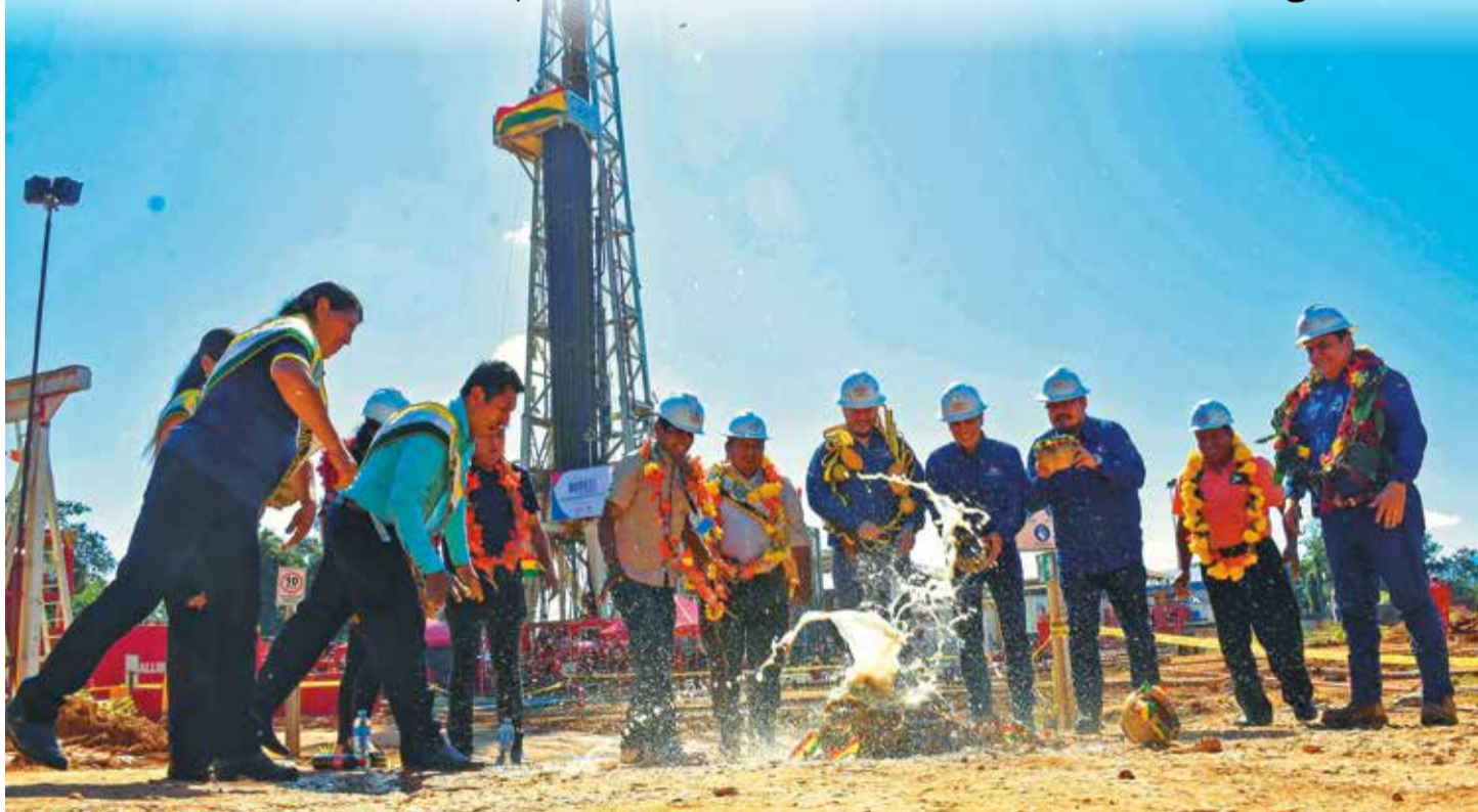
La tradicional ch'alla, realizada ayer junto al pozo de Mayaya Central X1, donde se certificó el hallazgo de un gran reservorio.

Proyecciones. El Ministro de Hidrocarburos calcula que se necesitarán 1.500 millones de dólares de inversión inicial, pero la rentabilidad sería de 6 mil millones. Pág. 6