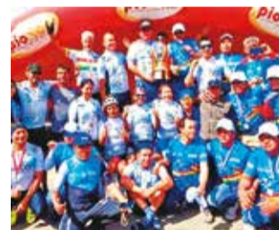
Los campeones nacionales de ciclismo. CICLISMO INFORMA

ra la delegación paceña con 12 preseas (5 oro, 1 plata y 6 bronce). Santa Cruz completó el podio con 13 medallas (4 oro, 5 plata y 4 bronce).