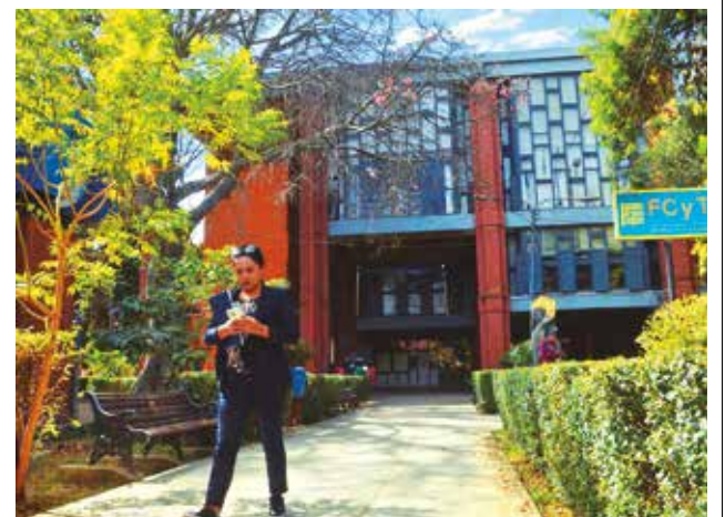
Los ambientes de la Facultad de Ciencias y Tecnología.