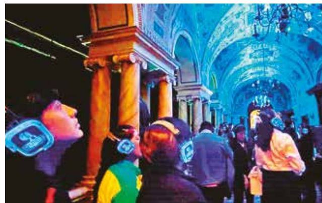
Palacio. La mansión Patiño se llena de colores.

Los esfuerzos detrás de la organización de “El Palacio Suena” incluyen a muchos expertos. El diseño sonoro, parte crucial de la experien-