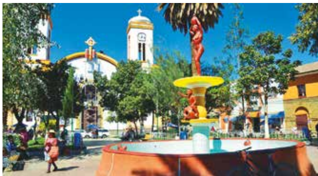
Plaza 18 de Mayo, lugar donde se hará el cabildo. LOS TIEMPOS

Demanda. La concentración busca que se esclarezcan las denuncias de presuntos cobros irregulares en la Alcaldía y el Concejo.