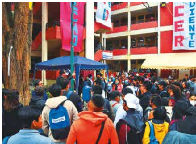
El edificio de la Facultad de Derecho y Ciencias Políticas.