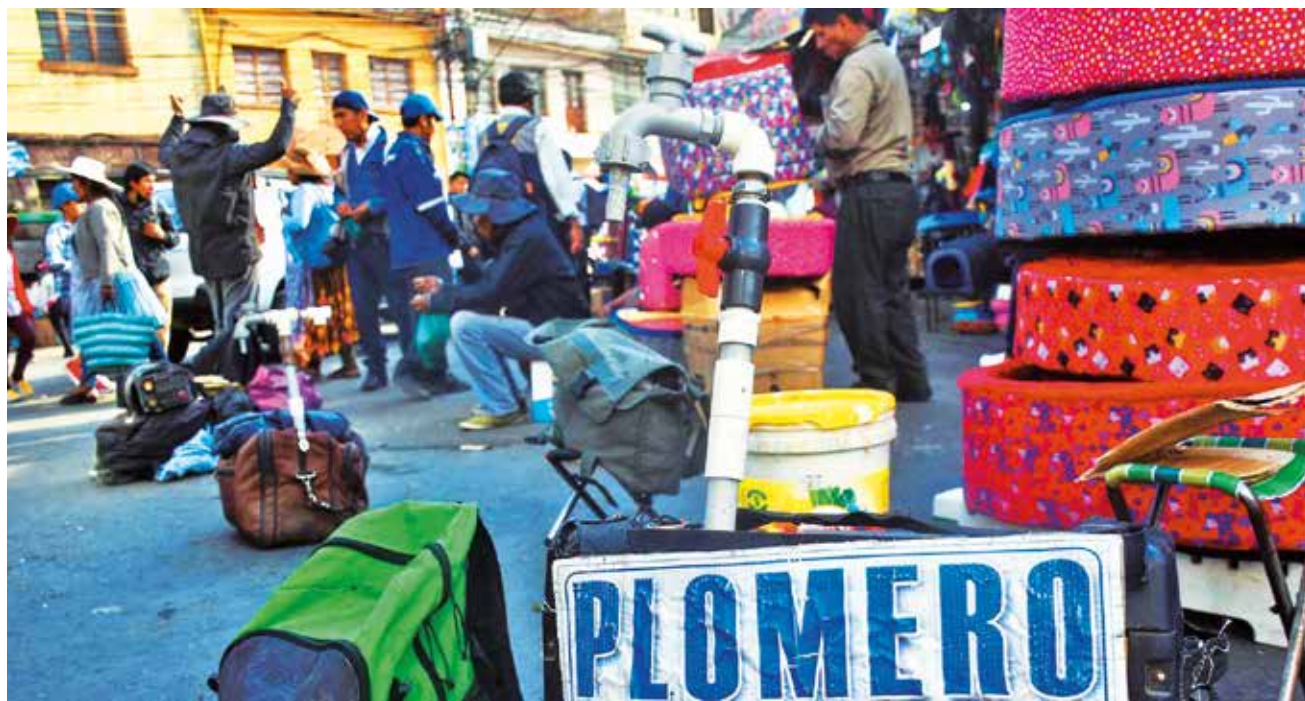
Trabajadores ofrecen sus servicios en la calle. El sector informal absorbe la mayor parte de desempleados. JOSÉ ROCHA

La falta de dólares comenzó a hacerse notoria a principios de 2023, cuando largas filas de personas se formaron