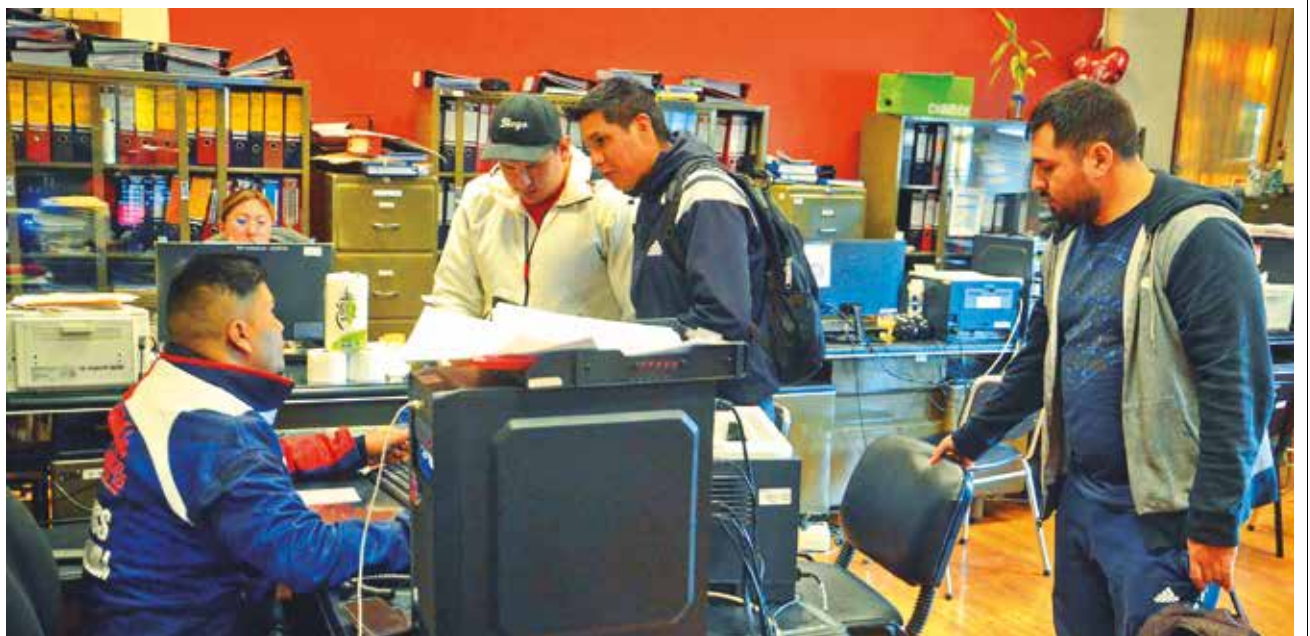
Las oficinas del Programa de Titulación Alternativa y Graduación (PTAG), de la UMSS.