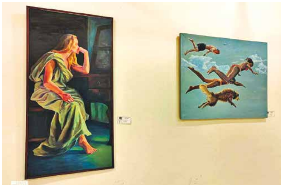
Pintura. Obras de arte expuestas en el salón Mario Unzueta. CASA DE LA CULTURA COCHABAMBA

Lugar: Teatro Adela Zamudio Un concierto repleto de melodías originales que fusionan los sonidos típicos de