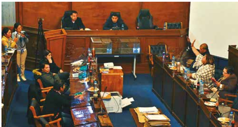
Diputados en la preselección de candidatos.

Los opositores de Creemos, Comunidad Ciudadana y el Movimiento Al Socialismo (MAS) evista acusan al Gobierno central de obstaculizar y trabar el avance de la preselección, a través del Constitucional, que ha venido suspendiendo el proceso hace más de un año.