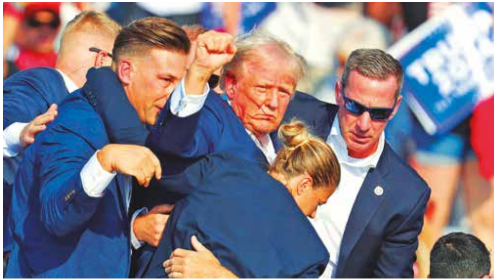
Donald Trump recibe ayuda tras tiroteo, el sábado.

Corey Comperatore, un exjefe de bomberos de 50 años, cubrió a su familia para protegerla cuando sonaron los disparos. Comperatore fue asesinado en el mitin de campaña de Donald Trump, en el que se produjo el atentado contra el expresidente estadounidense. La víctima era un exjefe de bomberos de 50 años y padre de dos hijas. De acuerdo con Josh Shapiro, gobernador de Pensilvania, "murió como un héroe" y se ordenó que las banderas de Estados Unidos ondeen a media asta en el estado.