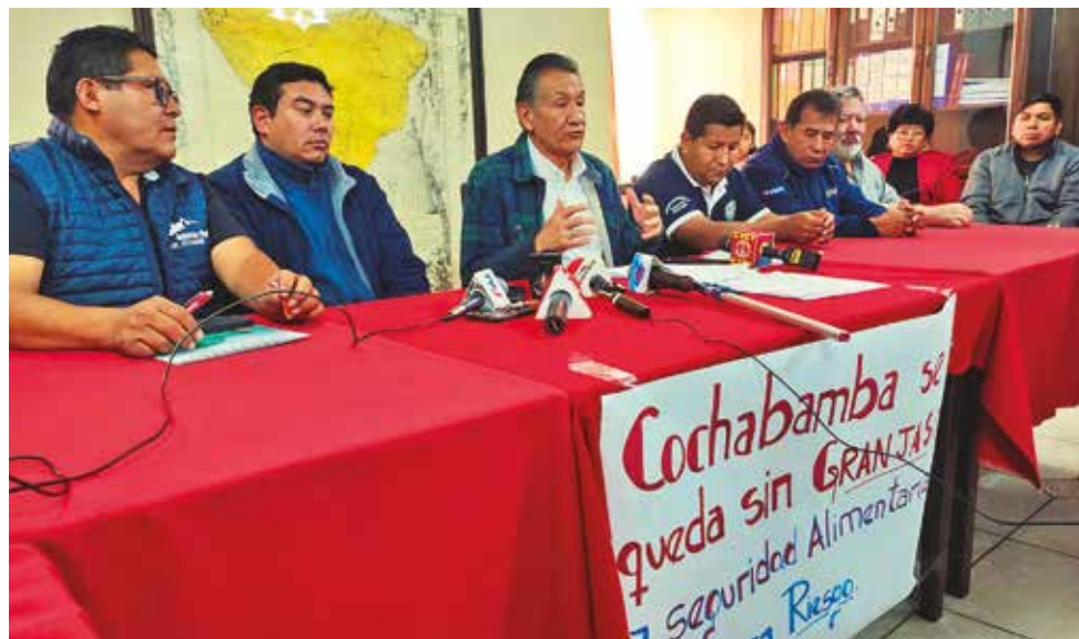
La Cámara Agropecuaria se pronuncia contra los avasallamientos. DANIEL JAMES

Asimismo, recalcó que urge trabajar en una norma que permita proteger a las unidades productivas que están saneando sus tierras.