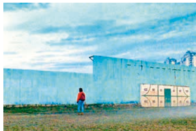
North Pole. Cortometraje ganador de 2023. MOSTRA CINEMA BRACCIANO.

Las obras finalistas se proyectarán en septiembre y los ganadores recibirán premios en efectivo y reconocimiento por parte del festival. Además, la oficina de prensa de la exhibición promoverá los trabajos seleccionados en medios de prensa y en redes sociales, brindando una cobertura y difusión completa de los ganadores.