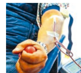
Donación en el punto móvil. HERNÁN ANDÍA