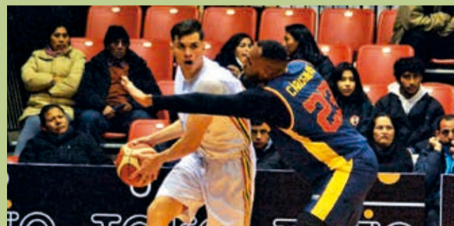
Encuentro Bolivia vs. Ecuador, anoche en Tarija.

Preclasificatorio. El Equipo de Todos sufrió sobre el final, pero superó a la Tri para definir todo el domingo en Ecuador