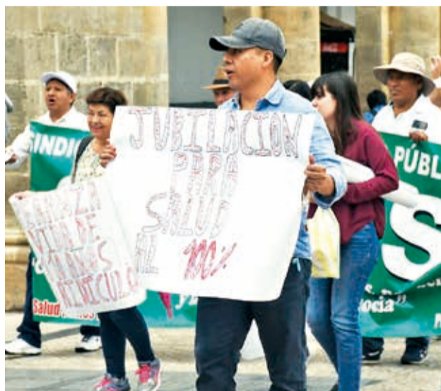
Marcha de médicos en contra de la jubilación forzosa.