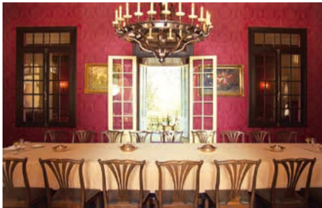
Hacienda. La arquitectura única, los salones lujosos y los jardines son los atractivos de la Villa. CASA MUSEO VILLA ALBINA

el costo de la alimentación. La organización no ofrece ningún tipo de transporte.