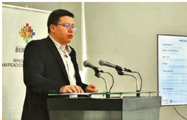
El ministro Sergio Cusicanqui, ayer ante la prensa.

Pedido. El ministro Cusicanqui señaló que hay créditos por $us 960 millones pendientes de ser aprobados en el Congreso