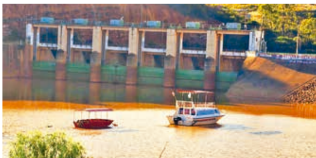
La represa de La Angostura, en el valle alto. DANIEL JAMES

Avances. Los regantes piden celeridad para el proyecto de reutilización de aguas de la planta de tratamiento de Albarrancho