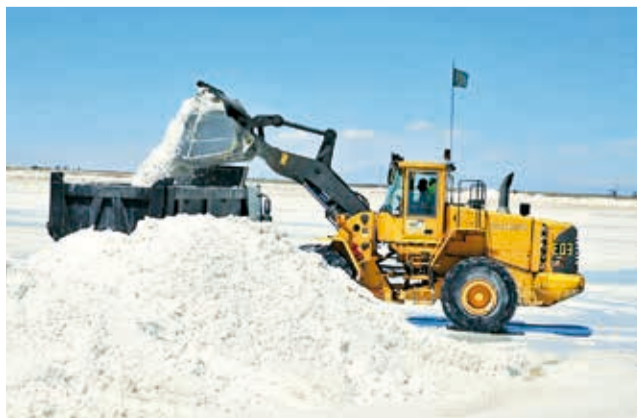
Bolivia podría vender sal del salar de Uyuni a Brasil. VLB

“Se buscó un memorándum de entendimiento para conversar acerca del litio, pero más importante es otro tipo de recursos evaporíticos que tenemos en nuestros salares, como el cloruro de potasio, fertilizante altamente demandado