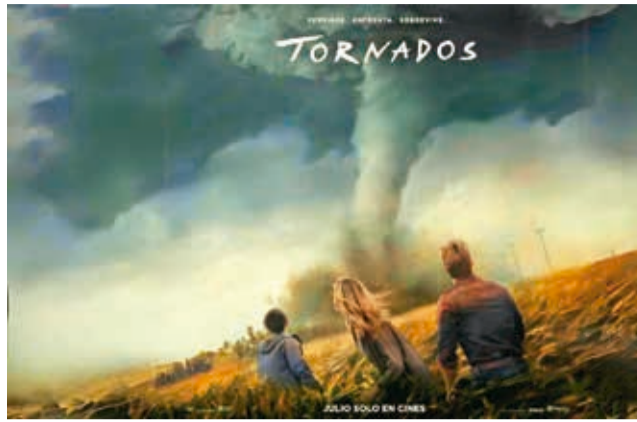
Catástrofe. La fuerza de los tornados es el epicentro de esta película. INTERNET

La historia sigue a Kate, una excavadora de tormentas que, tras un trágico evento en su juventud, se retiró a un trabajo de oficina. Su vida da un giro cuando un viejo amigo la convence de probar un innovador sistema de rastreo de tornados, lo que la lleva a reencontrarse con Tyler Owens, un famoso cazador de tornados.