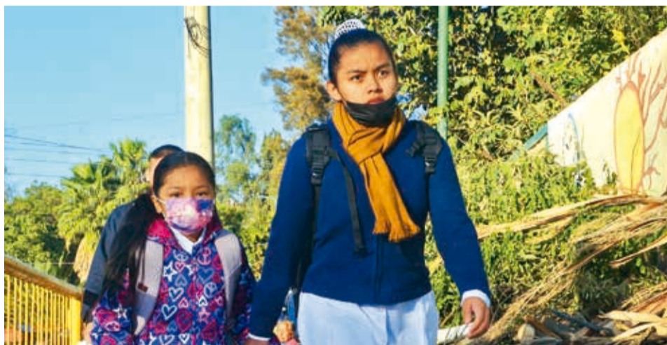
Los estudiantes antes de ingresar al descanso pedagógico en la ciudad.