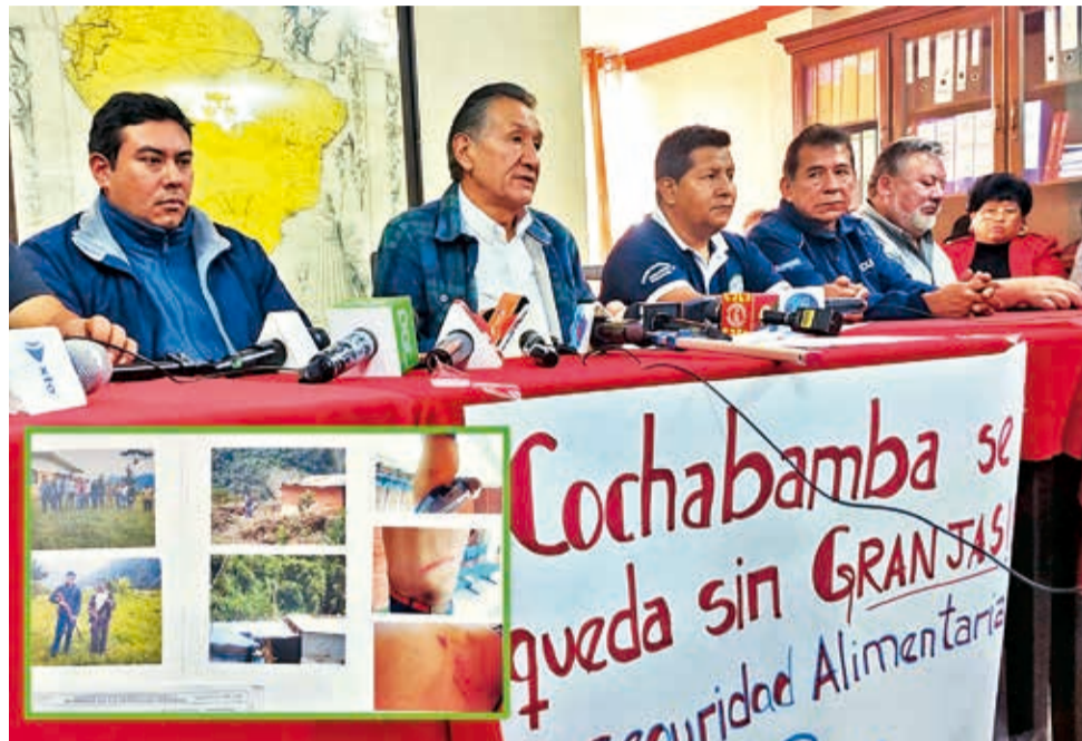
La conferencia de prensa realizada ayer, en la Cámara Agropecuaria. DANIEL JAMES

Asimismo, hace unos días, un grupo de personas ingresó a la fuerza a una granja porci-