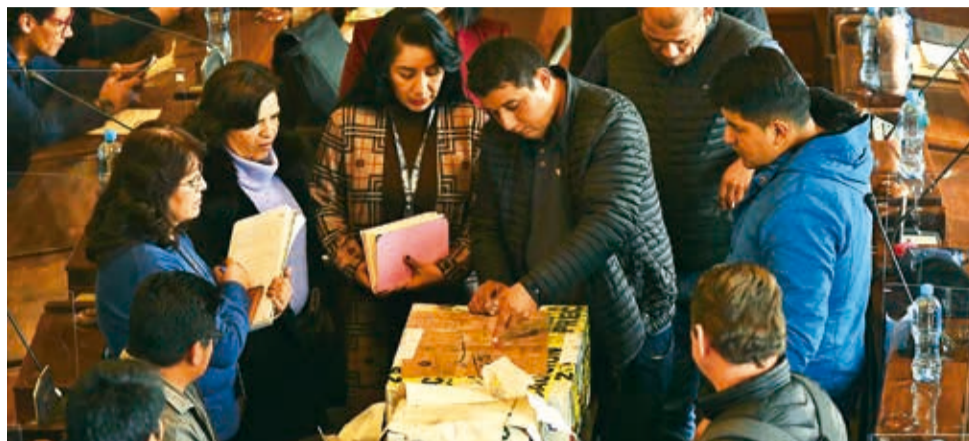
Integrantes de la Comisión de la ALP en la apertura de exámenes para judiciales, ayer.

nez Subirana y considerando que dentro del referido proceso de selección se han realizado actos vulneradores a mis derechos fundamentales, es que me encuentro legitimada dentro de la presente Acción de Defensa, por lo que acudo a sus autoridades a objeto de que se restablezcan mis derechos fundamentales”, dice en la parte inicial del documento al que Los Tiempos tuvo acceso.