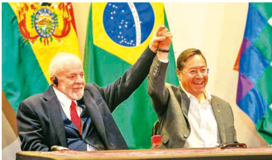
Los presidentes de Brasil y Bolivia, el martes en Santa Cruz.

Además, se identificarán insumos y productos agrícolas, ganaderos y agroindustriales de origen brasileño y boliviano, que podrán ser solicitados por las partes, con el fin de establecer la viabilidad de las