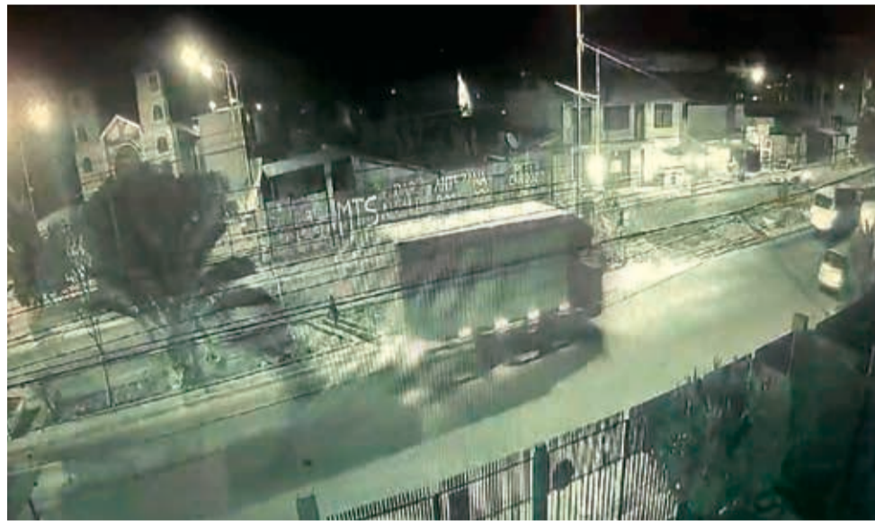
El camión que atropelló al motociclista, según imagen congelada de video.

“Hay mucha irresponsabilidad, en el primer semestre de 2023, se registraron 133 accidentes de motocicletas. Este año la cifra subió a 170; en cuanto a autos pequeños y camiones, tanto en la ciudad como en las carreteras ya suman 734 accidentes”, indicó Herbas.