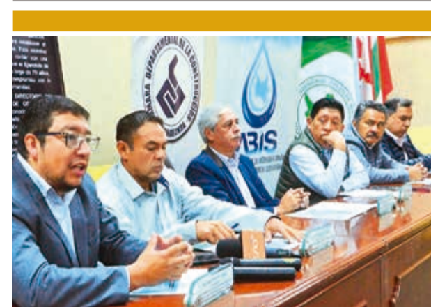
La conferencia de prensa, ayer en la sede de la SIB. HA

Recomendó notificar cualquier mordedura de animales para su inmediata atención. Cada semana, se registran 250 mordeduras en Cochabamba.