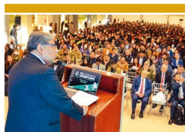
Un anterior evento de la Jornada Monetaria.

La deuda interna creció en 29% con relación a 2022, y la externa sólo en 2%.