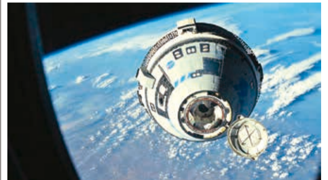
CST-100 Starliner. La nave de Boeing se acopla a la EEI en su segunda prueba de vuelo no tripulada.

Espacio. Los astronautas del Starliner de Boeing confían en que podrán volver a Tierra en la nave