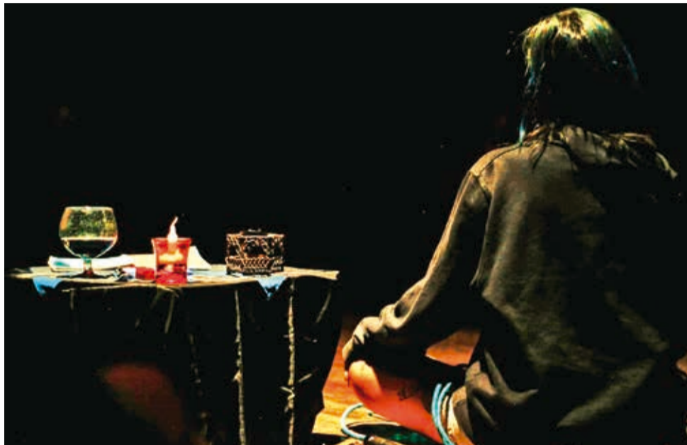
Gerundio. La obra evoca distintas experiencias sensoriales desde lo más profundo del ser.

meditación sobre el suelo pélvico que provoca placer en los cuerpos de las performers. Esto se hace diez minutos antes de que entre el público al auditorio. A partir de allí, se explora desde el placer propio hasta transformarlo en colectivo. En ese punto, la directora explica que “se invita al público a que entre en la experiencia desde lo sensorial, proponiendo diferentes placeres no simplemente el placer de ver lo que ocurre en escena, sino de conjugar con algunos sentidos, como el gusto el olfato y la vista”.