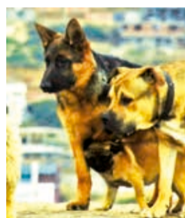
Un grupo de canes en calles de la ciudad. D.JAMES