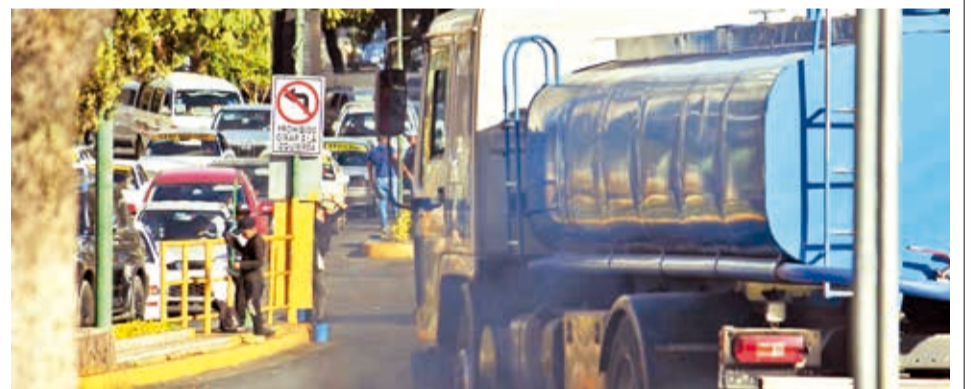
El humo de los vehículos motorizados que contaminan la ciudad.

En tanto, algunos municipios del valle alto preparan sus declaratorias de emergencia por sequía para que la Gobernación y el Gobierno nacional destinen recursos.