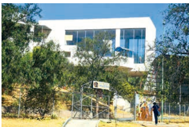
El Instituto G. Prada, ubicado en La Coronilla. CARLOS LÓPEZ

Rivero mencionó que la transferencia de la sede a la Gobernación sigue estancada, debido a la falta de documen-