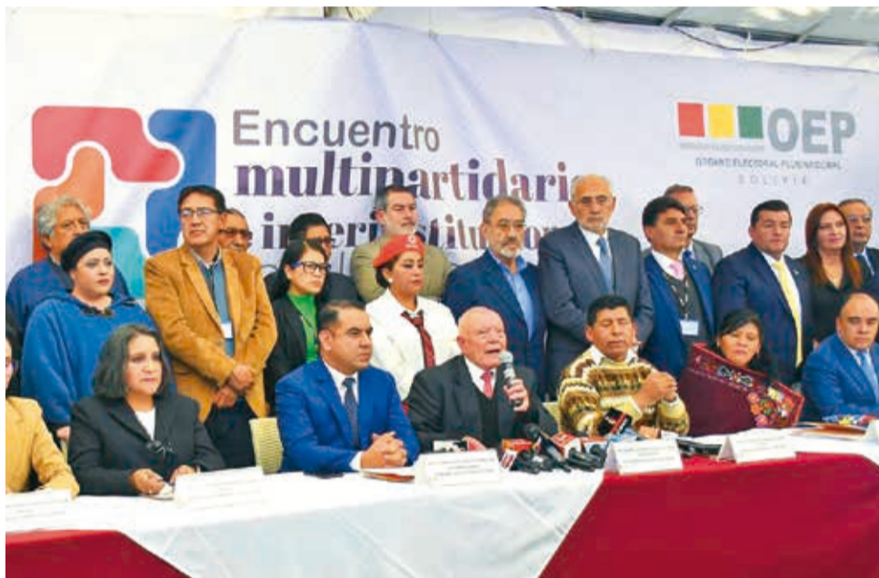
Miembros del TSE y políticos presentes en el Encuentro Multipartidario, ayer.

Además de las primarias, el encuentro determinó otros 11 puntos (ver cuadro). Se determina también dar prioridad