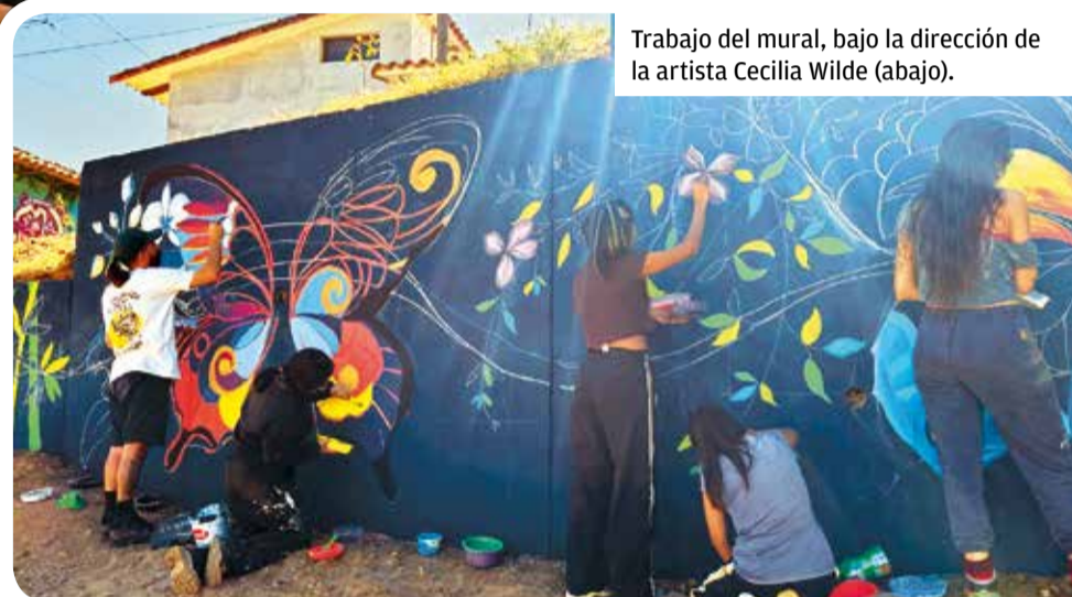
Trabajo del mural, bajo la dirección de la artista Cecilia Wilde (abajo).

El festival cuenta también con la codirección artística del actor Fernando Arze Echalar, quien busca integrar a artistas internacionales con la comunidad local, despertando el interés por la música y el arte, es-