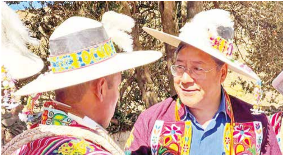
El presidente del Estado, Luis Arce, en un acto público en Oruro, ayer. RRS5

“El golpe de Estado está latente, el pueblo boliviano debe estar en alerta. Hemos escuchado los discursos de algunos diputados evistas que dicen: ‘que aliste la maleta Luis Arce, tiene que escapar’. Ellos (los evistas) tienen su plan negro, Pachajcho y Boquerón. Sabemos que ellos tienen su plan de llevar adelante un golpe de Estado”, dijo Velasco.