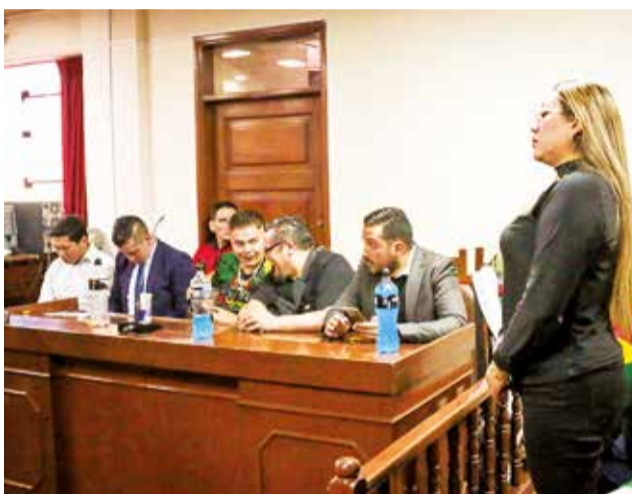
Integrantes de la RJC durante la sentencia, ayer.

Por su parte, el fiscal departamental de Cochabamba, Osvaldo Tejerina Ríos, señaló que el Ministerio Público presentó 105 pruebas documentales y 127 pruebas testificales. “Se mostró también peri-