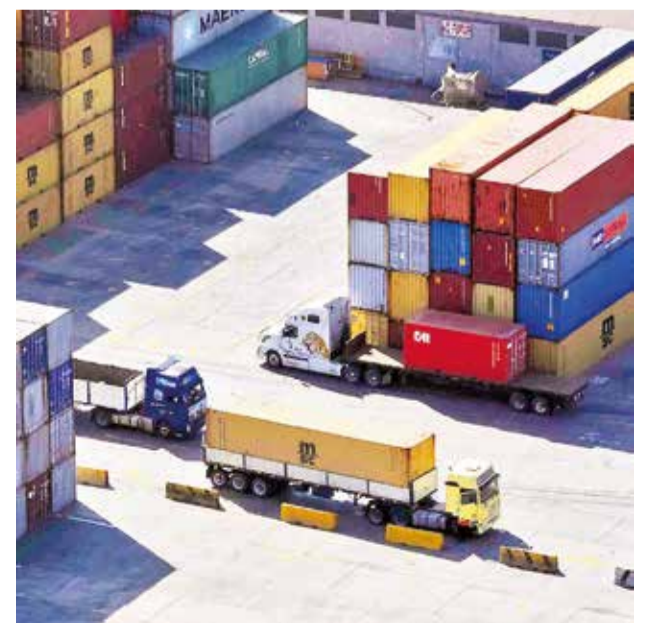
Camiones trasladan carga a puertos chilenos.

"Antes, un transportista con un solo camión no podía emitir facturas con IVA cero sin estar asociado a una empresa. Ahora, con la tarjeta de operación internacional, pueden hacerlo de manera independiente", explicó el dirigente Yucra.