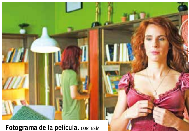
Fotograma de la película.