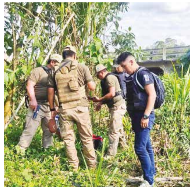
Un grupo de policías en la vivienda de Chimoré.

La investigación policial se intensifica.