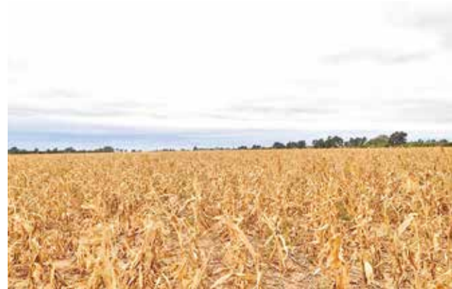
Cultivos secos en el oriente boliviano.

Dato. En la campaña de invierno de este año, se llegó a sembrar sólo 558 mil hectáreas frente a las 858 mil del año pasado