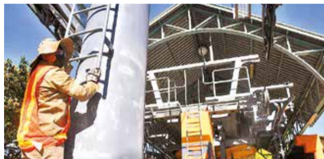
La refacción de los postes del teleférico.

miento precisó que se invierten alrededor de 570 mil dólares en la reparación y mencionó que las piezas no llegan en conjunto porque algunas se están fabricando de acuerdo a lo requerido.