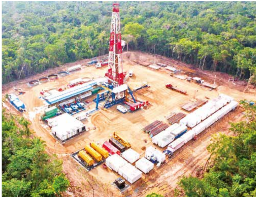
El campo petrolero Boquerón Norte ubicado en la provincia Ichilo de Santa Cruz. YPFB

Una de las metas específicas de la ley es reactivar el sector hidrocarburífero boliviano. "Actualmente, Bolivia enfrenta una reducción en la producción hidrocarburífera, afectando los ingresos de la renta petrolera, de la cual se benefician gobernaciones, municipios y universidades públicas", afirmó Mercado. La propuesta pretende duplicar las reservas de gas y aumentar la producción de petróleo, lo que resultaría en un ahorro aproximado de 1.700 millones de dólares anuales para el Estado boliviano.