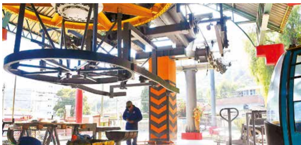
Trabajos de mantenimiento en la estación del teleférico, en San Pedro.

Mientras tanto, personal de la Empresa Municipal de Áreas Verdes y Recreación Alternativa (Emavra) realiza obras civiles para remozar los pisos de las terminales, los postes y los baños, según se constató. Asimismo, se proyecta la construcción de nuevos depósitos y un borde