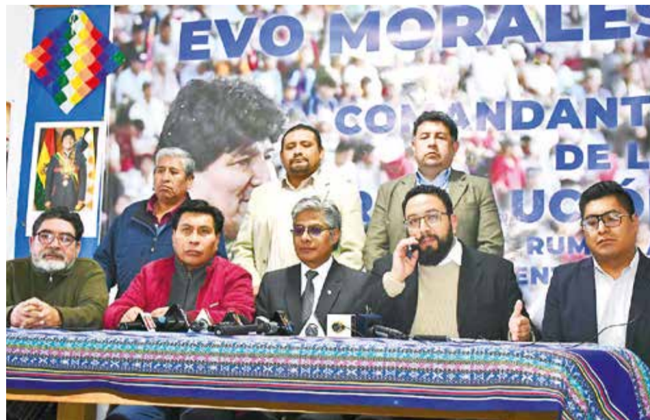
Los representantes de sector evista del MAS, ayer en conferencia de prensa.

Criticó también que el Tribunal invite a representantes del Ejecutivo o alianzas políticas, cuanto tampoco tiene un vínculo jurídico con estas entidades a nivel de partidos.