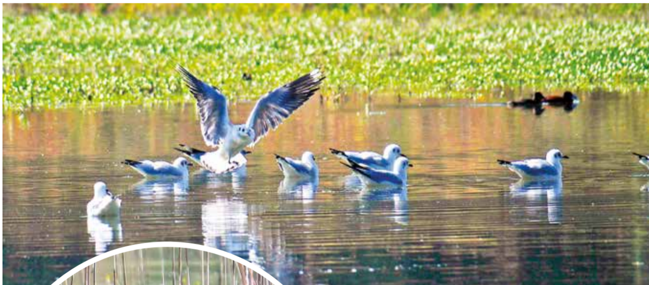
Las gaviotas andinas en la laguna de Coña Coña.

Proyecto. Se prevé revitalizar y mejorar el entorno de la laguna con áreas de esparcimiento, canchas y una playa artificial, según la maqueta expuesta, sin cambiar el espejo de agua de la zona oeste de la ciudad