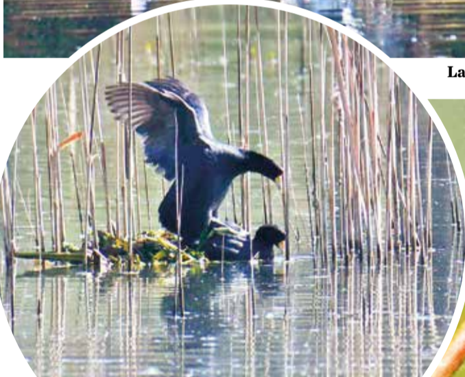
Gallareta andina ( Fulica ardesiaca ).