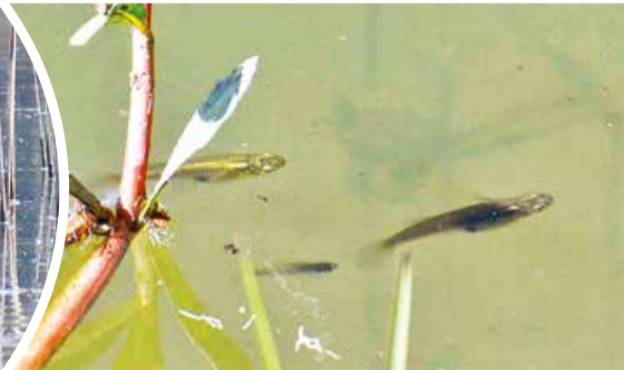
Sardinitas tipo Asthianax en la laguna.