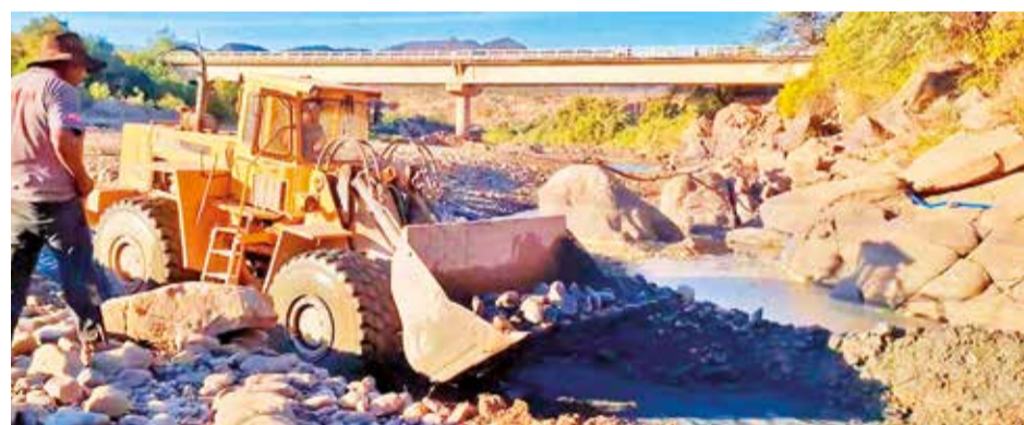
Cargan agua a una cisterna en el río Mizque, en Omereque.

Enfatizó que el propósito de referirlos a otros establecimientos es facilitar el acceso a laboratorios, medicamentos y atención a otras patologías que pueden llegar a complicar su estado de salud. “Nos reunimos con diferentes poblaciones vulnerables para realizar estas actividades en cumplimiento una normativa específica”, agregó.