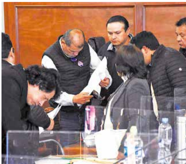
La Comisión de la ALP que recibe a postulantes.