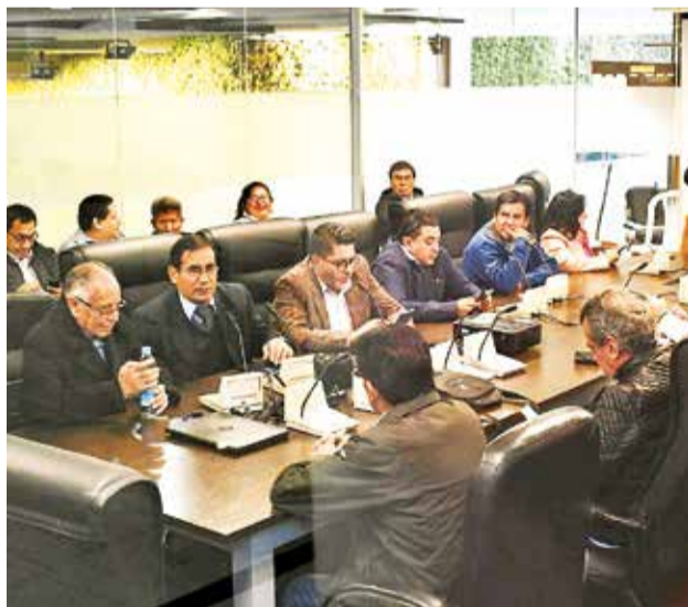
Reunión de legisladores con sector Salud. APG

“Sigue siendo obligatorio para los 65 es decir ‘tráete