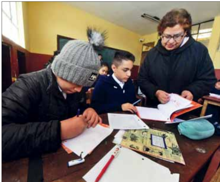
FRÍO. Los estudiantes volverán a clases recién el 29 de julio.

El calendario escolar 2024 contemplaba solo dos semanas de descanso pedagógico desde el 1 de julio. No obstante, el descenso de las temperaturas y el incremento de infecciones respiratorias obligó a una primera ampliación por una semana. Y ayer, los informes determinaron prolongar por otra semana el descanso pedagógico de invierno para los estudiantes.