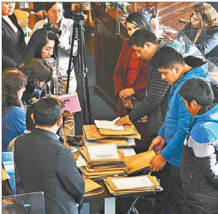
LABOR. La Comisión Mixta de Constitución retoma mañana su trabajo.

Agregó que para el Consejo de la Magistratura se tiene más de 80 postulantes, en tanto que para el Tribunal Agroambiental hay más de 40. “El viernes, sábado y domingo trabajaremos en la preselección. Hoy estamos notificando para que estén presentes a partir del viernes a las 14.00”, subrayó.