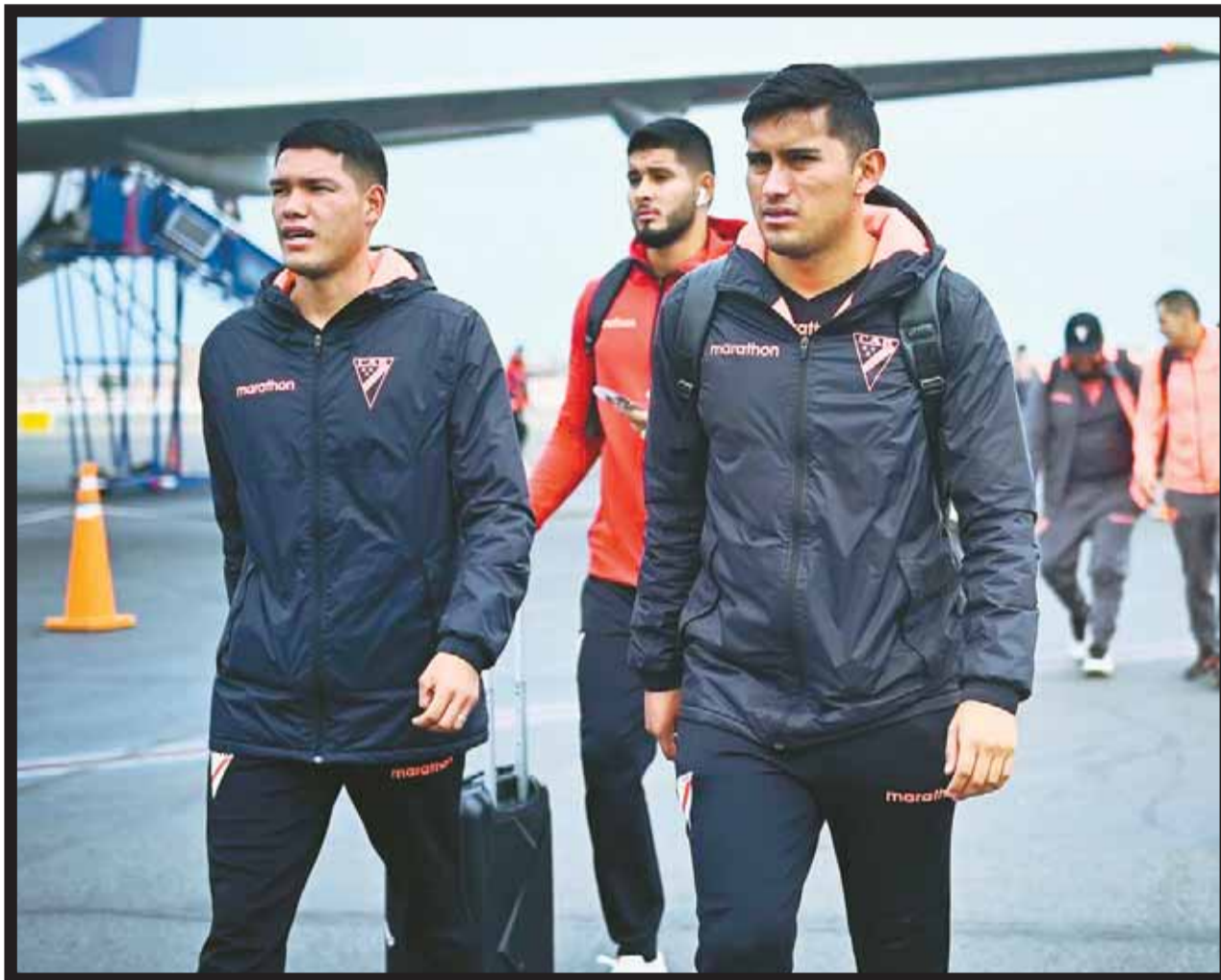
al ways ready

W Hoy (20.30 HB) jugará ante Liga DUQ por la ida de los play off de Copa Sudamericana