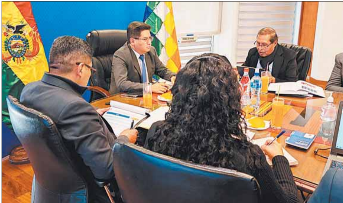
Ministerio de Economía