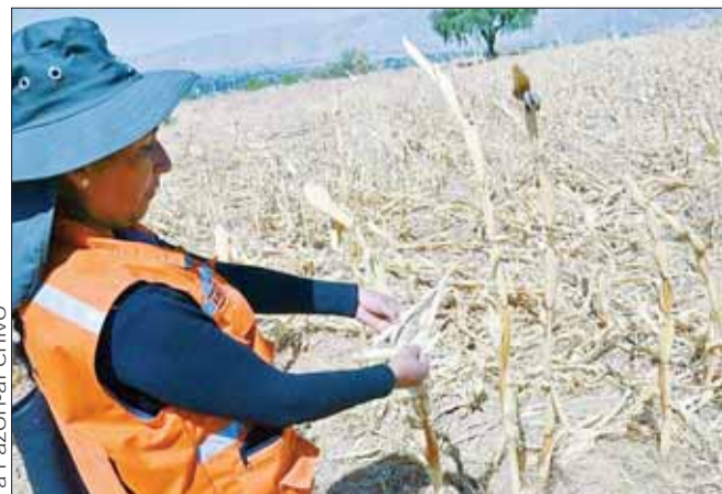
SEQUIA. Un agricultor muestra plantas de maíz afectadas.

Hay tres incendios activos en Santa Cruz: uno en San Matías y dos en Chiquitos