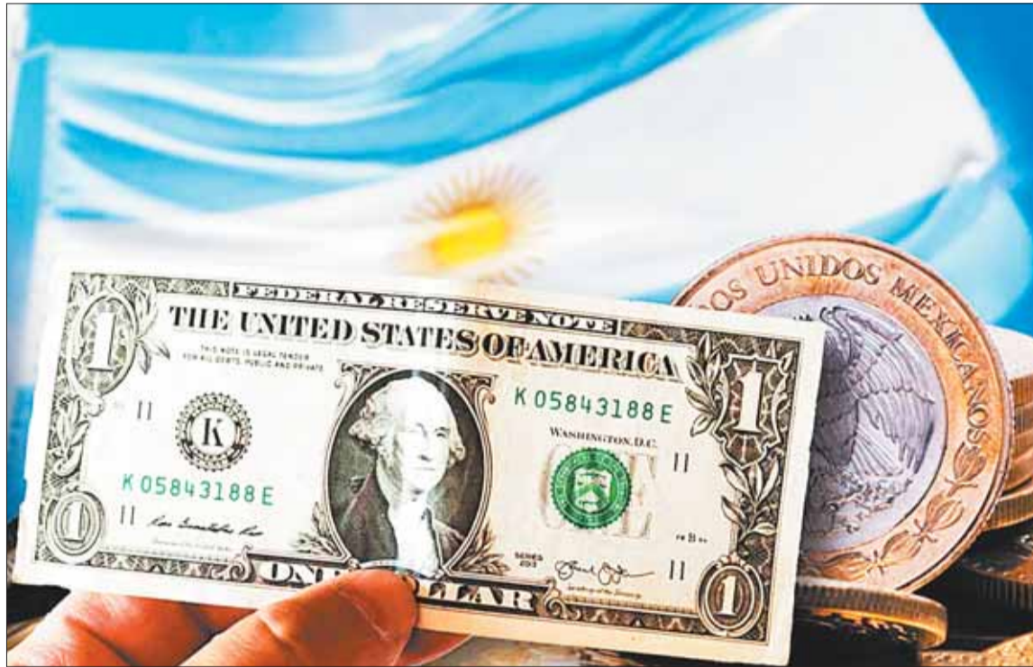
PRESIÓN. En las últimas semanas el dólar paralelo o 'blue' se disparó por la incertidumbre en el país.

En Argentina rigen restricciones a la adquisición de divisas desde el 2019, medidas que el presidente Milei prometió eliminar,