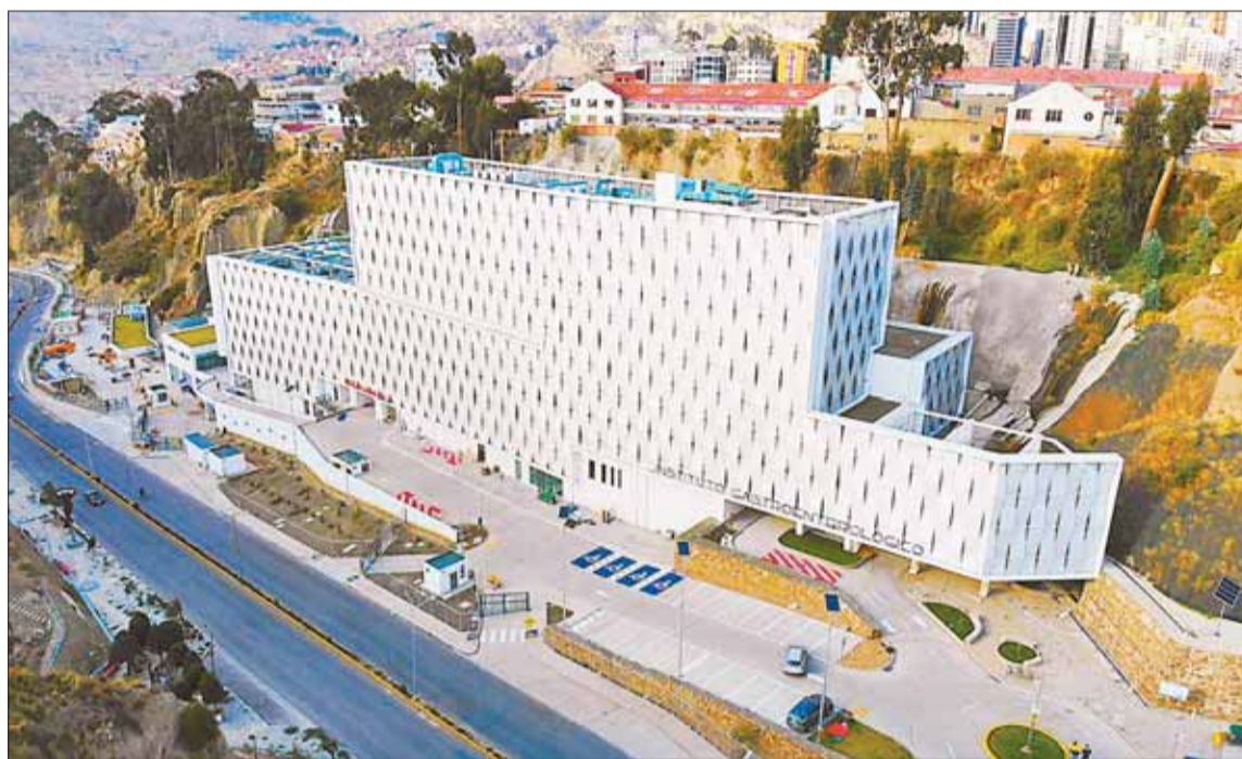
OBRA. El Hospital Gastroenterológico del Bicentenario está ubicado en la avenida Zavaleta de La Paz.

Para este proyecto, la inversión fue de más de Bs 739 millones provenientes del Tesoro.