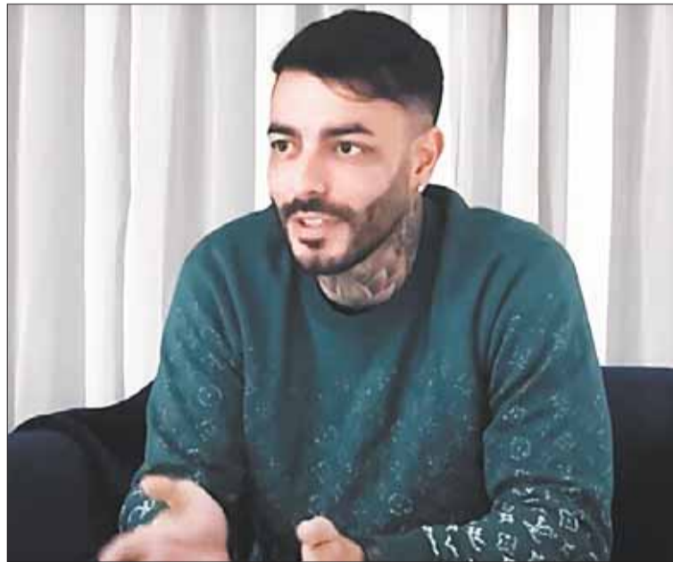
NARCO. El uruguayo Sebastián Marset es buscado a través de la Interpol.

‘Ya se tiene señalamiento de audiencia para el día 24 de julio’