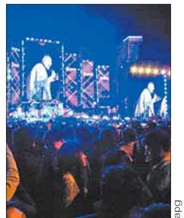
La verbena se realizó en el PUC.

En cuanto al movimiento económico, informó que la mayor composición del gasto, un 60%, está en bebidas con y sin alcohol, que sumaron Bs 17 millones. Dijo que en alimentación se erogó un gasto de Bs 7 millones y en transporte y algún otro tipo de actividad, Bs 4 millones.