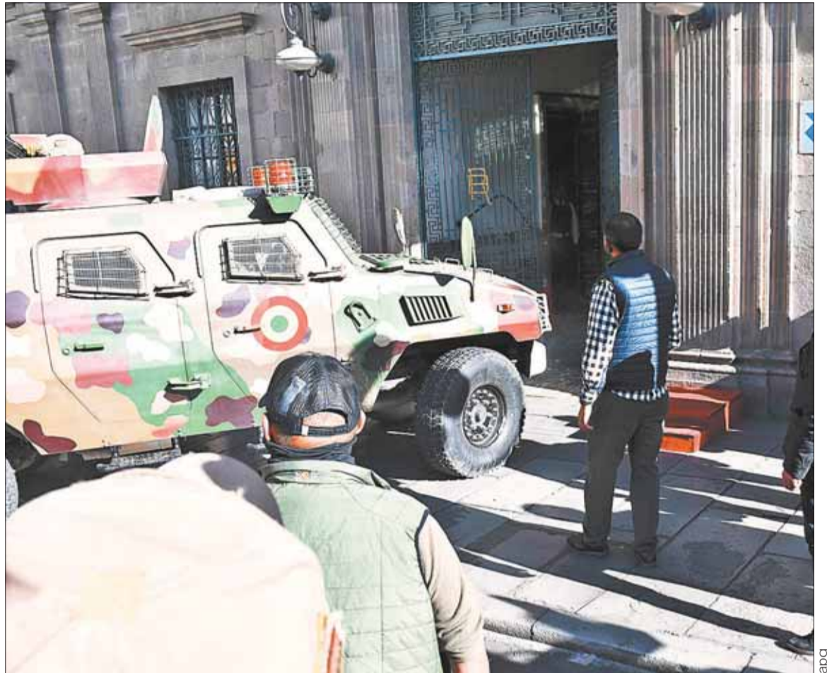
INTENTO. El momento en que un vehículo blindado rompe la puerta de ingreso del Palacio Quemado.

Heredia, ministra de Salud en el gobierno de Evo Morales, manifestó ayer su preocupación por el riesgo latente de la democracia