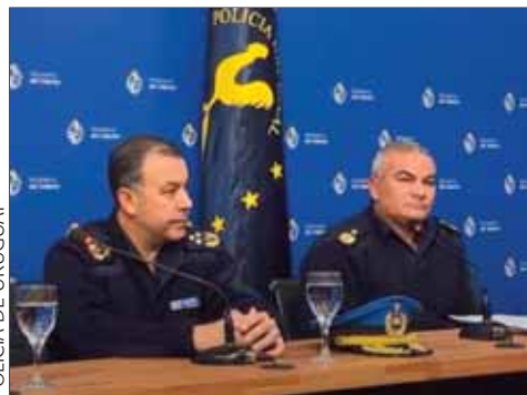
POLICÍA DE URUGUAY