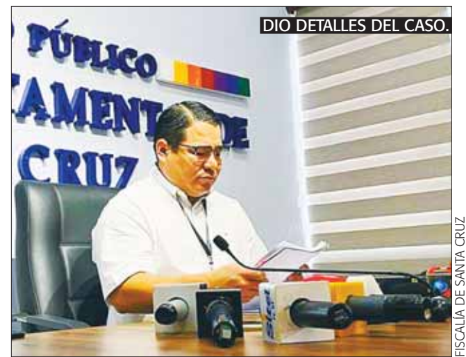
DIO DETALLES DEL CASO.

PROCESO Los operativos contra el narcotráfico lograron "inquietar" a Marset y su esposa.