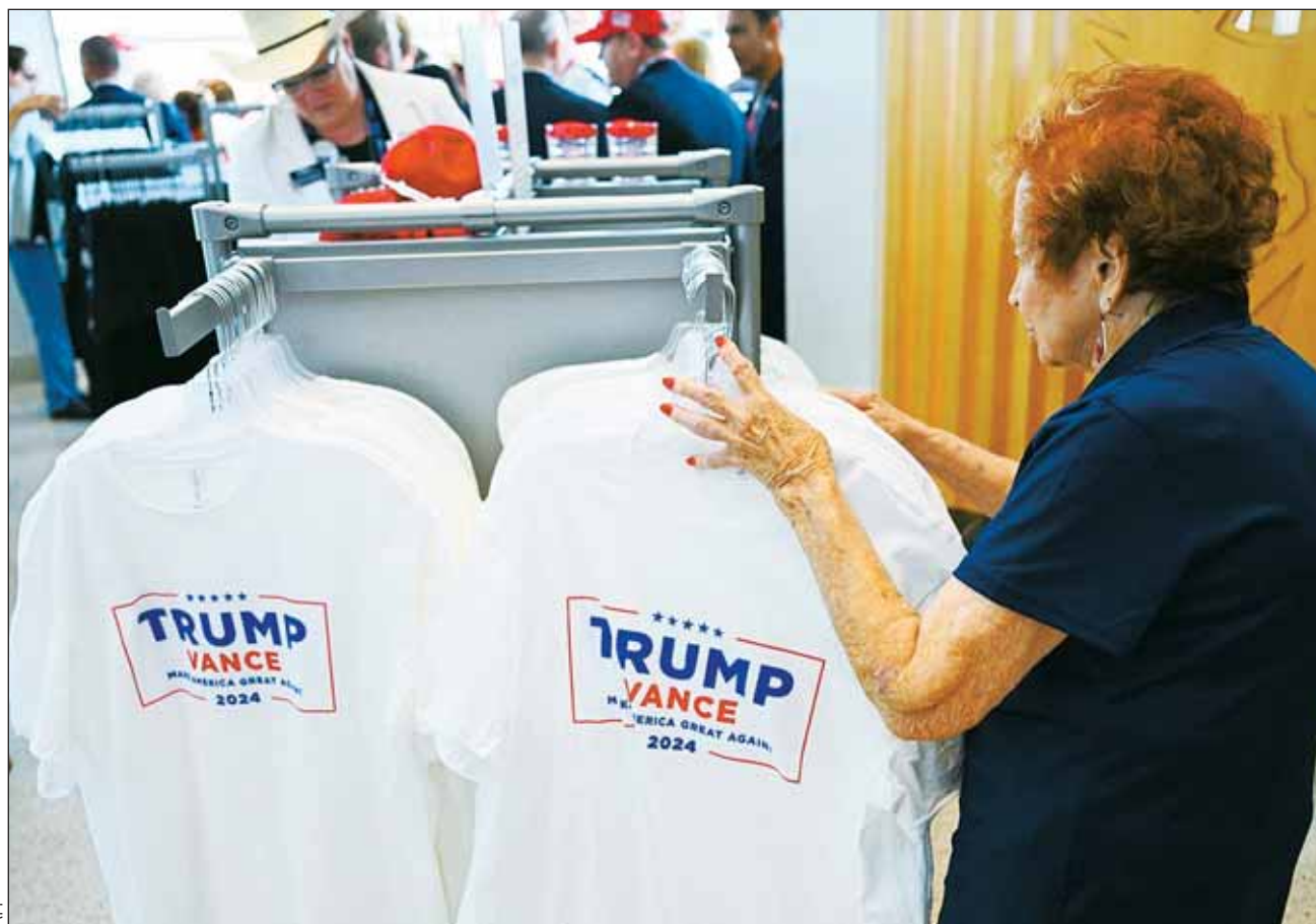
Imagen de Trump tras sobrevivir a disparo se estampa en camisetas

Inspirador. "Creo que en una situación similar uno haría lo