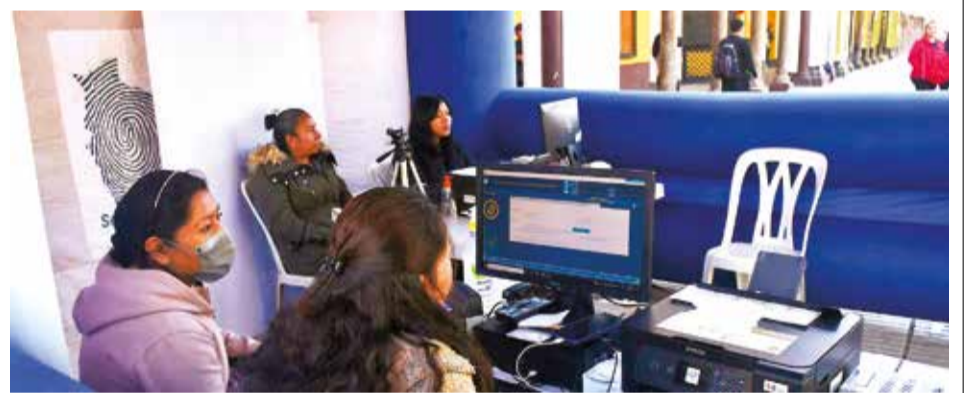
La atención de un punto móvil del Segip, en la plaza principal.