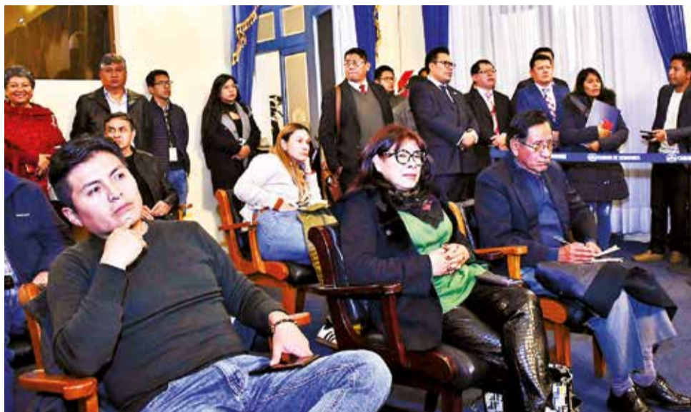
Postulantes a candidatos a magistrados judiciales ayer en la Comisión de Constitución.