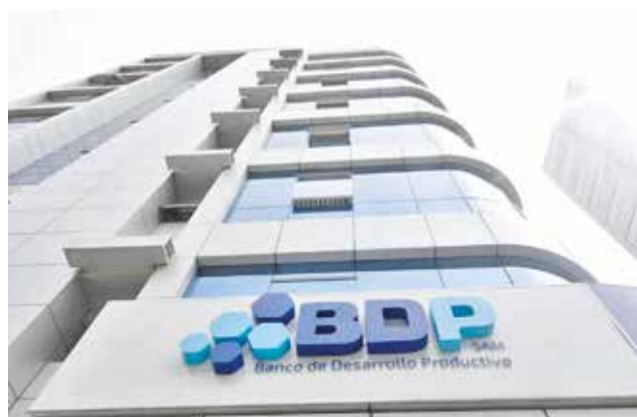
Edificio del BDP en La Paz. BDP

El BDP, en conjunto con el Banco Unión, actúa como fiduciario del crédito SiBolivia, diseñado para proporcionar financiamiento de capital de operaciones y/o inversión a productores de bienes de consumo final o intermedio en los sectores agropecuario y ma-