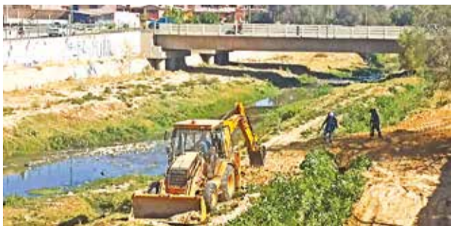
Los trabajos en la línea amarilla por el aeropuerto.

Avances. La Asociación Accidental de Tunari retomó las obras en abril tras la emisión de la licencia