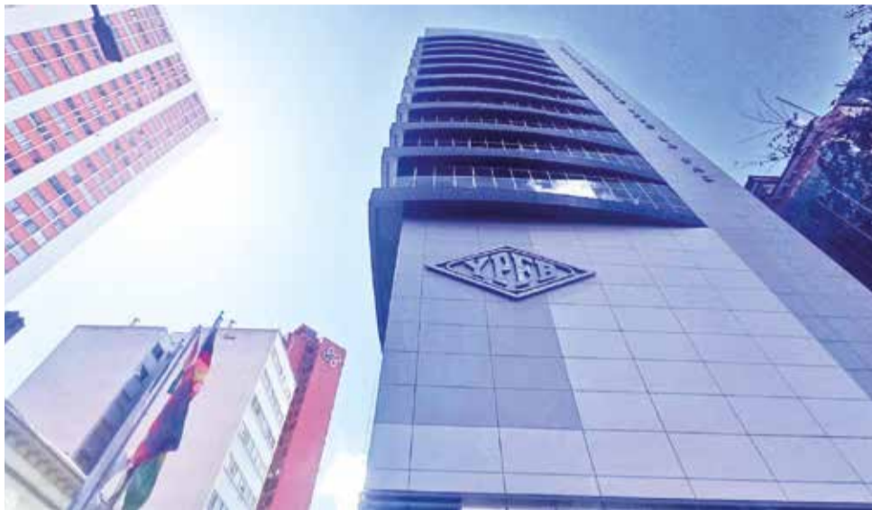
Oficinas de YPFB en el centro de la ciudad de La Paz.

Mientras tanto, la caída de la producción continúa. A mayo de este año llegó a 32,8 millones de m3d.