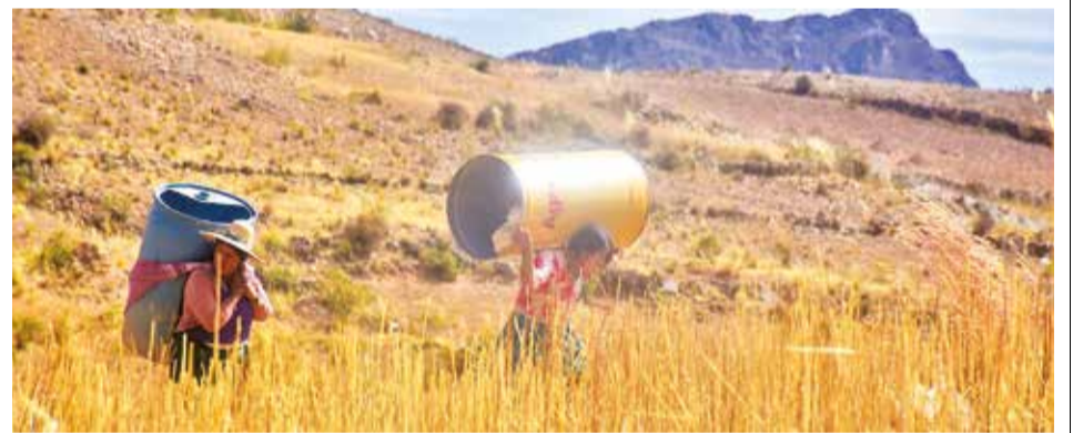
La sequía azota a los pobladores de Arque. JOSE ROCHA

Aunque la Gobernación descartó daños en viviendas, el secretario de Salud de Quillacollo, Milton Heredia, dijo que se sintió fuerte y “varios de nuestros hermanos quillacolleños se preocuparon; más bien no pasó a mayores”.