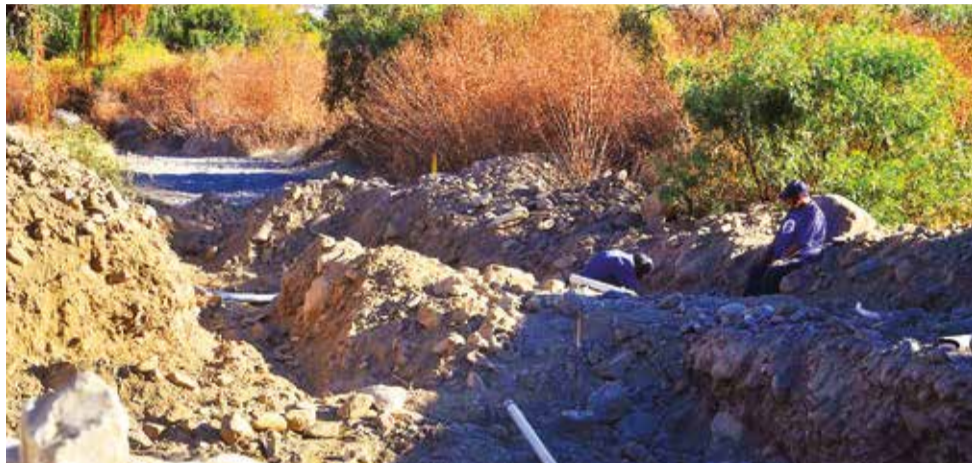
Las excavaciones que dañaron las tuberías de la comunidad.

bre, no pertenece a ningún sindicato, porque es área protegida. Cuando reclamamos del porqué de la construcción, reaccionan a la ofensiva”, contó Sipe.