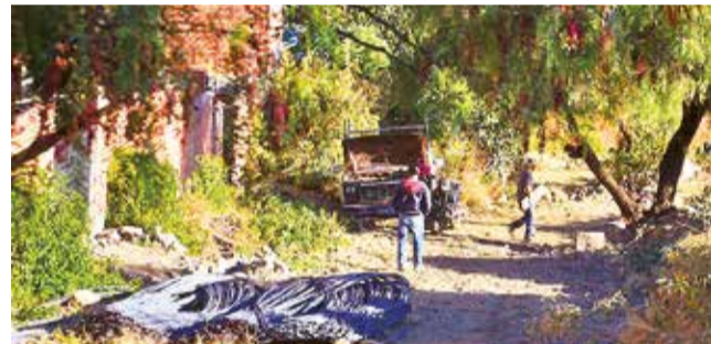
Material de construcción en el camino.

Ley No. 153 declara de prioridad nacional la forestación y reforestación para la conservación del Parque Nacional