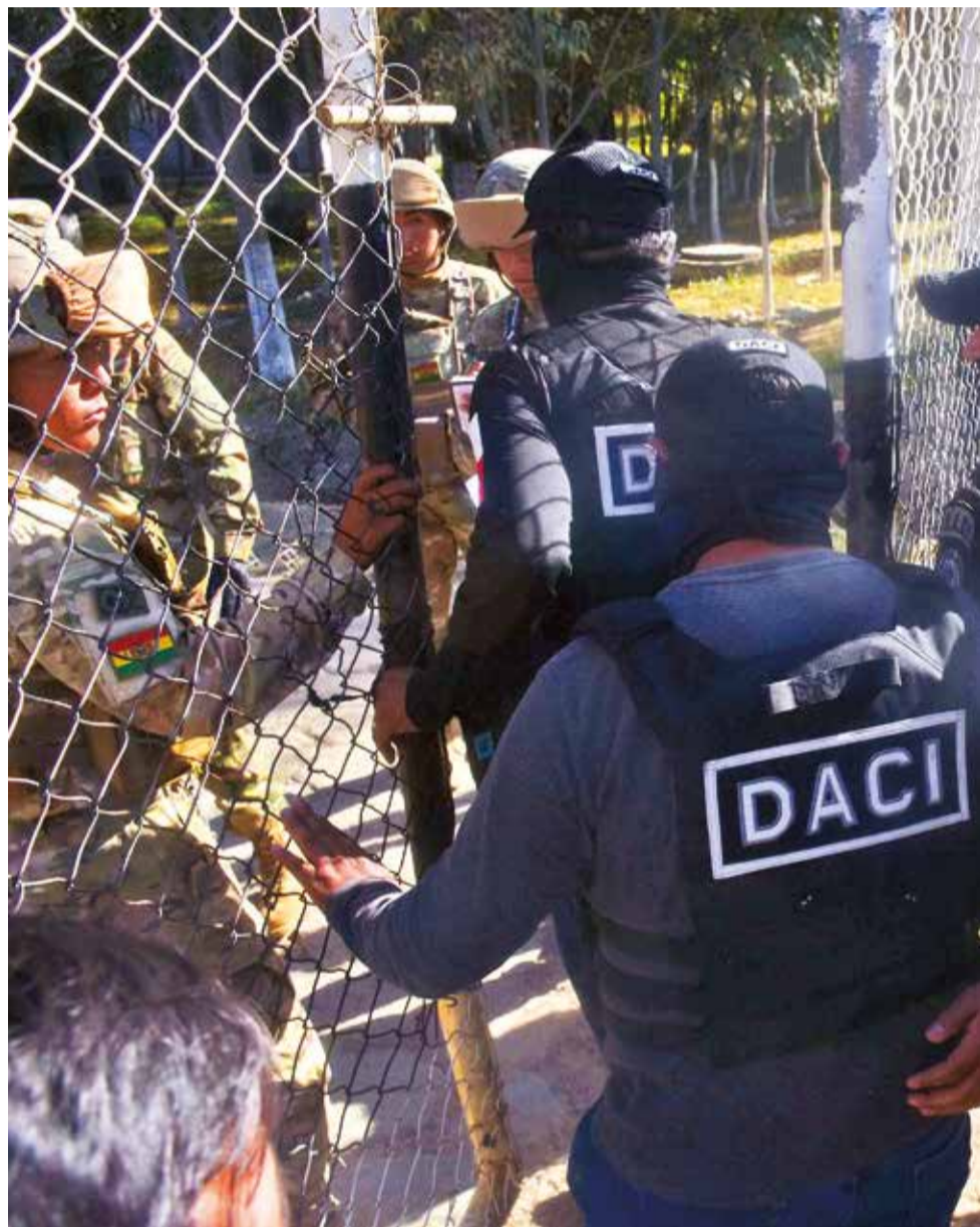
Policías ingresan al cuartel de Cotapachi en Cochabamba, ayer.

Aguilera confirmó que se arrestó ayer al comandante