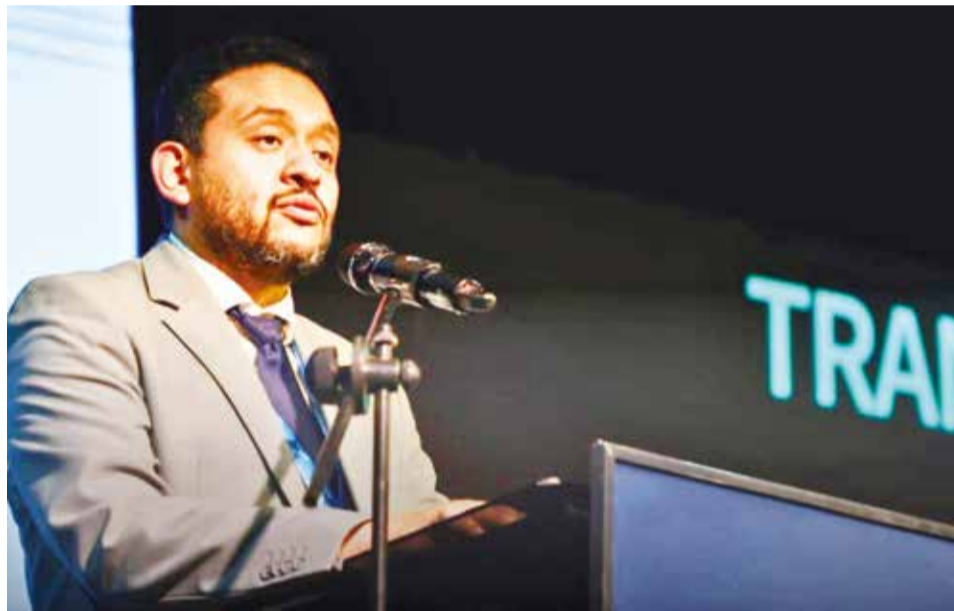
El viceministro de Exploración y Explotación de Recursos Energéticos, Raúl Mayta.

La necesidad de un marco normativo actualizado es el primer y más crucial paso para avanzar en el programa de biocombustibles de Bolivia. Según el Ministerio de Hidrocarburos y Energías (MHE), esta recomendación surgió del Foro de Transición Energética Bolivia 2050, donde se