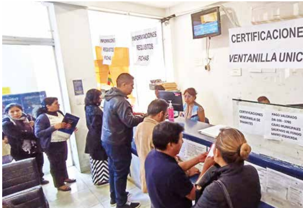
Contribuyentes acuden a pagar impuestos municipales en Recaudaciones. CARLOS LÓPEZ

nuevos operativos para la retención de vehículos y el embargo de inmuebles. “Vamos a continuar porque todavía existe mora y nosotros tene-