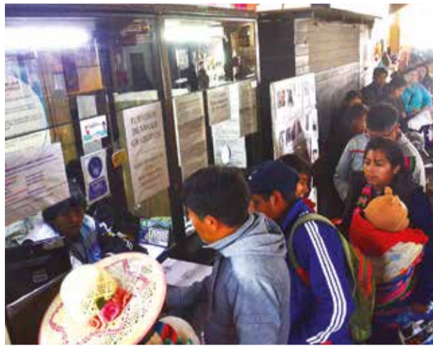
Uno de los operativos que se desarrolló en la terminal de buses de Cochabamba.

dido en el retén de Chiñata, donde se sorprendió a tres adolescentes, de 12, 13 y 14 años, que viajaban solos al trópico de Cochabamba; además, el Consejo Departamental de Lucha Contra la Trata y Tráfico sorprendió a progenitores que no portaban su documentación, ni de los me-