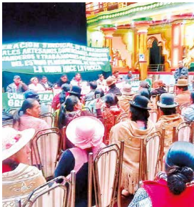
Ampliado nacional de gremiales, ayer en La Paz.

7- Liberar las exportaciones, para que puedan ingresar dólares al país.