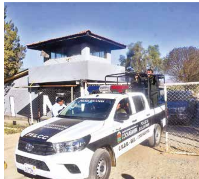
Una camioneta de la Policía se retira de Cotapachi.

“Había cinco francotiradores de Cochabamba (del F10), estamos investigando