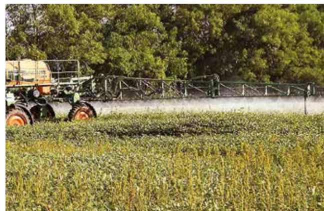
Cultivos de soja en el oriente boliviano.

Apunte. El gerente general de la institución indicó que la falta de dólares y combustibles afectan a la producción y la encarecen