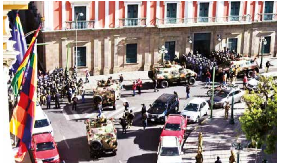
Acciones militares durante el golpe de Estado fallido en plaza Murillo en 26 de junio.