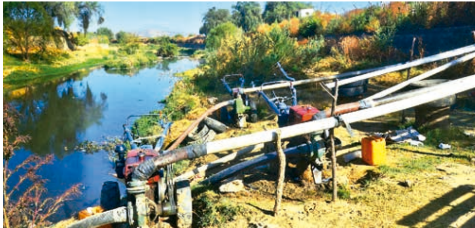
Las tuberías para desviar el agua del río Rocha al canal de riego.

La Maica, al igual que parte de Tiquipaya y Quillacollo, recibe aguas desde la represa La Angostura. Sin embargo, cada vez más municipios, especialmente de