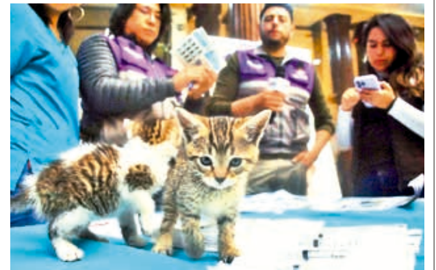
Lanzan la campaña de vacunación contra la rabia.