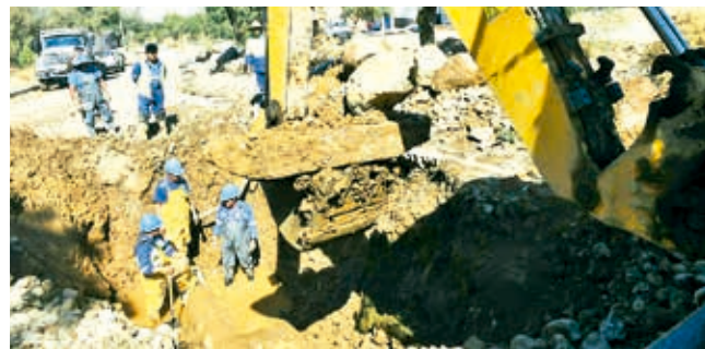
Semapa repara el ducto Taquiña Barrilete, ayer. DANIEL JAMES

Reventones. Sólo en junio, hubo tres colapsos de tuberías de Semapa en las avenidas principales del municipio