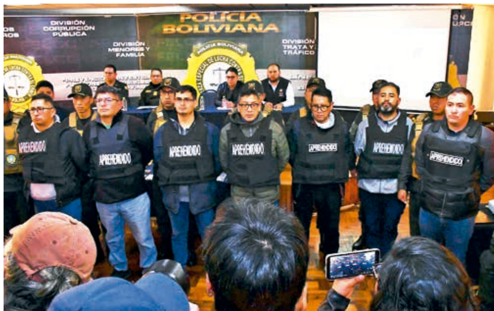
Los militares y civiles aprehendidos y presentados ayer a los medios, en La Paz.

El mandatario respondió de esa manera a las críticas de un “autogolpe” que el ala “evista” y la oposición sostienen que en realidad ocurrió la tarde del 26 de junio y con las declaraciones que hizo Zúñiga