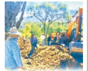
Realizan atajados en Omereque. EMAVRA