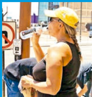
La ola de calor que se vive en Arizona.

partido de este viernes, a las 15:00 local (18:00 HB), en el State Farm Stadium, según el portal weather.com habrá una temperatura de 43 grados, menos mal que el estadio es techado y climatizado, sino sería imposible jugar a