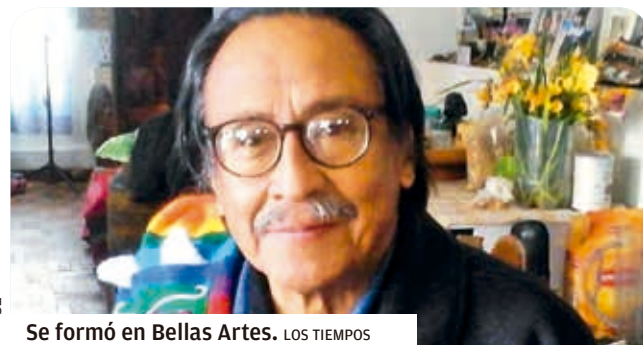
Se formó en Bellas Artes. LOS TIEMPOS