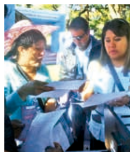
La feria tributaria en la plaza. JOSÉ ROCHA