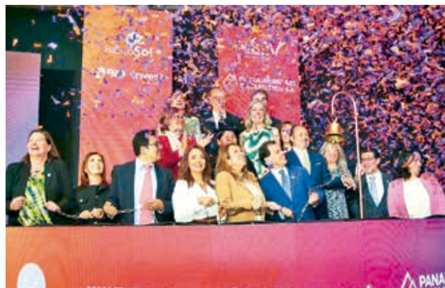
El acto de presentación del proyecto.

Riesgo S.A y AESA Ratings. La emisión se ejecutó en el mercado de capitales boliviano, y BID Invest respaldó con una garantía parcial de crédito cubriendo hasta el 50 por ciento del capital de la emisión. Los recursos permitirán financiar a 4.500 micro y pequeñas empresas lideradas