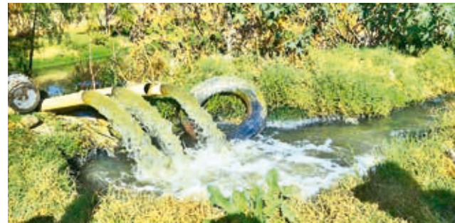
Se armaron sistemas para extraer el agua.

Escanee el código QR para ver el video del director de Riego de la Gobernación.