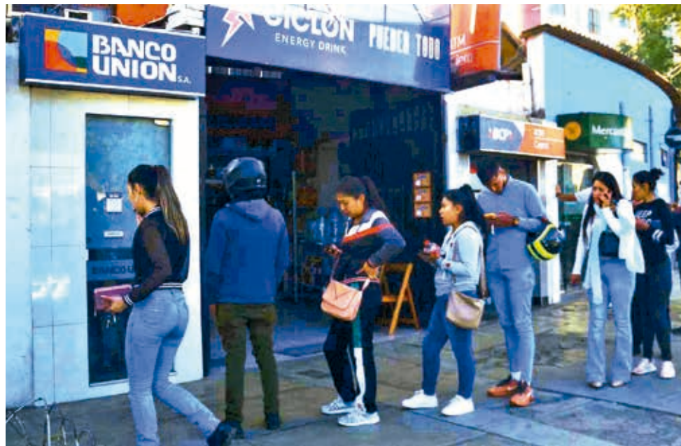
Ciudadanos buscan sacar su dinero de un cajero automático en Cochabamba. CARLOS LÓPEZ

El temor y la confusión también se trasladaron a los mercados y gasolineras. La Empresa de Apoyo a la Producción de Alimentos (Emapa) repor-