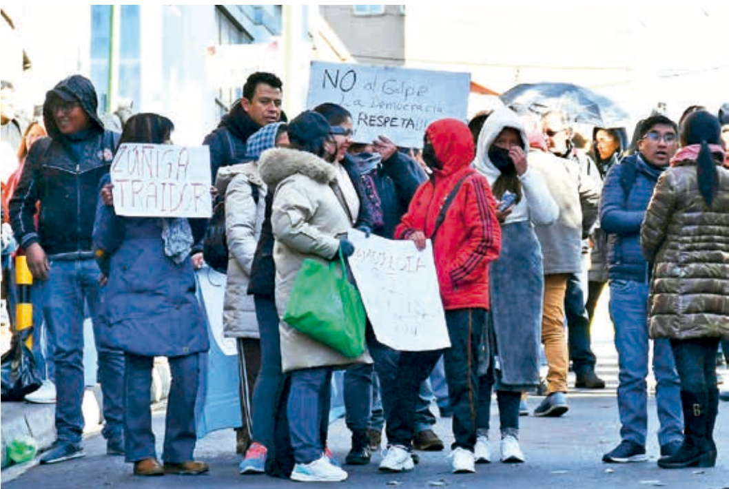
Representantes de organizaciones sociales dan su apoyo al Presidente, ayer.