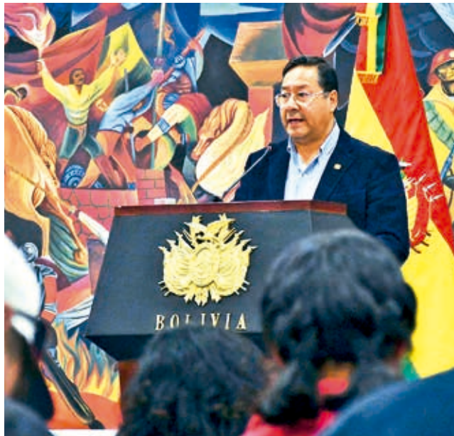
El presidente Luis Arce, ayer con los periodistas.