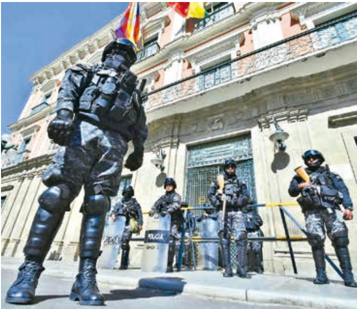
Resguardo policial en la plaza Murillo, ayer.