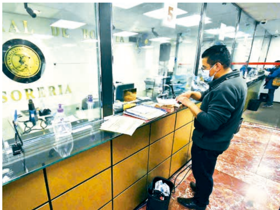
Venta de dólares en ventanillas del Banco Central.

Desde abril, se ha observado un repunte significativo en las exportaciones, impulsado principalmente por el sector sojero. Este crecimiento se espera que aumente la disponibilidad de dólares en el país, lo que podría influir en una reducción del tipo de cambio paralelo. Los primeros tres meses del año fueron compli-