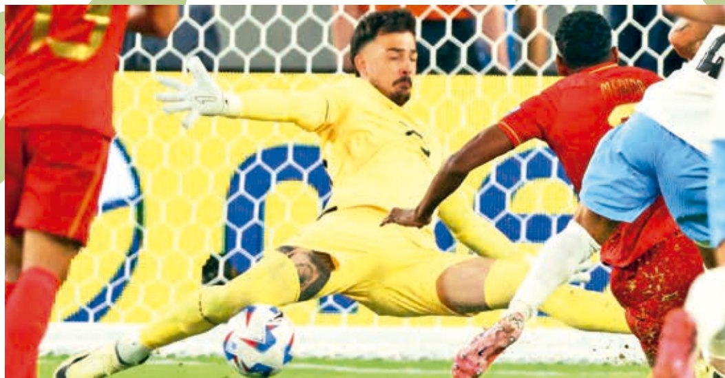
Guillermo Viscarra (centro), portero de Bolivia, no puede evitar el gol de Maxi Araújo, anoche.

A los 7 minutos de iniciadas las acciones, un tiro libre de Nicolás de La Cruz encontró un pivoteo de Ronald Araújo y,