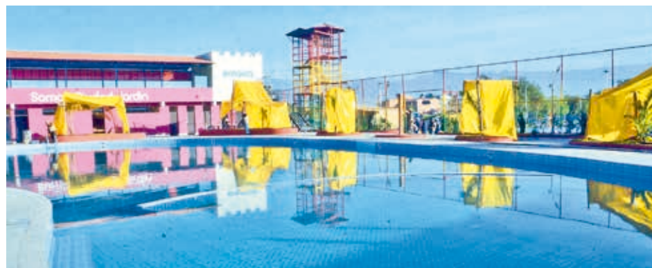
La piscina en el Parque Integración del Sur, en La Tamborada.

Las tres fallas se repararon rápidamente, pero generaron problemas con el tráfico vehicular.