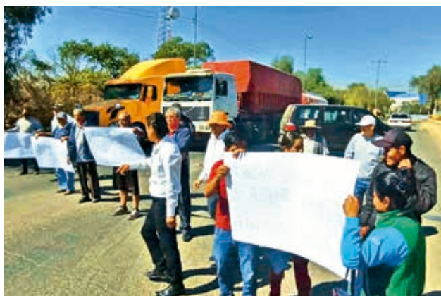
Vecinos bloquean por el trazo de línea del tren. CARLOS LÓPEZ

“Indicaron que se va a cortar una vía estructurante, entonces nosotros enviamos las