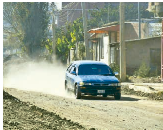
El polvo en la vía por el paso de motorizados. DANIEL JAMES

Perjuicio. Los pobladores de la OTB La Glorieta, en el límite entre los dos municipios del valle bajo, se enfrentan constantemente