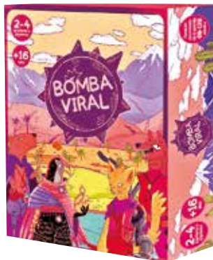
Bomba viral. Juego de mesa.

Este juego es una pieza central en la estrategia de la Fundación Muy Waso para promover la Alfabetización