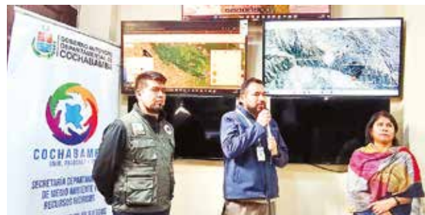
La Gobernación presenta el plan de San Juan.