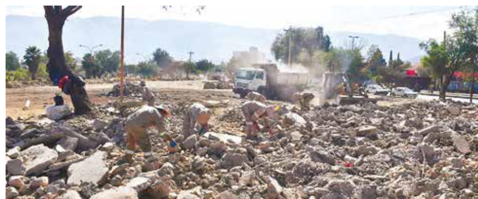
Trabajos de Emavra en la plaza Julio León Prado, en el parque Mariposa. DANIEL JAMES

"Tenemos que generar conciencia acerca del cuidado del medioambiente y denunciar", señaló.