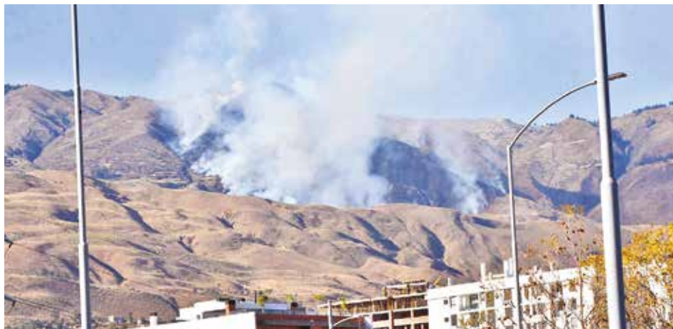
Un incendio forestal que afectó al Parque Nacional Tunari en 2024. HERNAN ANDIA

Conozca el reporte de la UGR de la Gobernación. www.lostiempos.com