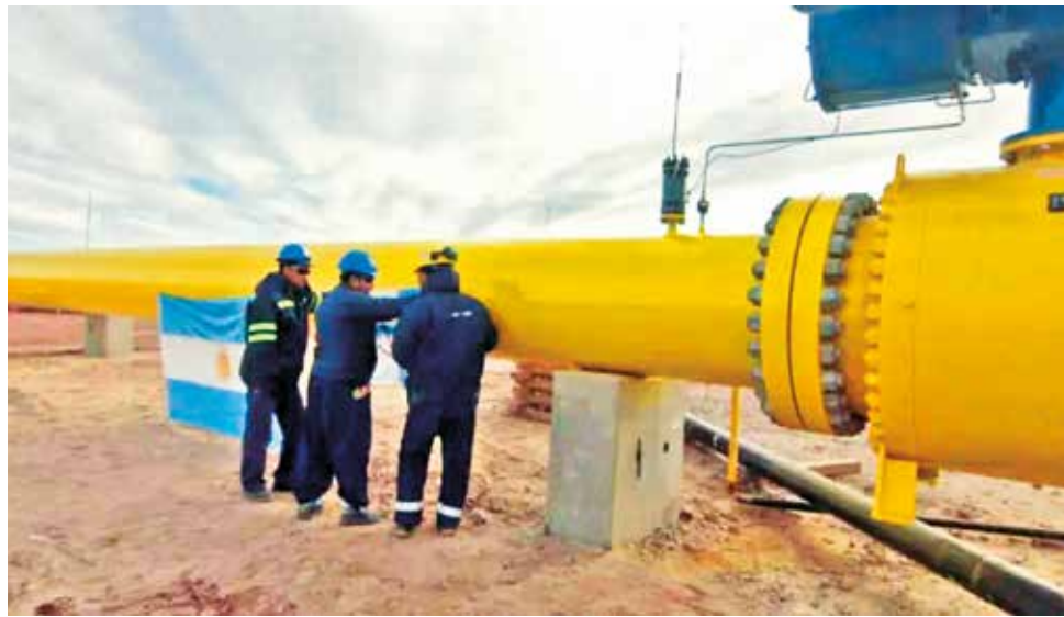
Los ductos bolivianos están listos para transportar el gas argentino. REDACCION.COM.AR

La producción de gas boliviano, por otro lado, continúa en caída. En mayo alcanzó los 32,8 millones de m3d y hace un año estaba en 35,8 millones de m3d.