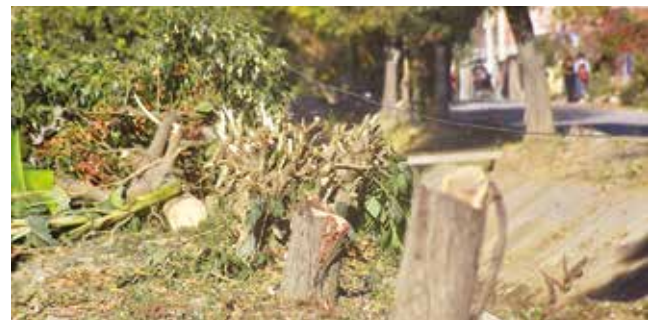
Los árboles talados en el canal de Linde, en Tiquipaya. J.R.

Medioambiente. Los vecinos de Linde Sur presentaron ayer una denuncia en contra de los regantes por daño al medioambiente