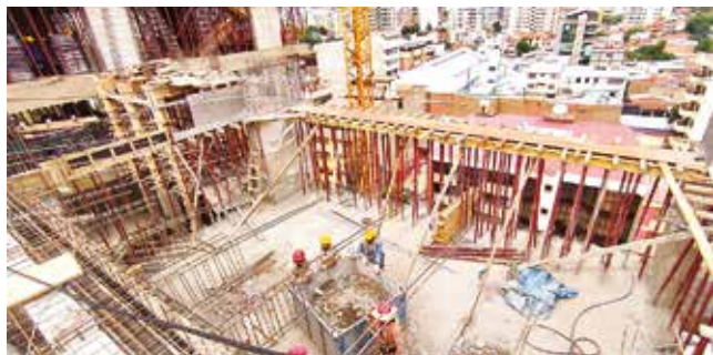
La construcción del edificio municipal en la Colón. D. JAMES

Evaluación. La DGAC y la Alcaldía trabajan para reducir los riesgos de operación de la pista con señalización y recomendaciones