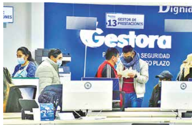
Oficinas de la Gestora Pública. APG

Comunicado. La empresa pública señaló que prioriza inversiones en sectores rentables “que abordan problemas globales”