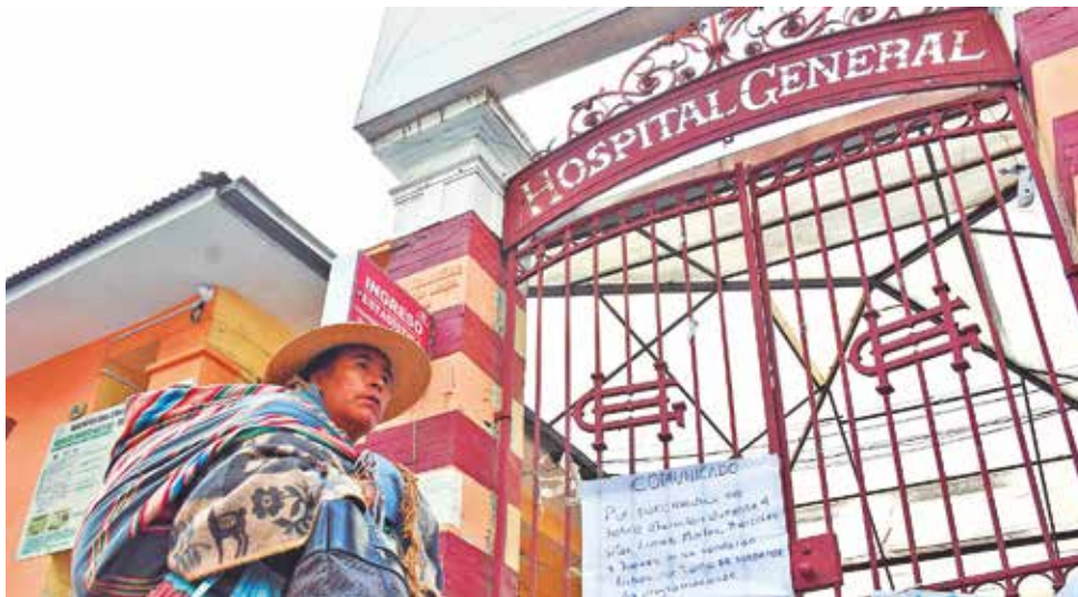
Un centro de salud cerrado por el paro convocado por los médicos, ayer en La Paz.

El sector también participó de mesas de trabajo en busca de una solución al conflicto, pero fue un fracaso.