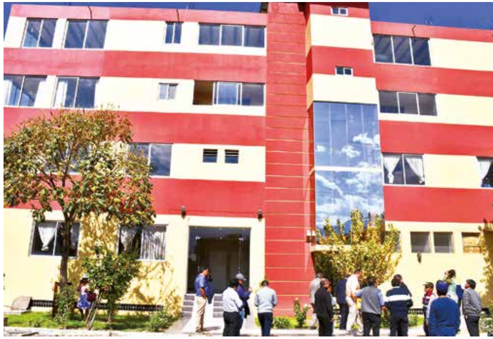
El edificio de la UMSS en la av. Albina Patiño, cerca de Manaco, en Quillacollo. C. COTARI

“En el valle bajo tenemos seis unidades académicas que funcionan y también tenemos la facultad de Veteri-