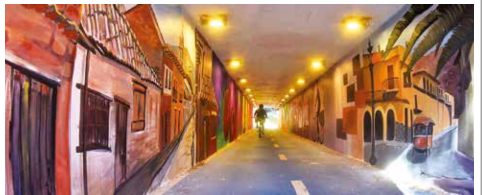
Los murales de la nueva imagen de la ciclovia de la zona norte. JOSE ROCHA

El director ejecutivo reconoció que pese a las medidas la edificación limitarán la operación por la pista del aeropuerto.