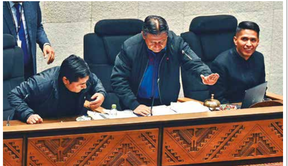
El vicepresidente del Estado, David Choquehuanca, ayer en la ALP.