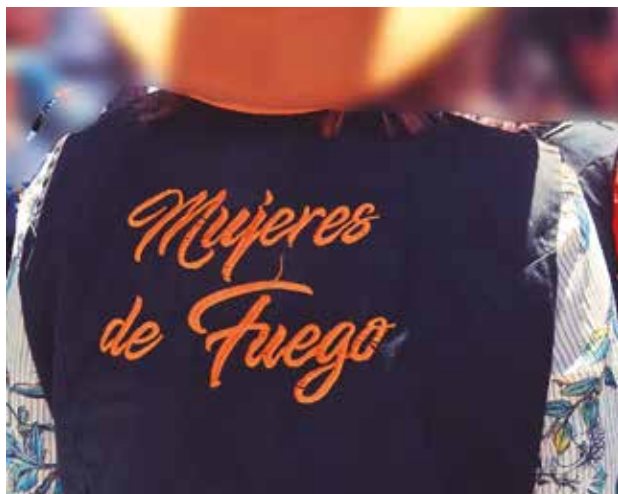
Miembros del colectivo Mujeres de Fuego.

Sobre la denuncia, la representante del colectivo,