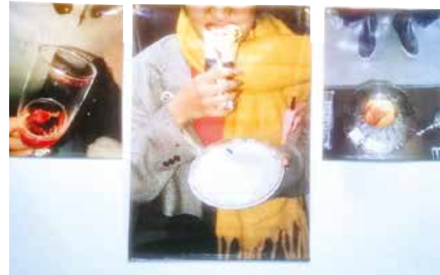
Montaje. Algunas fotografías expuestas en la Galería Christian Valbert de la Alianza Francesa.

El Concurso de Música Clásica Bolivia 2024 cuenta con el apoyo de diversas instituciones y con el entusiasmo del público se espera que este evento siga siendo una plataforma clave para el desarrollo artístico en la región.