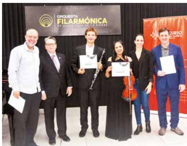
Destacados. Los ganadores (centro) junto a los representantes del concurso.