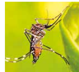
El mosquito Aedes aegypti , del dengue.