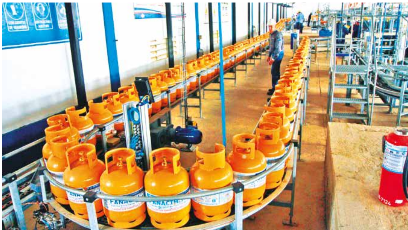
Una de las plantas engarradoras de gas licuado de petróleo (GLP) de YPFB en Santa Cruz. YPFB

La estrategia de YPFB es clara: ofrecer el GLP directamente a los consumidores pa-