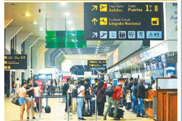
El aeropuerto de Viru Viru, el más grande del país.

En 2023, la Gestora invirtió 45,2 millones de bolivianos en bonos verdes emitidos por el Banco de Desarrollo Productivo (BDP), con vencimiento de cuatro y siete años, y con tasas de 4,5 y 5,5 por ciento, respectivamente. Este dinero es “destinado a financiar proyectos y actividades verdes que buscan reducir las emisiones de gases de efecto invernadero”.