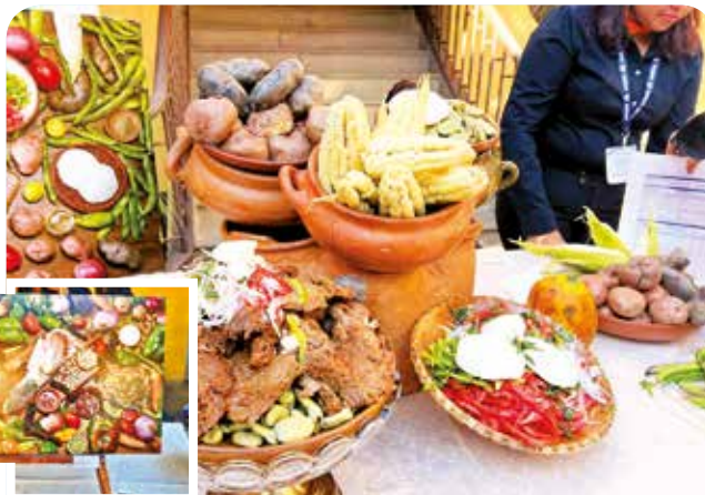
Iniciativa. Exposición de los platos tradicionales y fotografías de los ingredientes.

“Hoy conmemoramos la primera versión de este museo en Cochabamba, una iniciativa