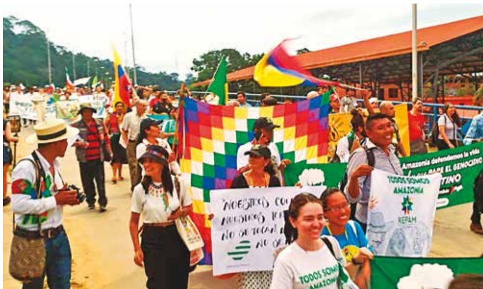
Indígenas reunidos en el Fospa, en Beni.

Exigen a las autoridades la socialización y cumplimiento del Acuerdo de Escazú, ante las agresiones constantes a los defensores ambientales, así como la paralización de amedrentamiento a estos defensores.