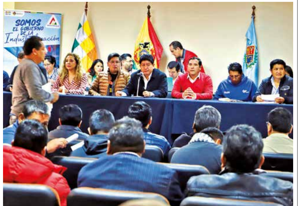
Reunión del transporte pesado con el Gobierno, en Cochabamba, ayer.

Sobre el encuentro, el ministro de Obras Públicas, Edgar Montaña, calificó de positivo el diálogo y destacó