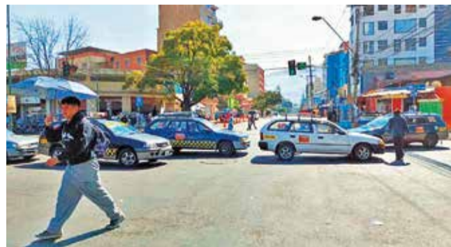
La protesta de taxistas pidiendo seguridad. PEDRO FIGUEROA

Plan. Tras protesta de taxistas se determinó reforzar el servicio en la zona para cuidar la integridad de los pasajeros y conductores.