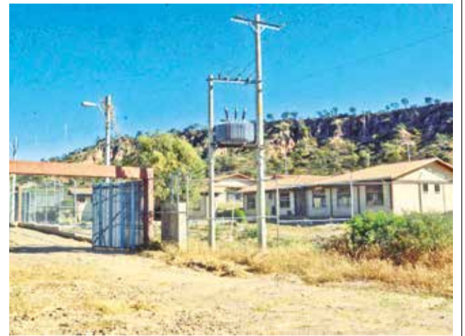
El bloque para adultos que se halla cerrado.