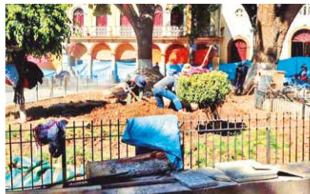
La remodelación de la plaza 15 de Agosto. GAMQ

Los conductores cuestionaron la falta de efectivos en el lugar pese a que pocas se encuentra las instalaciones de la Fuerza Especial de Lucha Contra el Crimen (Felcc). Asimismo, cuestionaron que la Policía no recibe las denuncias que presentan por agresiones.