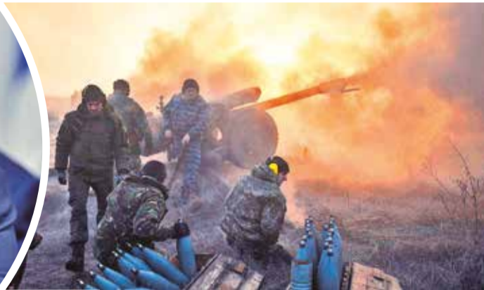
En Ucrania continúa la guerra tras la invasión rusa hace 14 meses.