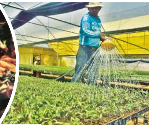
Plantines de tomate en un vivero (izq.) y una cisterna que carga agua para riego en el río Mizque.