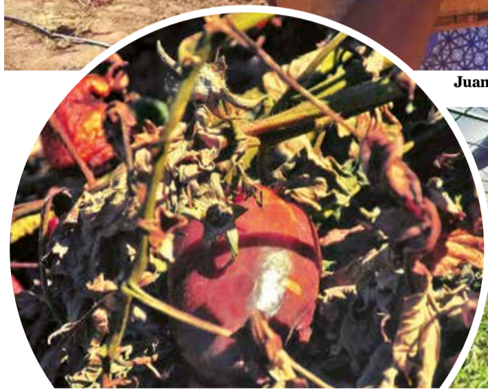
Plantas atacadas por la "peste negra".