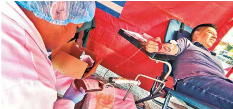
La donación de sangre en la colecta de la plaza de Las Banderas ayer.

“Antes el 20 por ciento de los donantes eran volunta-