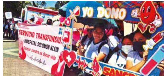
Algunos mensajes para promover la donación voluntaria.

Los asistentes aprovecharon la actividad para dis-