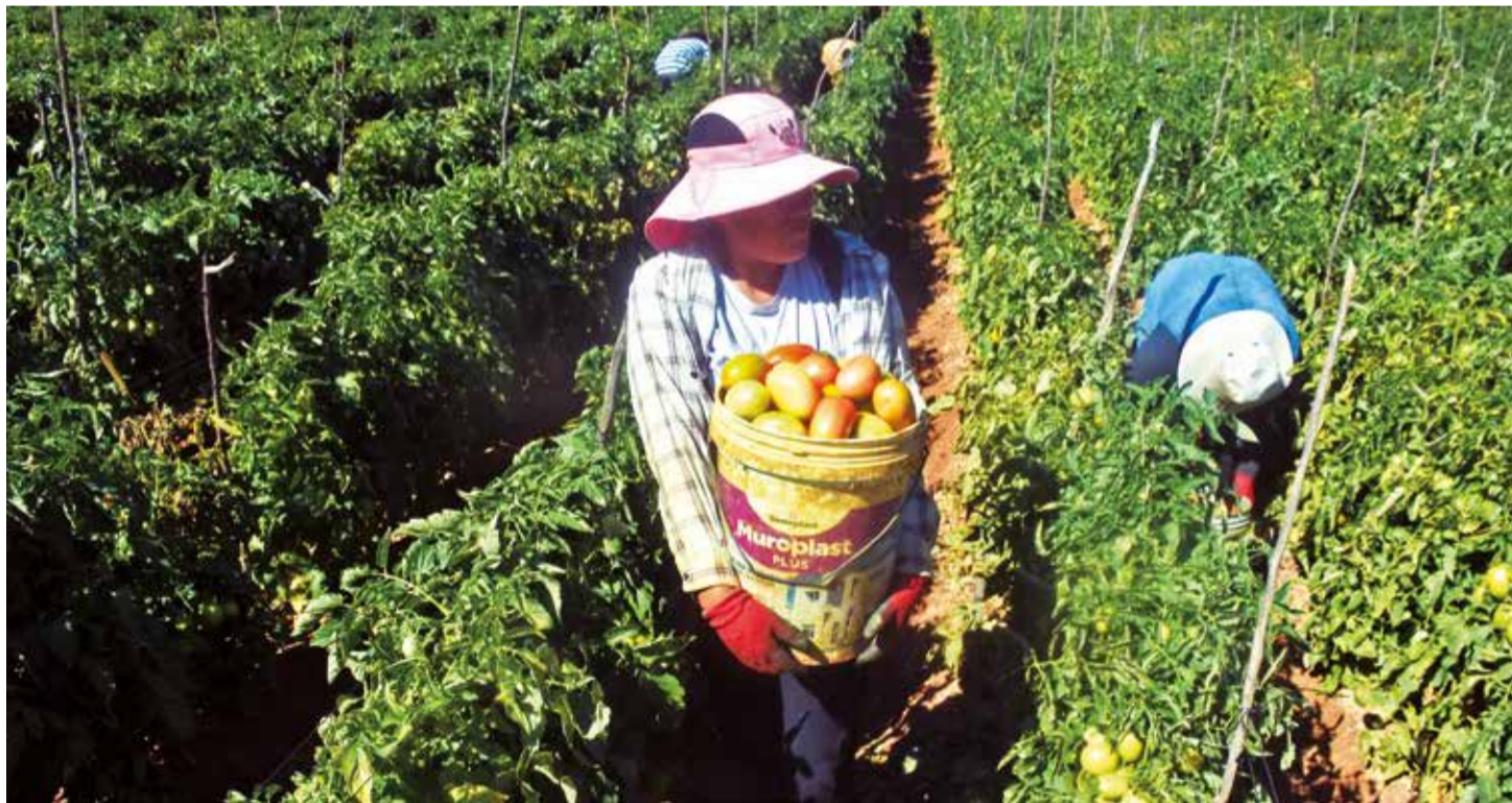
Productores cosechan tomates en cultivos ubicados en campos agrícolas del municipio de Omereque. JOSE ROCHA

Alimento. Este municipio es uno de los principales productores de la baya; los agricultores cuentan las dificultades que enfrentan en su cultivo. Pág. 8