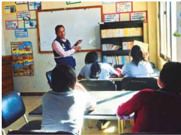
Adolescentes mujeres en el área psicopedagógica.