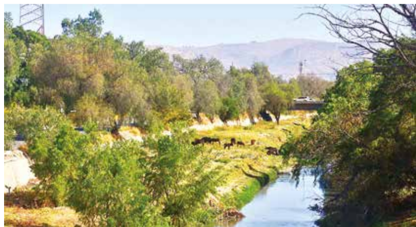
Una hilera de molles en el borde del río Rocha, cerca del aeropuerto.