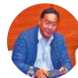
Luis Arce Catacora Presidente del Estado

Yava 14 meses de la fuga de Leyes sin señales de su paradero. Tiene cinco condenas por los casos “mochilas”. Urge que pague por sus delitos.