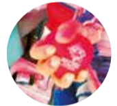
Donantes de Sangre Voluntarios

Muy bien que el presidente empiece a dialogar para frenar los bloqueos. Sin embargo, pudo hacerlo antes y evitar la zozobra en el país.