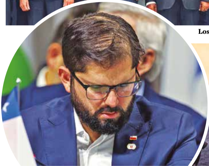
El presidente de Chile, Gabriel Boric.