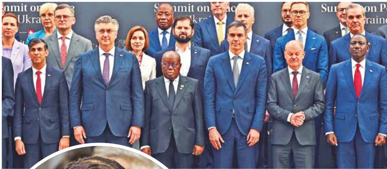
Los líderes presentes en Suiza, en la Cumbre por la Paz.

Diferencia. El presidente de Chile, Gabriel Boric, comparó la situación de Ucrania con la de Gaza y pidió no hacer diferencias cuando se trata de pedir respeto a los derechos humanos.