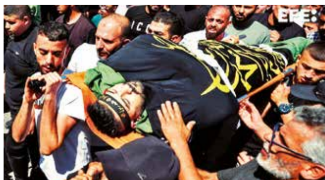
Invasión de soldados israelíes en la franja de Gaza.

“Este enemigo monstruoso no pretende detenerse aquí. Junto al resto del malva-