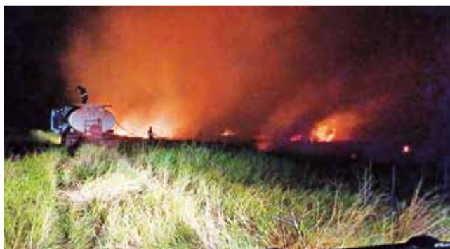
Luchan contra incendio fronterizo. MEDIO AMBIENTE SANTA CRUZ

Fuego. Se identificaron focos de calor en Puerto Quijarro, Bloque Pimiento, Puerto Suárez y Parque Nacional Otuquis.