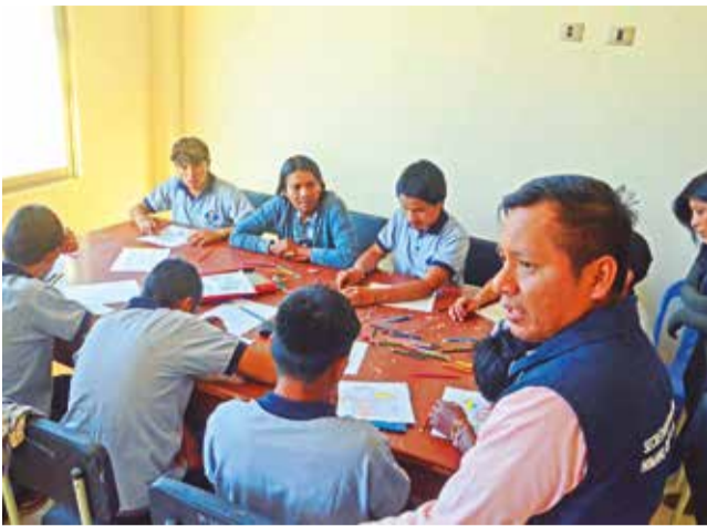
Un grupo de adolescentes varones.