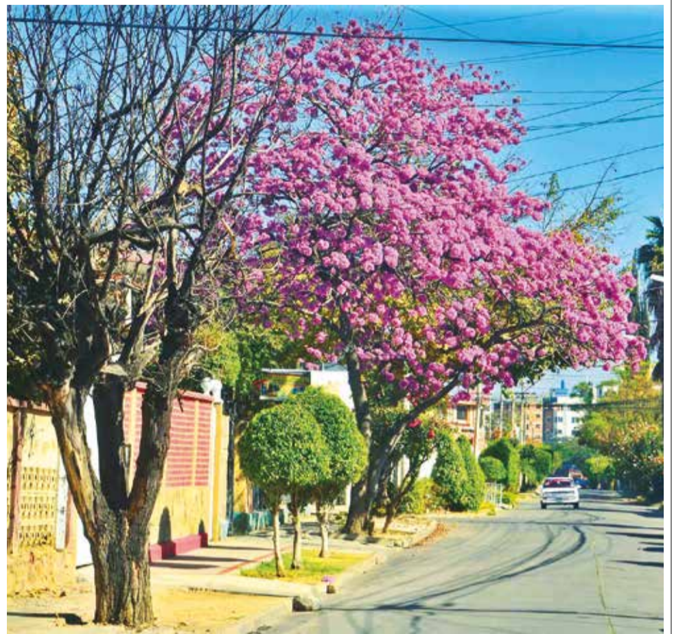
FLORIDO. Desafiando al frío y las inclemencias del invierno, este tajibó luce sus grandes flores en la avenida Perú y pasaje Zoológico.

ENVÍE SU FOTO PARA PUBLICARLA EN ESTA SECCIÓN A: fotografia@lostiempos-bolivia.com