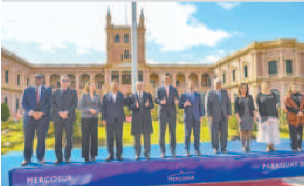
Jefes de Estado de los países del Mercosur reunidos en la LXIV Cumbre, en Paraguay.