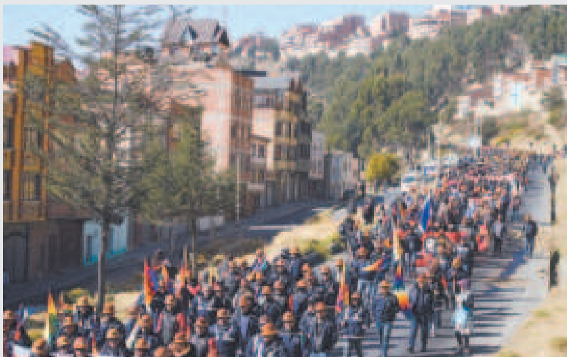
Movilización de mineros en La Paz, durante la marcha por la democracia.

Para Bolivia, un país que vivió unos 40 golpes de Estado y varios intentos de ruptura