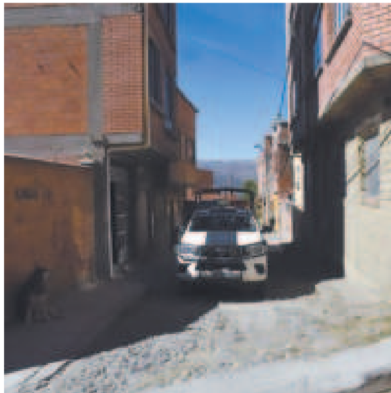
Presencia policial en el lugar de los hechos, en la zona Buenos Aires de La Paz.

AÑOS DE EDAD tenía la víctima cuyo cuerpo fue hallado por un familiar que alertó del hecho a la Policía.