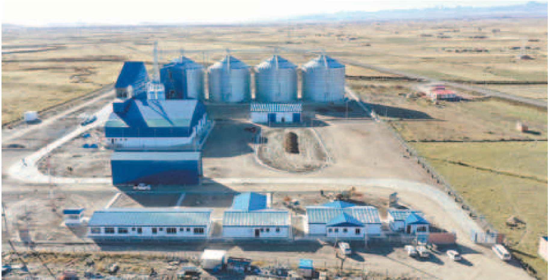
La Planta de Cereales de Emapa es uno de los puntos que se visitarán durante el recorrido de la marcha.