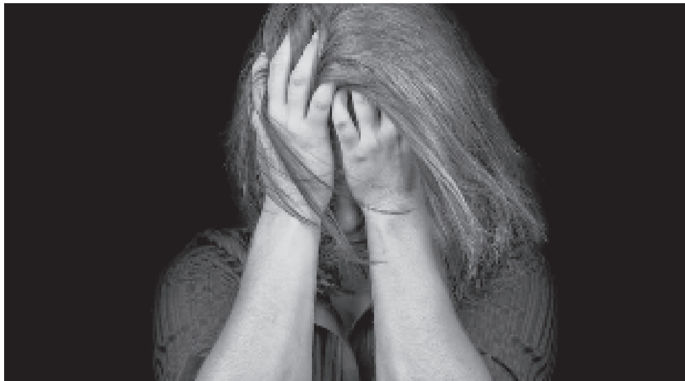
Uno de los delitos más cometidos es la trata y tráfico de personas.