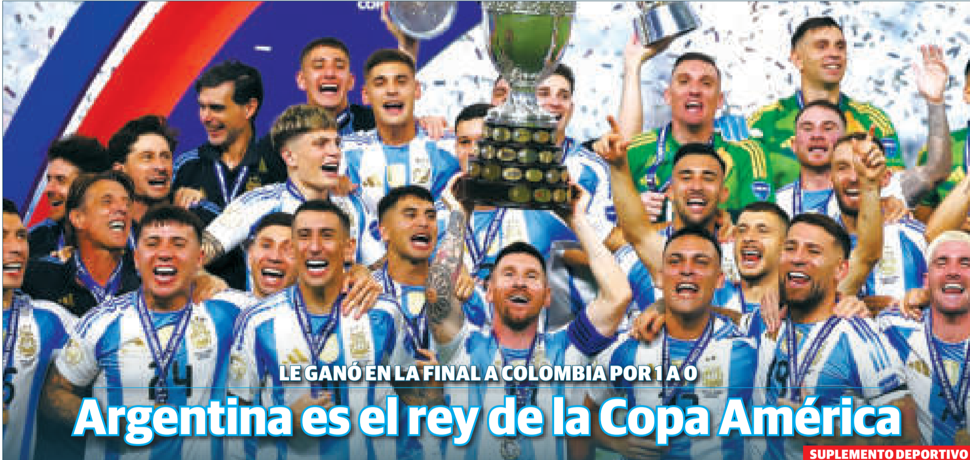
LE GANÓ EN LA FINAL A COLOMBIA POR 1 A 0