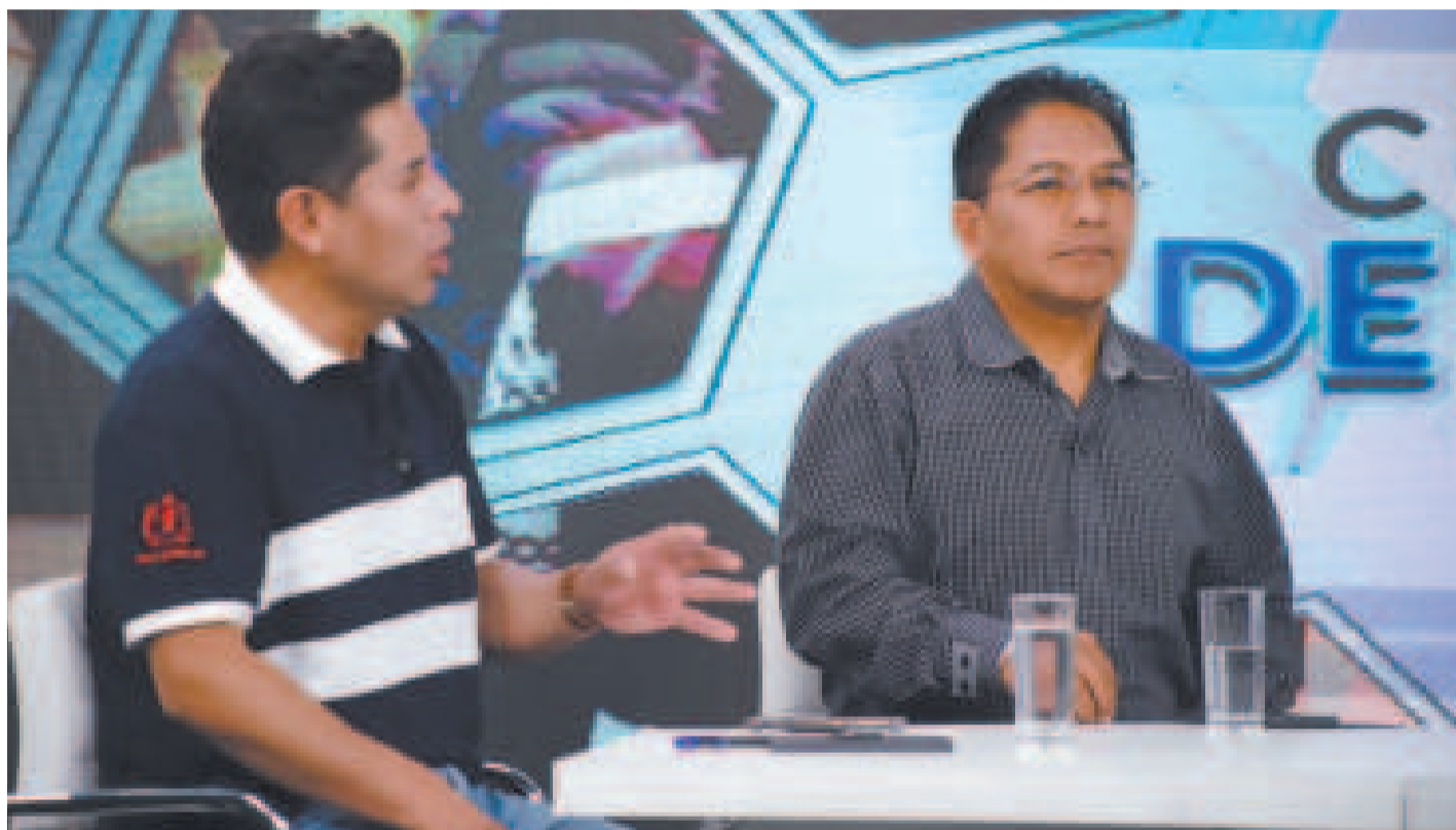
Los viceministros Grover Lacoa y Jorge Silva en el programa dominical 'Los hechos cuentan', de Bolivia TV.

El viceministro Grover Lacoa desmintió que el 70% de la producción de arroz haya sido afectada por la sequía. Aclaró que ésta llegó al 30%.