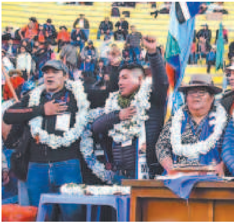
Posesión de la nueva directiva del MAS-IPSP en el congreso en El Alto.