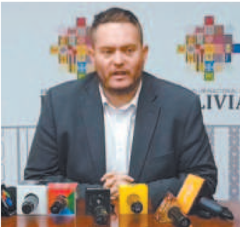
El presidente de Yacimientos Petrolíferos Fiscales Bolivianos (YPFB), Armin Dorgathen.