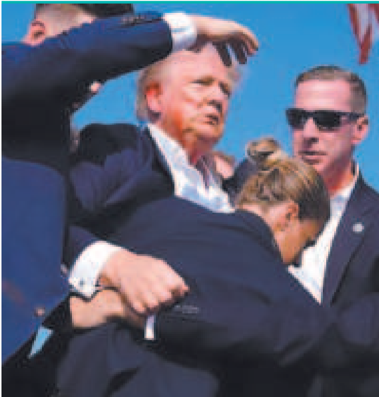
Trump es protegido por su seguridad durante el atentado del sábado.