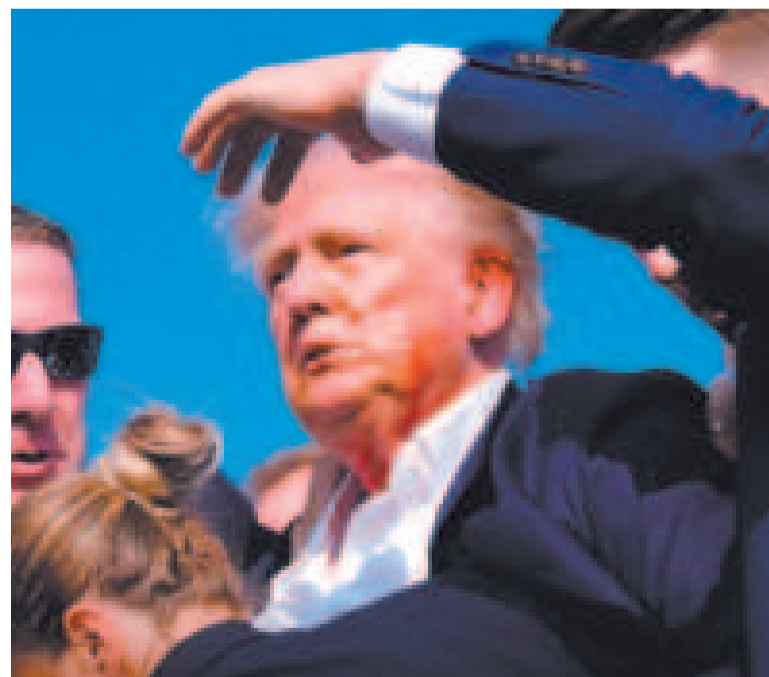
El expresidente estadounidense Donald Trump es evacuado luego del ataque.

“A pesar de nuestras profundas diferencias ideológicas y políticas, la violencia, venga de donde venga, debe ser rechazada siempre por todas y todos”, escribió Arce en redes sociales.