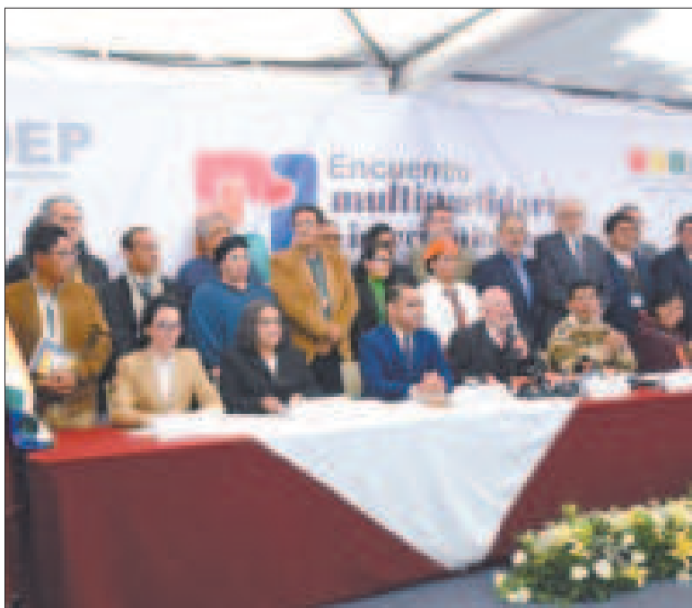
Invitados y vocales en el Encuentro Multipartidario por la Democracia, del TSE.

Según el dirigente campesino, por esta norma es que los vocales del Tribunal Supremo Electoral (TSE) tienen una postura distinta con partidos políticos en relación a las organizaciones, razón por la que demandarán la aprobación de una nueva ley con miras a las elecciones de 2025.