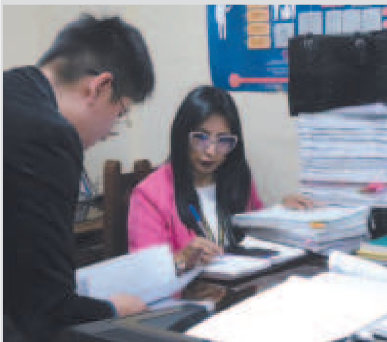
Autoridades del TSJ en la revisión de archivos de casos.