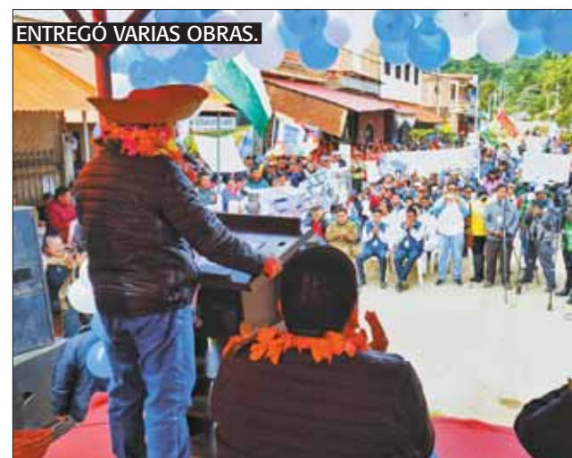
ENTREGÓ VARIAS OBRAS.

Las obras están dentro el plan de la “Marcha al norte” para aprovechar los recursos naturales de esa región.