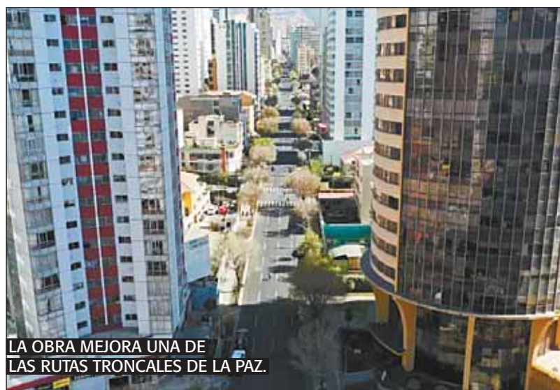
LA OBRA MEJORA UNA DE LAS RUTAS TRONCALES DE LA PAZ.

"Trabajamos en esta avenida principal que une la avenida Del Libertador, la avenida Arce, la avenida Villazón con una longitud de 1.970 metros, casi dos kilómetros", explicó la funcionaria. Además se instalaron basureros y bancas.