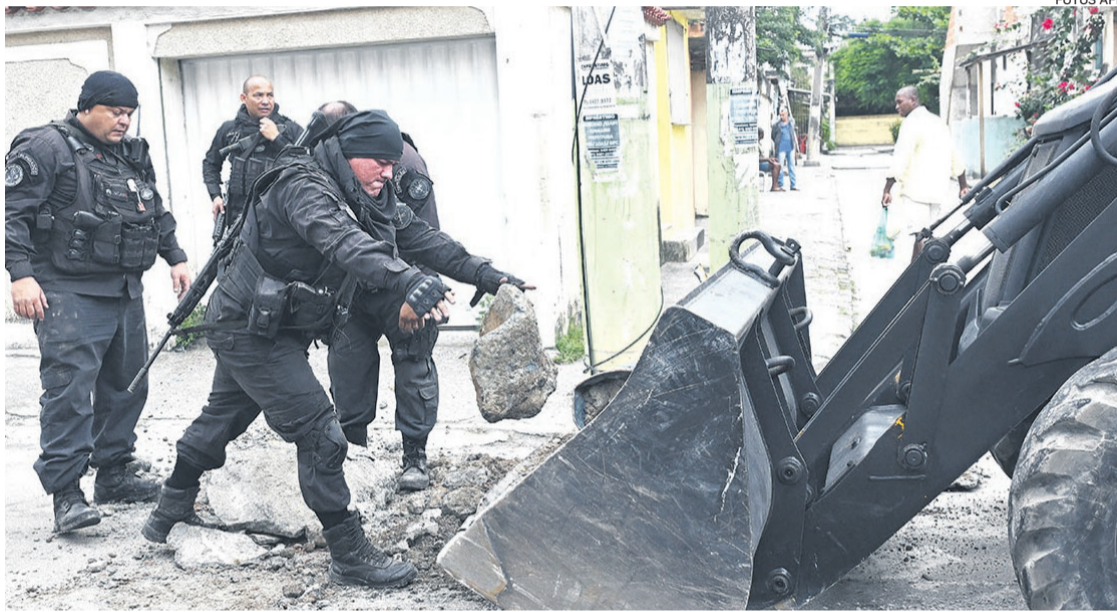
Triopas fuertemente armadas se han dedicado a limpiar de barricadas armadas por los traficantes

El operativo, que no tiene fecha para terminar, busca "acabar con la guerra desatada entre tráfico y milicia en esta parte de la zona oeste de Río", donde la criminalidad registró un "aumento signifi-