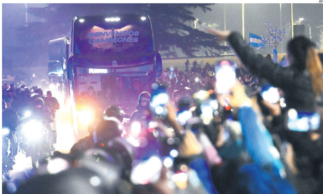
Cómo no celebrar con la selección supercampeona. Los hinchas esperaron en casa a los jugadores para festejar la nueva conquista

“(Di María) Quedate, por favor, si podés, si querés, si lo sentís”, dijo un hincha argentino al canal TyC Sports en medio de los festejos.