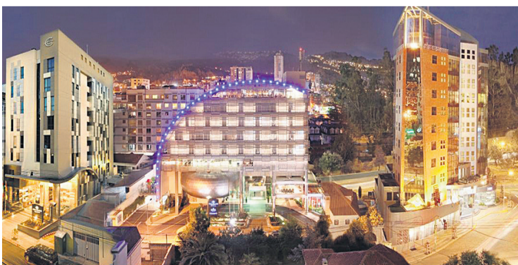
Las tres apuestas hoteleras de Casa Grande en La Paz