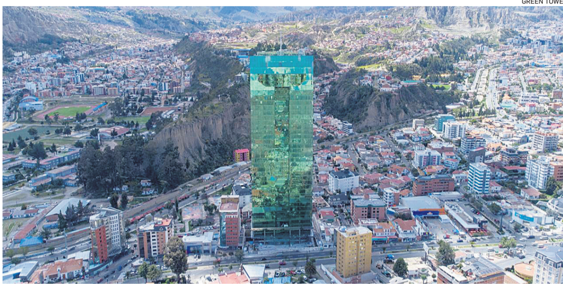
Los 40 pisos del edificio, más los 3.600 metros sobre el nivel del mar lo convierten en el techo del mundo.