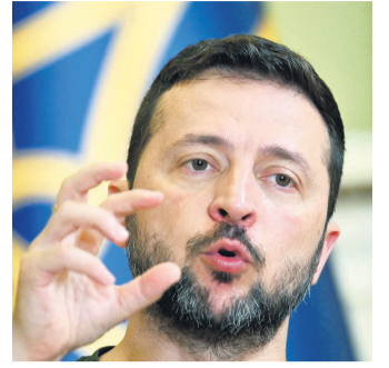
El mandatario ucraniano

armados con fusiles de asalto. Los agentes retiraron algunas barricadas de basura o cemento, colocadas habitualmente por los criminales en las favelas para controlar la circulación. Las primeras horas transcurrieron sin enfrentamientos y la población parecía seguir su vida normalmente