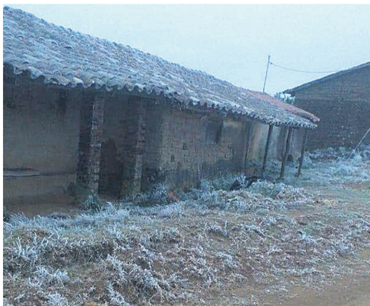
El viernes se registraron heladas y nevadas en los Valles cruceños

El Senamhi pronostica un ascenso en las temperaturas en Santa Cruz de la Sierra, donde la temperatura mínima oscilará entre 13 y 16 grados centígrados hasta el viernes y las máximas estarán entre 23 y 31°C.