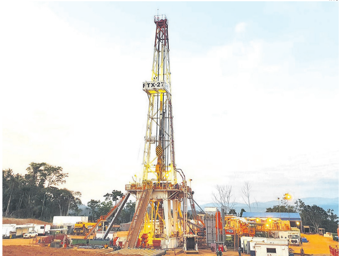
Yacimientos es optimista con el nuevo descubrimiento en la área no tradicional de hidrocarburos

Detalló además que se realizaron las pruebas de producción