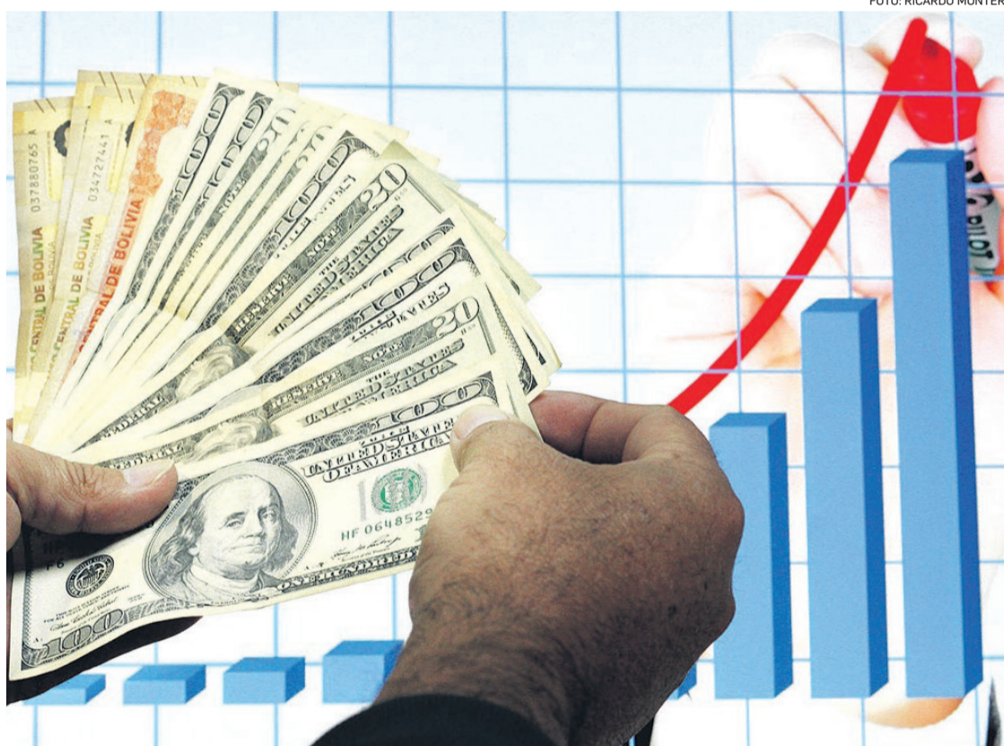
La escasez de dólares se recrudeció durante el primer semestre de este año afectando a varios sectores

Recordó que, desde noviembre de 2011, el tipo de cambio fijo fue una constante, pero una década después la demanda de dólares