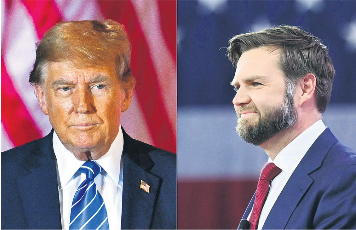
Donald Trump y J.D. Vance fueron anunciados como los candidatos a la presidencia y vicepresidencia por la convención republicana