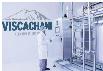
Viscachani es uno de los productos de La Cascada.

La Cascada fue fundada el año 1965 bajo la denominación de "Embotelladora La Cascada Ltda" en Pura Pura La Paz, Más tarde pasó a llamarse "La Cascada S.A." en el Altiplano del País. Este emprendimiento de irradió a todo el país.