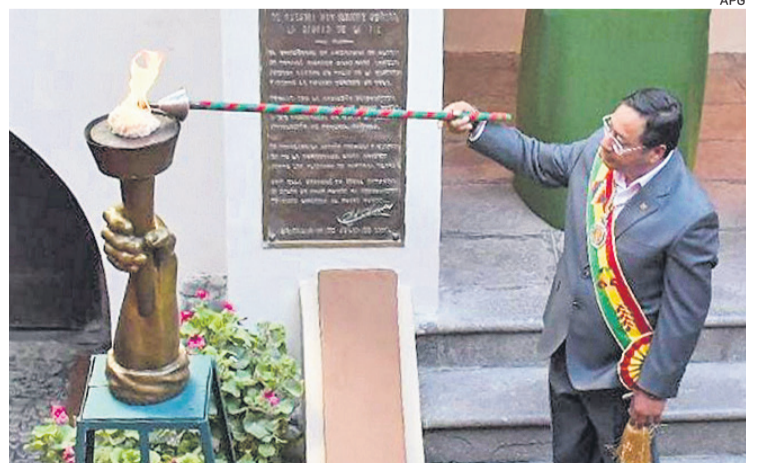
El presidente Luis Arce enciende la Tea de la Libertad. Fue ayer.