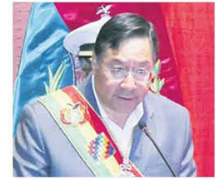
Arce en un acto cívico paceño

a la escasez de dólares para importar bienes de capital. Los empresarios piden medidas para mejorar la economía. A8