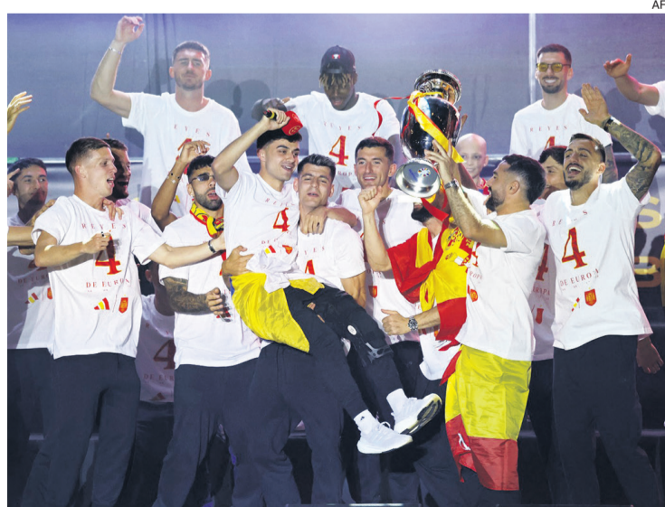
Madrid vibró recibiendo a los campeones de Europa. España festejó la nueva corona

Morata ejerció de maestro de ceremonia presentando con bromas y elogios uno a uno a sus compañeros, pidiendo el Balón de Oro para Rodri, el centrocampista del Manchester City, y lanzó un dardo a los ingleses al reclamar que “¡Gibraltar es español!”, dijo, sobre el enclave británico del sur de la península ibérica.