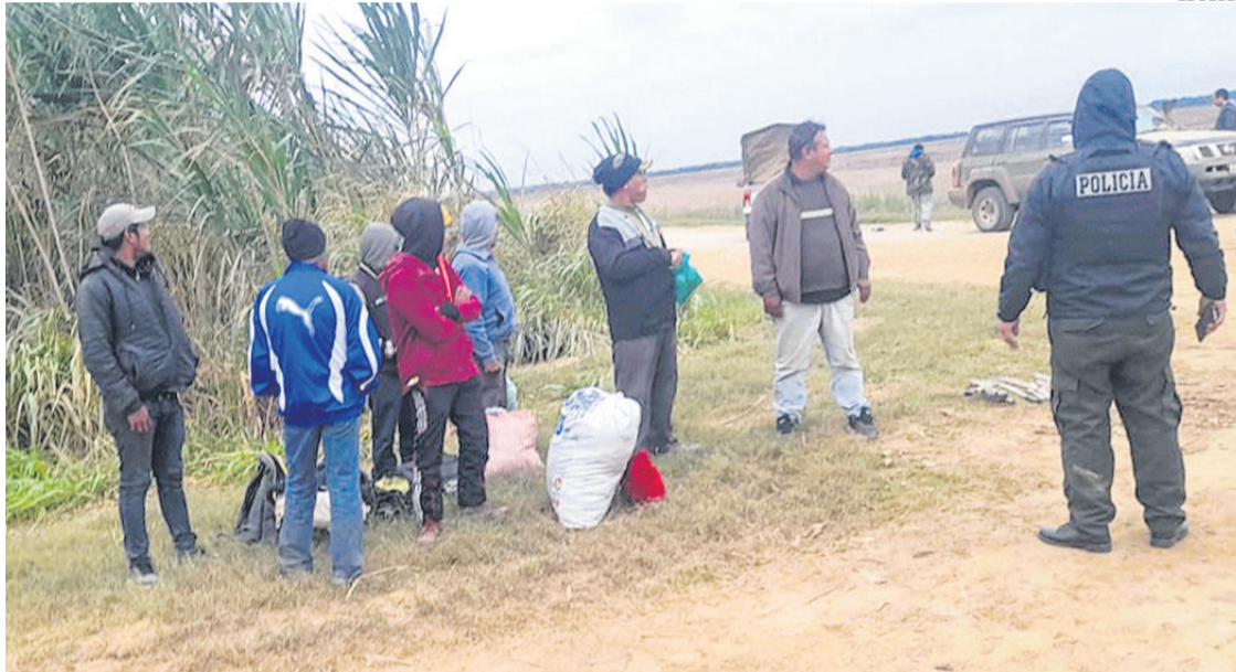
Momentos del operativo policial en los predios del norte intergado donde se movilizó la Policía y Fiscalía

Sin embargo, el representante del Ministerio Público aseguró