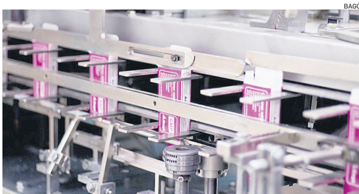
Bagó fabrica productos farmacéuticos y los exporta a Paraguay.