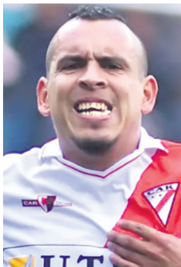
Ovejero es una de las alternativas en la ofensiva de Always Ready, el jueves

Los millonarios empataron (1-1) en casa el viernes con Real Tomayapo, en el reinicio del torneo Clausura 2024 y después de enfrentarse a Liga de Quito tendrán que medirse con Bolívar por la sexta fecha del torneo doméstico, ese partido se jugará el domingo en el estadio Hernando Siles.