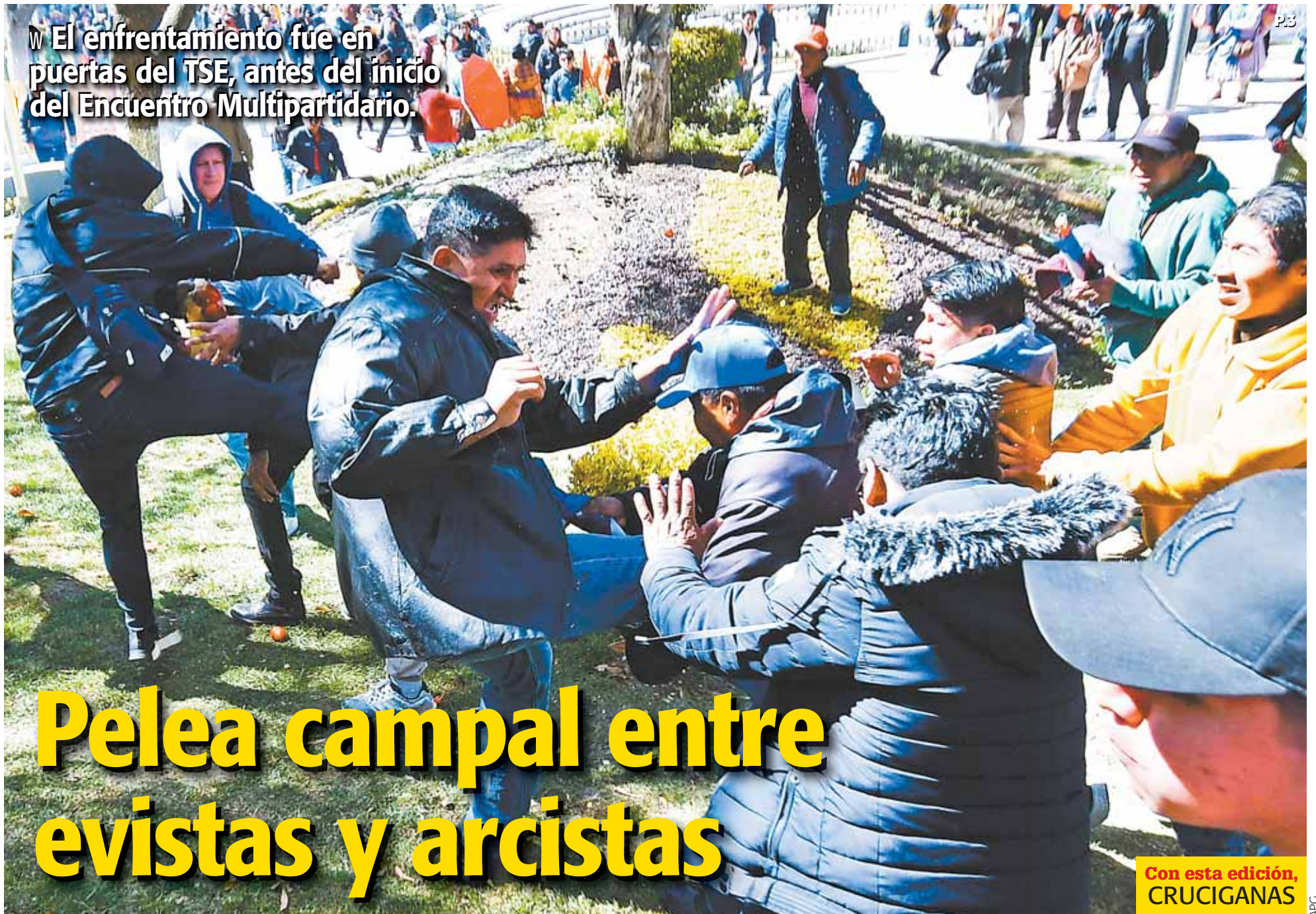
El enfrentamiento fue en puertas del TSE, antes del inicio del Encuentro Multipartidario.