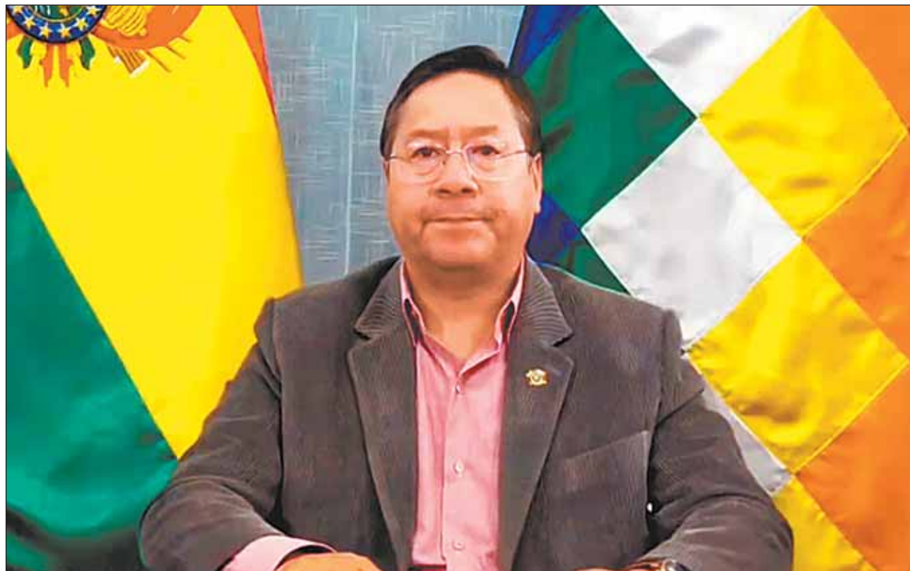
CAPTURA DE VIDEO

Mensaje. Lo sucedido fue denunciado por el gobierno de Arce como un “intento fallido de golpe de Estado”