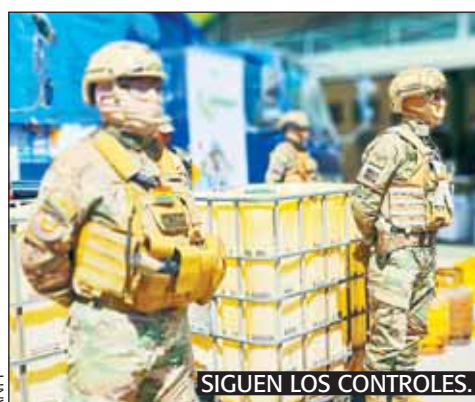
SIGUIEN LOS CONTROLES.