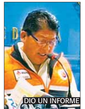
DIO UN INFORME

El Sistema de Información y Monitoreo de Bosques reportó que, de los 1.195, en Beni están 940; seguido de Santa Cruz, 187; La Paz, 24; Potosí, 20; Pando, 10; Cochabamba, 5; Chuquisaca, 5; Oruro, 3; y Tarija, 1.