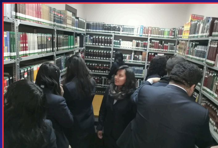
“CONOCIENDO EL AREA DE COLECCIÓN DE REFERENCIA”

Exploraron una amplia gama de obras clásicas y contemporáneas de autores bolivianos e internacionales, y la historia, con textos que abarcan desde la antigüedad hasta la era moderna, proporcionando una visión completa de la evolución de la humanidad.