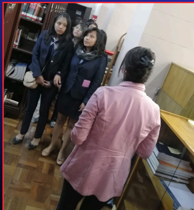
“BIENVENIDA A LOS ESTUDIANTES”

Luego de la bienvenida, los estudiantes fueron divididos en pequeños grupos para facilitar el recorrido y asegurar una experiencia más personalizada.