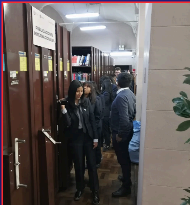
“RECORRIDO POR ESTANTERIAS MOVILES”

El recorrido comenzó con una cálida bienvenida a los estudiantes por parte del equipo de la Biblioteca. Los funcionarios recibieron a los jóvenes y a sus dos profesoras encargadas con amabilidad y entusiasmo, creando un ambiente acogedor y motivador desde el primer momento.