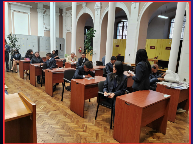
“PREPARÁNDOS PARA EL DEBATE”

Después de la actividad interactiva, se les recordó a los estudiantes que la biblioteca está abierta para ellos como un recurso valioso en su búsqueda de información.