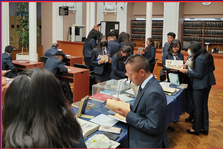
“ESTUDIANTES INTERESADOS EN LA HISTORIA”

Esta interacción directa con los bibliotecarios permitió a los estudiantes profundizar su comprensión sobre los temas discutidos durante la visita y les brindó la confianza para continuar explorando y aprendiendo por su cuenta.