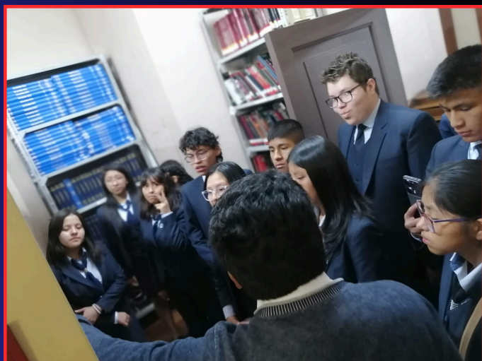
“EXPLICACIÓN DETALLADA DE LA ORGANIZACIÓN BIBLIOGRAFICA”

Los estudiantes exploraron las colecciones de libros especializados, abarcando temas como la economía, historia, literatura, y las ciencias sociales, también conocieron el área de Hemeroteca, donde se conservan revistas, periódicos, gacetas, y otros documentos periodísticos históricos y actuales, este recorrido fue como un viaje mágico que les permitió tener un encuentro con el pasado y el presente de la prensa boliviana.