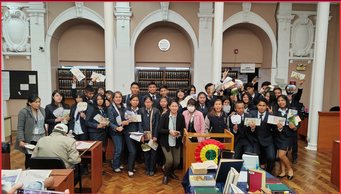
“FOTOGRAFÍA CON LOS ESTUDIANTES”

La Biblioteca Casto Rojas del Banco Central de Bolivia, organizó una visita guiada para 77 estudiantes de la promoción del “Colegio Fuerzas Armadas de la Nación” de La ciudad de La Paz, quienes estuvieron acompañados por dos profesoras. Esta actividad, fue realizada el día miércoles 5 de junio, de la presente gestión, fue un evento importante en el calendario cultural, destacándose como una oportunidad para que la juventud, descubriera la riqueza bibliográfica de la biblioteca.