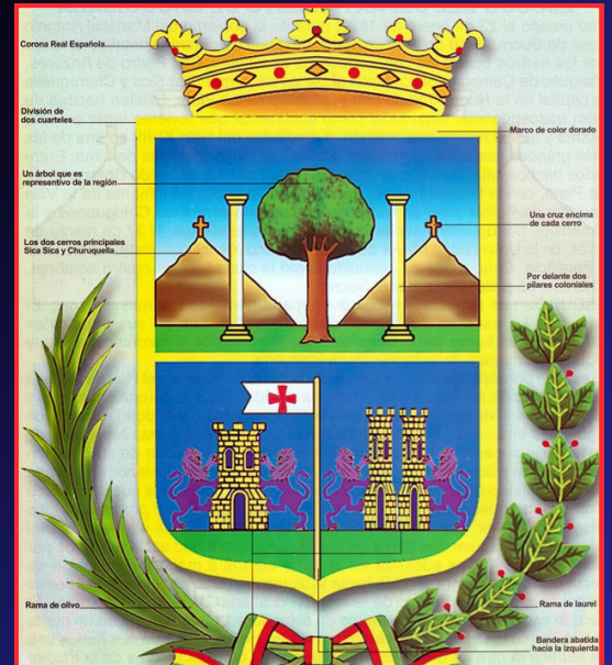
ESCUDO DE ARMAS DEL DEPARTAMENTO DE CHUQUISACA

La campaña de emancipación duró 15 años, alcanzando su objetivo el 6 de agosto de 1825 y como reconocimiento por su papel en la independencia de los pueblos de América, Sucre vuelve a hacer historia, cobijando en la Casa de la Libertad, antes Sala Mayor o Aula Magna de la Universidad Pontificia de “San Francisco Xavier”, la firma del Acta de la Independencia, llevando el nombre de Bolivia en honor al libertador Simón Bolívar.