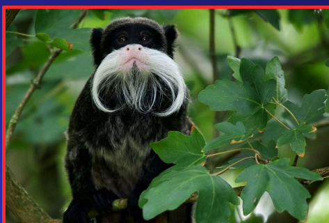
TITÍ EMPERADOR (SAGUINUS IMPERATOR) - FAUNA BOLIVIANA.

Esto con el fin de promover actividades de conservación y educación a nivel global.