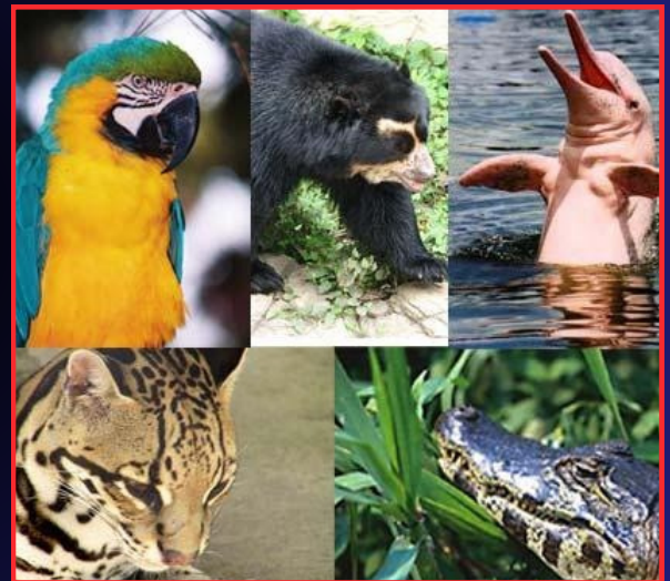
ESPECIES SILVESTRES EN EL PARQUE NACIONAL MADIDI (BOLIVIA).

En el año 2018, la Sociedad para la Conservación de la Vida Silvestre (WCS, por sus siglas en inglés), presentó los resultados de la expedición "Identidad Madidi" en el Parque Nacional Madidi, ubicado en Bolivia. Este estudio posicionó a Madidi como el parque con mayor biodiversidad del mundo, al albergar más de 8,000 especies de flora y fauna.