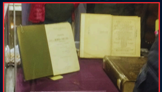
LIBROS HISTÓRICOS QUE ALBERGA LA BIBLIOTECA “CASTO ROJAS” DEL BCB