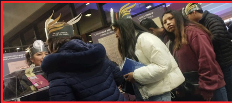
“ENTRE LOS VISITANTES SE CONTÓ CON LA PARTICIPACIÓN DE JÓVENES, NIÑOS Y ADULTOS”

Cada libro expuesto contó con información detallada sobre su contexto histórico, autoría y relevancia, permitiendo a los visitantes comprender mejor la exposición patrimonial bibliográfica.