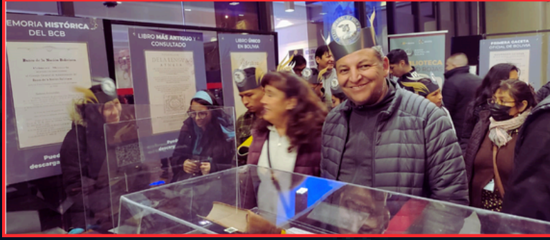
“LOS VISITANTES DISFRUTARON LA EXPOSICIÓN”

El interés por la exposición de material bibliográfico fue evidente, ya que los visitantes se congregaron alrededor de las exhibiciones que mostraban las colecciones patrimoniales.