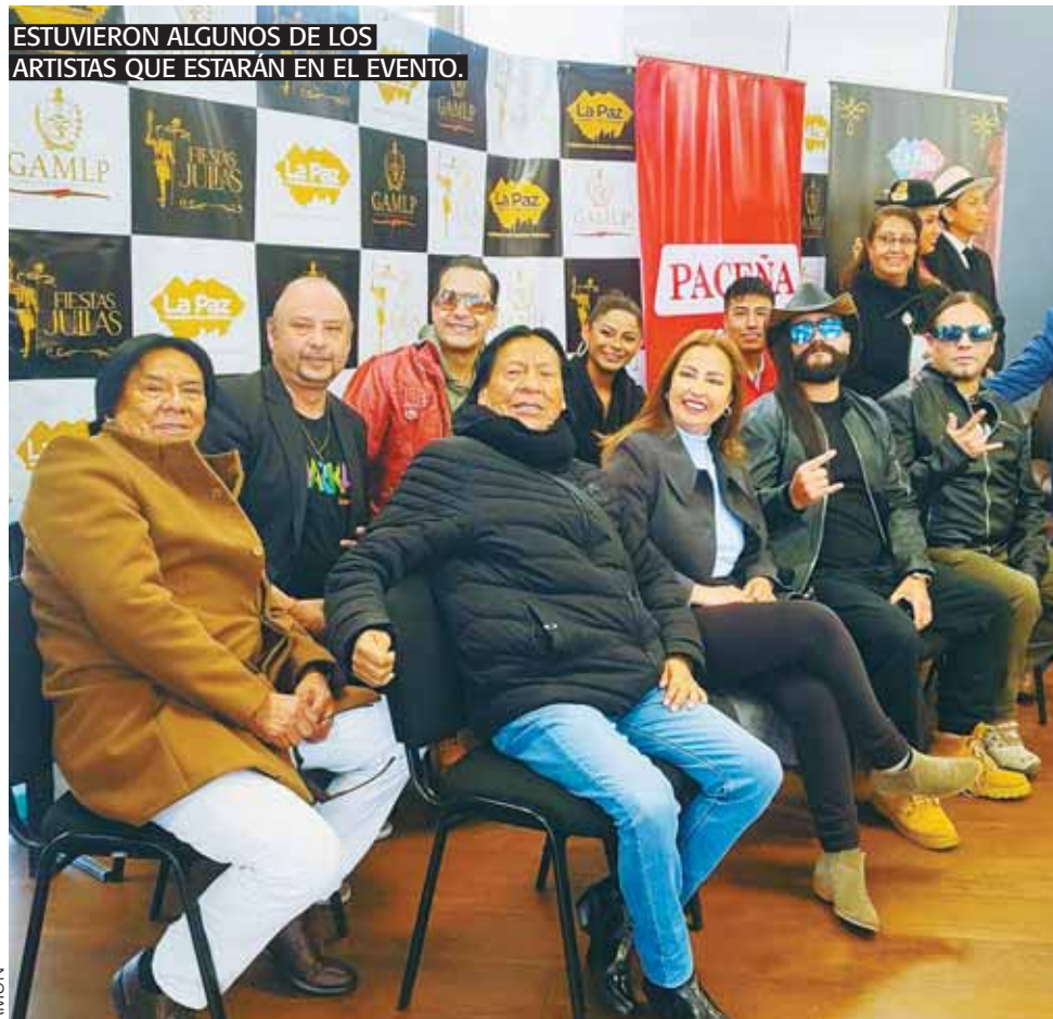
ESTUVIERON ALGUNOS DE LOS ARTISTAS QUE ESTARÁN EN EL EVENTO.

Celebración. La actividad se traslada al Parque Urbano Central y se realizará el 15 de julio desde las 13.00