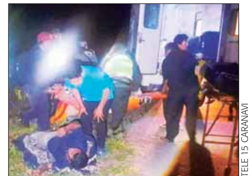
TELE 15 CARANAVI

vehículo, se conoció que el chofer perdió el control en una curva, porque el motorizado presentó fallas mecánicas. Una situación que será investigado por la Policía para determinar responsabilidades sobre este hecho: no se pudo lamentar el fallecimiento de ninguna persona. El hecho fue reportado por las personas que transitaban por el lugar del accidente.