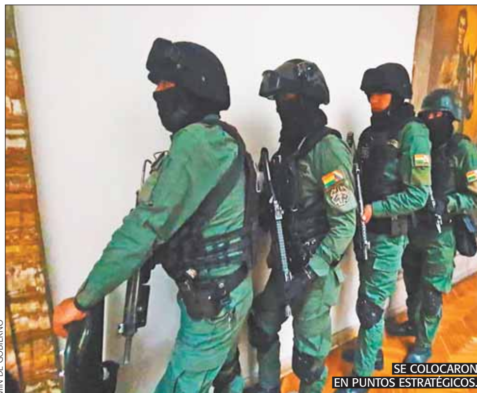
SE COLOCARON EN PUNTOS ESTRATÉGICOS.

Asimismo, entre el 14 de abril y el 18 de mayo se impartieron cursos especializados de doctrina en las Fuerzas Armadas, entre ellos el Curso de Operaciones Urbanas, para dar el golpe del miércoles 26.