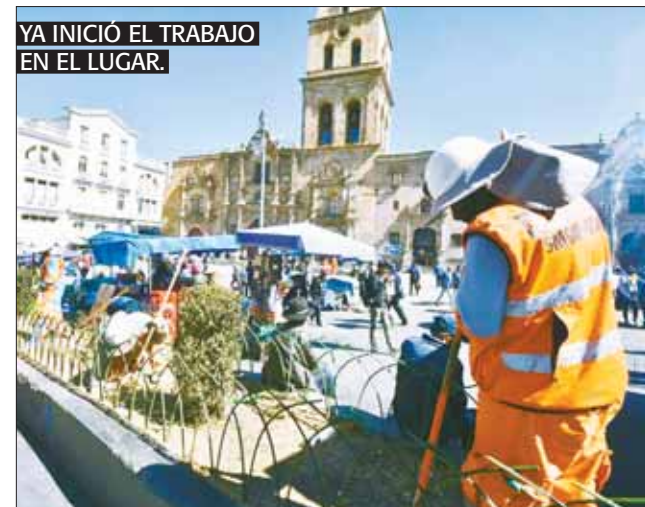
YA INICIÓ EL TRABAJO EN EL LUGAR.

Desde el lunes, en la plaza San Francisco se aplica una serie de restricciones.