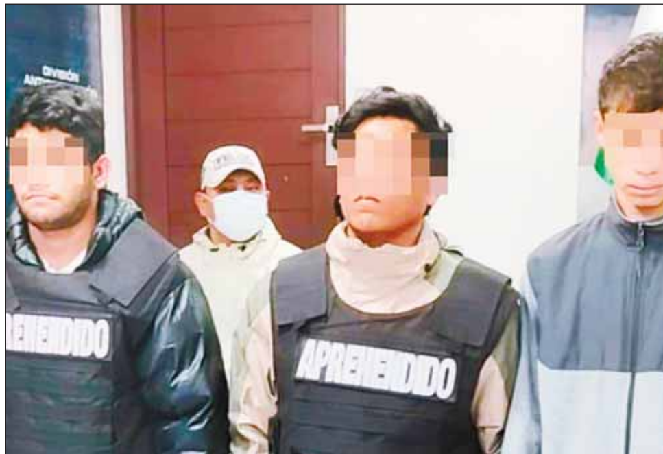
MINISTERIO DE GOBIERNO

Caso. Otras 11 personas tienen detención preventiva, quienes también son investigados