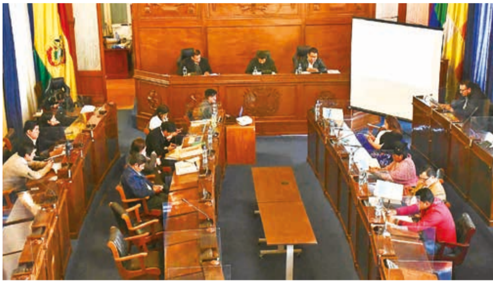
Los integrantes de la Comisión de Constitución de la Asamblea Legislativa, ayer.