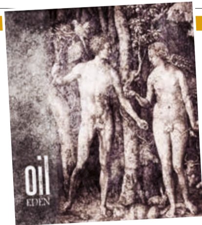
Portada. Diseño de Pablo Rico. CORTESÍA

“Estamos muy felices de la respuesta que ha tenido no sólo como canción, sino también por la estética, por la lírica y el video que también ha sido dirigido por el productor de esta canción, Sung Yoon Jang”. Según el cantante, los co-