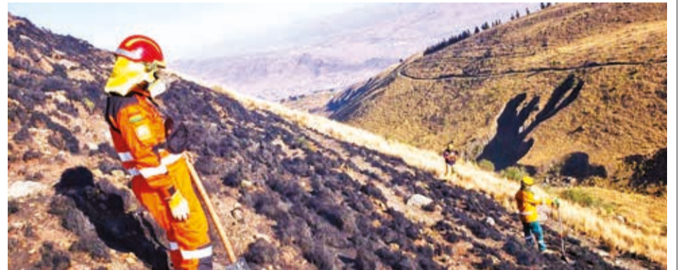
Uno de los últimos incendios ocurridos en el Parque Tunari. SAR

El objetivo es evitar el agio y la especulación de los productos de la canasta familiar, además, de luchar contra el contrabando en el municipio.