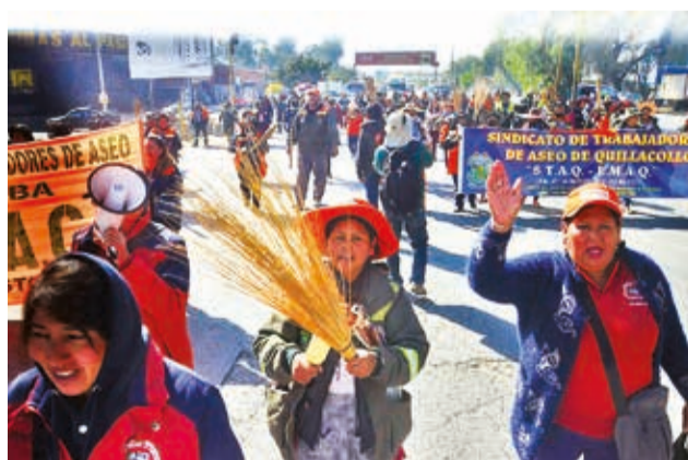
La marcha de los trabajadores de EMAQ, ayer. DANIEL JAMES

transporte público y particular, que tuvo que buscar desvíos. En tanto, los pasajeros realizaron transbordos.