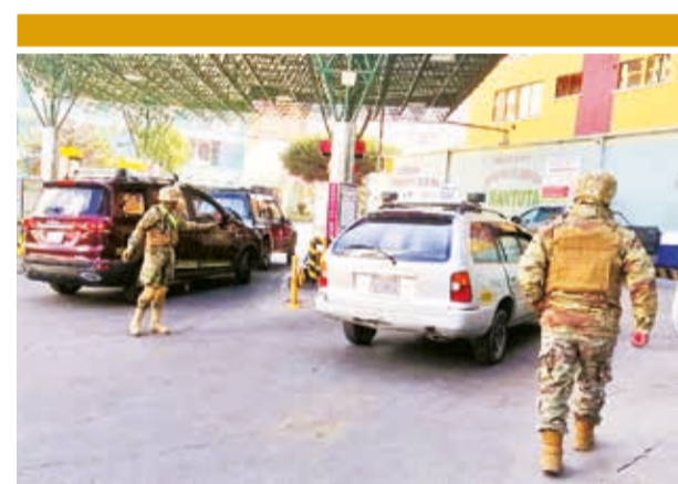
Una estación de servicios con militares en La Paz. JH

Arce tiene programados dos reuniones con transportistas: una el sábado por la tarde con el sector cooperativista y otra el domingo por la mañana con miembros de la Cámara Boliviana de Transporte, señaló Montaña.