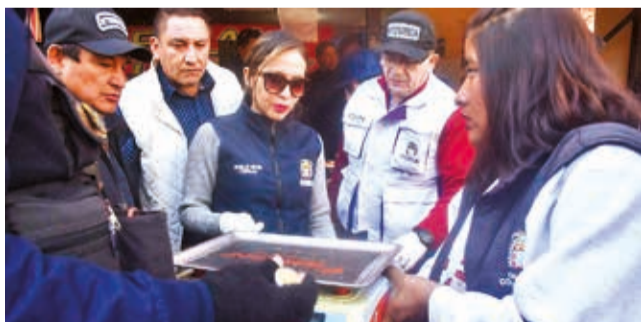
El decomiso de balanzas alteradas en la calle Lanza. J. ROCHA

Operativos. La Intendencia aseguró que los controles continuarán para evitar el incremento exagerado de los precios