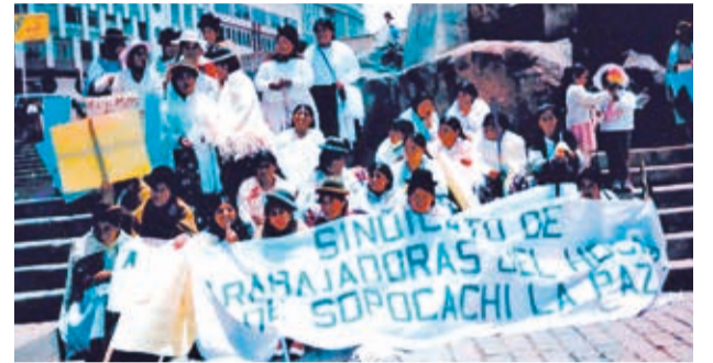
Archivo. Imágenes de las manifestaciones ocurridas en los años 70 y 80 que son parte del documental. AHORA EL PUEBLO