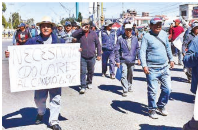
Protestas de los transportistas, la pasada semana.

Postura. Los dirigentes del sector movilizado señalaron que hasta ayer no recibieron una invitación formal