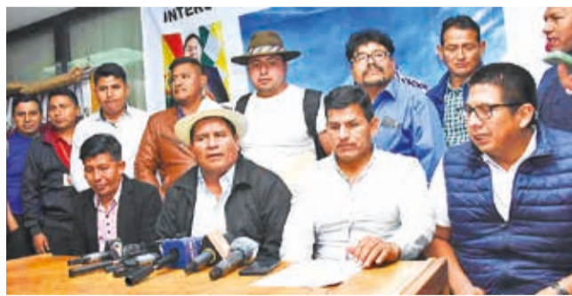
Integrantes de Comunidades Interculturales, ayer.

Amenazas. Las dos organizaciones sociales afines al presidente Luis Arce advirtieron con asumir medidas de presión