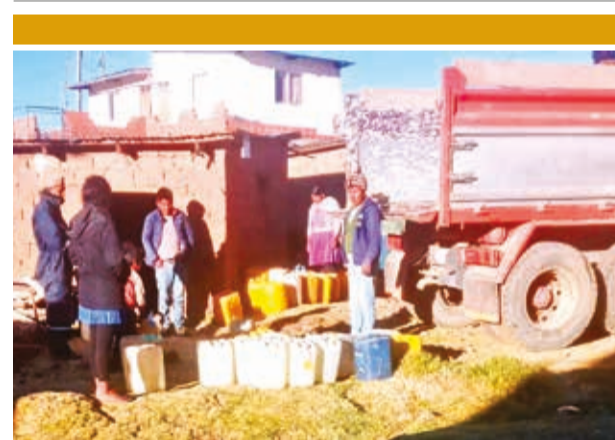
Pobladores esperan recibir agua en bidones.

El director de Desarrollo Productivo, Oscar Velarde señaló que este sábado y domingo de 9:00 a 15:00 se llevará adelante una interacción con el sector que produce artículos para las mascotas.