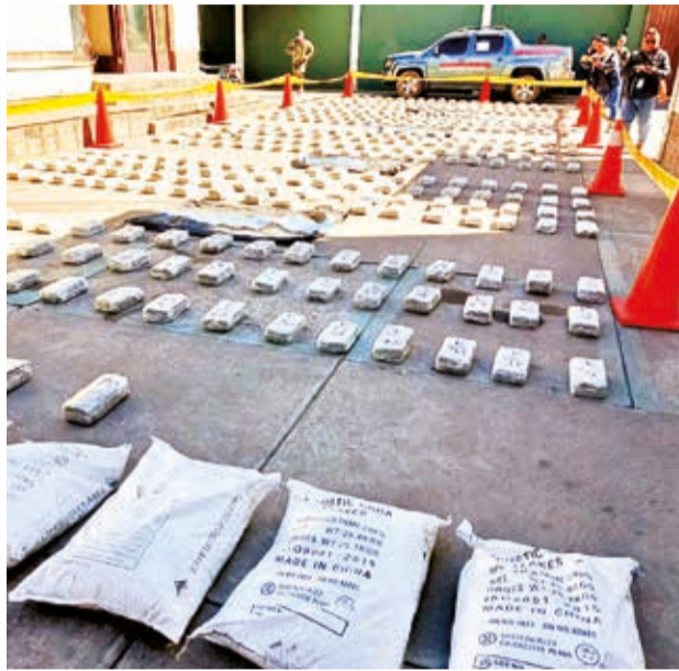
La marihuana y cocaína secuestradas ayer, expuesta en la Felcn. PEDRO FIGUEROA

“Cada bolsa contenía entre 70 y 80 paquetes de marihuana envueltos con cinta masking; en el asiento de atrás había siete paquetes más de marihuana. En total, se logró