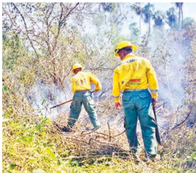
Bomberos sofocan incendios en fronteras.

Reportes extraoficiales dieron cuenta sobre el presunto ingreso de fuego por el lado brasileño al Triángulo Dionisio Foianini, punto geográfico entre el límite territorial entre Bolivia, Brasil y Paraguay.