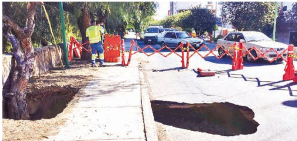
El hundimiento en la av. Uyuni casi Potosí por la falla en una tubería. DANIEL JA,ES

MULTIMEDIA: Escanee este QR para ver el informe de Semapa. www.lostiempos.com