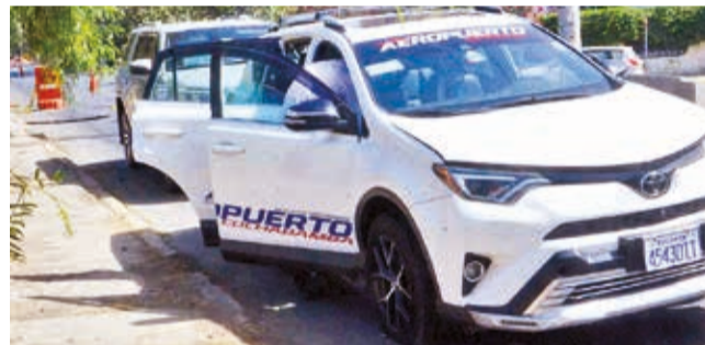
El taxi que se accidentó en el sitio del hueco.

La falla en la línea de impulsión dejó sin el suministro