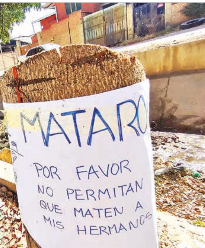
Letreros que colocaron los vecinos para proteger a los árboles del canal de Tiquipaya.

Acciones. Los vecinos colocaron letreros para proteger los ejemplares que se salvaron de ser derribados y listones negros en los troncos