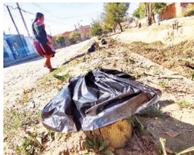
Listones negros en los troncos de los árboles.