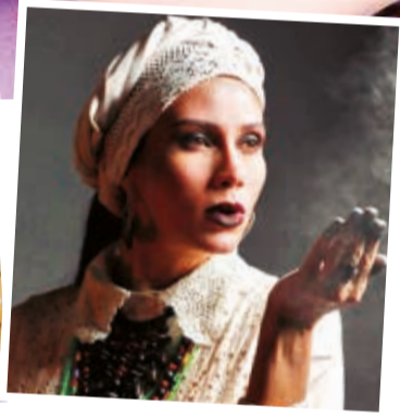
Fotogramas. Escenas de las películas que se estrenan en salas.

“Intensamente 2” se siente como una terapia emocional para todos los presentes en la sala.