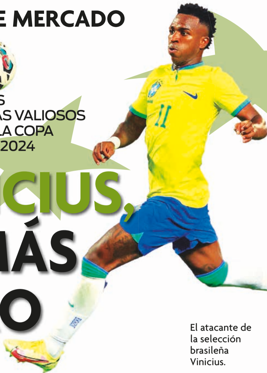
El atacante de la selección brasileña Vinicius.