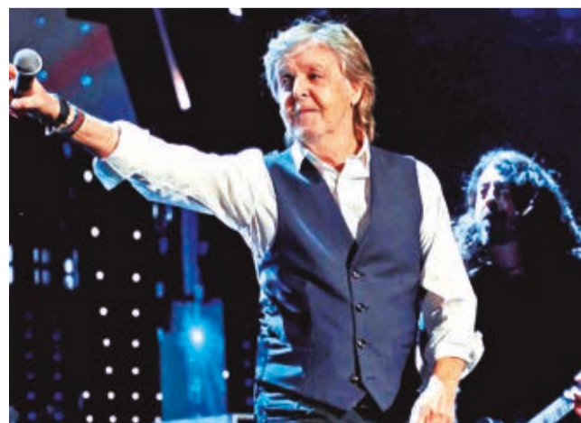
Artista. Paul McCartney.