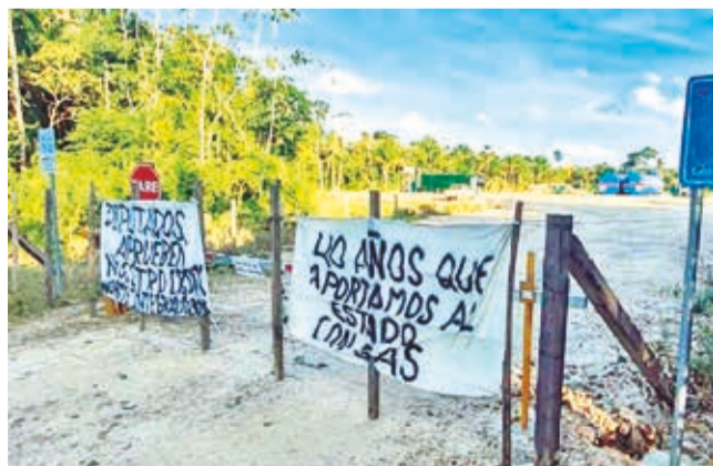
El ingreso al pozo petrolero Yara X2. UN ITEL

Comunicado. YPFB advierte sobre las consecuencias económicas y potenciales dificultades en la producción de combustibles