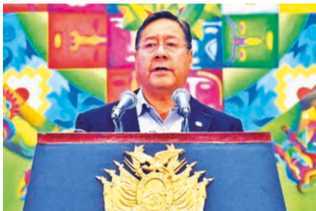
El presidente Luis Arce en rueda de prensa, ayer.

También habló de reforzar el control de las fronteras con más personal militar para evitar la salida de alimentos, principalmente a Argentina y Brasil. Asimismo, los militares cooperarán en los controles en las estaciones de servicio para que los com-