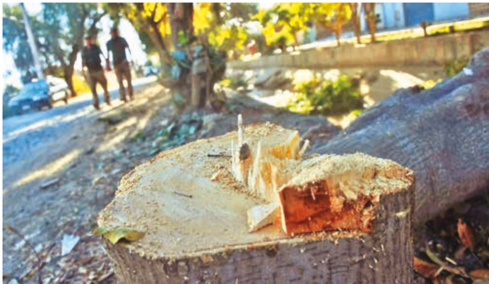
El tronco de uno de los árboles talados en el canal de Linde, en Tiquipaya.