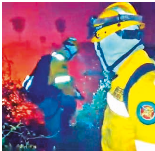
Incendio en poblados fronterizos con Brasil. GOBERNACION SCZ

Asimismo, se informó que, de manera coordinada con otras instituciones, se están aplicando estrategias de con-