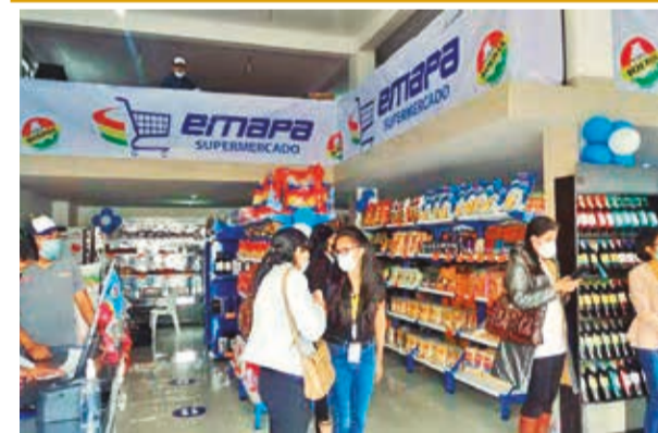
Un supermercado de la estatal Emapa.

Un trabajador del pozo Yará X-2 confirmó que las válvulas habían sido cerradas y que el equipo estaba en “stand by”, a la espera de instrucciones de la gerencia. Este acto de protesta no sólo tiene implicaciones locales, sino que también podría afectar el suministro energético a nivel nacional.