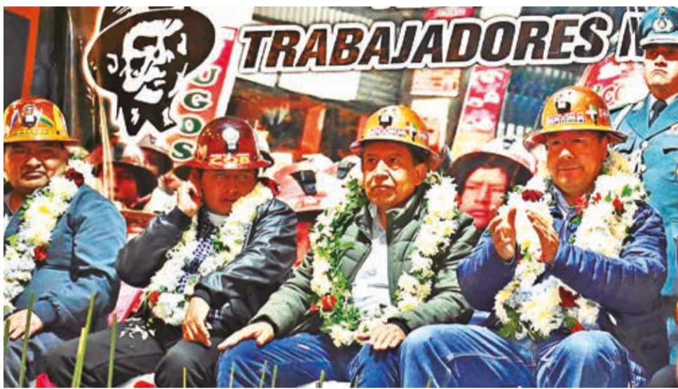
El presidente Luis Arce y el vicepresidente David Choquehuanca, ayer en La Paz.

El vicepresidente David Choquehuanca calificó de intento de golpe de Estado la sesión de la Asamblea Legislativa que convocó Andrónico Rodríguez para aprobar un paquete de leyes donde están las normas antiprórroga de magistrados. “En estos días hemos visto cómo han vulnerado la institucionalidad democrática, un intento de golpe, fabricando una situación no regulada en la Constitución Política del Estado, pero no nos vamos a detener ahí. El gran desafío de todos es encontrar una salida”, dijo Choquehuanca.