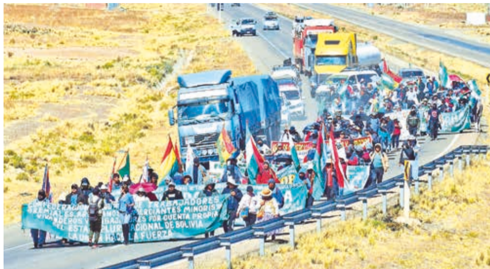
Gremiales marchan desde Patacamaya rumbo a la ciudad de La Paz.