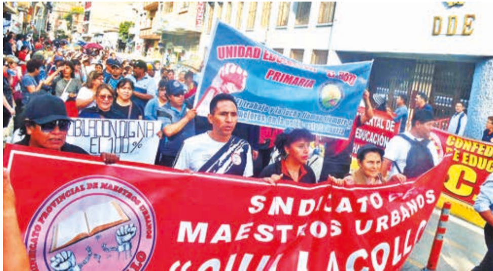
Maestros de Cochabamba durante una marcha de protesta en 2024.