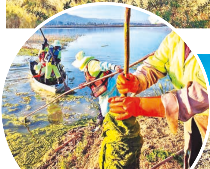
La extracción de algas en la laguna.