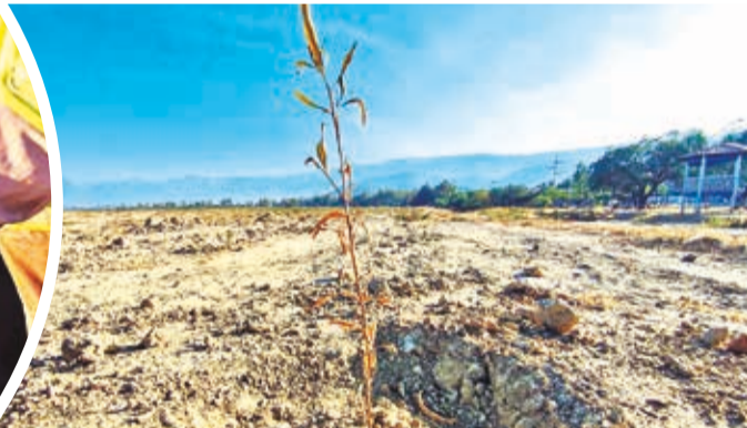
Uno de los plantines secos en el sur de Alalay.