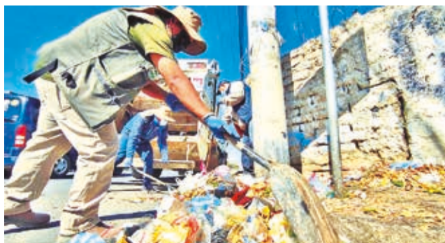
Funcionarios municipales limpian Quillacollo. DANIEL JAMES

Los trabajadores municipales de diferentes reparticiones salieron de sus oficinas