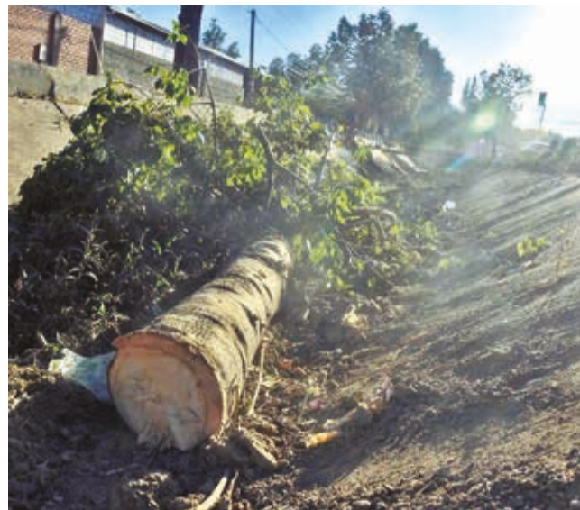
Una de las plantas derribadas por los regantes.