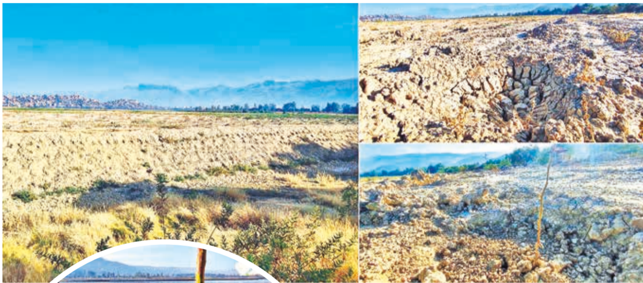
El lado sur de Alalay, seco, con hoyos vacíos y con plantines sin riego.

Plazos. Con una orden de cambio, la empresa obtuvo una ampliación para la conclusión de obras hasta el 8 de junio de 2024, pero la Alcaldía observó la reforestación y dio 180 días para garantizar el prendimiento