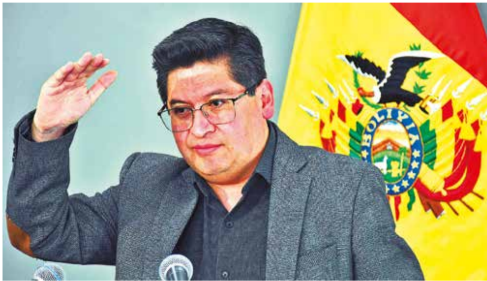
El ministro de Economía, Marcelo Montenegro, en rueda de prensa, ayer.

“Jamás han privilegiado la inversión ni a la mayoría de la gente. Este modelo ha sido diseñado solamente para unos pocos, para los que gobiernan y sus amigos; pero el 95 por ciento de la gente ha quedado totalmente descuidada, por eso no hay empleo”, expresó el analista.