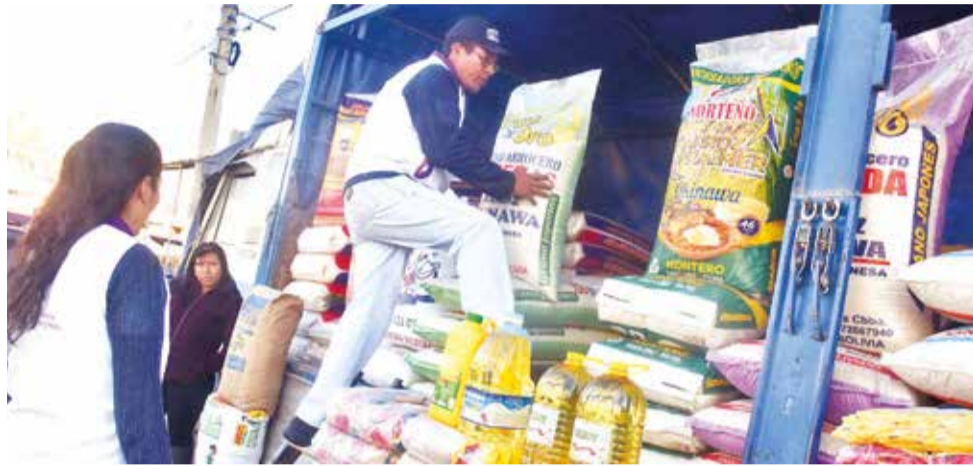
La Intendencia verifica el peso de los abarrotes en el mercado Campesino.

Ante esta situación, el intendente mencionó que se