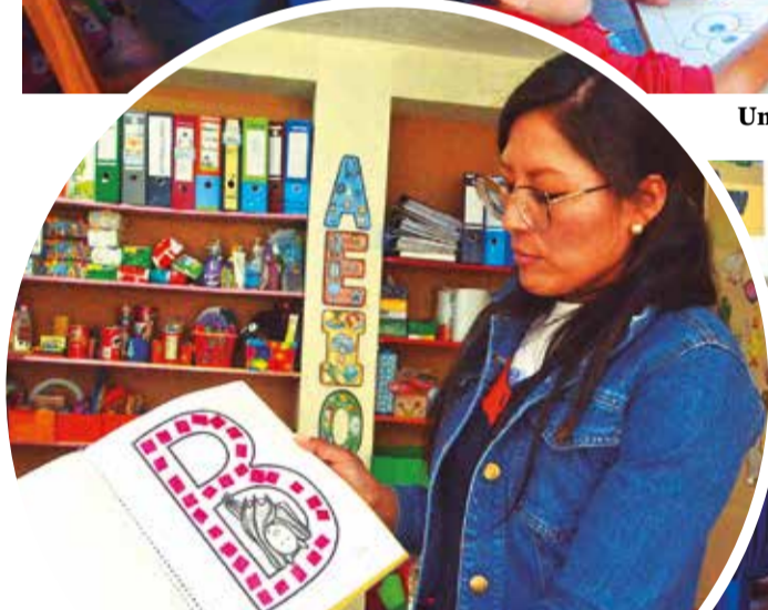
Una profesora muestra un texto de enseñanza.