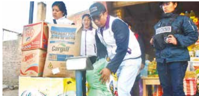
El control de balanzas y peso de los abarrotes.

“En el caso del tomate, hemos verificado que el precio subió, pero va a ir bajando porque se prevé que hasta fin de mes ingrese desde el Chape”, puntualizó.