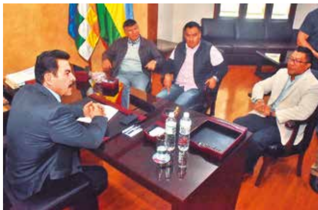
El Alcalde y dirigentes del transporte, ayer.

Explicó que un estudio detallado determinó que el costo del pasaje debería ser de 2,18 bolivianos, e incluso se sugirió un incremento a 2,20. Sin embargo, resaltó que no es el mo-