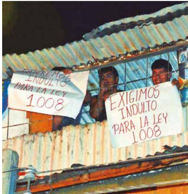
Protesta en San Antonio, Cochabamba. HERNAN ANDIA

En tanto, los reos en la protesta pedían amnistía. “Que-