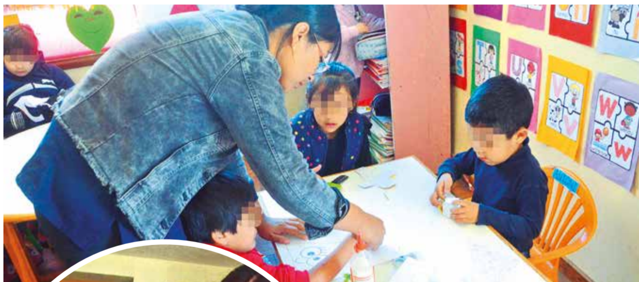
Una maestra de niños con autismo en una clase.

Dato. Aún no existe un censo de la población con TEA, pero se estima que en Cochabamba existen alrededor de 10 mil. Sin embargo, los profesores aseguran que los niños son discriminados en las escuelas