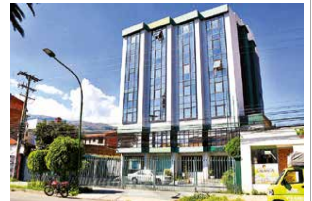
Frontis del edificio de la FBF en Cochabamba. CLÓPEZ