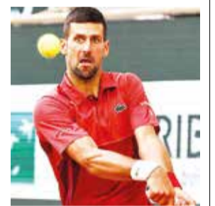
El tenista serbio Novak Djokovic.