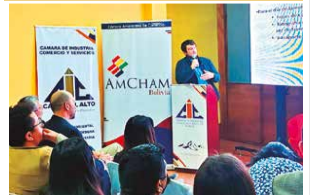
El encuentro en la Cainco de El Alto. JULY ROJAS

“Con esto, el Gobierno nacional cumple con establecer el marco legal con el cual se va a posibilitar hacer estos pagos”, acotó.