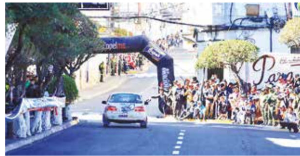
Imágenes de la competencia 2023 del COCS.

Automovilismo. El tradicional evento comenzó a llenar las calles de Sucre y los aficionados ya aguardan el rugir de motores