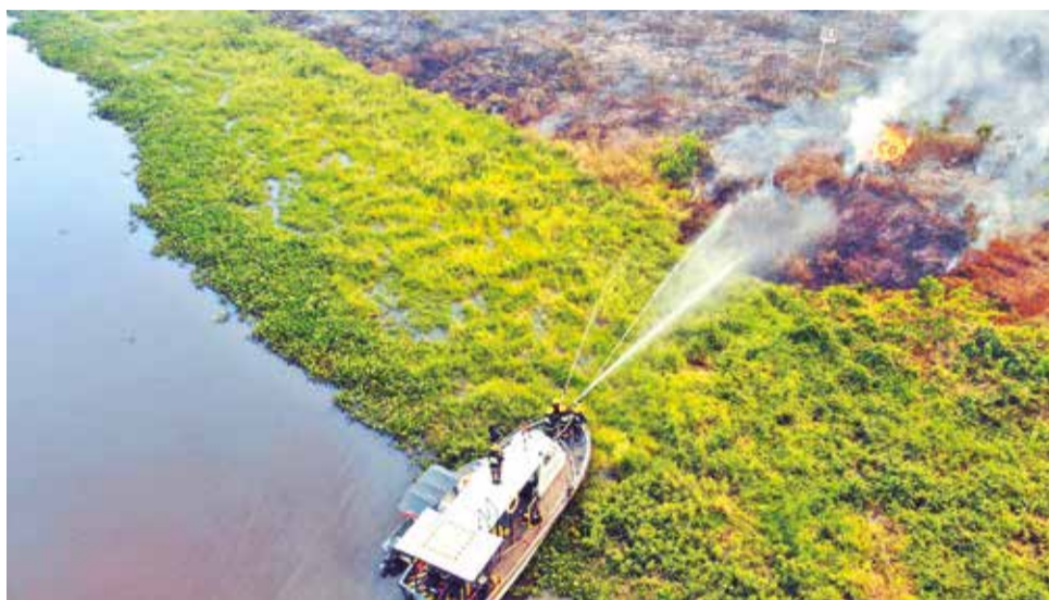
El incendio en Brasil afecta al municipio de Puerto Quijarro en territorio boliviano.

A finales de mayo, el Gobierno presentó un plan de acción contra los incendios forestales que incluye un Sistema de Monitoreo de Bosques (SIMB) para controlar e identificar posibles zonas vulnerables. Entre julio y noviembre de 2023, más de 3,3 millones de hectáreas de zonas boscosas, matorrales y pasturas secas se quemaron en al menos 160 incendios forestales registrados en el país. También durante algunas semanas el humo de los incendios afectó ciudades como Santa Cruz, La Paz y Cochabamba.