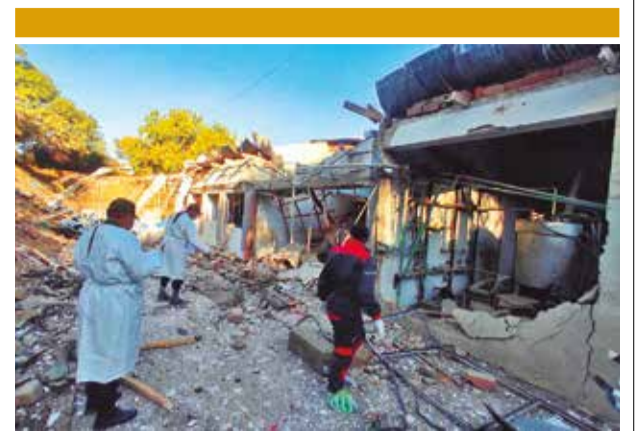
Inspección ocular de la Policía, el martes.

Hasta el cierre de esta edición (24:00), las protestas continuaban, junto con la vigilancia policial, pero no se reportaron hechos de violencia.