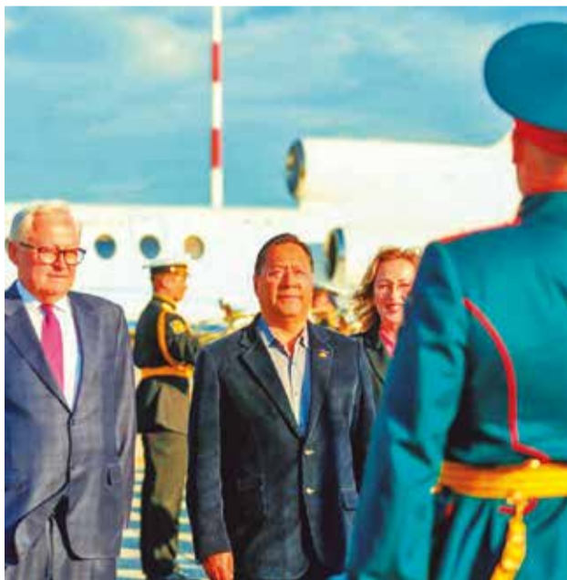
El presidente Luis Arce en San Petersburgo (Rusia).

En sus más de 25 años de historia, el Spief logró convertirse en la principal plataforma internacional de