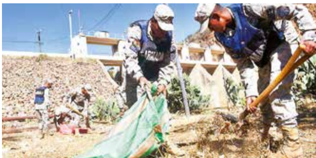
La Armada retira basura y maleza de La Angostura. D.JAMES

Objetivo. El puesto coadyuvará en tareas que permitan preservar el embalse y disminuir la contaminación del agua