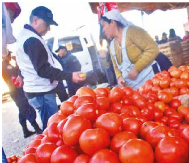
Controlan venta de tomates en el mercado Campesino. J.R.

El Índice de Precios al Consumidor (IPC) mostró en mayo un incremento notable en varios sectores, siendo los más afectados alimentos y bebidas no alcohólicas, bienes y servi-