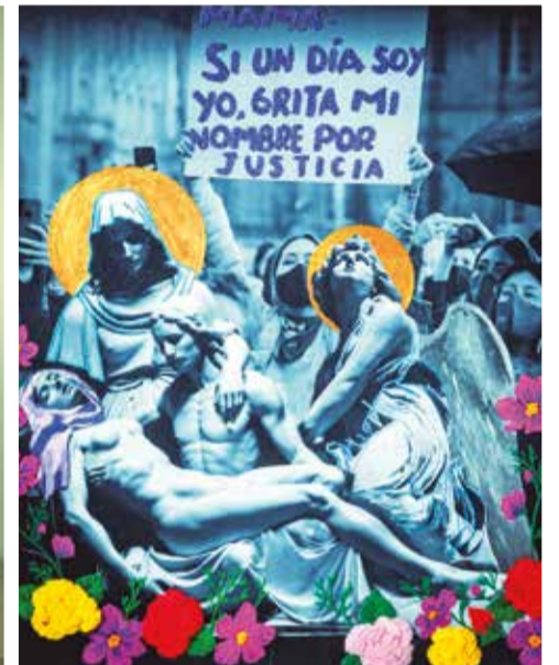
Montaje. La muestra incluirá 20 obras y una instalación impactante.