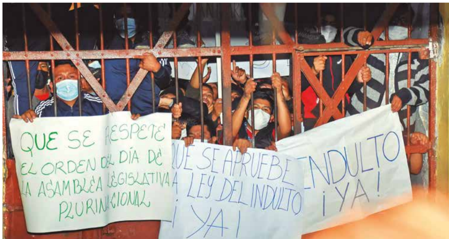
Protestas de los reclusos en la cárcel de San Pedro en La Paz, ayer. Escenas similares hubo en Cochabamba y Santa Cruz.

Demandas. Las protestas ocurren tras conocerse la convocatoria para hoy a sesión de la ALP, cuyo segundo punto es el perdón a reos por razones humanitarias. Pág. 12