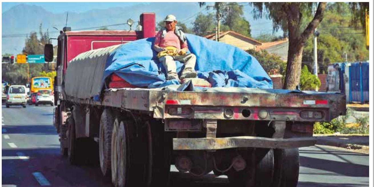
FAENA. Un obrero va sentado encima de bolsas de cemento en un camión que transita por la avenida Blanco Galindo.

ENVÍE SU FOTO PARA PUBLICARLA EN ESTA SECCIÓN A: fotografia@lostiempos-bolivia.com