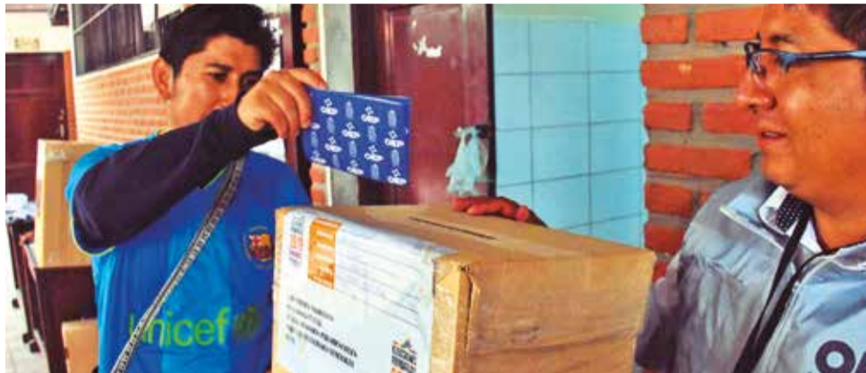
Votación durante las elecciones primarias de 2019 en Cochabamba. CARLOS LÓPEZ

3. Ser obligatorias , ya que el voto ciudadano es un derecho y un deber.