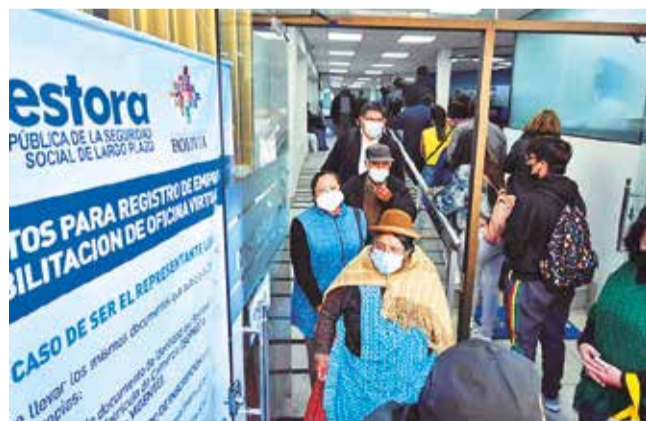
Oficinas de la Gestora Pública. APG

Cambios. El aumento beneficiará más a los que tienen rentas menores, explicó el ministro de Economía, Marcelo Montenegro