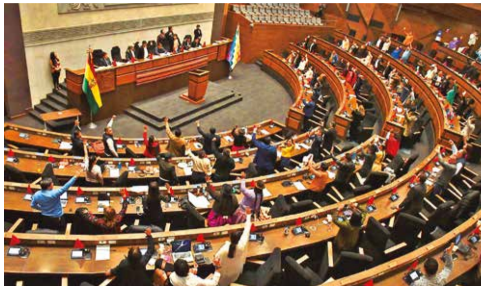
Sesión de Asamblea Legislativa Plurinacional.

El proyecto de ley 073 declara la pausa en los procesos legales que se ventilan ante el Tribunal Constitucional Plurinacional (TCP), hasta la nominación de nuevas autoridades en ese alto tribunal; mientras que el proyecto de ley 075 deja cesantes a las actuales autoridades y deriva todo en manos de las salas departamentales y los administradores del TCP, hasta la elección de nuevas autoridades.