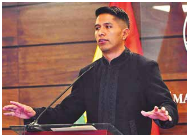
El presidente del Senado, Andrónico Rodríguez.