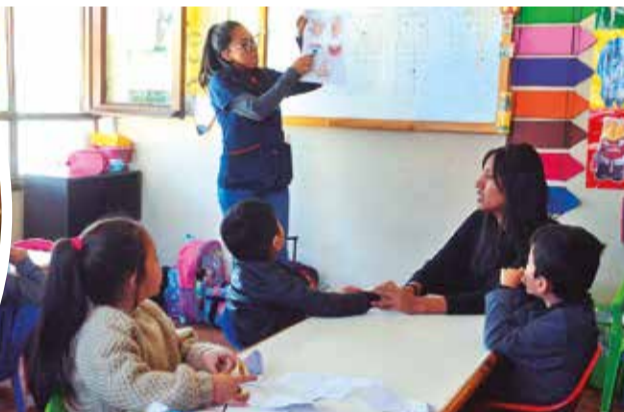
Educadoras en el colegio Manitos de Sol.