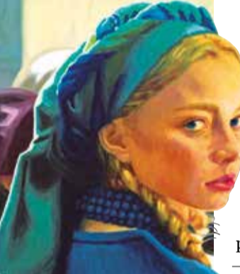
Cine. Fotogramas de los filmes que se estrenan este jueves.