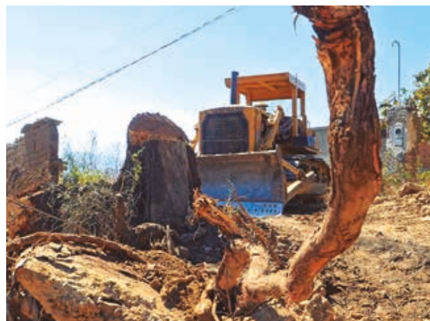
Maquinaria pesada en una propiedad.