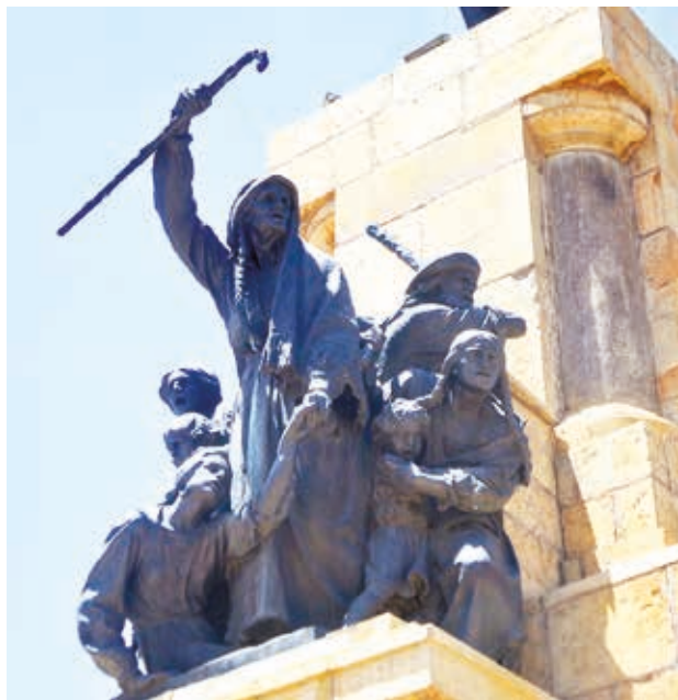
El monumento a las Heroínas de la Coronilla. DANIEL JAMES

Cochabamba, Oscar Aparicio Céspedes, celebrará una misa de campaña.