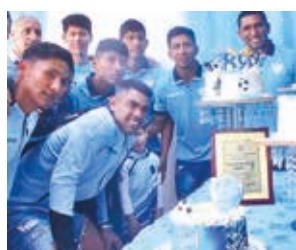
Festejo de Aurora en su complejo deportivo.

Los integrantes de la plantilla profesional se dedicaron a firmar autógrafos para sus seguidores, quie-