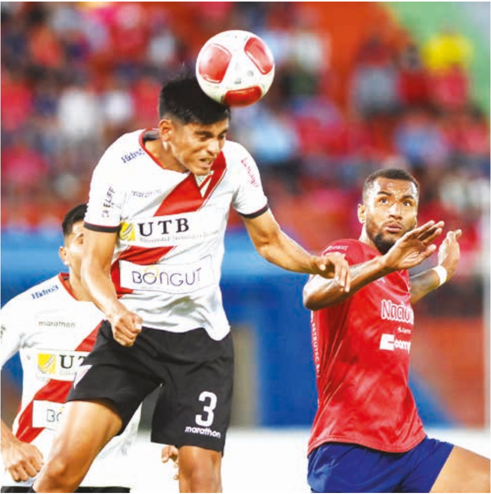
Vaca, de Always Ready (izq.), despeja el balón ante la mirada de Tabares.

MÁS TÉRMINOS: Escanee este QR o ingrese a nuestro sitio web www.lostiempos.com