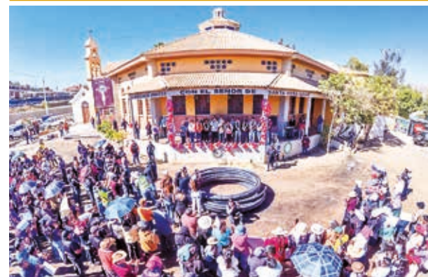
La inauguración de las obras de aducción, ayer.

ción de la Batalla de la Coronilla los discursos del Alcalde y del Gobernador, además de himnos, Nacional y a la Madre, completan el programa celebratorio.