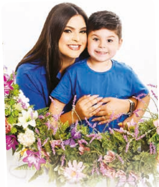
"Querida mamá, en este día tan especial, quiero expresarte todo mi amor y gratitud por ser el pilar fundamental de nuestras vidas. Tu amor incondicional, tu sabiduría y tu fortaleza nos han guiado y apoyado en cada paso del camino. Eres la luz que ilumina nuestros días y el refugio en los momentos difíciles. Gracias por tus sacrificios, por tus enseñanzas y por ser siempre nuestro ejemplo a seguir. Te queremos con todo nuestro corazón, mamá."