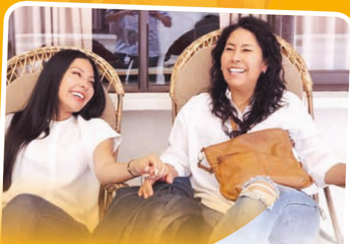
Una vida con tu peculiar forma de ser mamá es lo mejor que me ha pasado. ¡Feliz día mamacita!