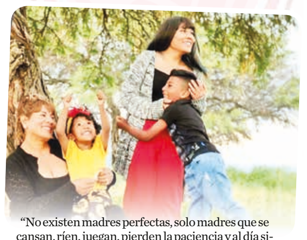
"No existen madres perfectas, solo madres que se cansan, ríen, juegan, pierden la paciencia y al día siguiente vuelven a intentarlo todo con más amor. ¡Feliz día, mamá!"