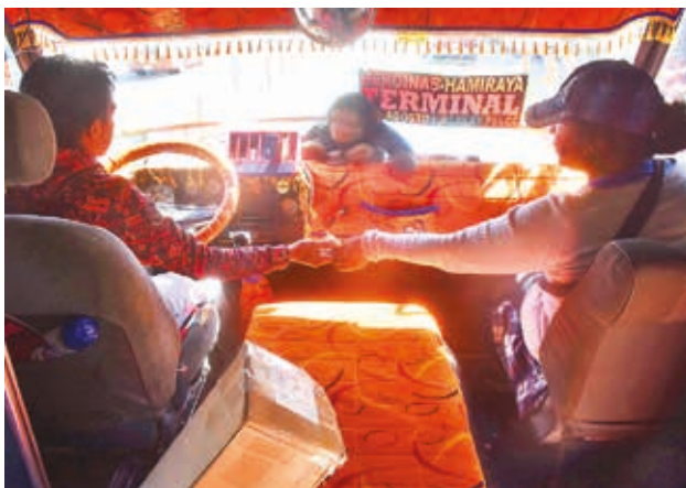
Micros transportan pasajeros en el centro de la ciudad. JR

Reyes Villa afirmó que no es momento de medidas de presión ni de subir la tarifa y ofreció bajar impuestos como una manera de evitar este incremento.