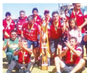
Integrantes del club Wilstermann.