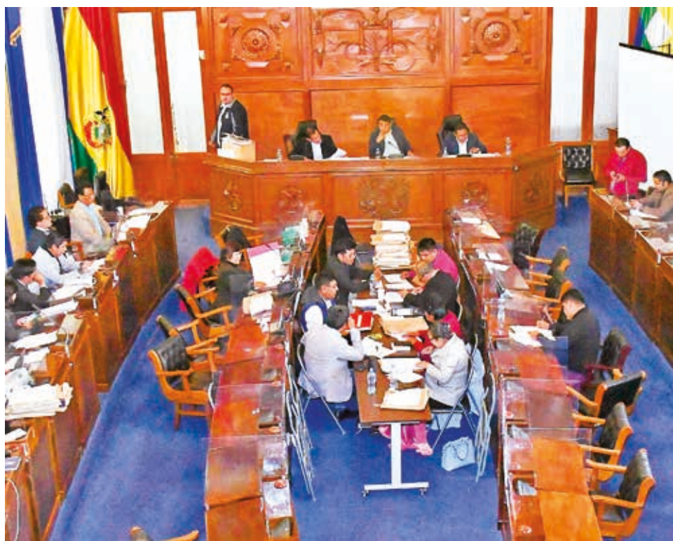
Sesión de la Comisión Mixta de Constitución de la ALP, en abril pasado.

Si bien el TCP unificó los amparos constitucionales y ordenó la reanudación de la preselección de candidatos, Mercado hizo notar que los