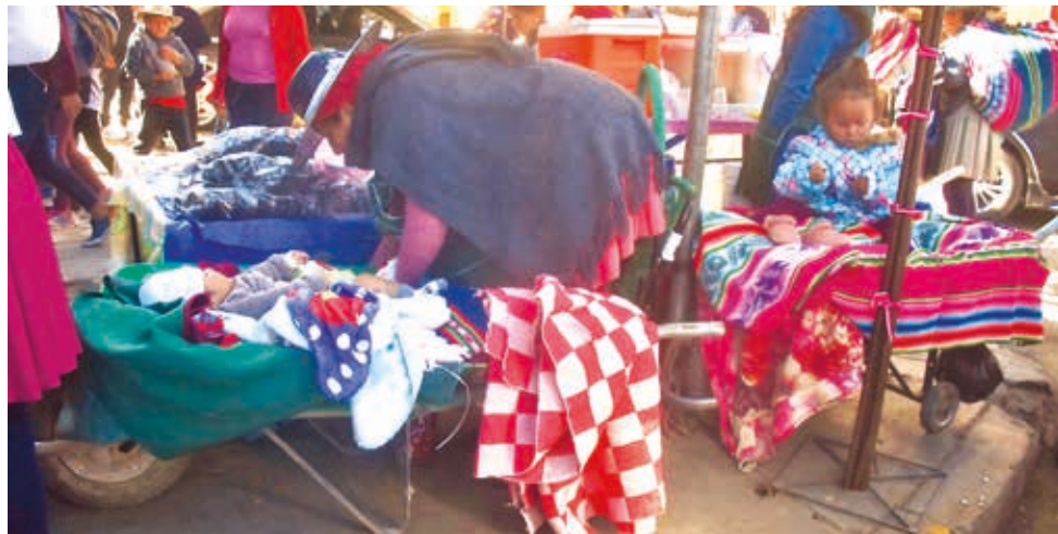
Madres con sus niños en sus puestos de venta. JOSÉ ROCHA