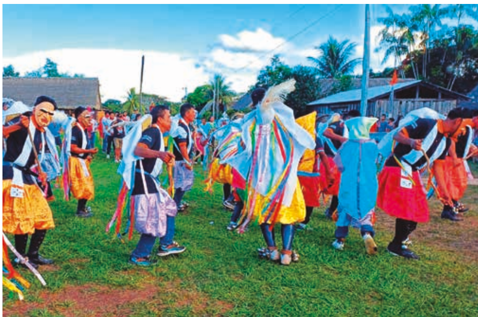
Bailarines de Machu Machu, en San José, durante su aniversario de 408 años.

La idea del ecoturismo comunitario parecía dar resultados. La gente comenzó a deshacer las valijas, los niveles de colegiatura aumentaron hasta llegar al bachillerato. El servicio de provisión de agua mejoró, se construyó una antena para telefonía celular y la comunidad logró la titulación de 210 mil hectáreas dentro del Parque Nacio-