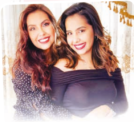
"Feliz día de la madre, a la mujer que me dio la vida y por la que yo doy la mía."