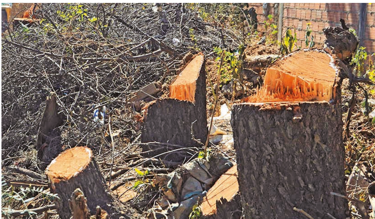
La fila de árboles talados en K'ara K'ara para ensanchar la vía a pedido de un grupo de vecinos.

Por ahora, la calle está cerrada por los trabajos, y los vecinos perjudicados piden una reunión con las autoridades para conciliar.