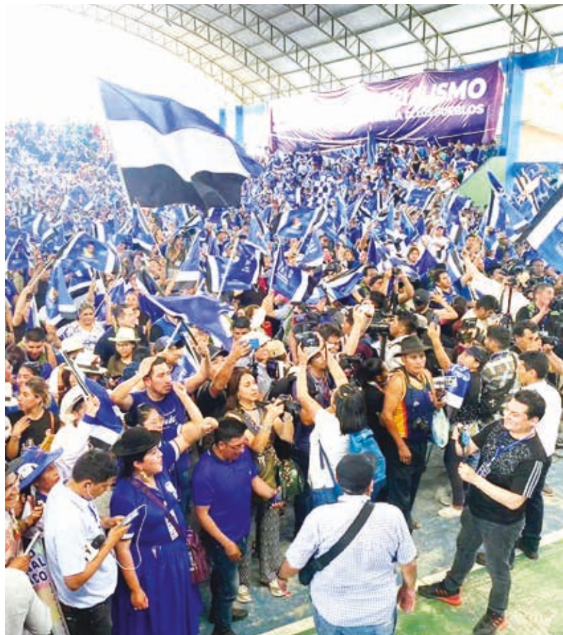
Congreso del MAS evista en Lauca Ñ, en octubre. Cónclave de los masistas arcistas en El Alto el 3 de mayo.