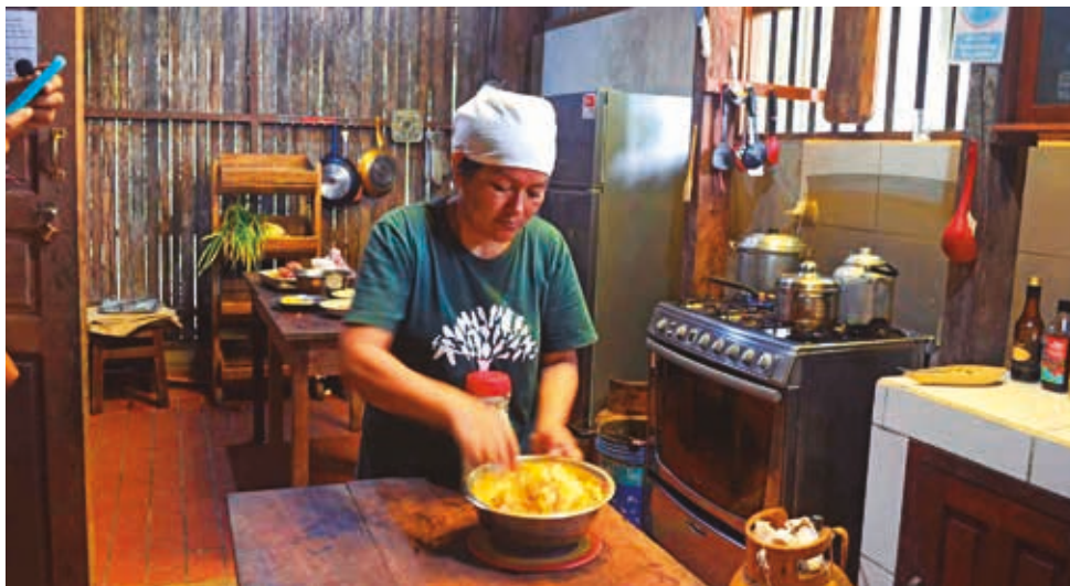
Una de las trabajadoras y accionistas del Sadiri prepara la comida. SERGIO MENDOZA