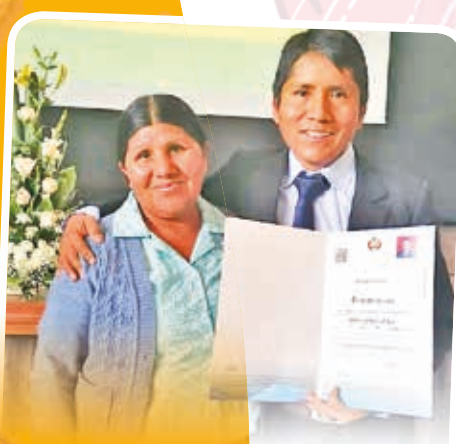
"Gracias, gracias madre, gracias por tu cariño, mimos, paciencia; mucha, mucha paciencia... y gracias a Dios por regalarme tu compañía."