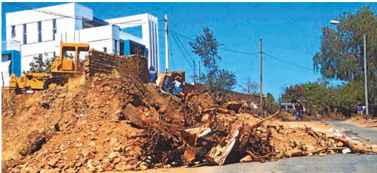
Vecinos afectados por el retiro de molles en la OTB Santo Domingo.