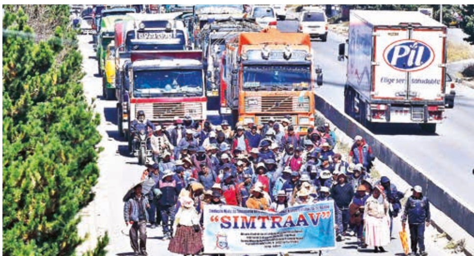
Protesta del transporte pesado por combustible y dólares, en abril pasado.

El Gobierno nacional afirmó ayer que las puertas “están abiertas para un diálogo” con el Transporte Pesado nacional e internacional, que anunció que irá a un bloqueo de caminos el 3 y 4 de junio, y advirtió que este tipo de medidas, además, de afectar el aparato económico nacional, perjudicará el arribo de combustibles al país. “Las puertas están abiertas para el diálogo”, afirmó el ministro de Obras Públicas, Edgar Montaña, consultado sobre los bloqueos, y advirtió que “traen retroceso y regresión económica”.