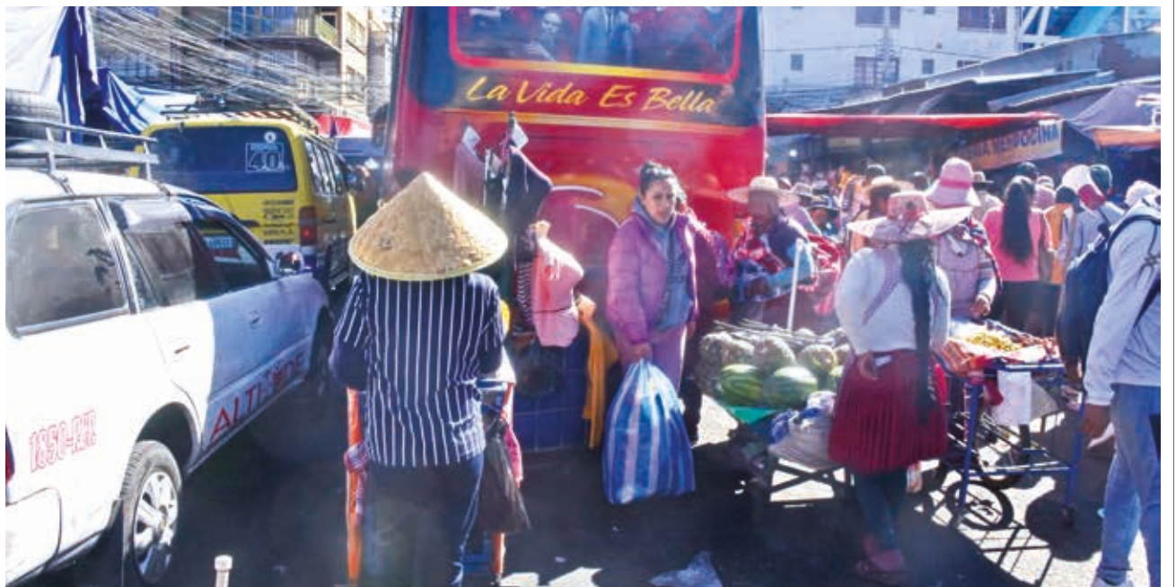
CAOS EN LA CANCHA. Micros, vendedores y peatones, todos sobre la calzada de la avenida San Martín, en la zona de La Cancha... así es el caos en el mercado del sur de la ciudad de Cochabamba.

ENVÍE SU FOTO PARA PUBLICARLA EN ESTA SECCIÓN A: fotografia@lostiempos-bolivia.com