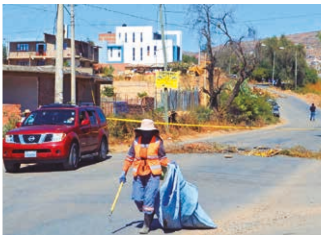
Una calle cerrada por los trabajos.