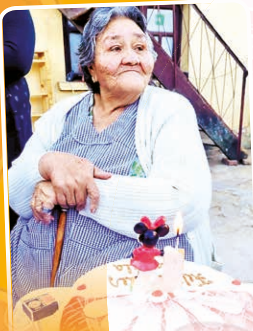
"Feliz día, madre querida."

Desde retratos íntimos hasta imágenes de momentos entrañables compartidos en familia, las fotografías enviadas capturaron la diversidad de relaciones maternas y reflejaron la inmensidad del amor maternal en todas sus formas. Entre risas, abrazos y lágrimas de alegría, cada fotografía contaba una historia única de amor, apoyo y complicidad.