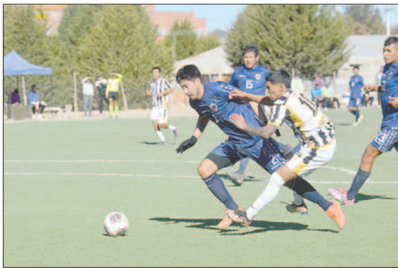
Ingenieros dio una digna batalla, pero al final se descuidó