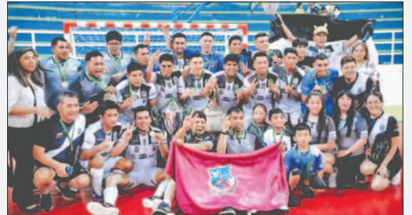
Fantasmas Morales Moralitos es el defensor del título

En el Grupo "A" se encuentran: Concepción y Córdova (ambos de Potosí); CRE (Santa Cruz), Deportivo Amistad (Bermejo), Nantes Vicky Ríos y San Martín de Porres (Tarija); Petrolero y La Prensa (Yacuiba).