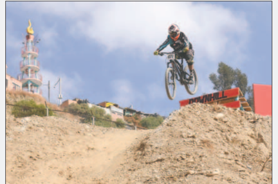
Espectacular fue la competencia realizada el domingo en La Paz