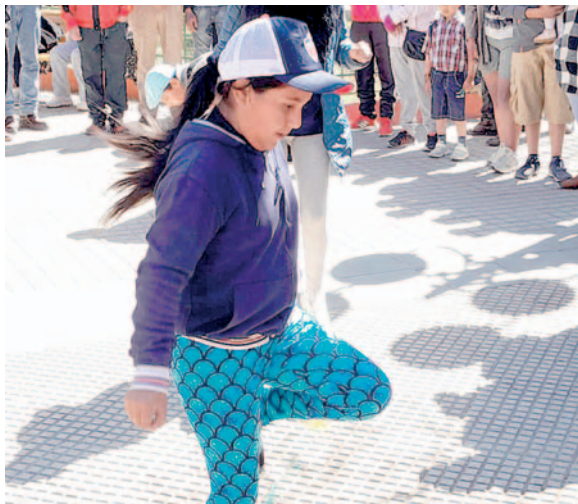
Los niños también fueron parte de los juegos, en este caso de la Pata Pata

Además de premiar a los ganadores de los seis concursos, se entregó incentivos a todos los vecinos que participaron y también, reconocimientos a deportistas con gran trayectoria o destacados de la Ranchería Sporting Club.