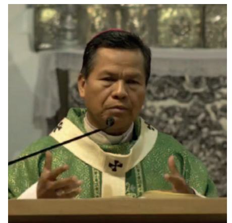
El arzobispo René Leigue insta a mantener confianza en las autoridades y exigir transparencia sobre lo ocurrido en Bolivia

Manifiestó que lo ocurrido el miércoles 26 de junio fue muy duro para el pueblo e hizo votos para que no vuelva a suceder y, al contrario, pidió a las autoridades que se preocupen por la situación de los hospitales, donde hay colas de niños enfermos y padres preocupados porque no hay remedios disponibles.