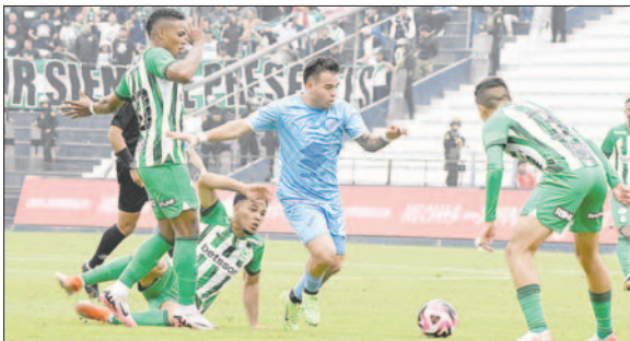
El partido de jugó con intensidad, al final el triunfo fue para Atlético Nacional