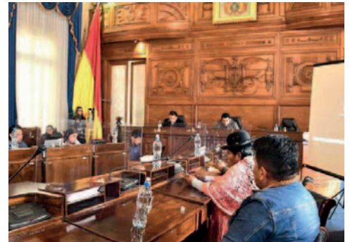
La ALP confirmó que este lunes se reanuda el proceso de preselección para las elecciones judiciales

El proceso había sido suspendido debido a una acción legal interpuesta que ordenó la suspensión del cronograma de preselección cuando se encontraba en la fase de evaluación de méritos y examen de competencia. A partir de esa fecha, se presentaron numerosas acciones legales en todo el país, superando la treintena según las cabezas de las comisiones correspondientes. Estas demandas fueron revisadas por el