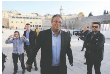
El ministro israelí de Seguridad Nacional, Itamar Ben Gvir

En abril de este año, Ben Gvir reiteró su postura sobre la eliminación de presos palestinos como solución al hacinamiento carcelario.