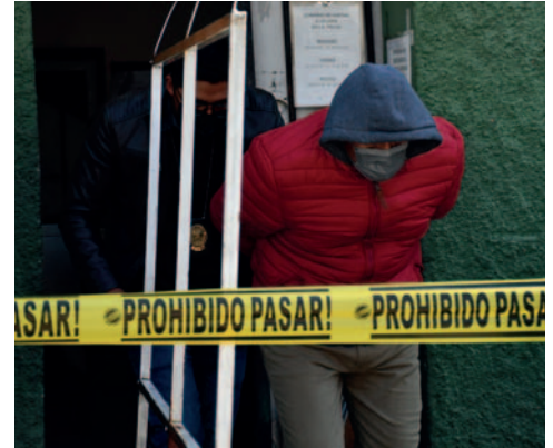
La justicia dispuso la detención preventiva de diez personas, involucrados en el intento de golpe de Estado

Los 21 aprehendidos asistieron hasta el momento a sus audiencias cautelares. Zúñiga fue llevado a la cárcel de El Abra de Cochabamba, luego de informes de inteligencia que daban cuenta que los