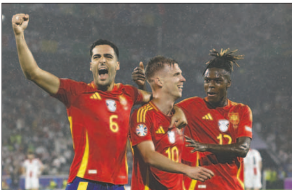
España pudo remontar y terminar ganando 4-1, jugará con Alemania en cuartos

Pero la sentencia ya era cuestión de tiempo y apareció Fabián para diseñarla como más dolió al rival. Con su propia medicina. El talento en el recorte de tación precedió el desplazamiento en largo a la carrera de Nico. Con la contundencia de los grandes jugadores, marchándose en carrera con facilidad del rival y definiendo con calidad arriba. España ya podía pensar en los cuartos. En el reto que representa Alemania en su casa. Y aun así, no rebajó de marcha, Dani Olmo firmó el cuarto y extendió el sueño.