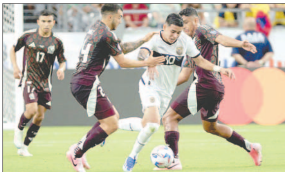
México a pesar de dominar el partido no pudo anotar, Ecuador se defendió bien y pudo clasificarse

La tónica del juego siguió, México y sus hinchas se desesperaron y tuvo ilusión a los 97 con el posible penal a Martínez que nunca llegó.