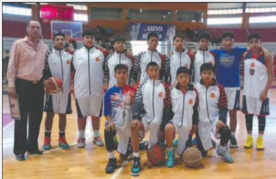
La Salle 2 quiere llegar con todo a la fase final de la Libomenor

La fase final del torneo U-15 en la rama masculina se llevará a cabo en la ciudad de Tarija, en el coliseo "Guadalquivir", entre el 24 y 28 de julio. Participarán los equipos de Chieri (Sucre), Bulls (Santa Cruz), Kinwa (La Paz), Yugoslavia y Los Ángeles (Cochabamba), además de Atenas y La Salle Tarija como organizadores.