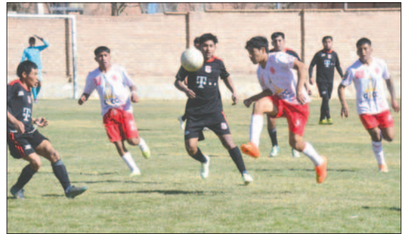
Aurora vuelve a sufrir una dura derrota en el certamen