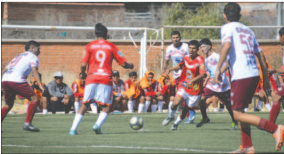
Rosario Central sigue sorprendiendo en el campeonato