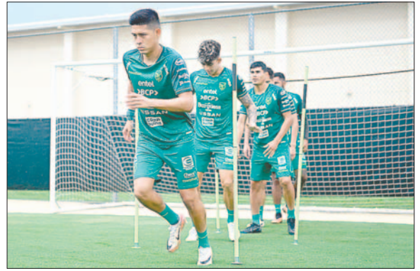
La selección boliviana cerró prácticas ayer en Orlando sede del partido

Panamá está a un paso de sumarse a la lista de revelaciones en esta Copa. Venció al anfitrión (2-1) y perdió contra Uruguay (1-3), y llega a esta fecha con chance de