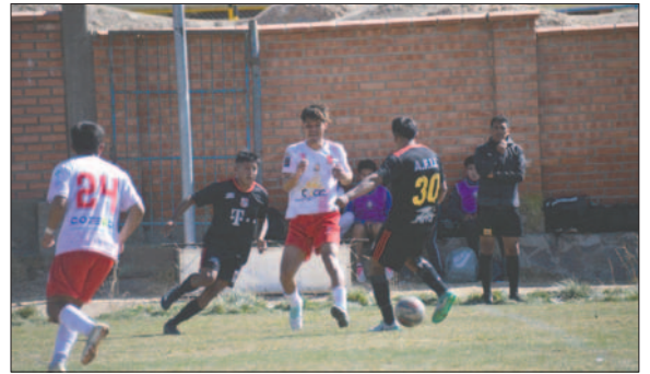
AFIZ pudo lograr su primer triunfo en el torneo de la Primera "A" / LA PATRIA

CDT Real Oruro intensificó su ataque y los goles llegaron por parte