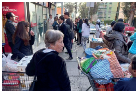
Intenso movimiento en supermercados durante el levantamiento militar

El viceministro de Defensa de los Derechos del Usuario y Consumidor, Jorge Silva, lamentó: “El golpe fallido ha provocado un desborde. Diferentes mercados, tanto populares como supermercados, incluso las tiendas de los barrios, han incrementado los precios. Y la gente desesperada ha tenido