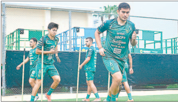
Los seleccionados tienen la intención de despedirse con un triunfo

PANAMÁ: Orlando Mosquera; Carlos Harvey, José Córdoba, Roderick Miller, Michael Murillo, Eric Davis, Cristian Martínez, Abdiel Ayarza, Edgar Bárcenas, Eduardo Guerrero y José Fajardo; seleccionador: Thomas Christiansen.