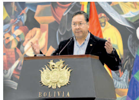
Presidente de Bolivia, Luis Arce

En declaraciones al periódico español El País, Arce recordó que Morales ya dijo que sería candidato “por las buenas o por las malas”, por eso no le sorprende que ponga en duda el supuesto intento de golpe de Estado. En ese sentido, aseguró que el expresidente está dispuesto a hacer todo por sus aspiraciones políticas.