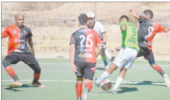
Sur-Car con el triunfo logrado, mantiene chances de clasificación

Este resultado deja a Deportivo Sur-Car con vida en su lucha por clasificar, igualando con Oruro Royal a dieciséis puntos. Sin embargo, para sellar la clasificación, Sur-Car deberá esperar un nuevo traspás del decano y lograr un triunfo abultado en el último encuentro frente a Ingenieros.