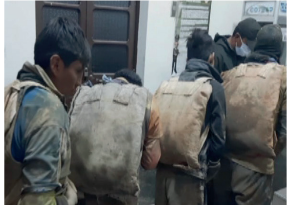
Se pudo evidenciar que tenían mochilas artesanales con mineral

Esta no es la primera vez que la EMH sufre un robo de mineral, por lo que desde el Sindicato