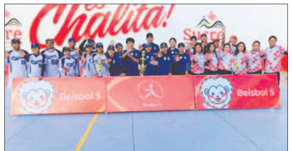
Los equipos de Oruro en lo más alto del podio, ocupó el primer y segundo lugar

La grata sorpresa fue Oruro, que con sus equipos llegó a la instancia final del torneo y obtuvo el primer y segundo puesto. La final se disputó