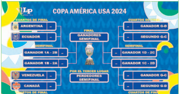
Ya se forman las llaves de cuartos de final

Hrs. 21:00.- Brasil vs. Colombia - Hrs. 21:00.- Costa Rica vs. Paraguay