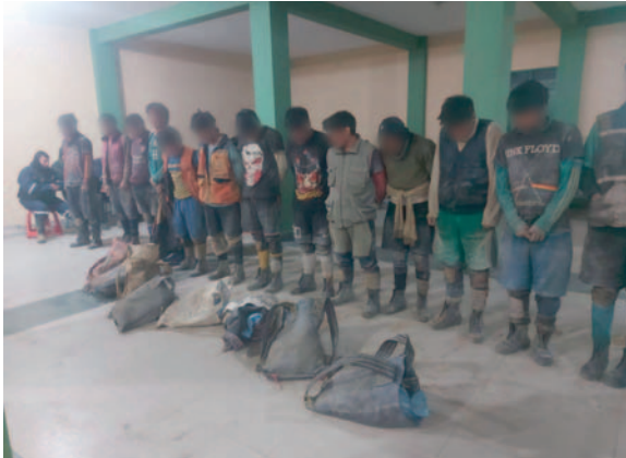
“Jucus” que fueron encontrados al interior de la mina en Huanuni

Según el llamado de alarma, era la 01:10 horas de ayer, domingo 30 de junio, cuando efectivos de la Fuerza Especial de Lucha Contra el Crimen (Felcc) de la localidad de Huanuni y personal de una empresa de seguridad privada, encontraron en flagrancia a los implicados robando el mineral.