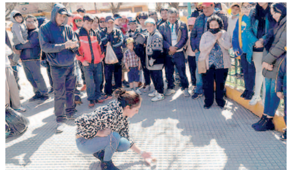
Personas rememoran el juego del trompo

dio de risas y juegos, entre ellos: concurso de comelones, pata pata, carrera de sacos, tres pies, carrera con huevo y trompo, con lo que los vecinos mostraron sus habilidades y destrezas en cada participación.