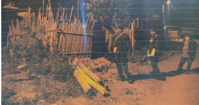
Policía encontró al menor con signos de violencia en su integridad

“La Fiscalía, al enterarse del hecho, inició la investigación de oficio. En la etapa preliminar, el fiscal de provincia recopiló elementos de convicción, como el acta de denuncia verbal de la madre, el registro del lugar y el muestrario fotográfico. Además, se obtuvo el acta del levantamiento del cadáver y el acta de autopsia médico legal realizada por el Instituto de Investigaciones Forenses (IDIF). Estos documentos determinaron que la causa de muerte fue anoxia anóxica, compresión cervical externa y asfixia mecánica por estrangulación a lazo, entre otros. Esto nos permitió ordenar la aprehensión del sospechoso del crimen”, dijo el fiscal departamental de La Paz, William Alave Laura.