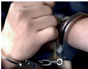
Los diez años de cárcel deberán ser cumplidos en el penal de San Pablo de Quillacollo /REFERENCIAL

En la audiencia, el fiscal presentó todas las pruebas recolectadas en la investigación, como el informe psicológico, el informe social y la declaración de la víctima, entre otros. Estas pruebas fueron valoradas por la autoridad jurisdiccional que dictó