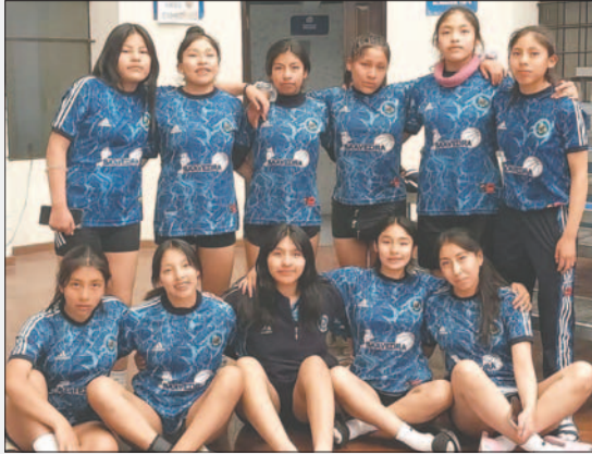
Integrantes del equipo de Saavedra en la recta final de su preparación