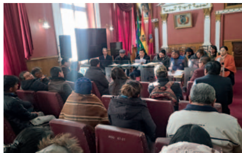
Reunión entre representantes de la UTO y el GAMO / UTO

“Siempre hay la predisposición de apoyar la Educación, hemos encontrado