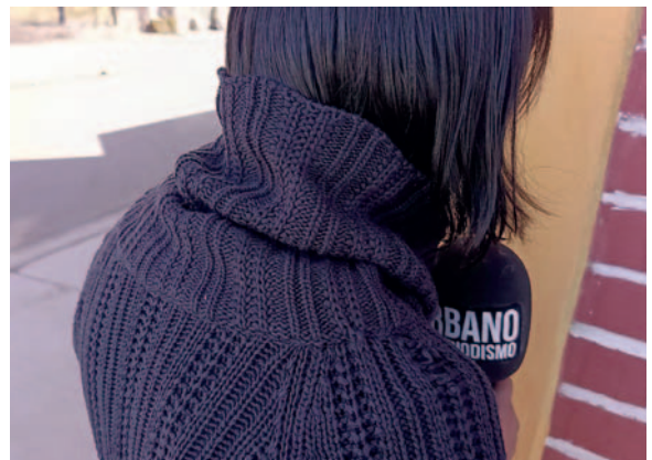
La adolescente declaró que la tratan mal /URBANO TV PERIODISMO

En una entrevista realizada en la página Urbano TV Periodismo, la adolescente, refirió malos tratos dentro de la institución, con lo que argumentó su fuga del Centro de Acogida.