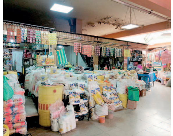
Centro de la ciudad está colapsado por asentamiento de comerciantes

“Nosotros siempre recomendamos a los comerciantes que abran sus puestos de venta, que no los abandonen porque, así como fue un sacrificio tener un puesto de venta, es necesario que