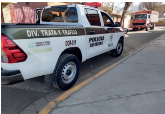
El vehículo de la División de Trata y Tráfico de la Felcc que trasladó a la adolescente

to al promediar las 18:00 horas y hemos mandando a los dos equipos interdisciplinarios y se ha podido tomar un poco la declaración, toda vez de que la adolescente está un poco reacia a realizar su entrevista, ya está nuevamente a disposición el Sedeges (Servicio de Gestión Social). Refiere que estaba con una de las adolescentes, pero la