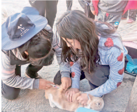
Varias personas llevaron a sus mascotas a los puntos de vacunación

“Hoy damos el inicio en Oruro y ha sido un trabajo arduo, nuestro alcalde ha realizado reuniones y coordinaciones mucho antes y se ha entregado cintillos, jeringas y otros insumos para la logística,