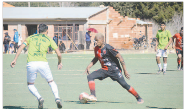
Unión Huayllamarca dio dura batalla a Sur-Car que reaccionó a tiempo