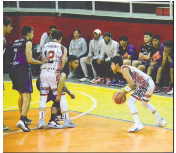
Saracho necesita el triunfo en el último partido como local

Por ahora, la obligación del equipo orureño es ganar esta noche ante Básquetbol La Paz en su cancha y así mantener claras posibilidades de clasificación. No será un encuentro fácil, ya que en la primera ronda el equipo pacaño obtuvo su único triunfo en el certamen ganando precisamente a las "águilas" el pasado 8 de mayo por 103 a 100