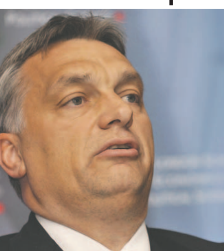
Imagen de archivo del jefe del Gobierno húngaro, Viktor Orbán, líder del nuevo grupo de extrema derecha en el Parlamento Europeo

en un “cohetes portador” para motivar a otras formaciones europeas a unirse a su causa.