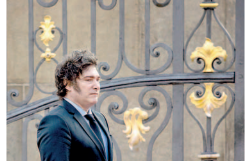
El presidente de Argentina, Javier Milei emitió un comunicado sobre los acontecimientos en Bolivia

Bolivia fue sacudida por un intento de golpe de Estado perpetrado por un grupo de altos mandos militares disidentes que buscaban derrocar al Gobierno del Presidente Luis Arce. Los conspiradores intentaron tomar el control de varias instalaciones clave en La Paz, incluida la sede del Gobierno y los medios de comunicación.