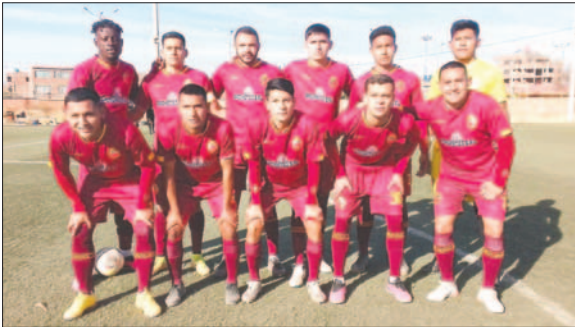
CDT Real Oruro se mantiene como líder e invicto del torneo local