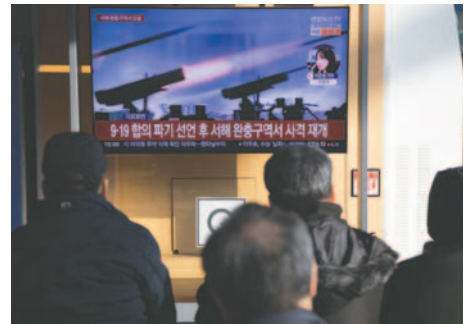
Fotografía de archivo personas ven las noticias en una estación de Seúl, Corea del Sur

El texto de KCNA del domingo denunciaba el