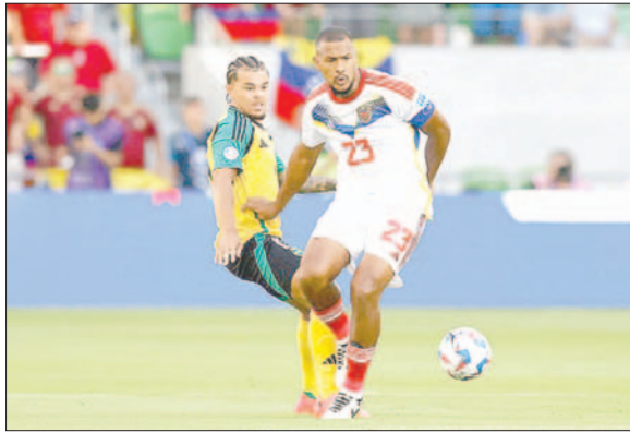
Salomón Rondón se libra de la marca de Joel Latibeaudiere

Le funciona todo a Venezuela. El Gladiador se retiró en el minuto