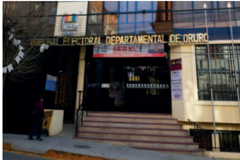
Las puertas del TED Oruro estuvieron abiertas en domingo