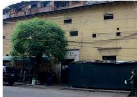
El autor deberá cumplir la pena en el penal de San Sebastián varones /FCE

En la audiencia de juicio oral se presentaron como pruebas el certificado médico forense, el informe psicológico y declaraciones de testigos, entre otros, que fueron valorados por la autoridad jurisdiccional que dictó 15