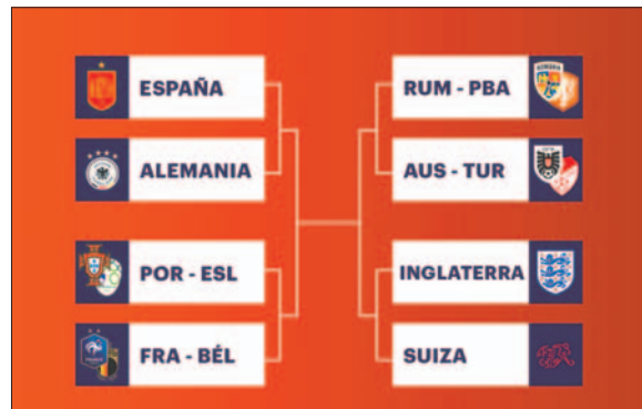
Ya se van formando las llaves de cuartos de final de la Eurocupa 2024