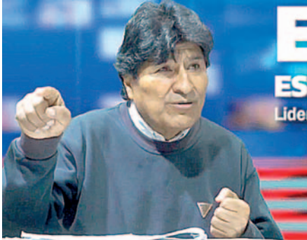
El líder del MAS, Evo Morales, se pronuncia sobre el intento de golpe de Estado en Bolivia