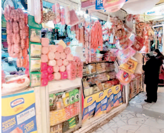
Instan a comerciantes a no abandonar sus puestos de venta

Según Pally, dentro del mercado Bartolina Sisa, que cuenta con casi 200 puestos de venta, de los