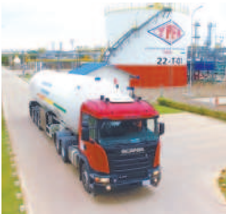
Un camión cisterna que transporta combustibles.