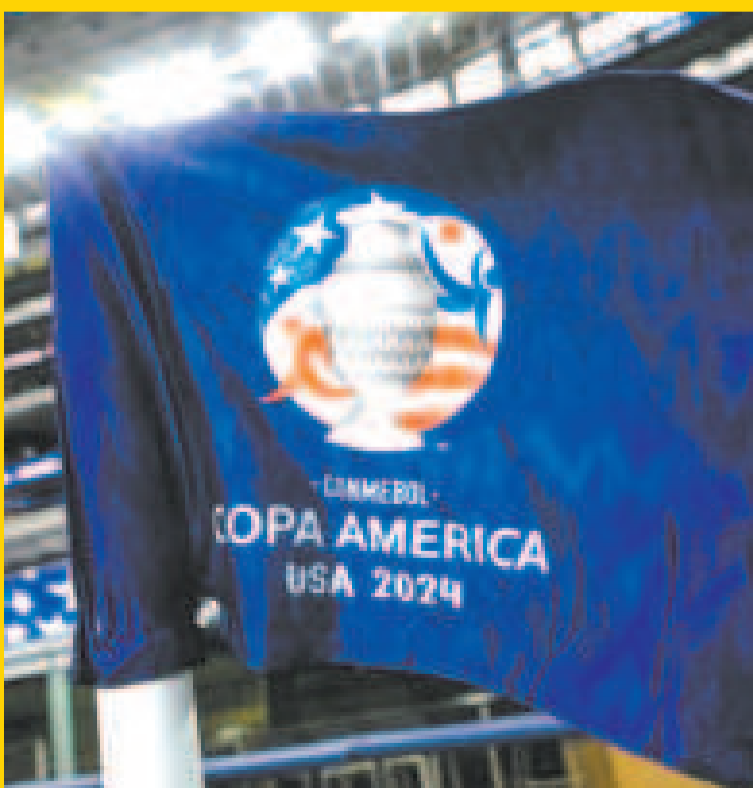
La Copa América ingresa en su etapa decisiva para definir a los clasificados a cuartos.