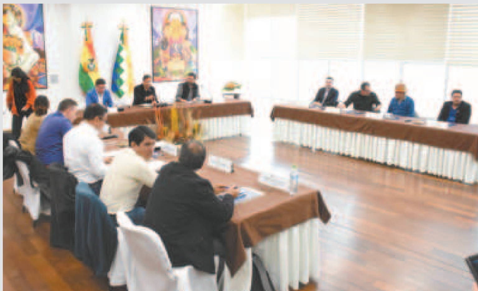
El presidente Luis Arce junto a los gobernadores de los nueve departamentos del país.

“Estas han sido dos reuniones muy importantes y productivas que demuestran la vocación de diálogo del Gobierno nacional. Es fundamental que todos los actores económicos y políticos del país trabajen unidos, siempre en beneficio de la población boliviana”, refirió Cusicanqui.