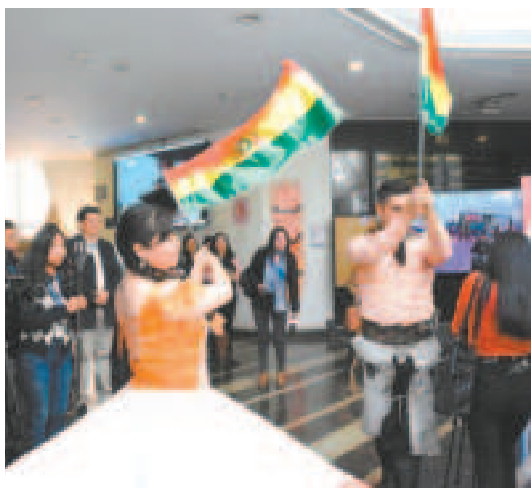
Expresiones artísticas durante el lanzamiento de la ExpoChaco.