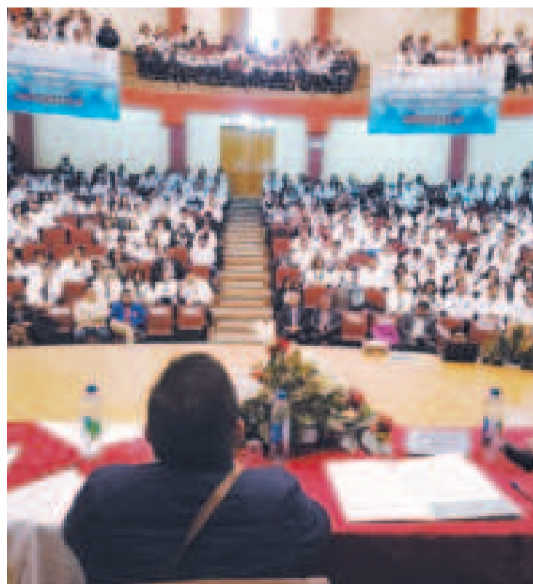
Médicos y autoridades durante el evento.

Por su mes aniversario, del 26 al 28 de junio se celebra en Sucre el Primer Congreso Internacional IV Jornada Nacional de Investigación en Salud con Enfoque en la Política de Salud Familiar Comunitaria Intercultural (Safci Construyendo Salud), que reúne a 640 profesionales de salud de los nueve departamentos.