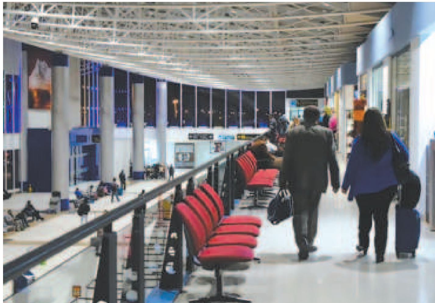
Pasajeros en el Aeropuerto Internacional de El Alto.

La ATT dio cuenta de que, en un plazo de 48 horas, la aerolínea debe presentar un plan de mejora de su capacidad de ocupa-