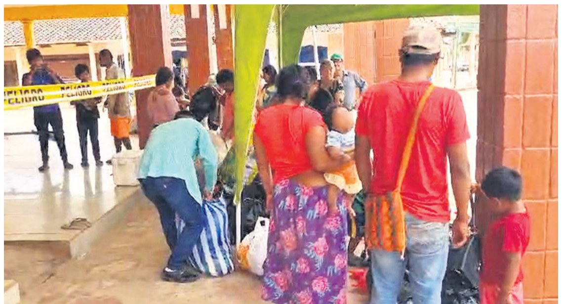
Recibieron donaciones y decidieron compartirlas con otras personas necesitadas. Así fue su reacción después de perder a sus seres queridos cuando cayó el puente Rapuso