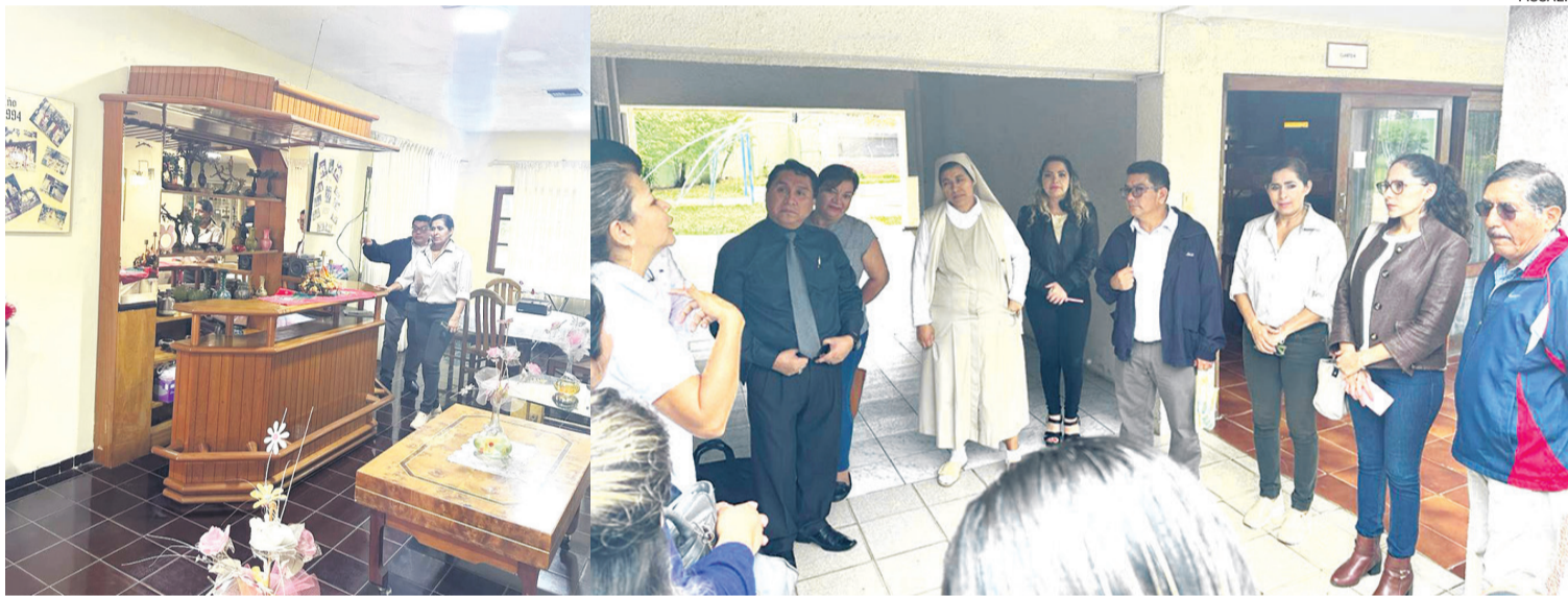
Fiscales concluyen la inspección en uno de los bienes de Techo e Paja donde funciona un hogar de niñas administrado por monjas italianas

Entre los bienes fiscalizados figura la mansión donde en los años 1991 vivía Jorge Roca Suárez, en la avenida Banzer y cuarto anillo. Ahora, en este inmueble, funciona un hogar de niñas huérfanas. Hay personas acusadas como 'palos blancos'