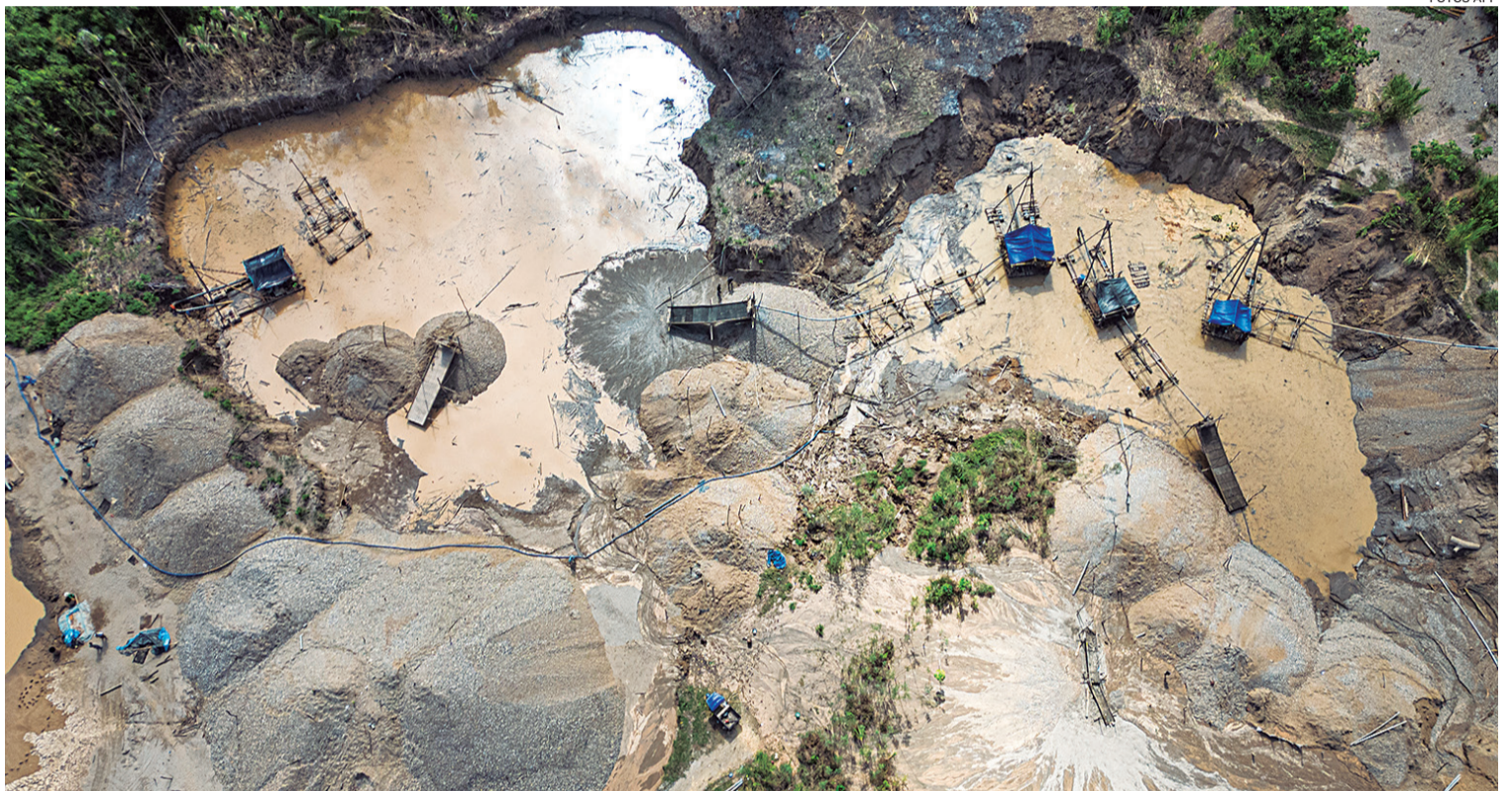
Donde antes había vegetación exuberante hoy se abren profundos socavones inundados de agua color ocre causados por la minería