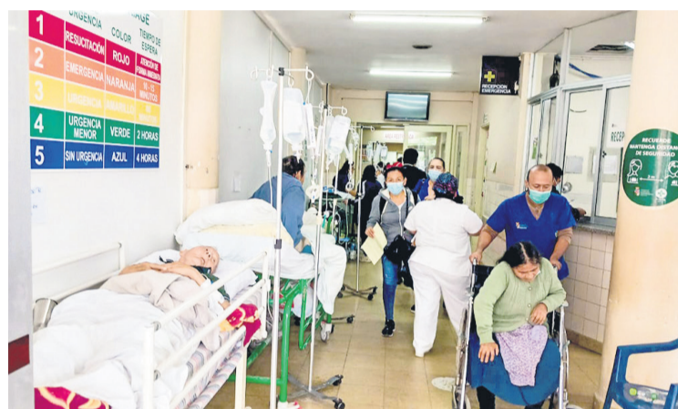
En el hospital Japonés se muestra la saturación en Emergencias