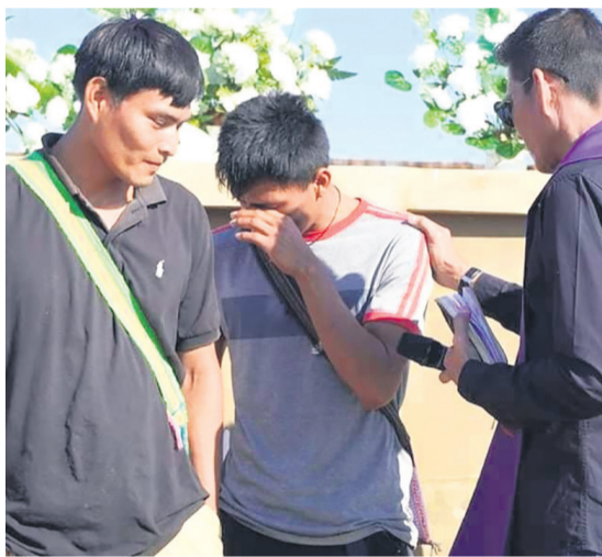
Estos jóvenes quedaron viudos en la tragedia