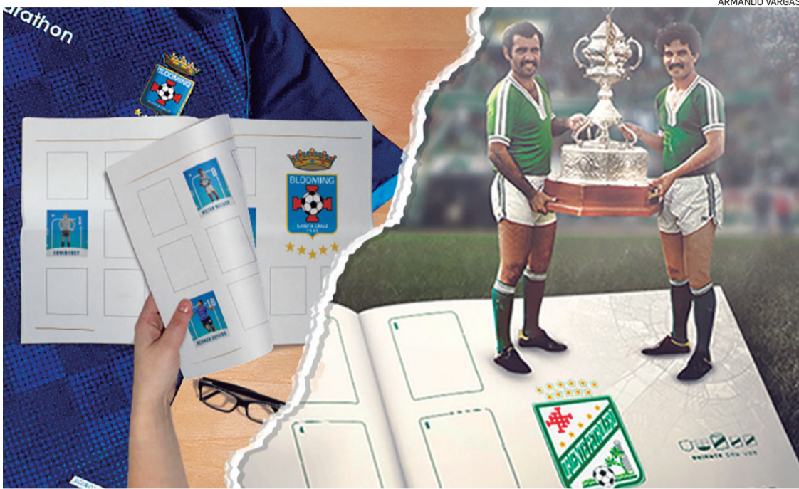
Jugadores, entrenadores y otros personajes que contribuyeron a los éxitos merecen ser celebrados