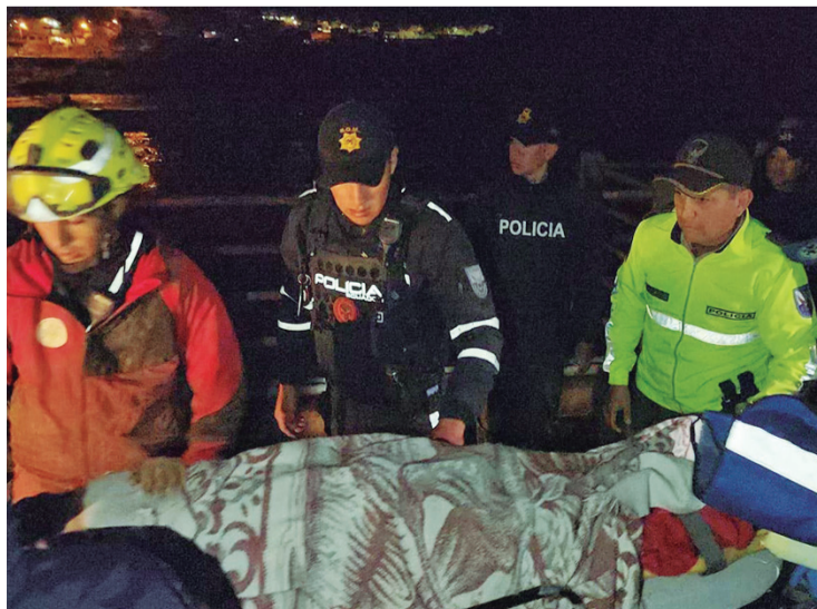
El cuerpo de una persona fallecida es llevado por los rescatistas

“Están varias personas desaparecidas. Estamos hablando de que