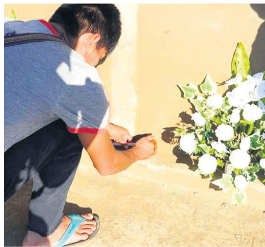
Ocho chimanes murieron al caer el puente

envidia, para ellos todo es comunitario. Les preguntaban ¿qué quieres para vos? y ellos respondían, queremos para todos. Impresionante sus valores con los que han sido formados. Ojalá no cambien nunca”, dijo la educadora.