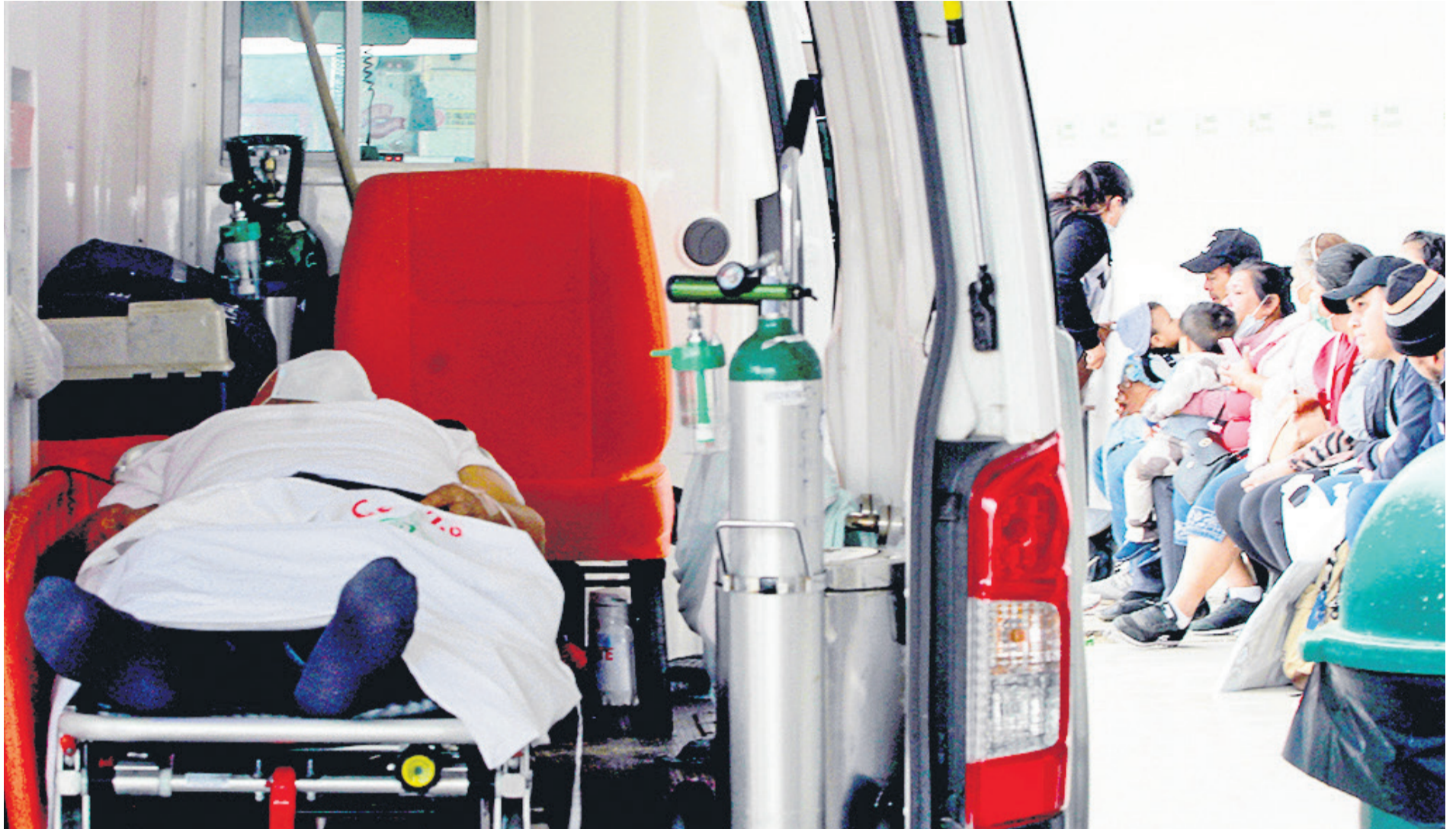
Pacientes que llegan en busca de atención al servicio de Emergencias del hospital San Juan de Dios. Las quejas de la gente era por la saturación y las largas esperas