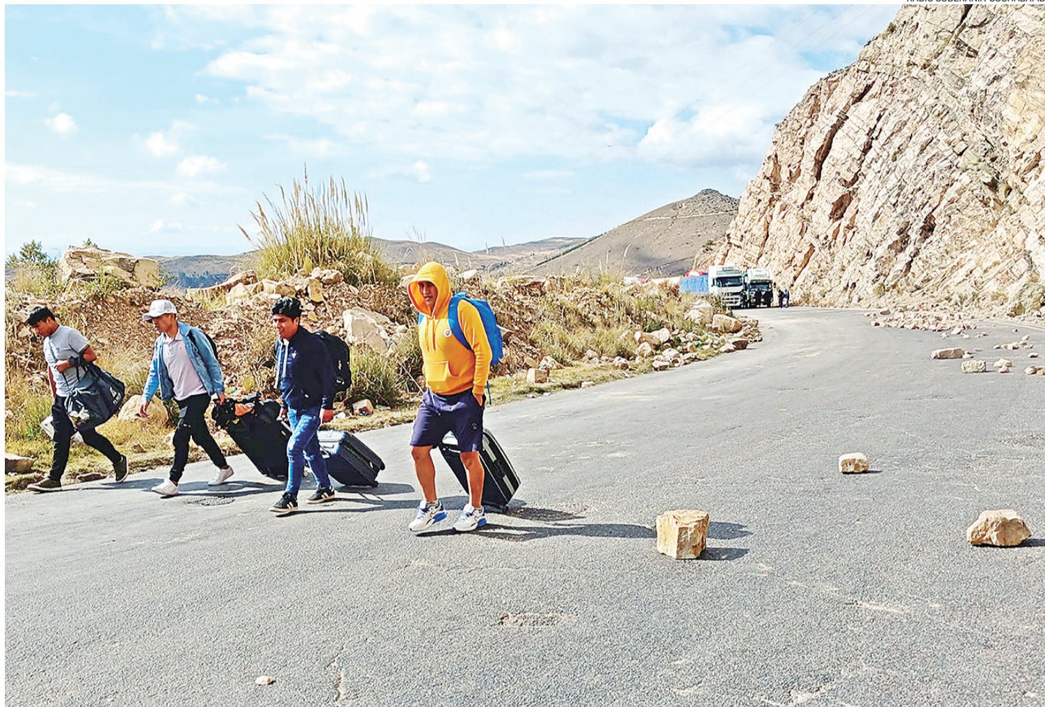
La carretera Cochabamba - Oruro en la región de Sayari, fue bloqueada por varias horas por mineros cooperativistas afines a Evo Morales.

EL GOBIERNO ESPERA EL PRONUNCIAMIENTO DEL TCP