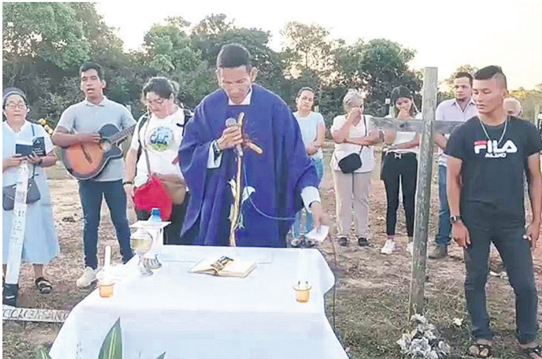
El domingo enterraron dignamente a los chimanes que murieron en el puente Rapuso