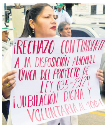
Uno de los letreros que registra la principal demanda