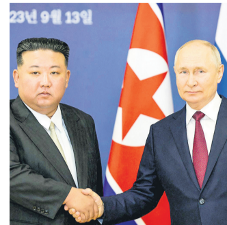
Los líderes norcoreano y ruso

Las condiciones externas pueden volverse menos favorables y “la recesión podría prolongarse, alimentando tensiones sociales y complicando la implementación del programa”, advierte.