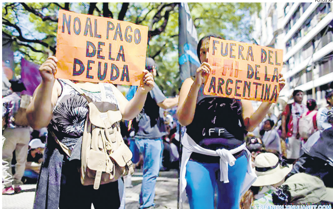
Las protestas contra el gobierno de Milei se registran a diario en las calles céntricas de Buenos Aires

Además, en su opinión “las políticas monetarias y cambiarias