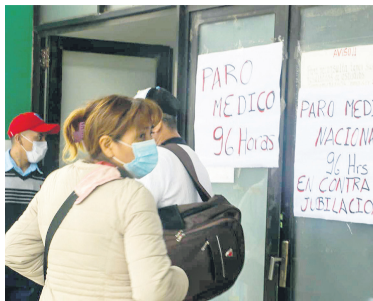
La gente se topó con letreros que anunciaron la medida