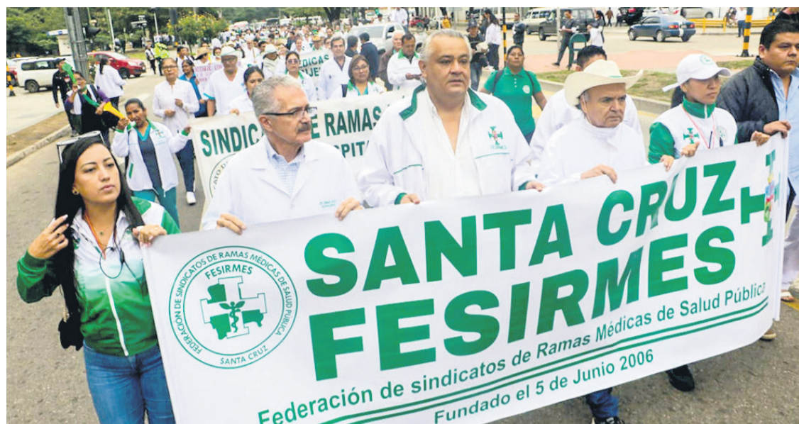
Los profesionales de la salud se movilizaron en diferentes regiones del país con marchas de protestas