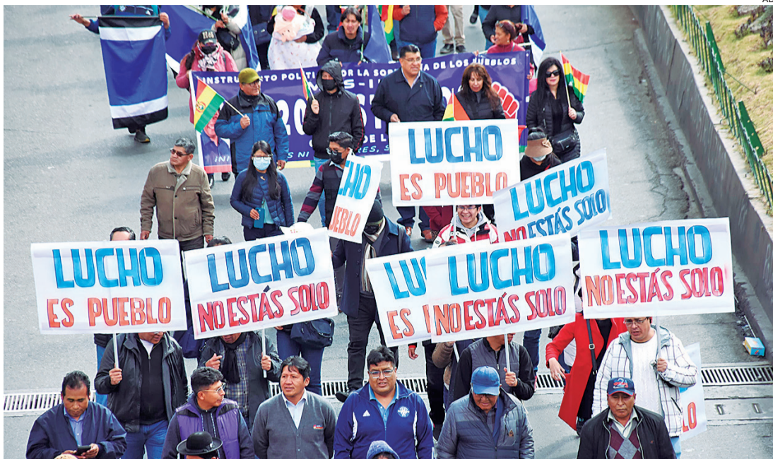
En La Paz, organizaciones afines al Gobierno marchan en apoyo al presidente Luis Arce.

Van a legalizar persecuciones, van a legalizar represiones y van a utilizar a los usurpadores para dar la sensación de que legalmente están inhabilitando candidatos de la oposición, y al paso que van es muy probable que lo utilicen para prorrogarse como Gobierno.