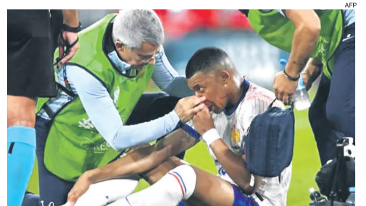
Así terminó Mbappé el partido, con un fuerte golpe en la nariz que le provocó sangrado

No fue fácil ganar los primeros tres puntos, pero los franceses lo consiguieron (1-0)