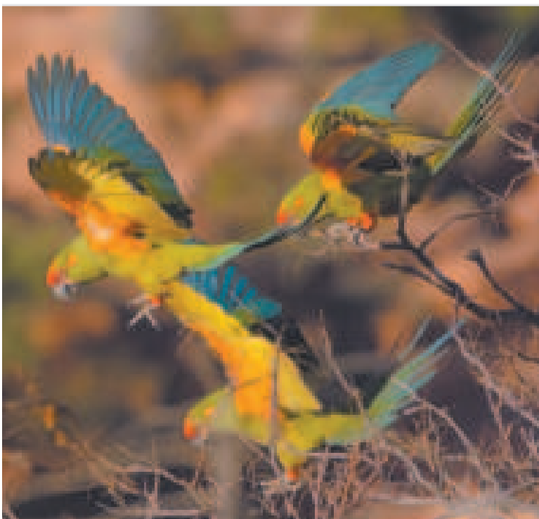
Esta especie endémica del país está en peligro de extinción.