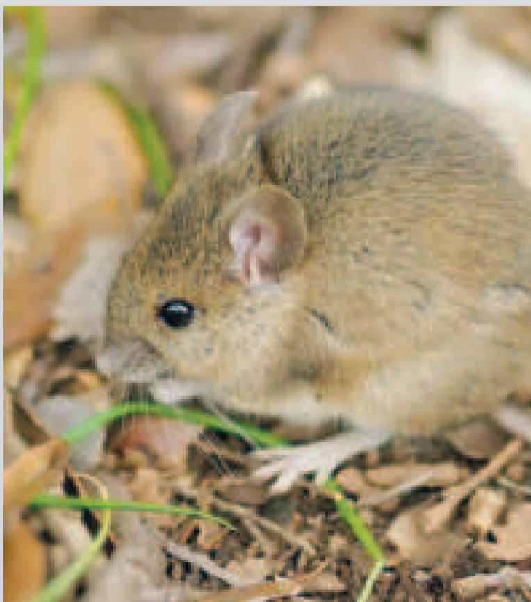
El arenavirus se transmite por el contacto con los fluidos o las heces de un roedor.