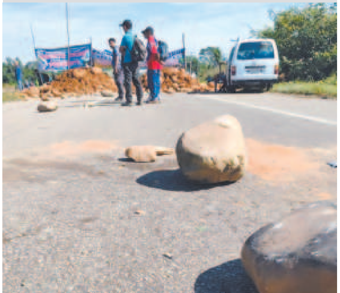
Las piedras y tierra que se utilizan para bloquear la zona.

“No presionen, no perjudiquen a Santa Cruz, es un problema político de estos asambleístas, en este caso, de la infraestructura de la carretera Norte Integrado”, indicó.