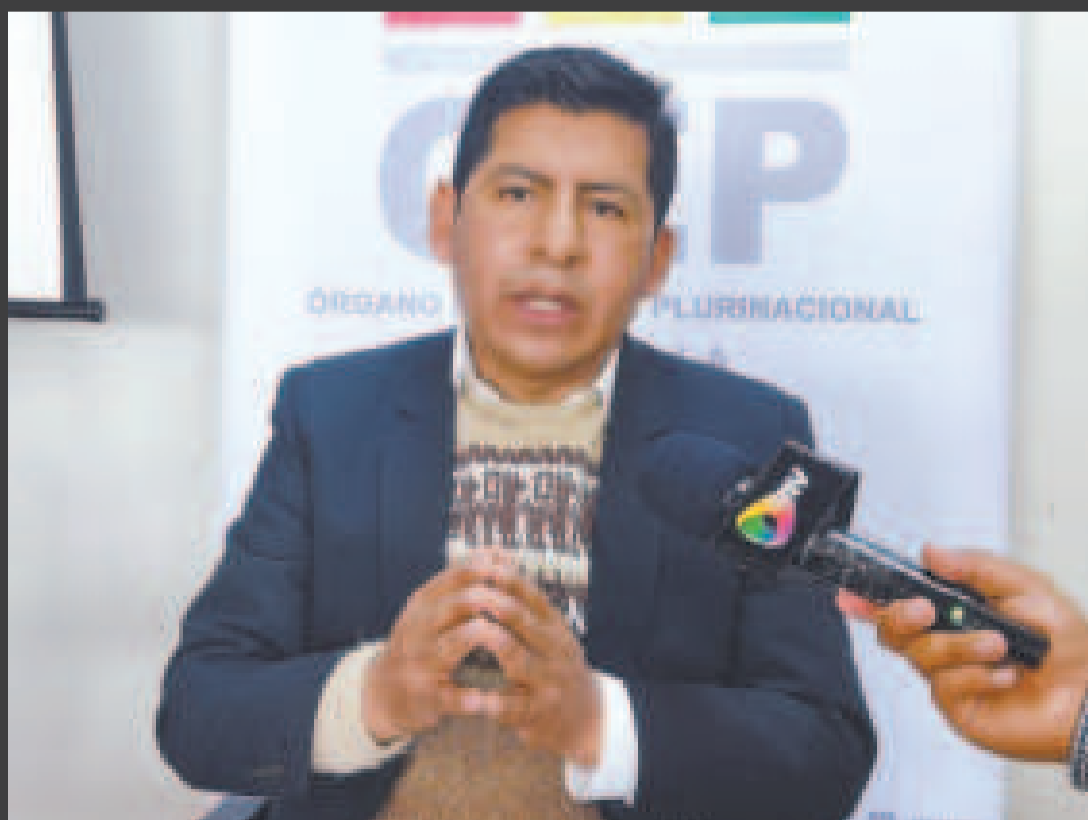
El vocal del TSE, Tahuichi Tahuichi.