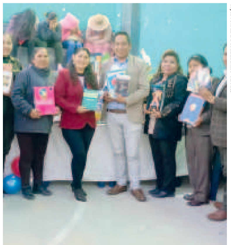
Autoridades estatales y representantes de las internas durante la entrega.