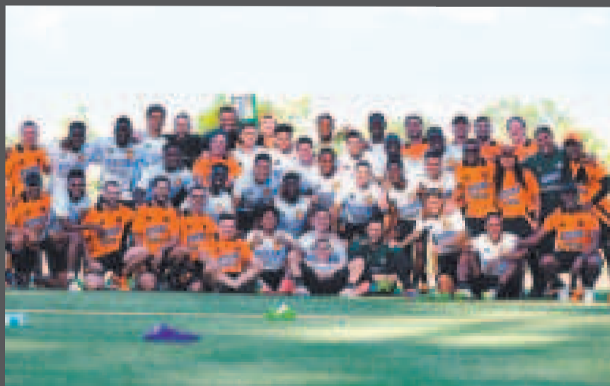
Integrantes de la selección colombiana que se preparan para jugar la Copa América.

Luego reaccionó a la pregunta sobre el favoritismo de Colombia en la Copa América: "Creo que estamos bien, vamos partido a partido, no creo que sea-