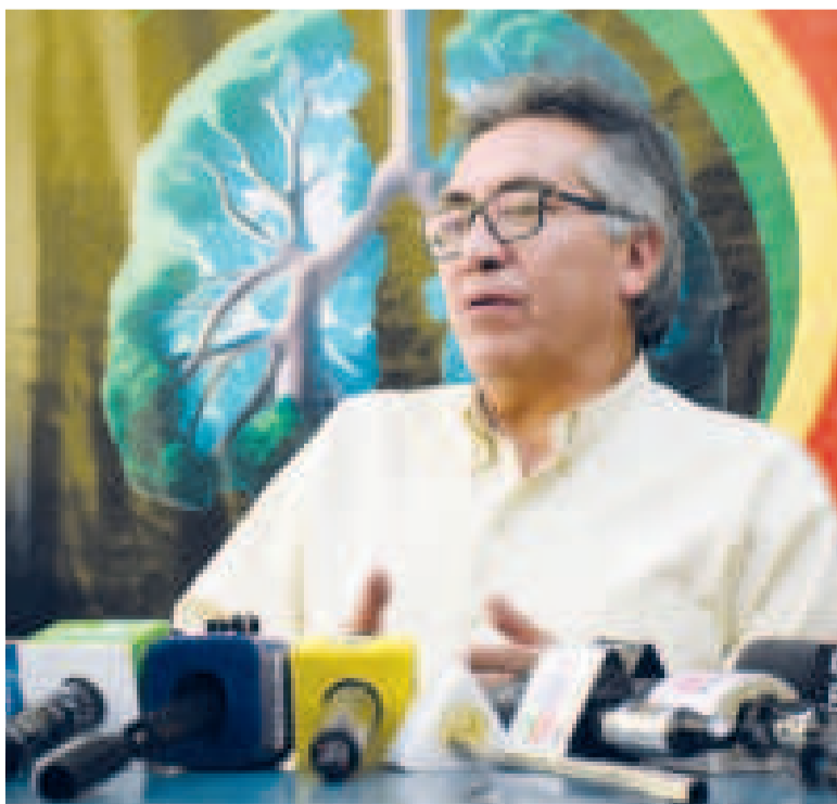
El viceministro de Coordinación Gubernamental, Gustavo Torrico.