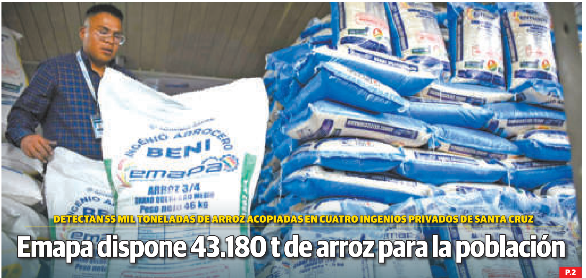
DETECTAN 55 MIL TONELADAS DE ARROZ ACOPIADAS EN CUATRO INGENIOS PRIVADOS DE SANTA CRUZ