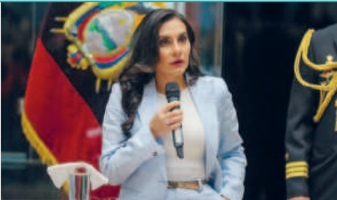
La vicepresidenta Verónica Abad.