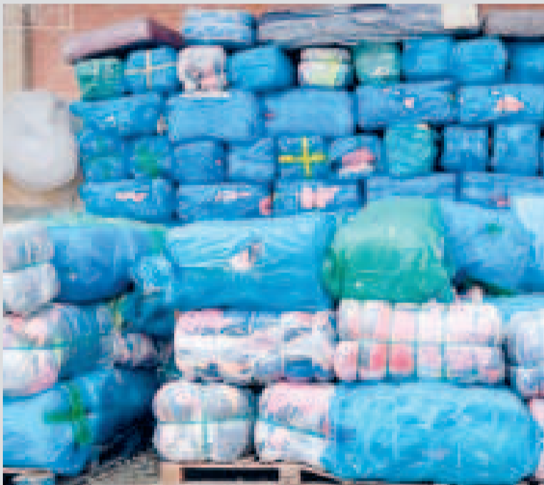
Ropa incautada por la Aduana en varios operativos.