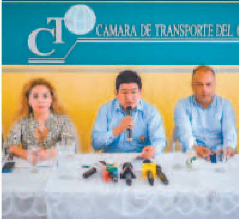
El ministro de Obras Públicas, Édgar Montaño (centro), en conferencia de prensa.