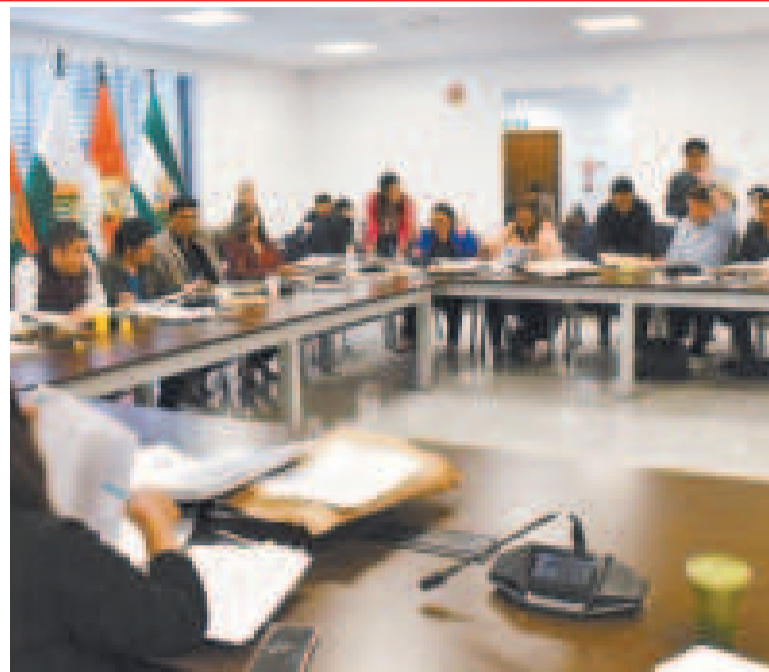
La Comisión Mixta de Constitución.

El expresidente Morales gobernó el país durante tres gestiones seguidas, en su cuarta reelección y desconociendo el resultado del referéndum consultivo de 2016, volvió a postularse en 2019, lo que desató una crisis política y social, y su posterior renuncia a la presidencia de Bolivia.