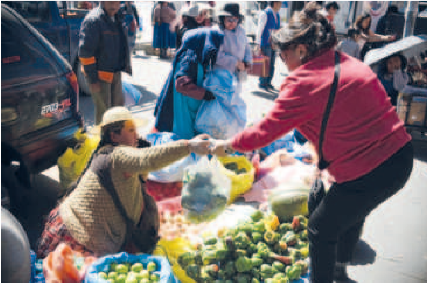
Una reciente feria de precio justo en La Paz.