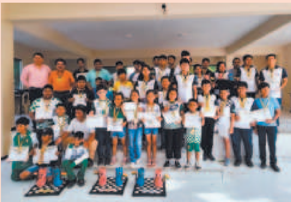
Ajedrecistas ganadores del Primer Nacional Intermunicipal que se disputó en Santa Cruz.