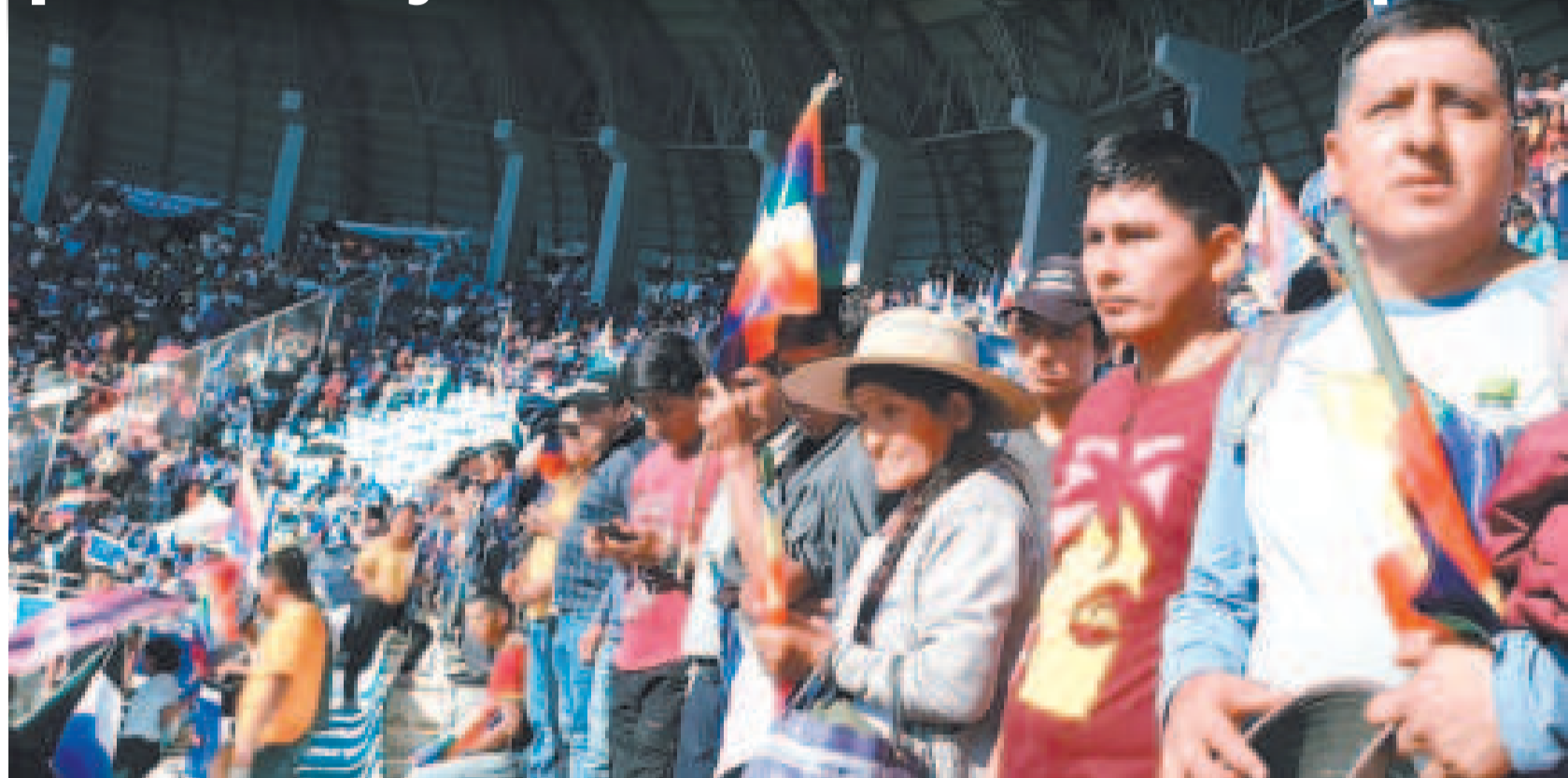
Encuentro en Villa Tunari.

semanas antes que es obligatorio asistir a estos eventos, sino son pasibles a sanciones y multas que van desde Bs 500 a Bs 1000, incluso pueden perder sus terrenos.