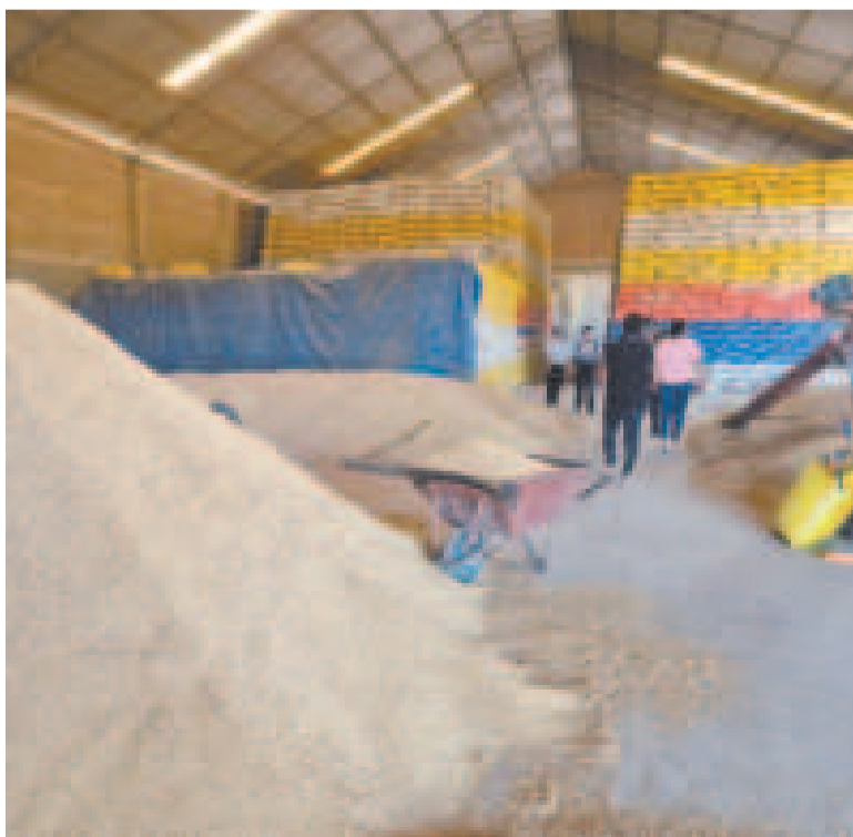
Grandes cantidades de arroz almacenadas en Montero, Santa Cruz.