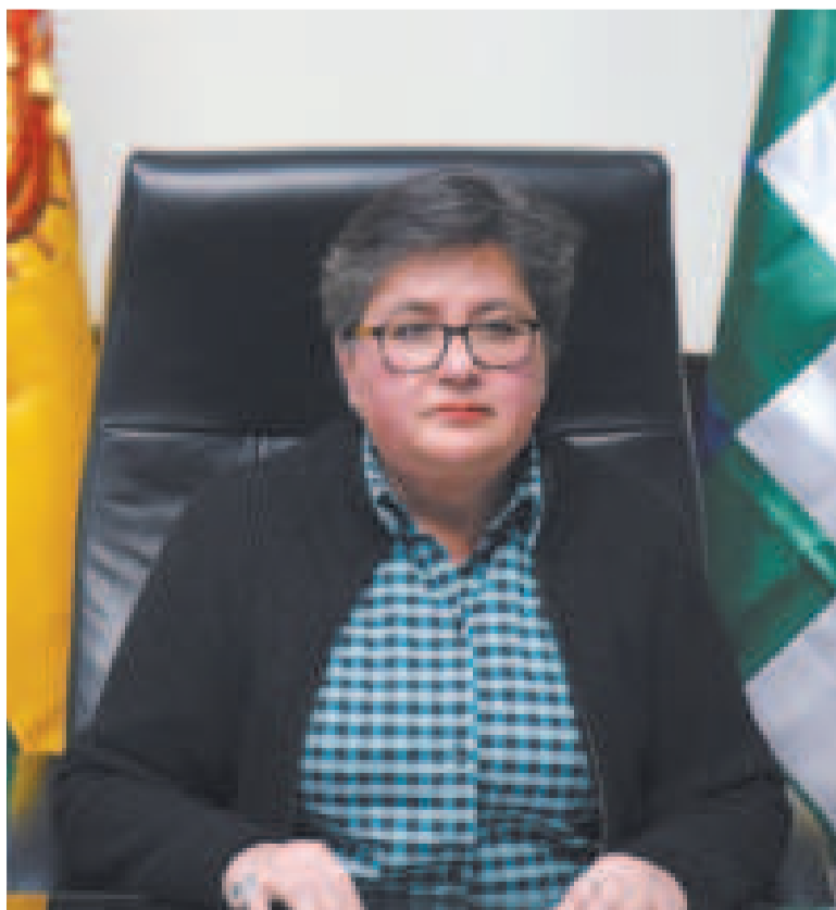
La ministra de Trabajo, Verónica Navia, durante su intervención.