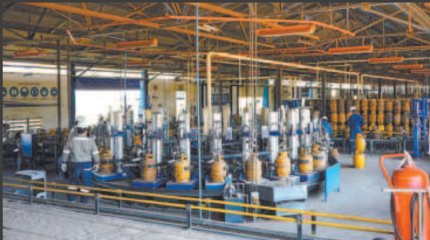
El proceso de engarrafado de GLP.