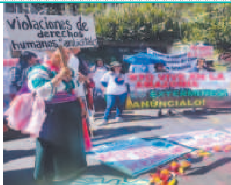
Plantón frente a la Corte Constitucional de Ecuador.