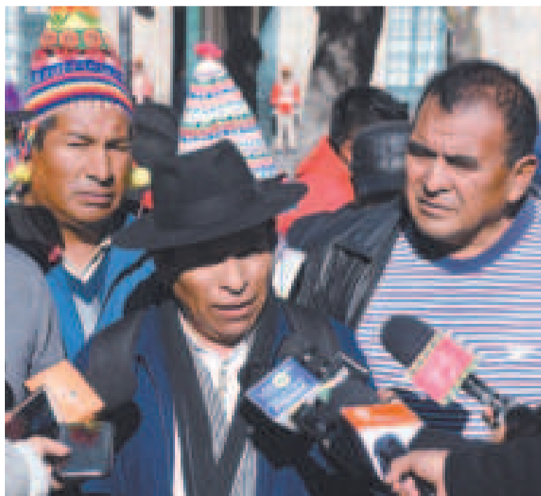
La dirigencia de la CSUTCB en conferencia.