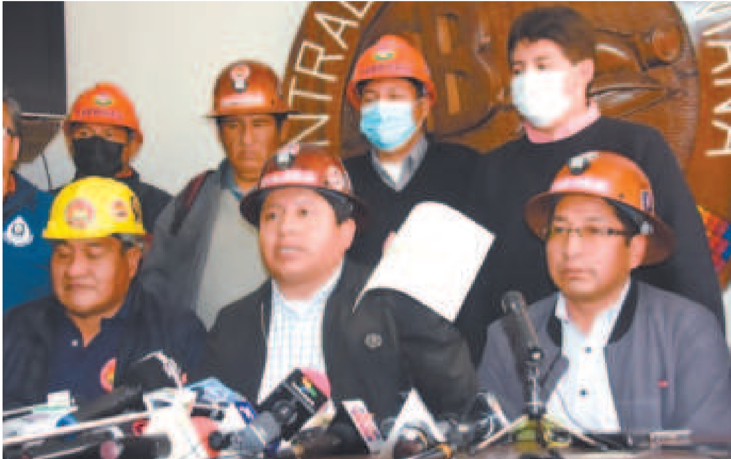
Dirigencia de la COB.