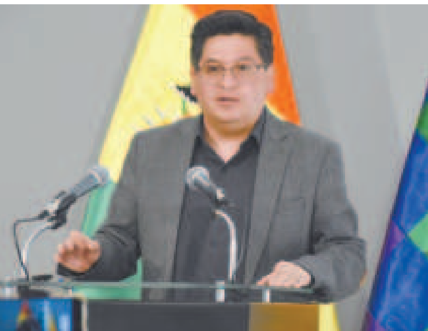
El ministro de Economía y Finanzas Públicas, Marcelo Montenegro, en conferencia de prensa.

nente de la compensación de cotizaciones mensual, el ajuste anual del 2,72% en función a la variación de UFV a dicho componente, fue otorgado de forma lineal a partir de enero de la presente gestión, en el marco del artículo 11 de la Ley 065 de Pensiones; por ello este sector ya es beneficiado con este incremento.