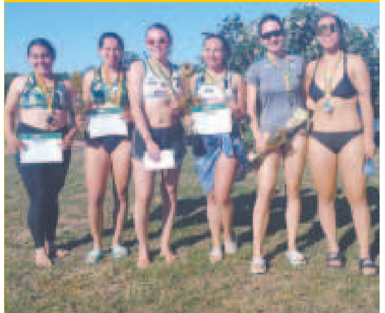
Las duplas ganadoras del primer circuito de voleibol de playa.

El calendario del Consejo Nacional de Voleibol de Playa tiene aprobadas seis etapas, alternará las sedes en Sucre, Santa Cruz y Cochabamba hasta noviembre de este año. Mientras habrá una etapa en la categoría U-17 y otra en U-19, damas y varones, en agosto, en ciudades por definir.