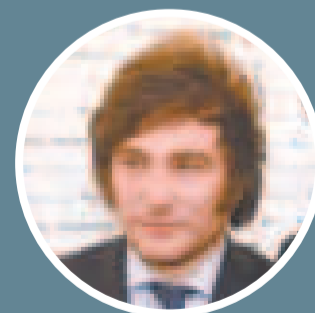
JAVIER MILEI ratificó que avanzará en su plan Motosierra.

No se descartan recortes en organismos descentralizados.