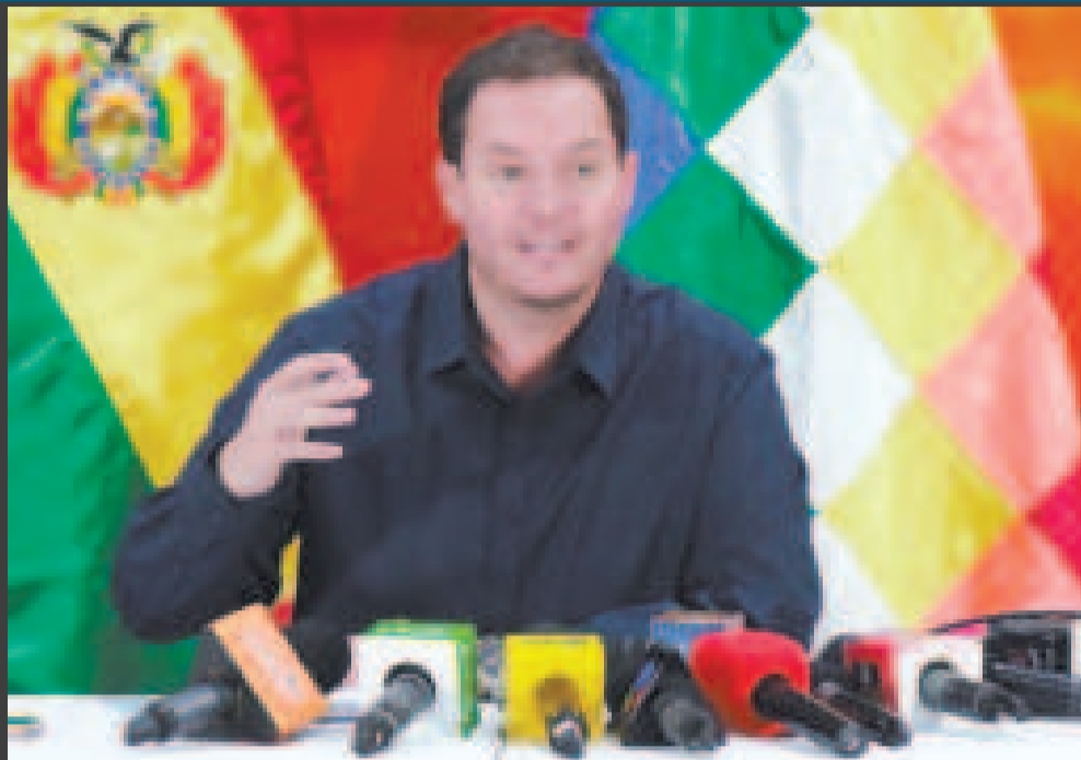
El presidente de la estatal petrolera, Armin Dorgathen, en conferencia de prensa.