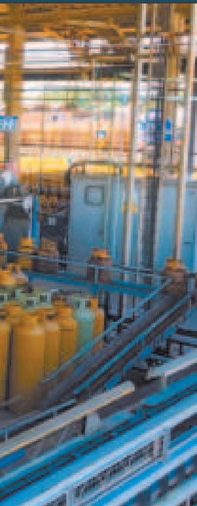
Una de las plantas de engarrafado de GLP en Palmasola, Santa Cruz.