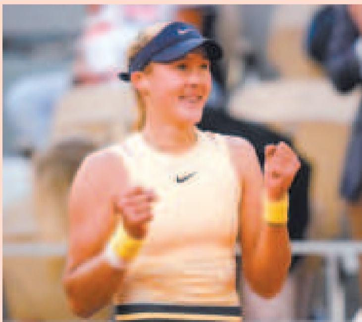
La tenista rusa Mirra Andreeva festeja la victoria ante Aryna Sabalenka.