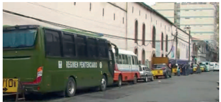
El informe policial señala que la agresión se realizó con un cuchillo de cocina

dica que la agresión se realizó con un cuchillo de cocina, con el cual el acusado infligió una herida cortopunzante en el pecho de la víctima. Tras el ataque, el herido fue trasladado al Hospital de Clínicas, donde falleció debido a la gravedad de sus heridas.