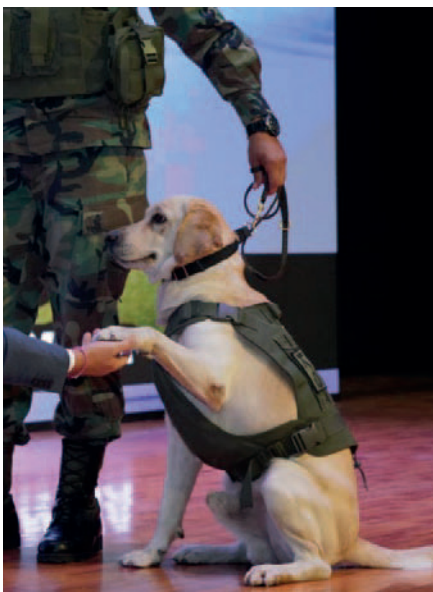
Vico, un can experimentado en la detección de narcóticos

El valor estimado de la droga decomisada asciende a 6.057 dólares, la providencia de esta sustancia se encuentra en investigación.