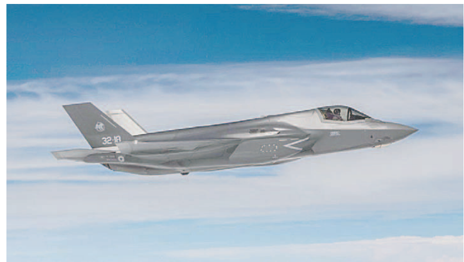
Los aviones Caza F-35 que serán entregados a Israel

LA PATRIA/EFE E l ministro de Defensa israelí, Yoav Gallant, anunció este martes la firma de un nuevo acuerdo con Estados Unidos, a pesar de la polémica en torno al uso de armamento estadounidense en la guerra en Gaza. Este acuerdo incluye la entrega de 25 cazas F-35 a partir de 2028. “Esto envía un poderoso mensaje a nuestros enemigos en toda la región. Me gustaría expresar mi aprecio y gratitud a nuestros socios en el Departamento de