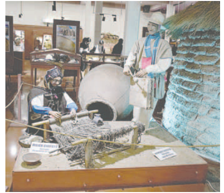
Un total de 34 museos abrirán sus puertas al público orureño