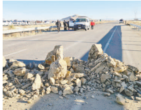
Se retiraron los promontorios de tierra de manera que la circulación sea libre

Los transportistas de Oruro levantaron los bloqueos y despejaron las vías donde se instalaron horas antes, pero pidieron que el primer mandatario atienda sus demandas, que son: