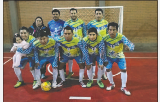
Óptica Medical quiere su primer título en la categoría senior