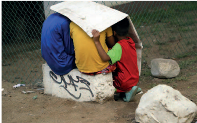
Niños mientras juegan en el parque Monumento a la Madre, en la ciudad de Danlí, al oriente de Honduras

Martínez defendió la prevención como fórmula para garantizar y proteger los derechos de la niñez y la juventud frente a la explotación