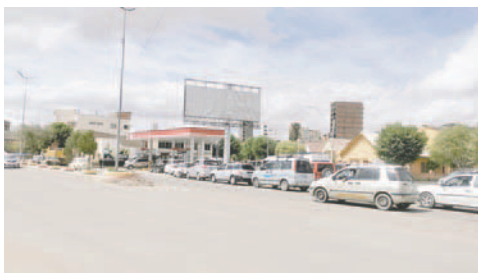
Molestia en los conductores por las filas en los surtidores

Extraoficialmente, desde YPFB indicaron a este medio de comunicación que no hay reducción en la dotación de combustible, sino mucha demanda en algunas jornadas, por lo que se generan largas filas y falta en algunas estaciones, sin embargo, se espera la palabra de una autoridad que pueda negar o confirmar esta aseveración.