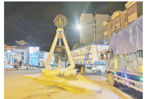
Largas filas ponen de manifiesto la reducción de dotación de combustible

“Cada fin de semana hay filas en surtidores, porque nos han reducido el cupo, ahora indican subvención de combustible evidentemente existe, pero no por el total, porque de acuerdo a la 371 (ley), existe la subvención de un porcentaje, por ejemplo, si cargo 100