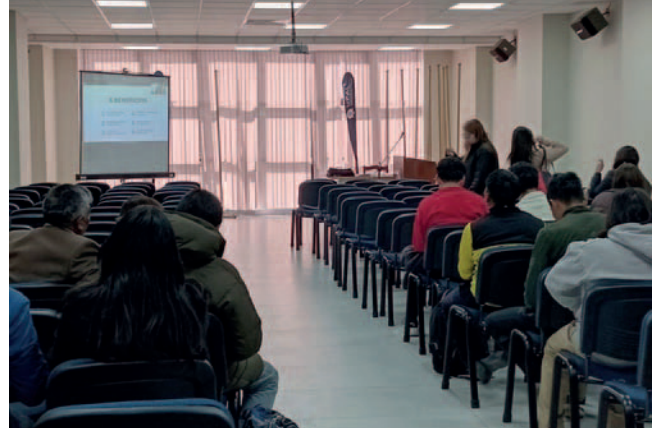
El seminario se realizó en el Auditorio del edificio multinacional de la UPAL