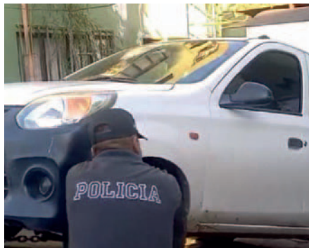
Felcv secuestra y precinta el vehículo del hombre que dio una golpiza a su expareja