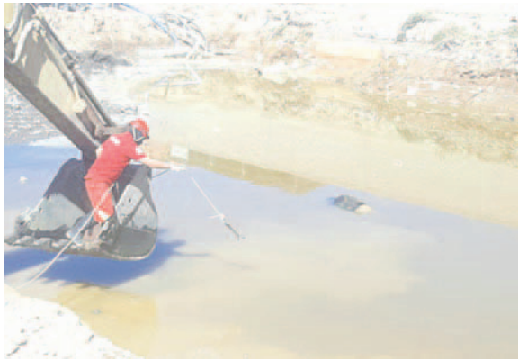
Personal de Bomberos realizó las labores de rescate del cadáver que se encontraba flotando en el río