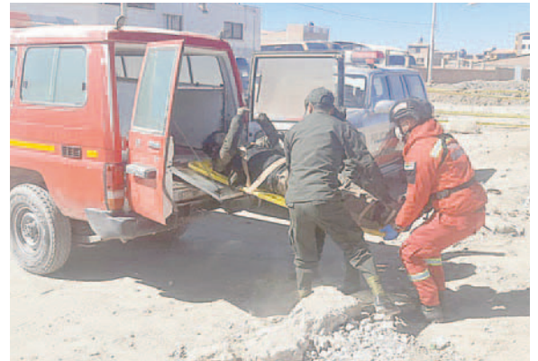
El cuerpo fue trasladado hasta la morgue del Cementerio General donde se realizó la autopsia de ley