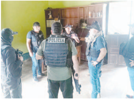
Dos personas fueron aprehendidas ayer en horas de la mañana por efectivos de la Policía Nacional