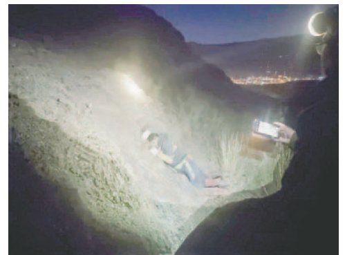
El cuerpo fue hallado en las faldas del cerro Posokoni de Huanuni

Se están tomando declaraciones de varios testigos y analizando otros elementos relacionados con el caso. A medida que avancen las investigaciones, se verificarán detalles como el estado de la ropa de la víctima y la posible entrada a los parajes del Posokoni.