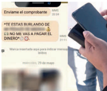
La mujer que accedió a un préstamo de 1.500 bolivianos ahora enfrenta amenazas de muerte /REFERENCIAL

Días atrás, la Policía desbarató un grupo criminal que ofrecía montos de dinero como préstamo a través de cuatro aplicaciones. Para acceder, la víctima debía aceptar cláusulas, pero al hacerlo, las apps se apoderaban de todos los datos del teléfono celular de las personas, incluyendo contactos, fotos, cuentas bancarias y otros, que eran utilizados para la extorsión.