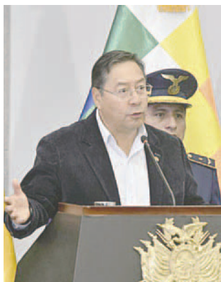
Luis Arce, presentará el modelo económico implementado en el país

Arce entregó simbólicamente el “bastón de mando” al vicepresidente David Choquehuanca, quien asumirá la presidencia interina durante la ausencia del mandatario. La Presidencia boliviana no ha detallado la agenda completa de Arce en Rusia,