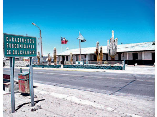
El hecho ocurrió en la madrugada de este martes en una celda de Carabineros de Chile, en Colchane