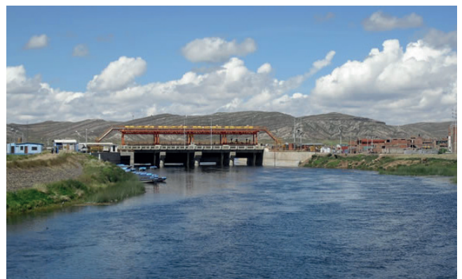
Desaguadero, zona fronteriza con Perú

Justamente el Comité de Apoyo a la Producción, Comercialización y Lucha Contra el Contrabando decidió intensificar controles en las fronteras con Argentina, Brasil y Perú,