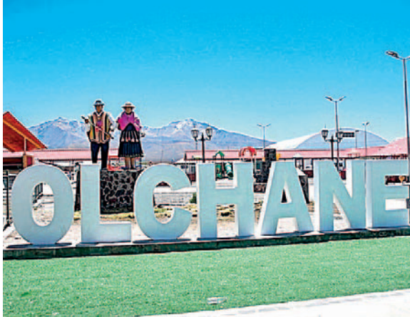
Autoridades de la municipalidad de Chile se encuentran preocupados por este hecho

El médico general de zona asignado al Consultorio Ge-