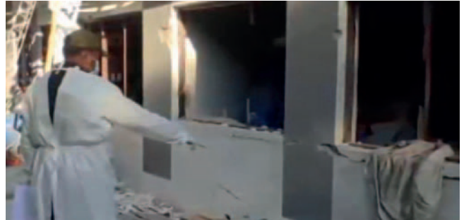
La Policía comenzó con las investigaciones del caso /CAPTURADA

La segunda víctima, que había trabajado en el sector durante 20 años, había regresado al trabajo el lunes tras unas vacaciones. “Es obrero, estaba antes en Potosí y lo han traído aquí. Estaba de vacaciones,