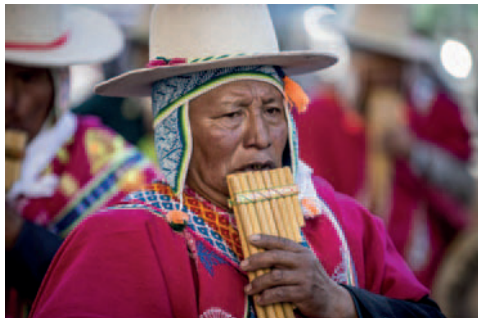
Comunarios participarán en la celebración del Año Nuevo Andino