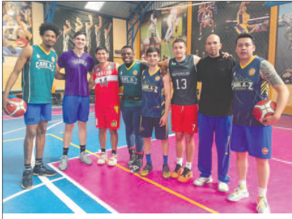
Carl A-Z debe ganar si o si esta noche para mantenerse en zona de clasificación / LA PATRIA

El equipo orureño de Carl A-Z viene de ganar a Saracho victoria que subió los ánimos en el cuadro de la zona de Huajara para mantener intacta su chance de clasificar