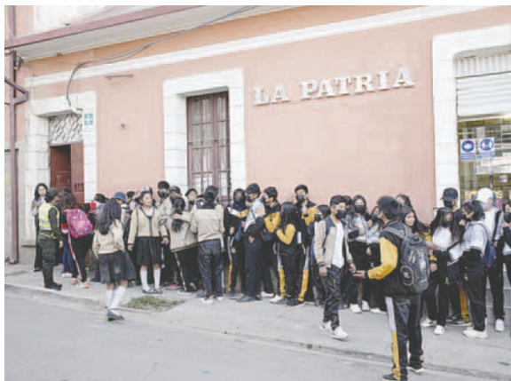
El Museo Gráfico de LA PATRIA abrirá sus puertas desde las 16:00 horas