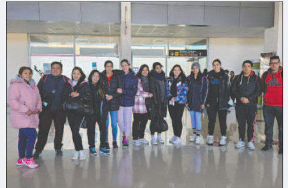
América ya se encuentra en la sede del torneo nacional clasificatorio