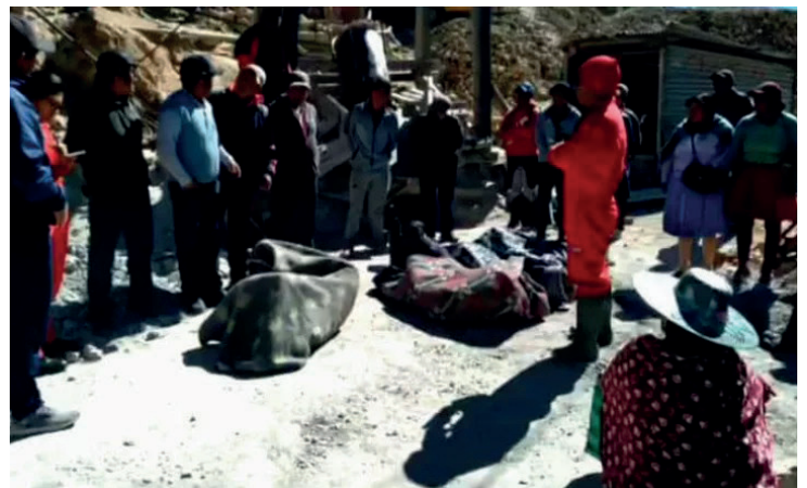
Después de más de 24 horas los cadáveres fueron rescatados del interior de la mina

“Los tres mineros ingresaron a la mina el viernes. Le dijeron al sereno que iban a trabajar hasta el día siguiente. Luego de percatarse de que el vehículo de la cooperativa continuaba, ingresó a la mina y encontró los cuerpos sin vida. El equipo de bomberos, después de un arduo trabajo de 24 horas, rescató los tres cuerpos”, informó el director de la Fuerza Es-