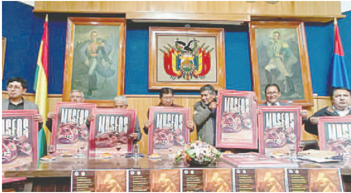
Las autoridades municipales y de la UTO realizaron la presentación oficial del Día de Museos

En total, participarán 34 museos y centros culturales, ocho más en comparación al 2023, dos de los cuales son de la localidad de Machacamarca y Sora. “Esto