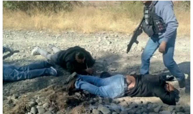
Los delincuentes fueron interceptados por agentes de la Felcc

Este arresto marca la segunda vez que estos individuos, conocidos como ‘monrreros’, son detenidos por actividades delictivas. En febrero pasado, miembros de esta misma banda robaron más de 100 mil bolivianos en una casa en el mu-