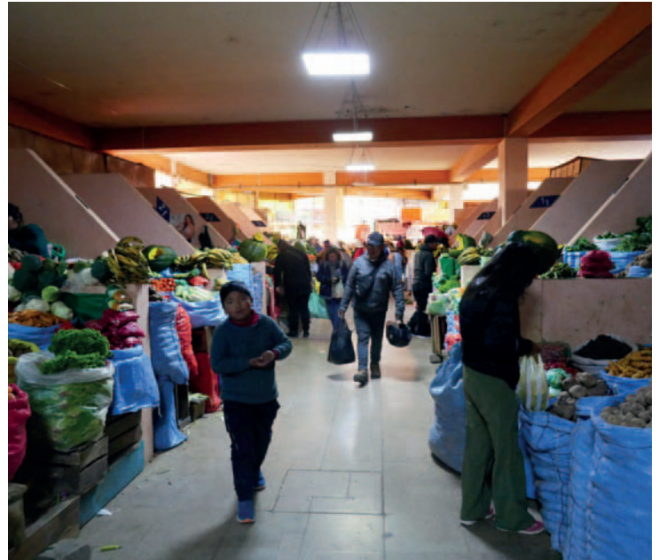
Alza de precios particularmente del tomate, preocupa a la población orureña

La preocupación por el precio del tomate y otros productos, ha generado molestia en varias personas que piden políticas de estabilidad de precios, así como en algún caso, incentivo para mejorar las condiciones de los productores locales en Oruro y con ello dejar la dependencia de algunos alimentos e insumos.