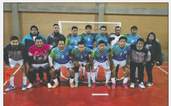
Quiroziñhos validó su condición de candidato al título

Los partidos a jugarse esta noche son: a las 20:50 horas ELT Peña vs. Trapp FC por el tercer lugar, a las 22:00: Quiroziñhos vs. Óptica Medical por el título.