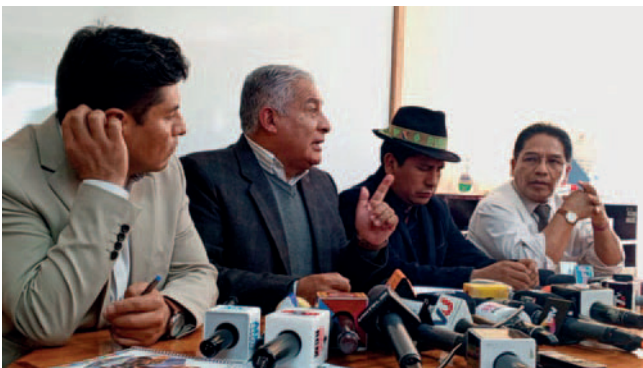
Cuatro viceministros analizan el tema y explicaron la situación