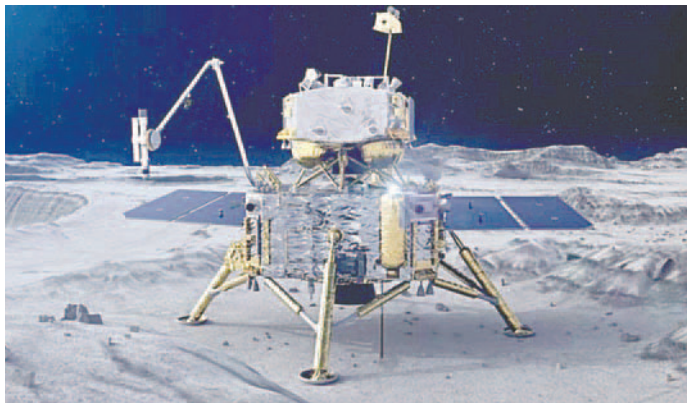
China lanza la misión Chang'e 6, la primera que traerá muestras de la cara oculta de la Luna

Según la Administración Nacional del Espacio de China (CNSA), se cal-