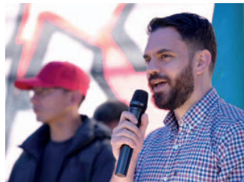
El ministro de Gobierno, Eduardo del Castillo

Durante los recientes operativos en el Trópico de Cochabamba, dirigentes de las Seis Federaciones de cocaceros cuestionaron las intervenciones de la Felcn y consideraron que se busca "estigmatizar" ese sector.