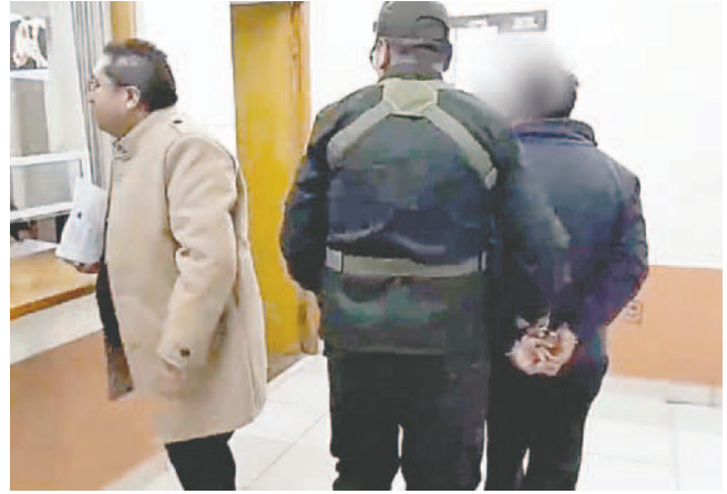
El acusado fue cautelado por un juez y remitido a prisión preventiva

Como resultado de las diligentes acciones de los agentes de la Felcv y las autoridades pertinentes, el