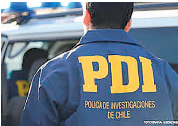
Agentes de la PDI de Chile investigan el hecho /REFERENCIAL

El fiscal Milton Torres, en conversación con este medio, informó sobre las diligencias instruidas por el fallecimiento de un ciudadano boliviano en el calabozo de Carabineros en Colchane, luego de ser detenido junto a su acompañan-