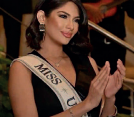
La Miss Universo Sheynnis Alondra Palacios está en Bolivia