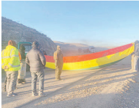
Transporte Pesado entra en cuarto intermedio tras dos días de bloqueo

“Nosotros, como Oruro, vamos a respetar. Hasta el 14 de junio es el plazo que tiene el Presidente Luis Arce para convocarnos; caso contrario, ya asumiremos una medida indefinida,