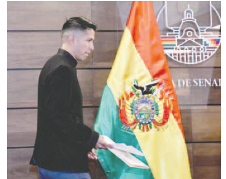
Presidente de la Cámara de Senadores, Andrónico Rodríguez