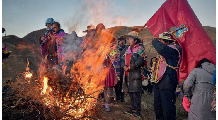
El ritual del solsticio de invierno se llevará a cabo el 25 de junio a las 06:00 en el cerro de la víbora

En el Año Nuevo Andino también se celebra el solsticio de invierno austral, marcando el día más corto y la noche más larga en el Hemisferio Sur. La festividad ha evolucionado con criterios inclusivos a lo largo del tiempo, pasando por distintas denominaciones hasta consolidarse como Año Nuevo Andino. Además, que el 21 de junio fue declarado festivo mediante un decreto promulgado en 2009.