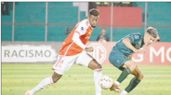
Tomayapo se despide sin pena ni gloria del torneo internacional

Con ocho puntos, Internacional igualó con Delfin. Ambos equipos jugarán el sábado 8 de junio el cotejo determinante en territorio brasileño, el ganador quedará como segundo e irá al play off por la clasificación a los octavos de final de la Sudamericana.