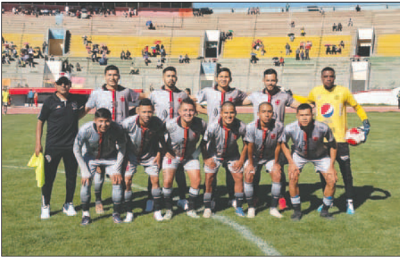
Unión Huayllamarca quiere reponerse de su mal momento