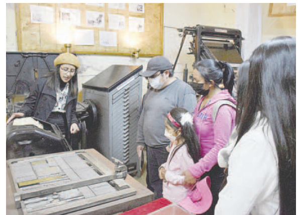
Los visitantes podrán conocer detalles sobre la historia del Matutino LA PATRIA