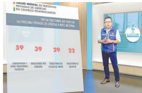
El informe revela que el 28,5% de los privados de libertad diagnosticados padecen esquizofrenia

El informe revela que el 28,5% de los privados de libertad diagnosticados padecen esquizofrenia u otros trastornos psicóticos. Después de La Paz, Cochabamba alberga la segunda mayor cantidad de individuos con trastornos mentales, 31; seguido por Santa Cruz con 20, Chuquisaca