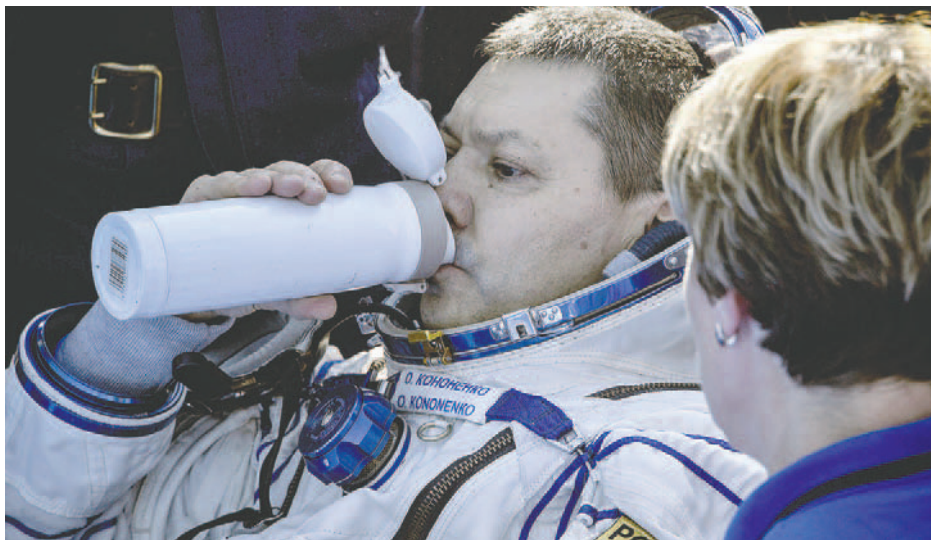
El cosmonauta ruso Oleg Kononenko

que nació en la antigua república soviética de Turkmenistán, ha realizado cinco misiones en la EEI (2008, 2011, 2015, 2018 y 2023) fue Ingeniero de la expedición número 70 y comandante de la 71, asimismo, también ha