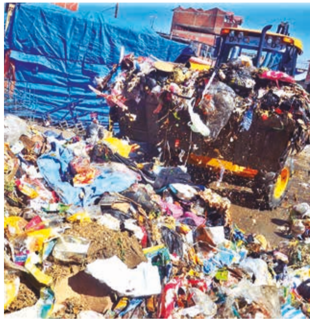
La basura que perjudicó a Quillacollo. DANIEL JAMES

to con los distritos como con las organizaciones sociales y hemos dicho que por factor tiempo no vamos a empezar con los bloqueos, pero si amerita podríamos la próxima se-