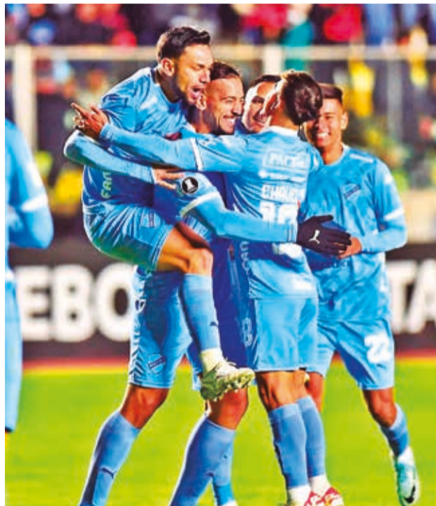
Jugadores de Bolívar festejan la victoria sobre Palestino, ayer.