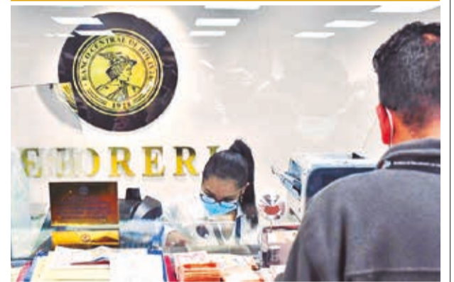
Oficinas del BCB en la ciudad de La Paz.

Asimismo, reportó que las utilidades del sistema financiero aumentaron en 98 por ciento desde marzo de 2021 a marzo de 2024 y un 9 por ciento en comparación a marzo de 2023. Se prevé que las utilidades lleguen a 2.300 millones de bolivianos hasta diciembre.