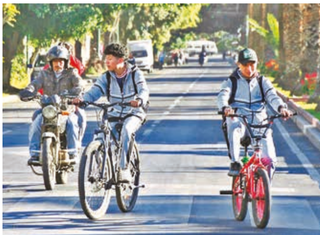
Personas circulan en bicicletas y motocicletas, ayer.

Apunte. Los dirigentes de los transportistas reportaron que no hubo ningún incidente en la jornada de paro. A las 10:00 de hoy, Fedjuve entregará el cronograma para la socialización del estudio de costos