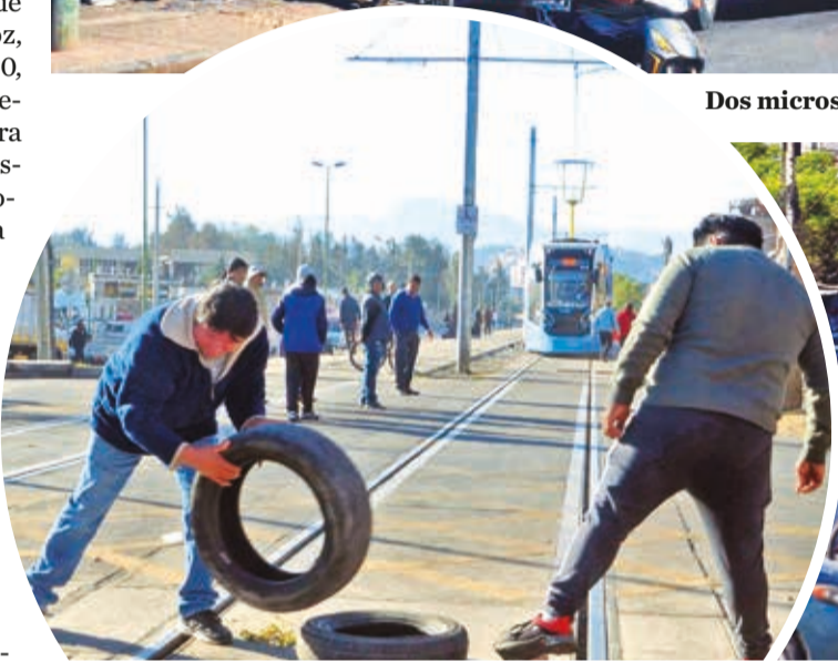
Choferes colocan llantas en la vía del tren. HERNÁN ANDÍA