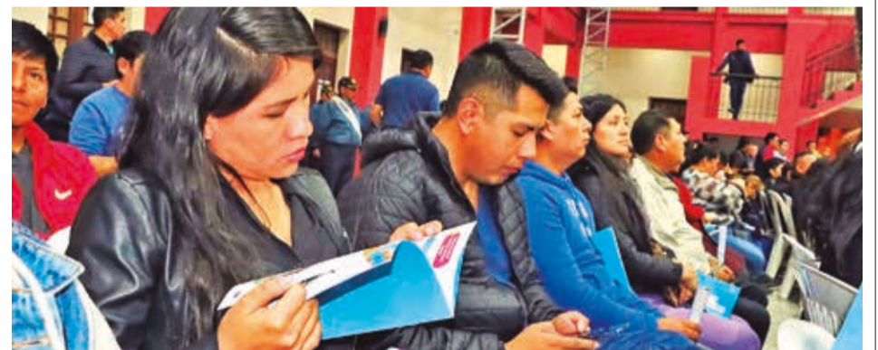
La presentación de la Carta Orgánica de Cochabamba. CONCEJO MUNICIPAL

Entre tanto, el arzobispo de Cochabamba, Oscar Aparicio, invitó a los feligreses a vivir la festividad religiosa con una misa que se realizará a las 9:00 en la Catedral Metropolitana y procesión por el centro de la ciudad, en la que se apreciarán los mosaicos armados por estudiantes de 30 colegios.