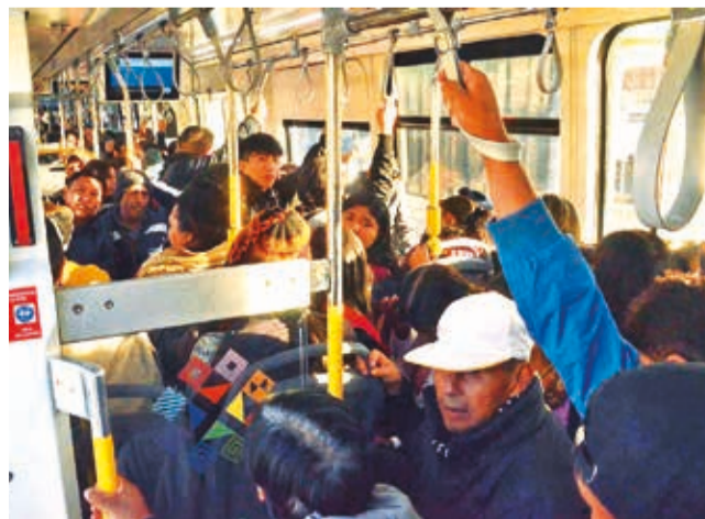
El Tren Metropolitano con gran afluencia de usuarios.