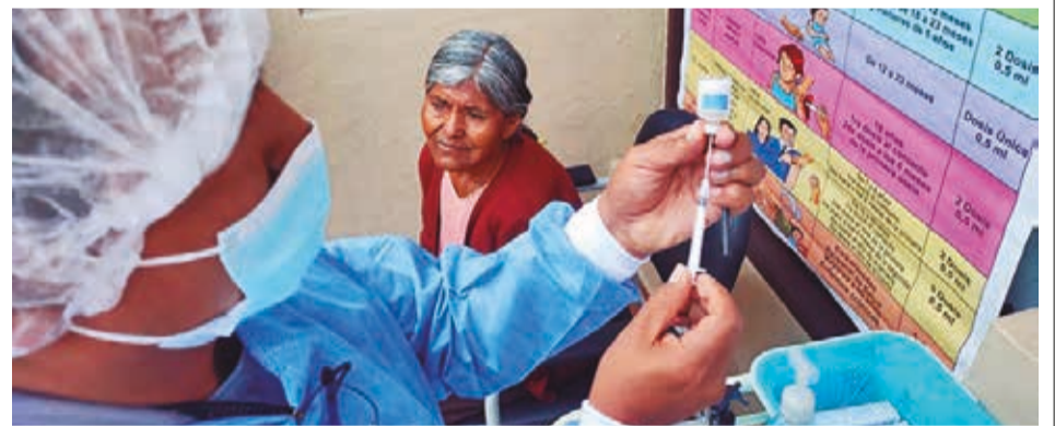
La vacunación contra la influenza en Cochabamba. DANIEL JAMES

Para disminuir la mortalidad materna infantil y la desnutrición crónica en niños, el Gobierno entregará un bono como incentivo por cumplir con cuatro controles prenatales y el parto en un centro público.