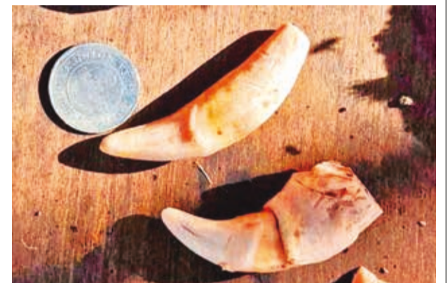
Los colmillos extraídos al jaguar.

Osco explicó que se presume que los responsables incurrieron en el delito, porque retiraron el cuero, las patas, colmillos e hicieron desaparecer el resto del cuerpo del jaguar luego del supuesto atropello.