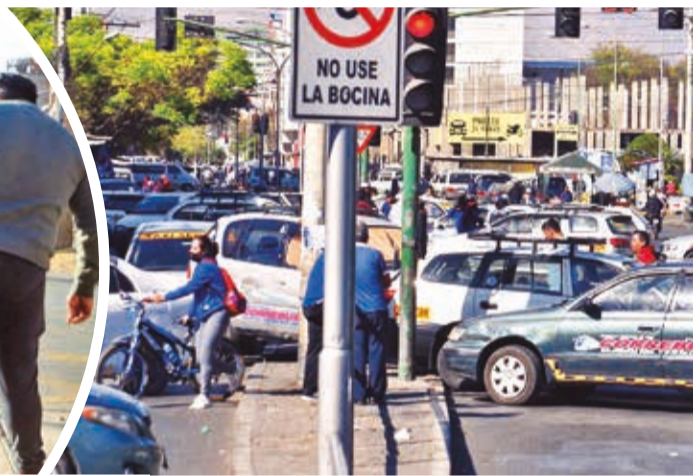
Radiotaxis bloquean la avenida Ayacucho, ayer.