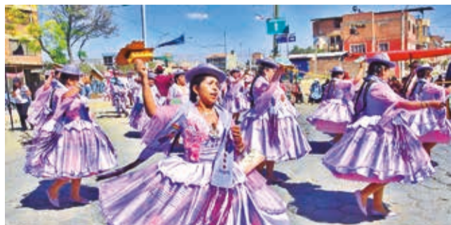
Participantes de la festividad de Urkupiña. HERNÁN ANDÍA

Actividades. Los devotos podrán celebrar Corpus Christi con misas, procesiones y con los mosaicos florales armados por escolares