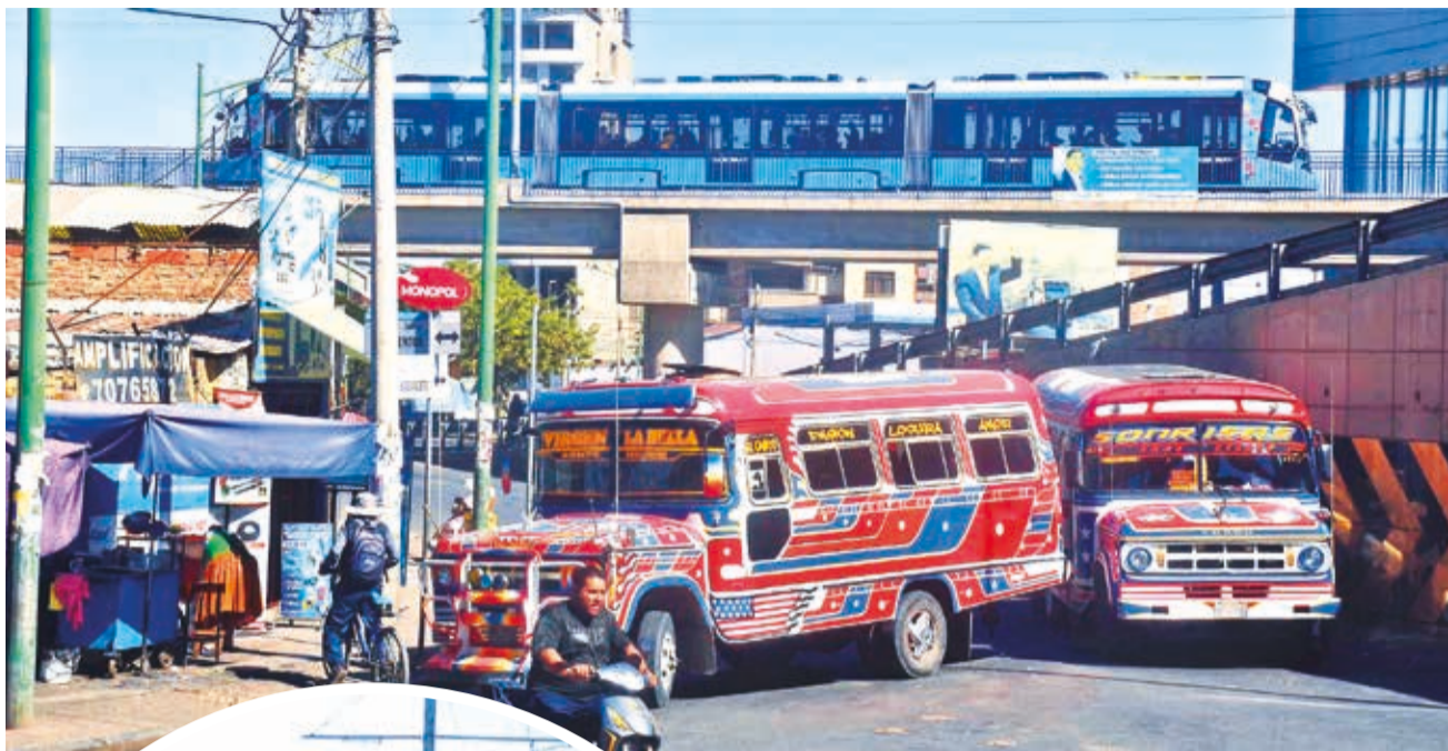
Dos micros bloquean el paso en uno de los viaductos.