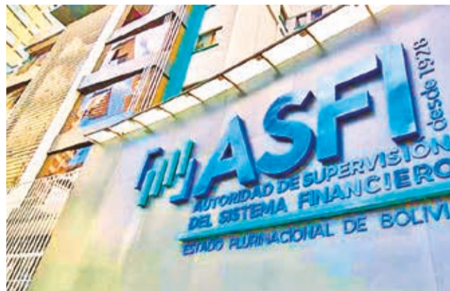
Funcionarios de la ASFI en conferencia de prensa, ayer. RRS5

Dato. Asoban reportó $us 1.093 millones de retiro de los depósitos, en un contexto de falta de divisas y caída de las RIN