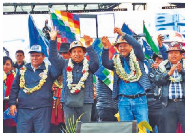
Militantes del MAS en el congreso de El Alto.

zó el registro del congreso del MAS convocado por el Pacto de Unidad y realizado entre el 3 y 5 de mayo en El Alto, que eligió al dirigente campesino Grover García, como presidente del Instrumento Político. El TSE argumentó que el evento no cumplió con las previsiones del Estatuto del MAS, entre ellas el consenso con la actual directiva del Instrumento Político a la cabeza de Evo Morales.