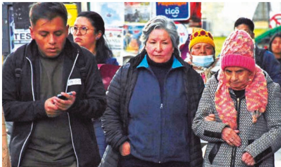
Gente abrigada en las mañanas en los umbrales de invierno.

"Si adelantan las vacaciones, el regreso a clases sería antes de julio y las tempera-