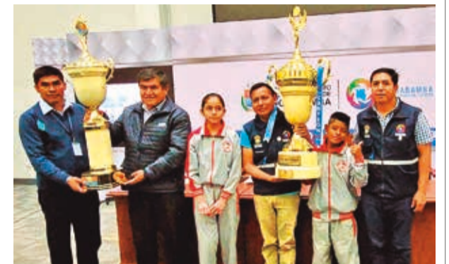
Presentación de las copas rotativas de los Juegos Estudiantiles de la Integración 2024. DIDEDE