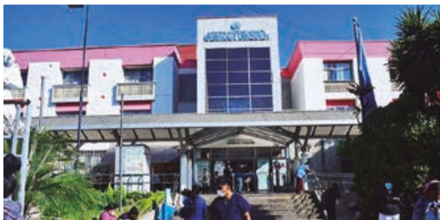
El ingreso al hospital materno infantil. C. LÓPEZ

Incentivo. El Gobierno entrega un bono como un incentivo para que las gestantes que no tienen un seguro acudan a sus controles