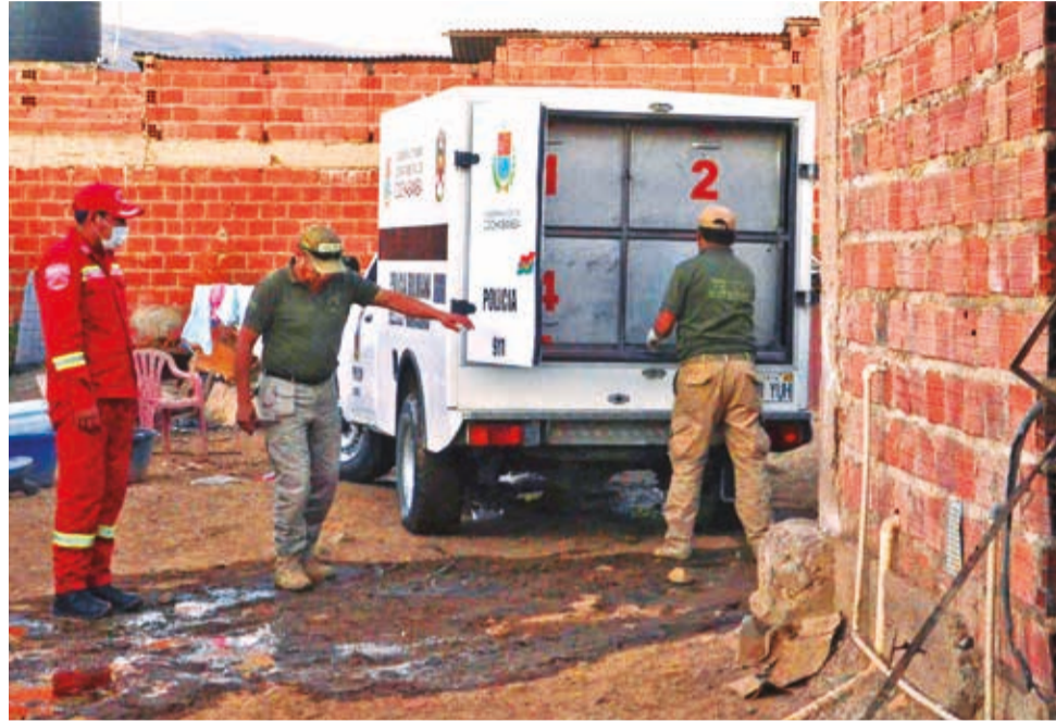
Los bomberos y personal de homicidios en la vivienda, ayer en Sacaba. HERNÁN ANDÍA

La niña fallecida fue trasladada al Instituto de Investigaciones Forenses (IDIF), por la Policía de homicidios de la Fuerza Especial de Lucha Contra el Crimen (Felce).