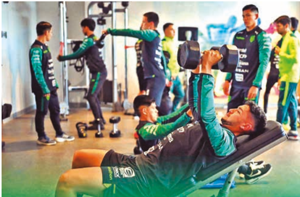
Trabajo de los seleccionados nacionales en gimnasio, ayer.

De los 72 millones, 40 serán repartidos en las otras fases de la Copa América, como cuartos de final, semifinales y la fi-