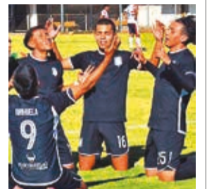
Festejo de Millonarios, en el triunfo ante Happ.