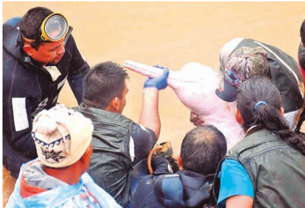
Los delfines, madre y cría, liberados el viernes en el río Isiboro. DANIEL JAMES

dina con los pescadores para evitar la captura de los delfines y el uso de mallas que los lastimen. También se capacitará a las alcaldías con el pro-