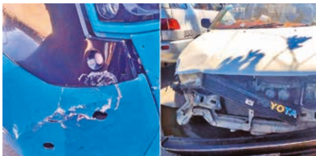
El accidente del tren en la línea verde, el sábado. MI TREN

Casos. Este año, la operadora de Mi Tren reportó dos incidentes, uno sobre la vía en placa y otro de un choque con una vagoneta