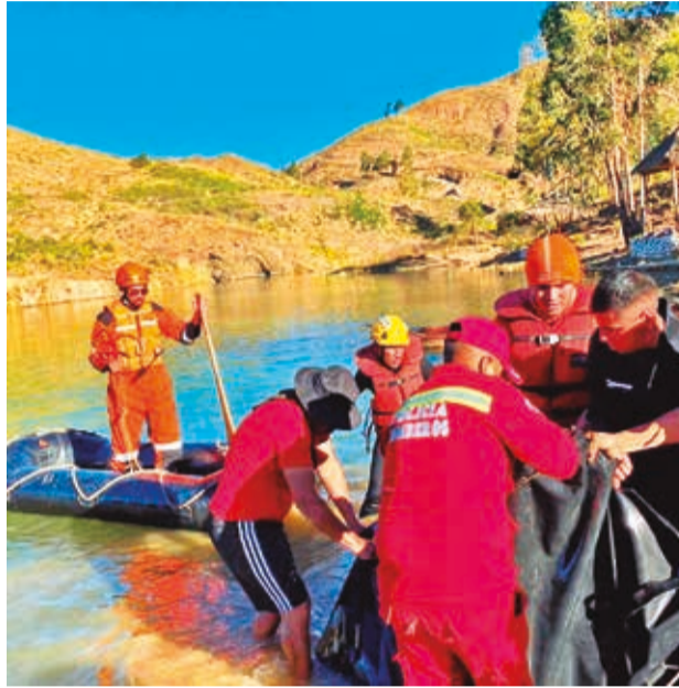
Los rescatistas en la búsqueda, ayer en Tarata. SAR BOLIVIA

“A las 15:23 se realiza el primer ingreso del bote Zodiac para medición de la zona y entrada de buzos, donde ha-