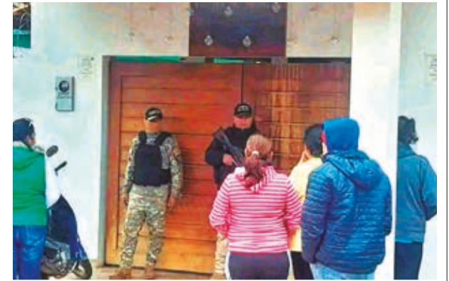
Los vecinos en el restaurante, el domingo en Beni. LT

Por su lado, el subcomandante indicó que el cuerpo fue llevado a la morgue para su autopsia.