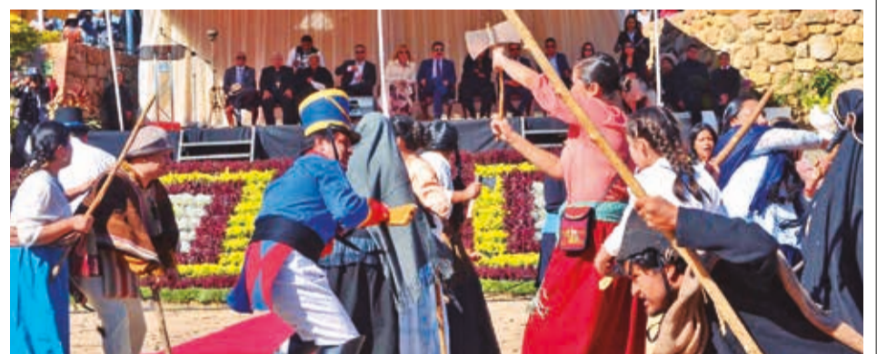
La escenificación de la batalla de las Heroínas de la Coronilla. HERNÁN ANDIA

Después de cada incidente, indicó que se activa un procedimiento de emergencia que incluye una evaluación y la presencia de un abogado. Posteriormente, intervienen Tránsito y la fiscalía para iniciar un proceso por daños a la propiedad del Estado. “Las personas reponen todos los daños que han causado”, subrayó.