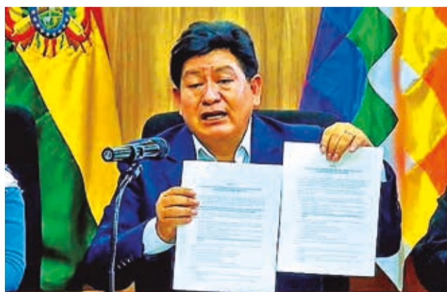
Edgar Montaña, ministro de Obras Públicas, ayer.

cional e internacional exige la abrogación del Decreto Supremo 5146 del 12 de abril y la Resolución Ministerial 090/2024; además, demanda al Gobierno que garantice la disponibilidad de dólares en el país y el abastecimiento de combustibles.