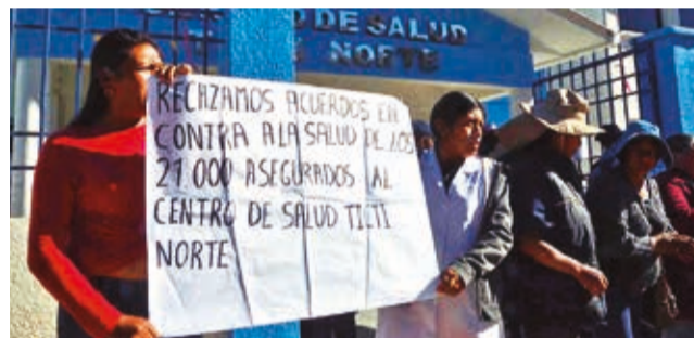
Vecinos protestan contra el traslado del pediátrico.