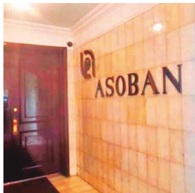
Oficinas de Asoban. RRSS

“La mayor demanda de dólares del público y su efecto en los saldos de depósitos en moneda extranjera, en un contexto de menores RIN se constituye en un desafío para el sector bancario cuya prudente administración ha permitido atender la demanda del público”, señaló Asoban en su informe.