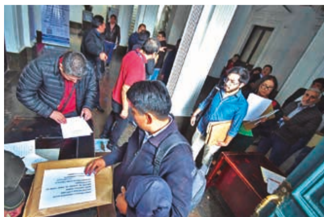
Miembros de comisión reciben los documentos de los postulantes al Órgano Judicial.

De acuerdo con la Sentencia Constitucional Plurinacional 0191/2024-S2, del 23 de mayo de 2024, se revoca la Resolución AP N° 004/2024 de 30 de abril de 2024, emiti-