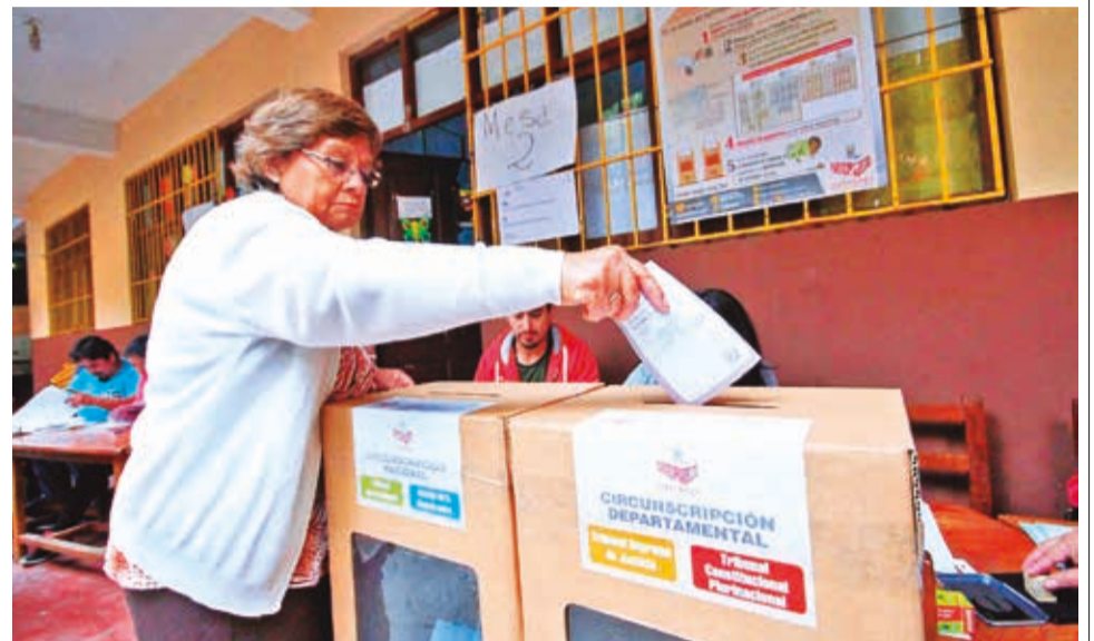
Ciudadanos de Cochabamba votan durante las elecciones judiciales de 2017. APG

La Presidencia de la ALP emitió notas a las Comisiones Mixtas: de Justicia Plural, Ministerio Público y Defensa Legal del Estado, y de Constitución, Legislación y Sistema Electoral, para reiniciar y continuar de manera inmediata el proceso de preselección de candidatas y candidatos rumbo a las elecciones judiciales 2024.