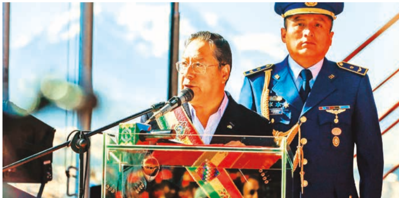
El presidente Luis Arce en su discurso en el 115 aniversario de los Colorados de Bolivia.

Los precios de algunos productos han subido en las recientes semanas, así como la oferta de éstos debido a la dificultad de los importadores