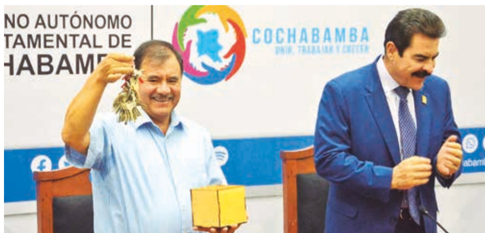
Gobernador y Alcalde firman el comodato para el traslado del hospital del niño. H. ANDIA