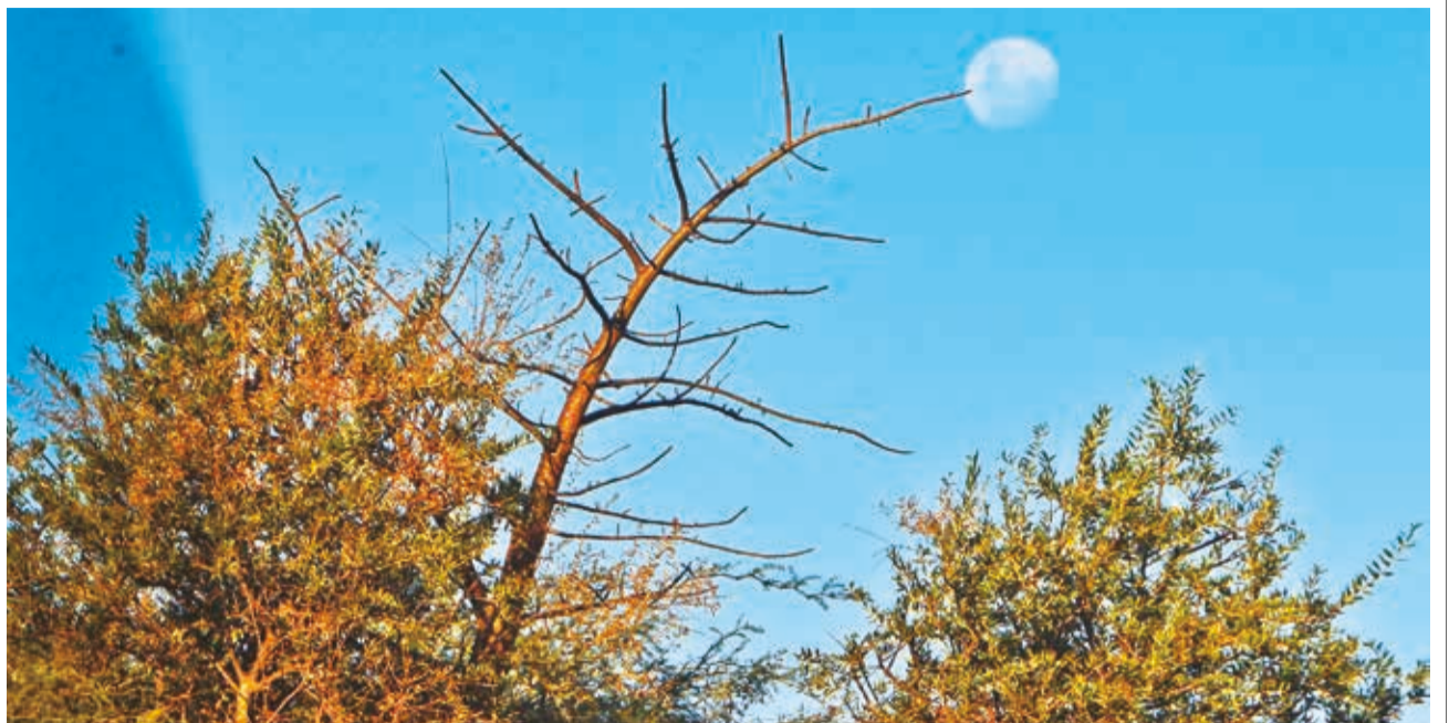
CREPÚSCULO. La luna luce brillante en el atardecer cochabambino. La imagen fue tomada desde el sector de Cotapachi, en Quillacollo.

ENVÍE SU FOTO PARA PUBLICARLA EN ESTA SECCIÓN A: fotografia@lostiempos-bolivia.com