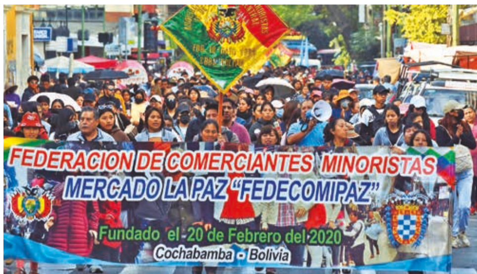
Marcha de gremiales contra decretos del Gobierno, la semana pasada.

También rechazan el proyecto de ley 145, que contempla operativos en los comercios y depósitos de los gremiales por los funcionarios de la Aduana Nacional.