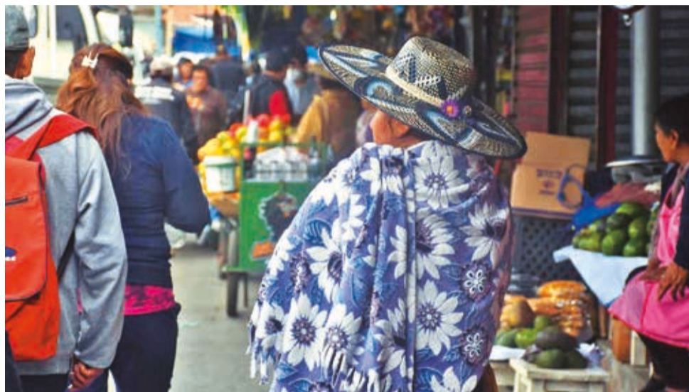
Ciudadanos en Cochabamba optan por usar ropa abrigada para combatir el frío.

En Cochabamba, el director departamental del Senamhi,