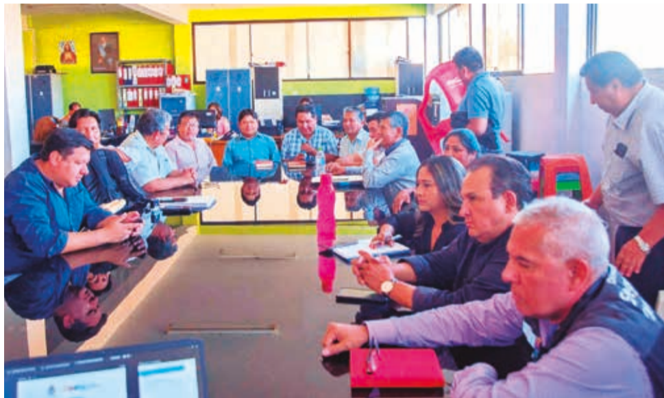
La reunión del Comité Municipal de Transporte, el martes. GAMC

“Acudimos el jueves a la sede de la OTB San Marcos, distrito 9, hemos estado con el control social, Fedjuve y las comunidades y hemos encontrado