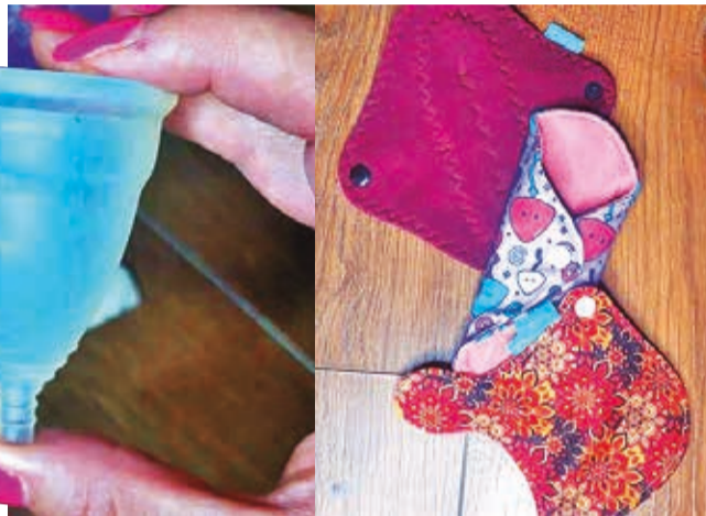
Productos. Copa menstrual y toallas de tela reutilizables. LOS TIEMPOS

Las toallas higiénicas desechables y los tampones no son los únicos productos utilizados