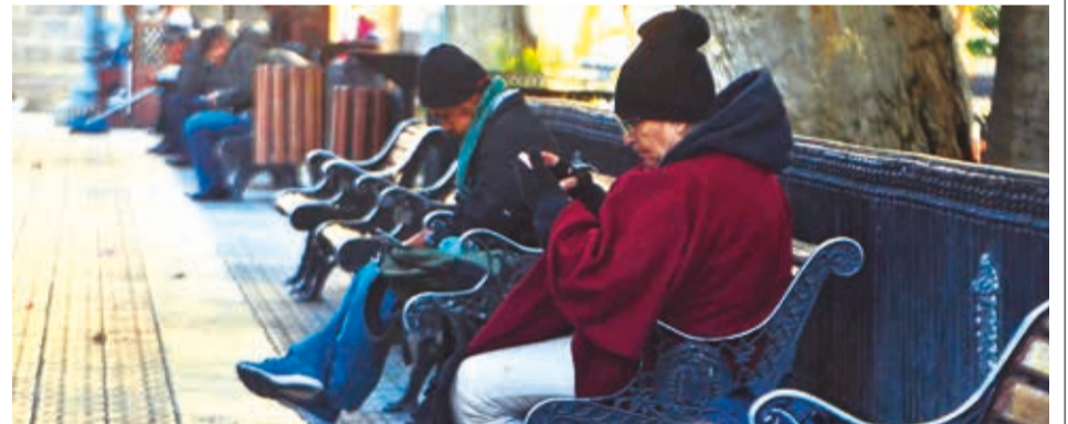
Las personas caminan más abrigadas por la baja de temperaturas.

La situación de la represa La Angostura preocupa a la Gobernación. Equilea dijo que el almacenamiento es de 3.40 metros de altura y aún se prepara un cronograma de turnos para regar la producción de valle central y bajo de Cochabamba.