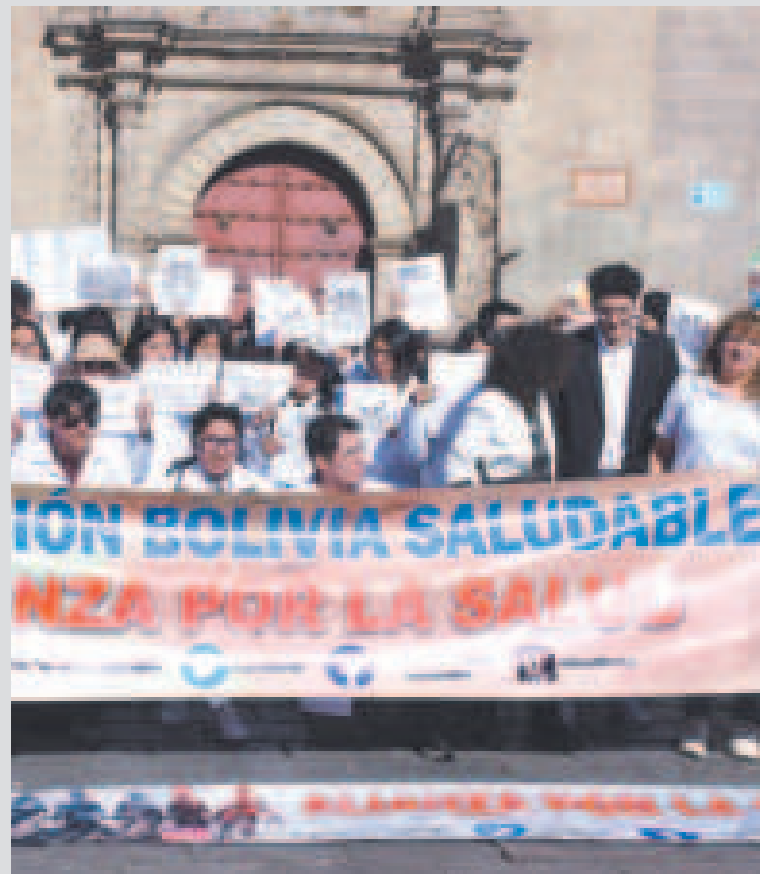
La marcha contra el tabaco en la plaza San Francisco.

Este año, a través de la representación de la OMS en el país, se lanzó el Curso de Intervenciones Breves sobre el Tabaco para fortalecer las habilidades técnicas del personal de salud: médicos, enfermeras, trabajadoras sociales, psicólogos, entre otros.