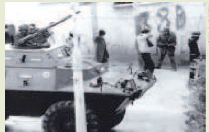
Dictaduras militares en el periodo 1964-1982.

Explicó que la determinación fue asumida en el documento de opiniones procuradurales especializadas, que fue elaborado por la Procu-