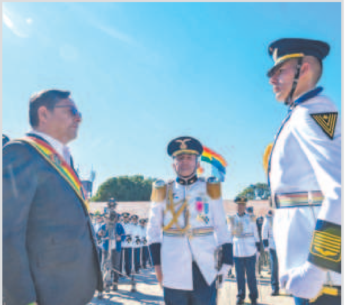
El presidente Luis Arce durante el aniversario 72 del Colegio Militar de Aviación.

“Nuestro modelo implica una mirada multidimensional”, remarcó el Presidente con referencia a la transformación de materias primas en productos finales para la exportación, como parte de su visión para el desarrollo económico y social de Bolivia.