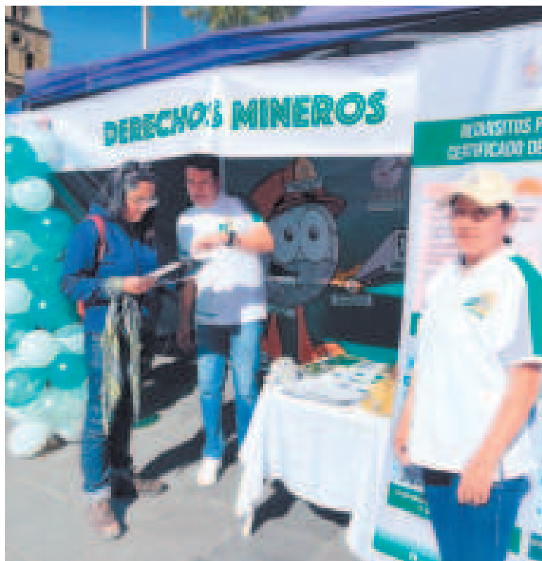
El personal de la AJAM en la feria.