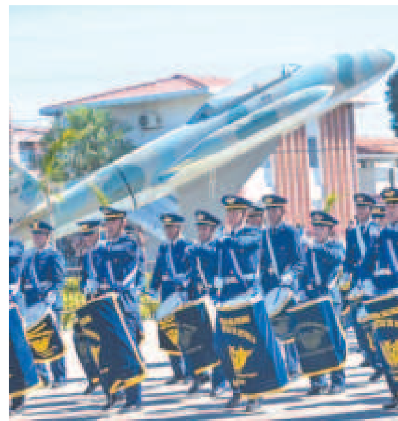
La banda militar de la Fuerza Aérea Boliviana durante su aniversario.

una institución de gran importancia por su B y su contribución al desarrollo nacional.