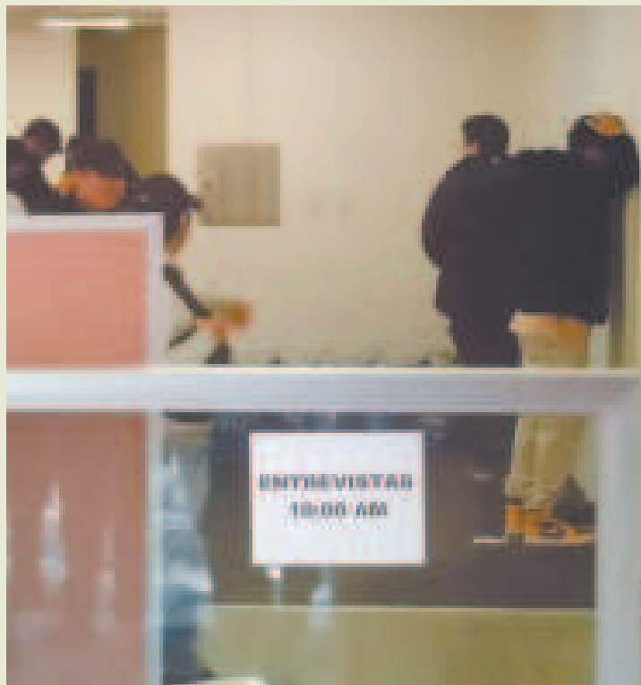
Una ciudadana colombiana es arrestada sindicada de ciberestafa.