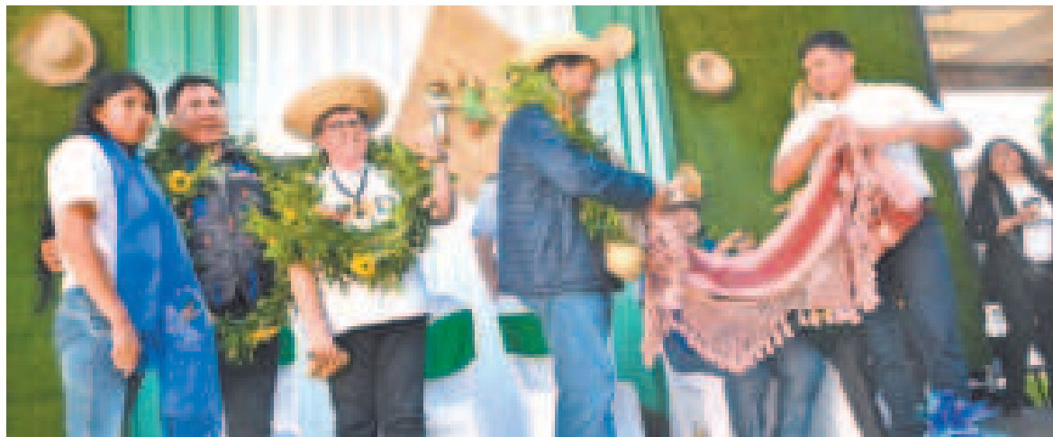
Productores cruceños entregan muestras de cariño al presidente Arce.

“Esta es una muestra de que el Modelo Económico Social Comunitario Productivo funciona, Presidente, porque esto nos permitirá aportar en muchos de los casos con la materia prima que nuestras plantas industriales que se están construyendo demandan”, precisó Navia.