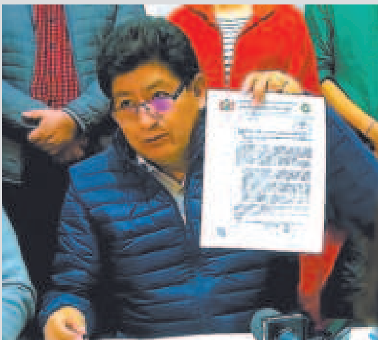
El ministro de Obras Públicas, Édgar Montaño, en conferencia de prensa.