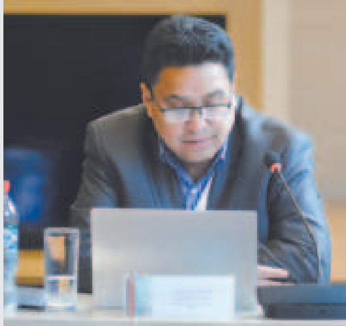
El procurador general del Estado, César Siles, en conferencia de prensa.

"El señor Evo Morales ya se presentó a una reelección en Bolivia, ya no tiene opción a más, pues hay una sentencia constitucional y la opinión consultiva de la Corte-IDH, que determina que la reelección en el país está prevista en el artículo 168 de la Constitución, que dice una vez de forma continua, por tanto, ahí se termina la discusión, por lo menos desde el punto de vista técnico y legal", expuso Siles en conferencia de prensa.