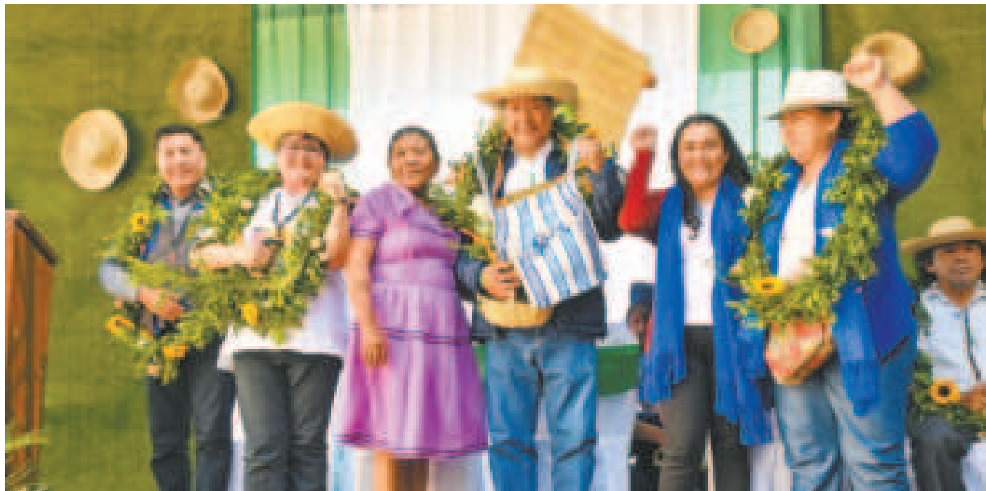
El presidente Luis Arce entrega la personería jurídica a las productoras beneficiadas.