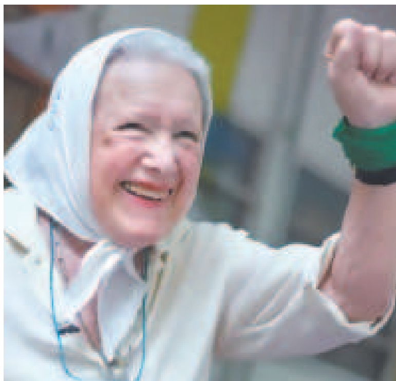
Nora Cortiñas en una gráfica de archivo.