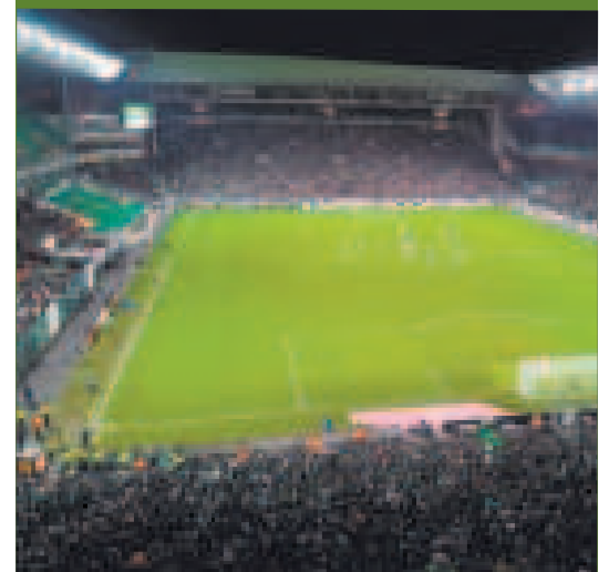
Estadio Geoffroy-Guichard de Saint-Etienne, Francia

Como ha informado el medio británico The Guardian, Francia ha sido blanco de ataques islamistas durante los últimos 10 años por individuos motivados por Al Qaeda o el Estado Islámico (EI). En octubre del año pasado, un joven radicalizado de 20 años también checheno, que había jurado lealtad al EI, mató a un maestro en la ciudad de Arras, en el norte de Francia. Además, los Juegos Olímpicos también han sido atacados en el pasado, el más infame en 1972 en Múnich y nuevamente en 1996 en Atlanta.