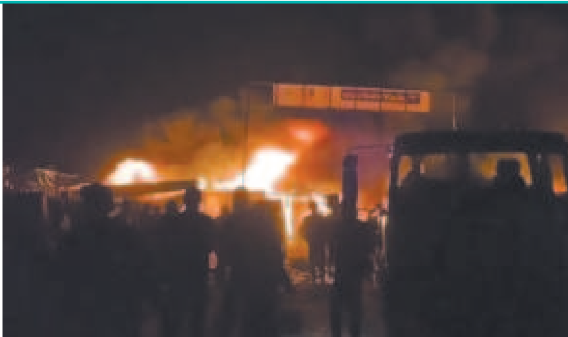
Bombardeo israelí a un campo de refugiados.

En los textos, los sospechosos intentaban intimidar los dando detalles sobre la