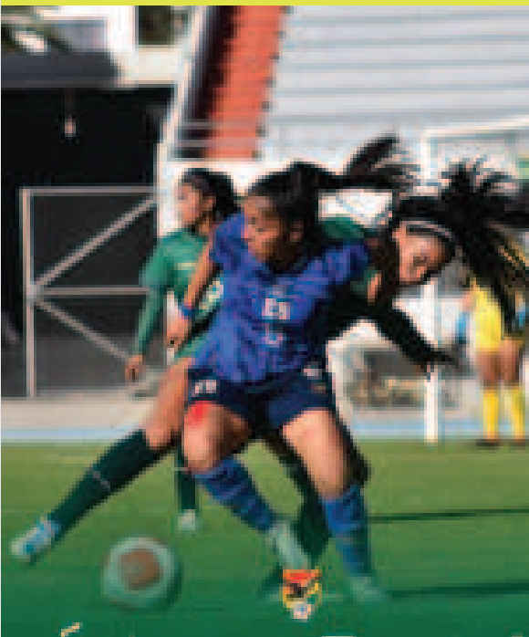
Una escena del cotejo de damas.