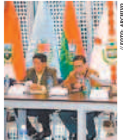
Comisión Mixta de Constitución.

La Procuraduría General del Estado hizo un análisis de la sentencia del TCP sobre la reelección presidencial en el país y reiteró ayer la conclusión de que en el país "no existe la reelección indefinida".