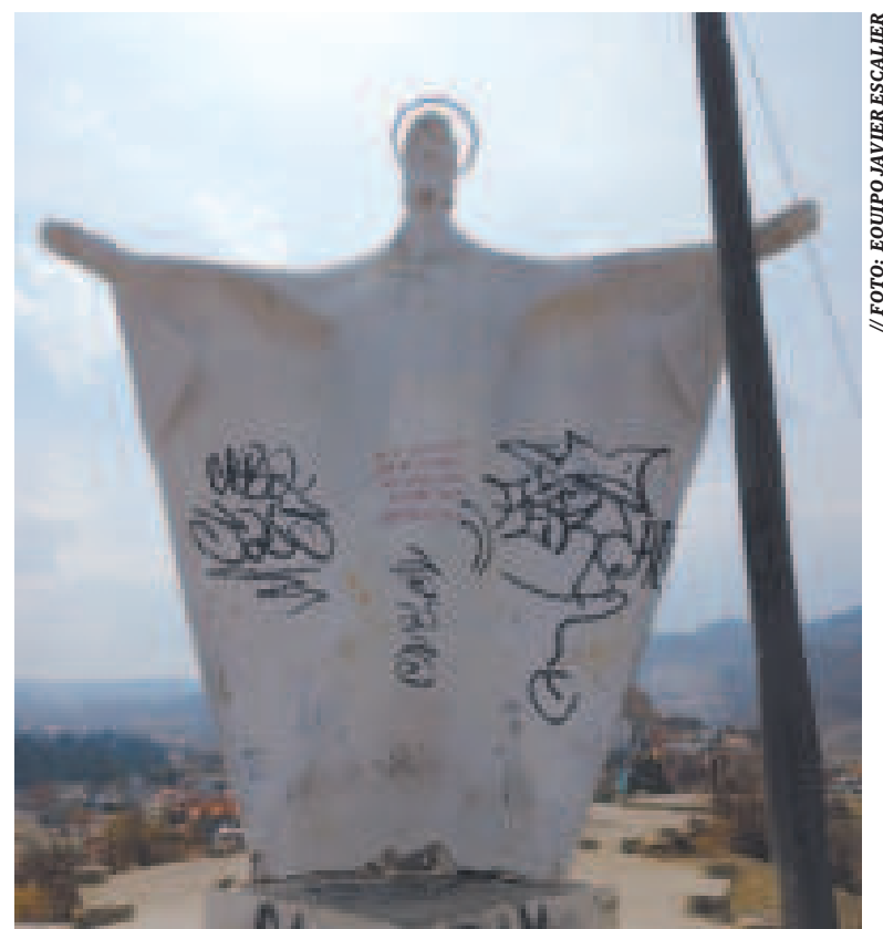
La reconocida imagen no recibe mantenimiento.

“Ingresa el agua dentro de la imagen y en un corto tiempo la humedad destrozará por completo la estructura. Lo peor son los vándalos, personas inescrupulosas que pintarrajearon gran parte de la imagen. Por lo tanto, recomendamos al ejecutivo municipal intervenga y restaure este patrimonio histórico que se encuentra en el mirador de Mallasilla”, apuntó Escalier.