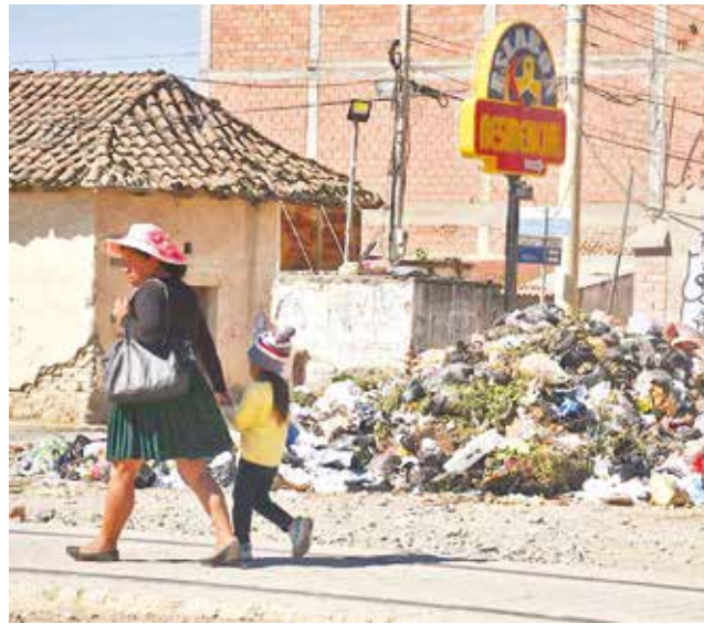
Las personas pasan cerca de los basurales.