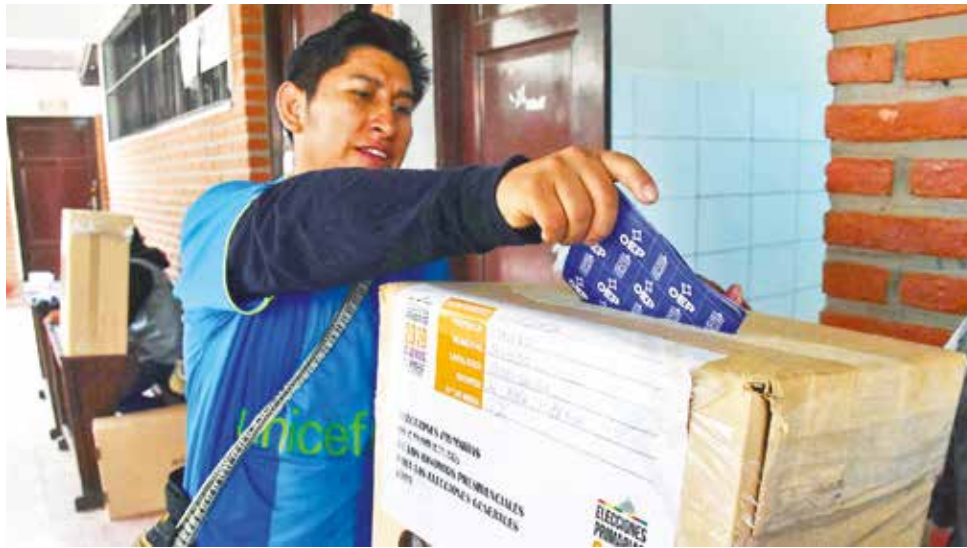
Ciudadanos en la jornada de votación de las elecciones primarias de 2019.

La Ley 1096 de Organizaciones Políticas contempla la realización de las elecciones primarias con la participación sólo de la militancia y con un solo binomio. Tanto la alianza Comunidad Ciudadana (CC) como el vocal del Tribunal Supremo Electoral (TSE), a título personal, presentaron ante la Asamblea Legislativa Plurinacional (ALP) proyectos de ley para modificar los comicios. El punto coincidente es la obligatoriedad de contar con dos binomios, por lo menos, por cada organización política.