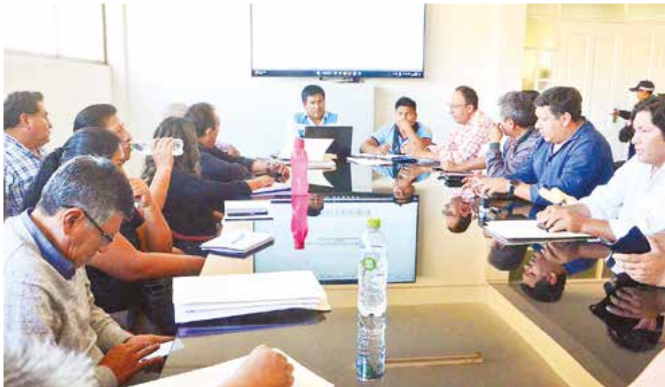
La reunión del Comité Municipal de Transporte de Cochabamba, ayer. HERNAN ANDIA

Indicó que los representantes de las organizaciones sociales que se oponen a un incremento en las tarifas del transporte solicitaron que haya una socialización del estu-