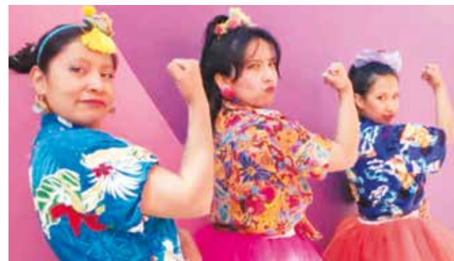
Homenaje. Captura de pantalla del videoclip.