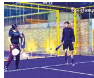
Las canchas de Pádel Park. DARA CALUSTRO

Desde este viernes 24 hasta el domingo 26 de mayo, Pádel Park se vestirá de fiesta deportiva, ya que será sede del Campeonato Departamental, que reemplazará de importancia ya que será clasificatorio al even-