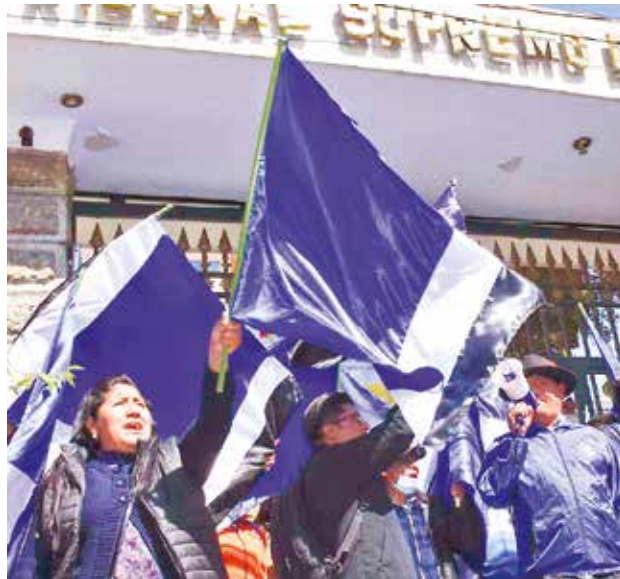
Los seguidores del MAS arcista hacen vigilia en el TSE.

El vocal dijo también que la Sala Plena aún no tiene el informe técnico del Servicio Intercultural de Fortalecimiento Democrático (Sifde) sobre el congreso del MAS. Según los plazos del Órgano Electoral, el informe tendría que ser conocido el 23 de mayo.