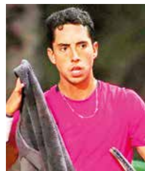
El tenista boliviano Murkel Dellien.

Ya para el segundo set, Monteiro tomó sus previsiones y se puso rápidamente 4-1 en ventaja, dando pocas oportunidades y bloqueando el juego del boliviano, que dio batalla