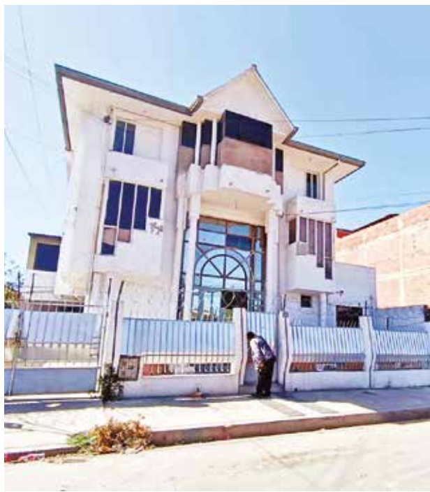
El edificio que alquiló la UMSS en Quillacollo. LSO TIEMPOS

La descentralización se da luego de identificarse que al-