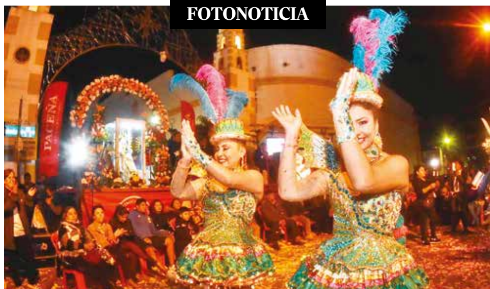
Dan inicio a “Urkupiña 2024” con danzas y fe. Con la participación de 25 fraternidades, anoche, la Asociación de Conjuntos Folklóricos Virgen de Urkupiña de Quillacollo lanzó la festividad 2024 con énfasis en las danzas y la devoción por la “mamita”. JOSE ROCHA