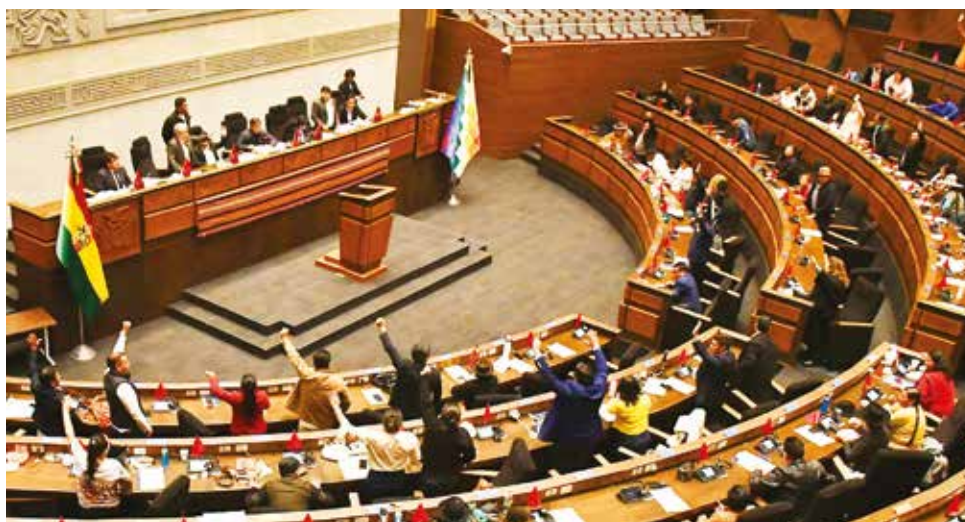
Sesión de Sala Plena de la Asamblea Legislativa Plurinacional, en 2023.