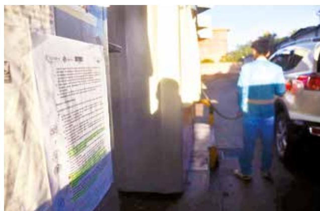
El instructivo de la ANH colocado en un surtidor, ayer. J.R.

La medida —según la explicación de la entidad regulado-