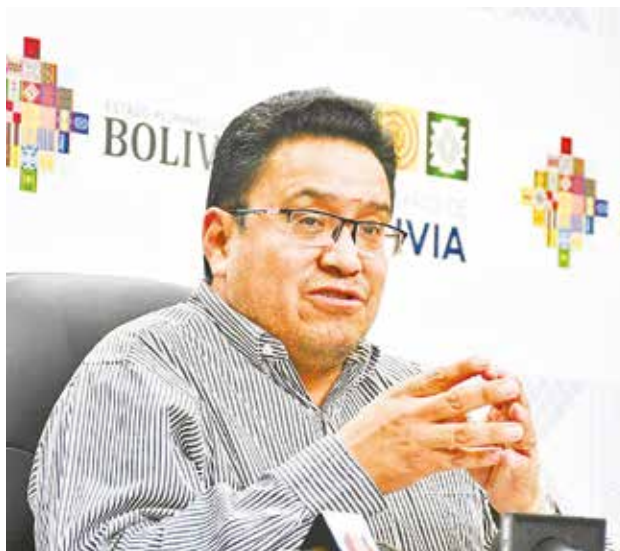
El procurador general del Estado, César Siles.

Así lo establece el análisis jurídico especializado N° 04/2024 realizado por la PGE en respuesta a “cuatro peticiones ante la Comisión Interamericana de Derechos Humanos, relacionadas con el Artículo 23 de la Convención Americana sobre Derechos Humanos”, y que fue presen-