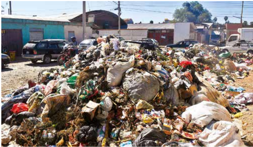
La gran cantidad de basura en una de las calles de Quillacollo.