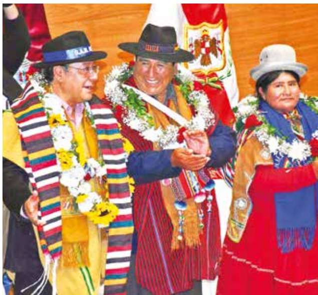
La reunión de alcaldes de municipios del país.

Consigna Legisladores que responden a Morales y de las opositoras CC y Creemos advirtieron que no darán curso a más créditos, en tanto no se aprueben los proyectos de ley 073 y 075 en contra de la prórro-