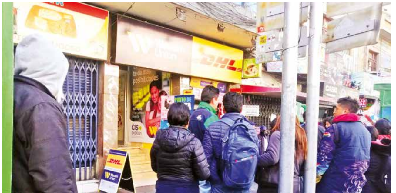
Personas al ingreso de la agencia de Western Union, en El Prado de La Paz.

“Tengo que enviar mil dólares a Desaguadero a mi proveedor, así que debo venir 10 días seguidos aquí y estar entre tres y cuatro horas en la fila, lo cual es un perjuicio para mi trabajo”, contó Car-