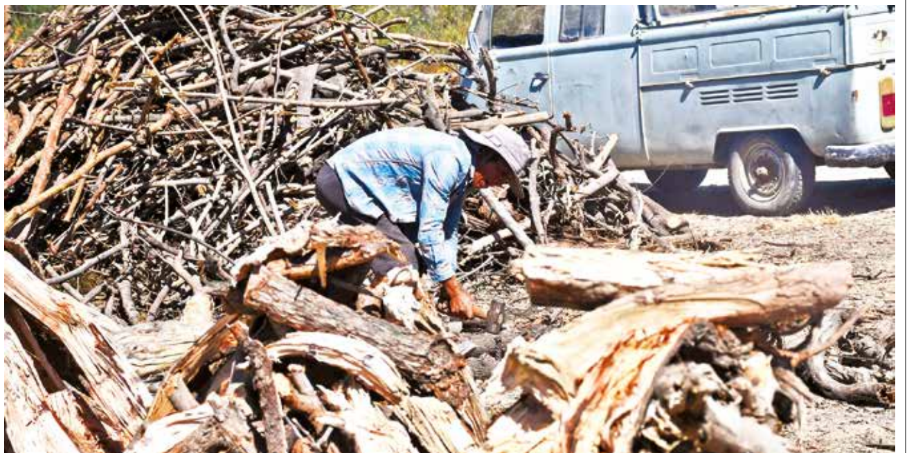
FAENA. Una persona corta leña para cocinar y alimentar a sus animales, en la zona del Calvario, Quillacollo.

ENVÍE SU FOTO PARA PUBLICARLA EN ESTA SECCIÓN A: fotografia@lostiempos-bolivia.com