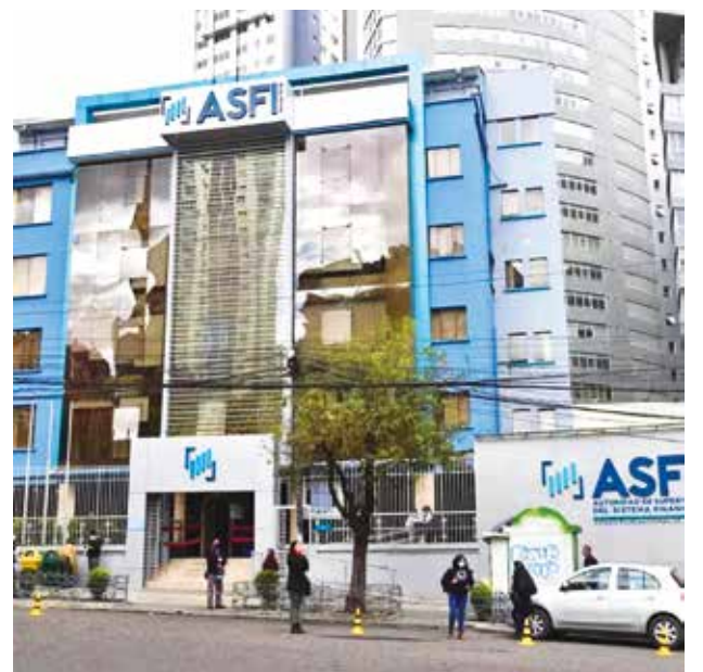
Oficinas de la ASFI en Sopocachi, La Paz. RRS5

El lunes se informó que 18 entidades financieras fueron sancionadas con una multa de 20 millones de bolivianos (más la devolución de los 7,9 millones) por exceder el límite del 10 por ciento para transferencias al extranjero. Dicho límite fue establecido tras una reunión entre el Gobierno y la banca.