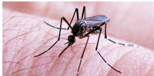
El mosquito Aedes aegypti , que transmite el dengue. UNIDIVERSIDAD

Salud. El Sedes pidió a los pacientes sospechosos que asistan a los centros de salud para evitar complicaciones por la enfermedad