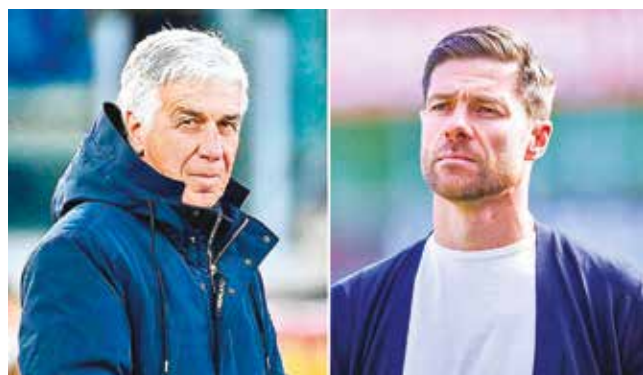
Los entrenadores Gian Gasperini (der.), de Atalanta, y Xabi Alonso, de Leverkusen.

ritos y absolutos dominadores de la competición, llegan a la capital irlandesa con la moral por las nubes. Xabi Alonso tiene a disposición a todos los efectivos de su plantilla.