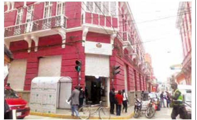
La Fiscalía de Oruro, que investiga el caso.

Joni se encuentra actualmente internado en terapia intensiva.