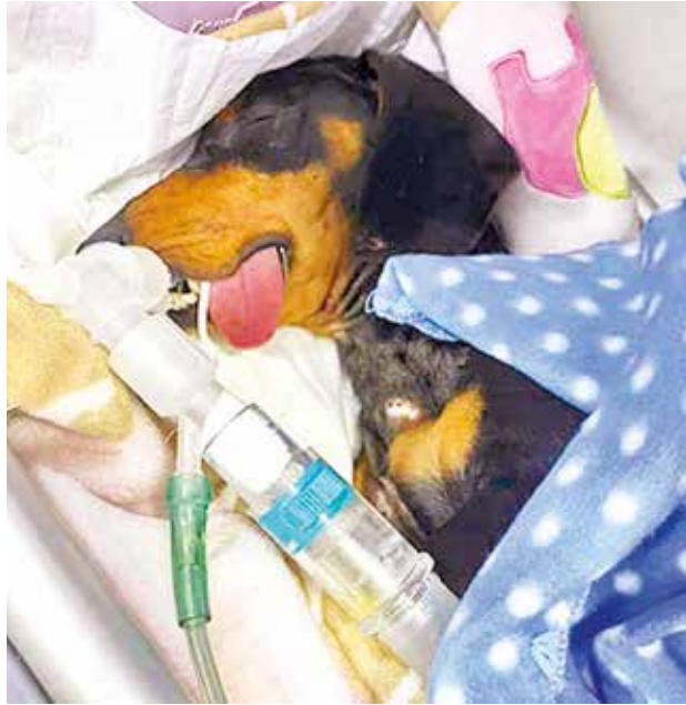
El perro, hospitalizado ayer en Santa Cruz.