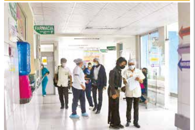
Los ambientes del centro de salud Ticti Norte.

chilleres ya concluyen los cursos de nivelación en la universidad ilegal Adela Zamudio (Unaaz), en predios de una sede vecinal.