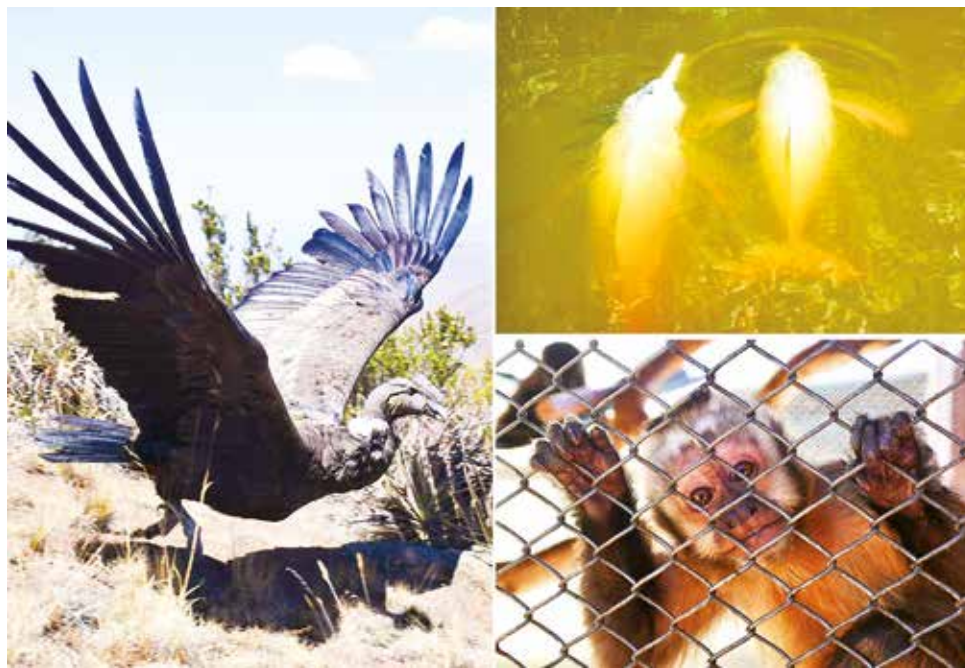
Un cóndor liberado, un mono rescatado y los bufeos que volverán a su hábitat.

Dos expertos creen que las leyes no son suficientes para la protección de la biodiversidad. Para el biólogo Huber Villca, los municipios deben reforzar las áreas de medioam-