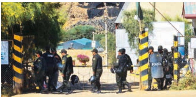
Policías resguardan la entrada al botadero.

Inusual. La emergencia por los casos de dengue persiste en Cochabamba, principalmente en la zona sur de la ciudad