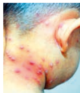
El sarpullido de la varicela.