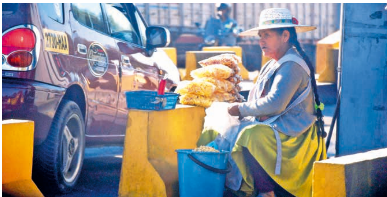
TRADICIÓN. Una mujer vende tostados desde hace bastante tiempo en la tranca ubicada en la zona de Huayllani, carretera a Sacaba.

ENVÍE SU FOTO PARA PUBLICARLA EN ESTA SECCIÓN A: fotografia@lostiempos-bolivia.com