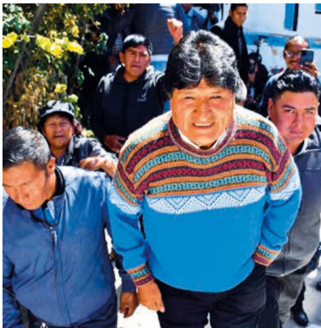
El expresidente Evo Morales.