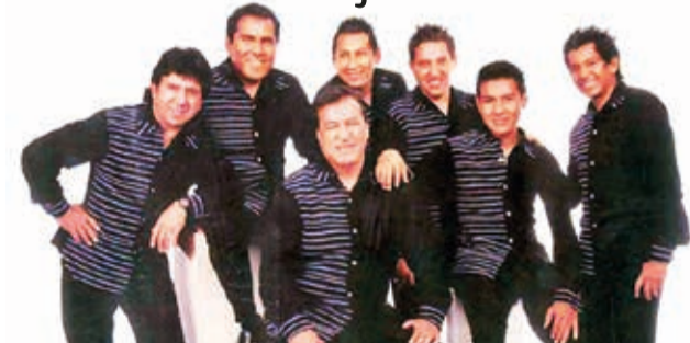
Folklore. Bonanza está vigente desde 1990. CORTESÍA