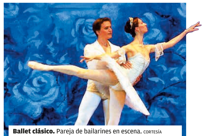
Ballet clásico. Pareja de bailarines en escena.

Acompañando a Volchkov, el cuerpo de ballet, compuesto por artistas igualmente talentosos y dedicados, garantiza una experiencia única y memorable para todos los asistentes. La elegancia, la gracia y la precisión técnica que carac-