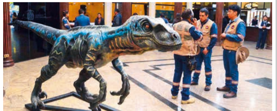
Presentan los dinosaurios que estarán en el parque. HERNÁN ANDIA

Éste es el tercer bloqueo reportado este año como medida de presión por diferentes demandas.