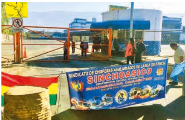
El piquete de bloqueo en la puerta de la terminal, ayer. DJ

Demandas. Los conductores de un sindicato local exigen “un salario justo” y presionan bloqueando el acceso a la terminal