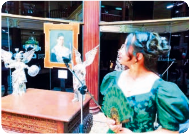
Lanzamiento. Una muestra de una de las casonas, ayer, durante la presentación de la actividad en la alcaldía.

Recorrido. Los organizadores preparan todos estos espacios ser visitados este 17 de mayo con recorridos peatonales y móviles de forma gratuita