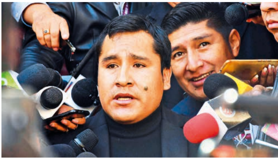
El presidente de la Cámara de Diputados, Israel Huaytari, del MAS. APG

Una de las causas para el inicio de las investigaciones contra el presidente de la Cámara de Diputados, Israel Huaytari, es el depósito de 1,4 millones de bolivianos en una cuenta mancomunada con su esposa. Se trata de una pesquisa que se realiza desde inteligencia financiera, relacionada con una presunta legitimación de ganancias ilícitas, en un proceso que data desde enero. El proceso fue trasladado a la ciudad de Santa Cruz, a solicitud de uno de los involucrados en el caso de "lavado" de dinero.