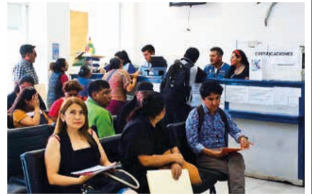
Contribuyentes en la sede de Recaudaciones.

La varicela es causada por un virus varicela-zóster que causa sarpullido y ampollas en la piel, que suele durar entre 4 y 7 días. Se debe acudir a un centro de salud.