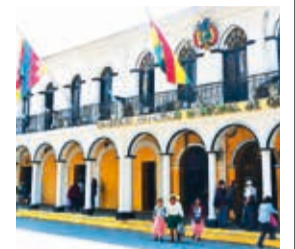
El frontis de la Alcaldía de Quillacollo. C. LÓPEZ