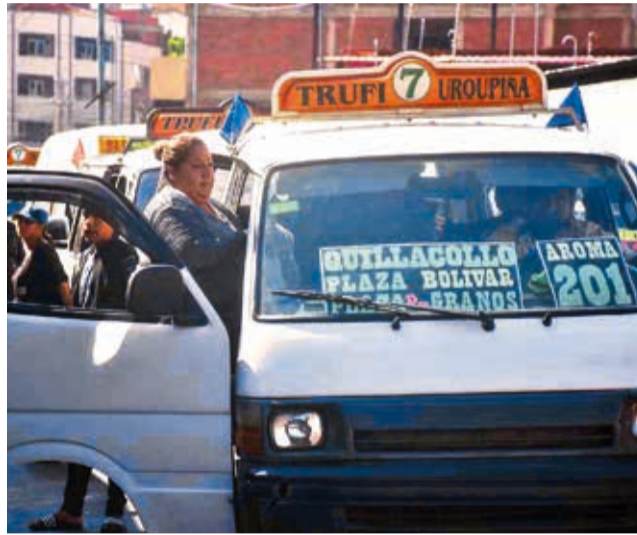
Vehículos del transporte público en Cochabamba.