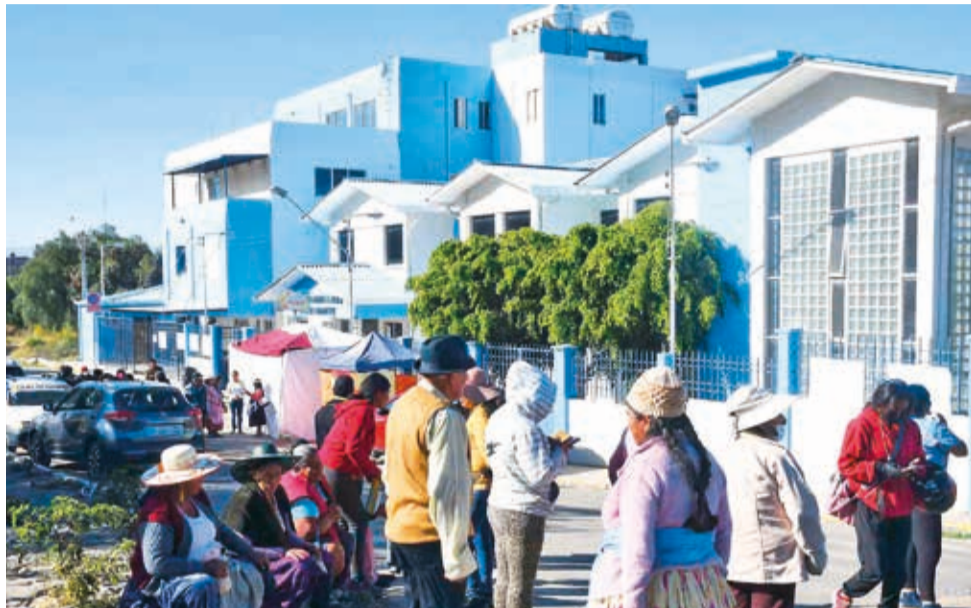
Vecinos protestan en el centro de salud Ticti Norte, ayer.