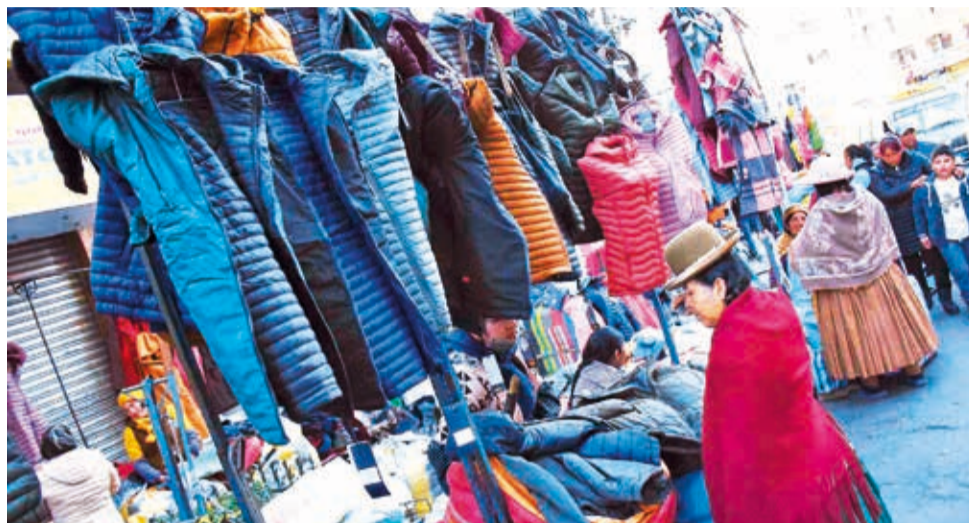
La gente compra ropa abrigada para combatir el frío, ayer en La Paz.

viar a sus hijos a la escuela abrigados, siempre precautelando la salud de nuestros estudiantes”.