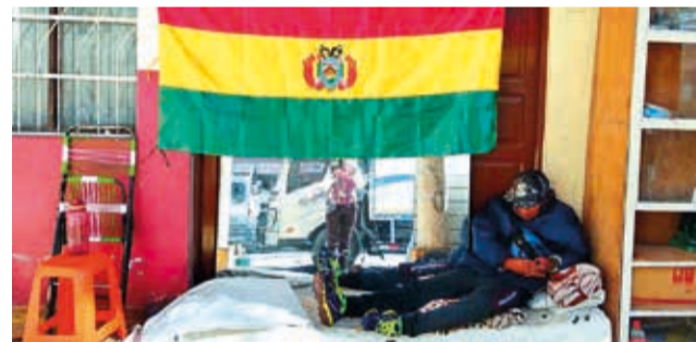
La huelga de uno de los adjudicatarios.

MULTIMEDIA Escanee el QR para ver testimonios del desalojo. www.lostiempos.com