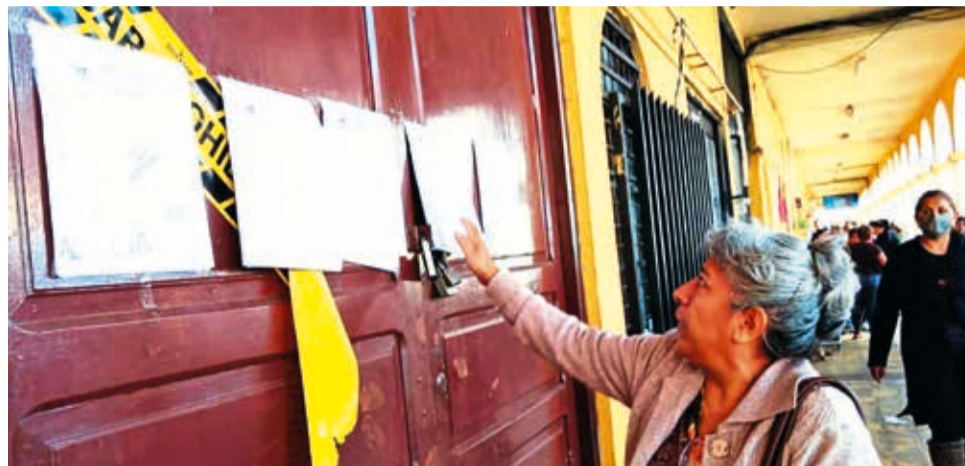
La notificación de desalojo de las tiendas municipales en Quillacollo.

Rojas indicó que la deuda por tienda supera en algunos casos los 200 mil bolivianos y aclaró que sólo uno de los 22 adjudicatarios entregó