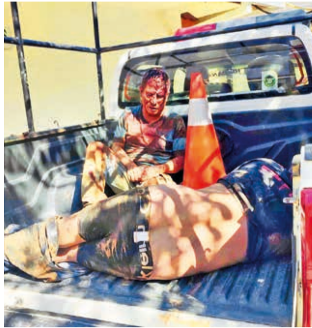
Los golpeados en la camioneta policial, ayer en Tolata.