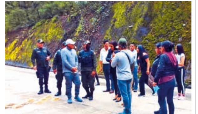
La reconstrucción de la desaparición de Odalys, ayer en Yungas de La Paz.

España señaló que el caso es investigado por la Fuerza Especial de Lucha Contra el Crimen (Felcc).