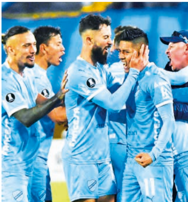
Bolívar, en su victoria sobre Millonarios.

a Gremio el 29 de mayo, para así no tener que esperar los resultados de los partidos reprogramados por las inundaciones en Brasil como ser: Huachipato vs. Gremio, que jugará el 4 de junio y Gremio vs. Estudiantes a disputarse el 8 de junio.