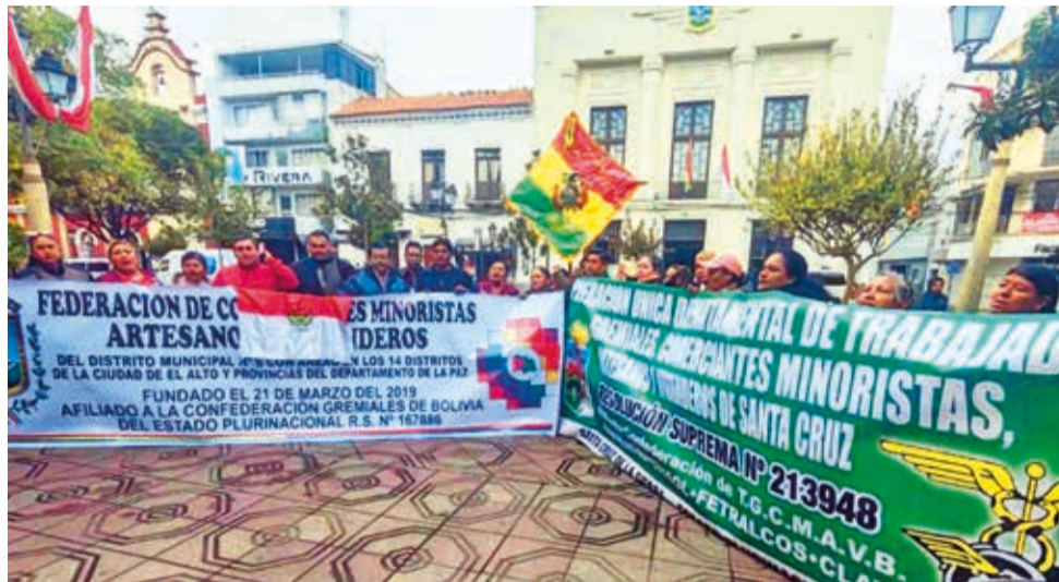
Los gremiales del país marchan en la ciudad de Tarija, ayer.

El Tribunal Constitucional Plurinacional (TCP) tiene en sus manos la decisión sobre la constitucionalidad o no del Decreto Supremo 5143 de Derechos Reales promulgado por el presidente Luis Arce y resistido por varios sectores políticos, sociales y empresariales y que se ha convertido en otro tema conflictivo dentro de la pugna política entre "arcistas", por un lado, y "evistas" y opositores de CC y Creemos, por el otro, según reporte del diario Correo del Sur.