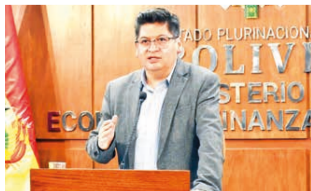
Marcelo Montenegro, ministro de Economía y Finanzas Públicas, en rueda de prensa. MEF

La pasada semana, la industria farmacéutica denunció falta de dólares para la importación de materias primas y