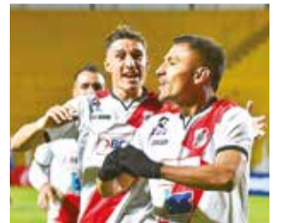
Jugadores de Nacional festejan la goleada.