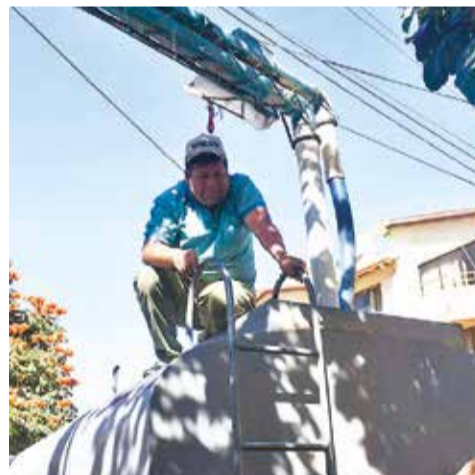
La recarga de cisternas o aguateros en las vertientes del parque Fidel Anze.