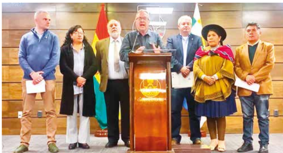
Legisladores de CC anuncian un proyecto de ley para abrogar decreto 5143. COMUNIDAD CIUDADANA

El DS 5143 establece la creación de la Instancia Competente Nacional del Registro de Derechos Reales, a la que hace responsable de la implementación, mantenimiento y actualización del Sistema Único de Derechos Reales, así como de la infraestructura tecnológica. El decreto 5143 establece la obligatoriedad que tiene el Consejo de la Magistratura de coordinar su trabajo con la Agencia de Gobierno Electrónico y Tecnologías de Información (Agetic) que depende del Ministerio de la Presidencia.