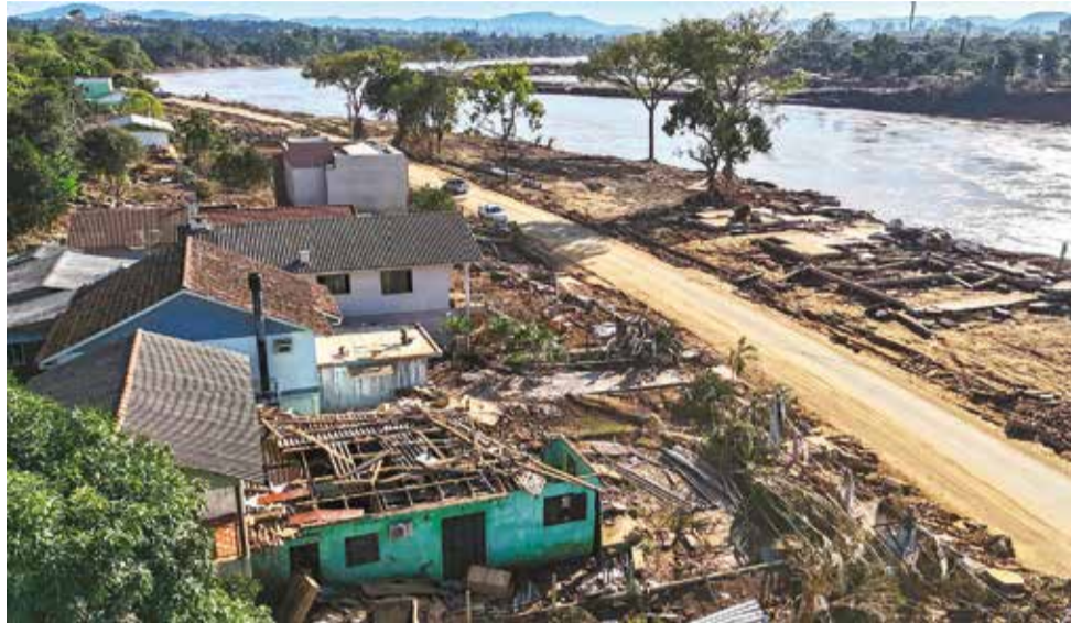
Una escena de las inundaciones en Rio Grande do Sul, en Brasil.

También fueron destruidas miles de viviendas e infraestructuras, como puentes o carreteras, y el aeropuerto de Porto Alegre se ha convertido en una inmensa laguna, lo que ha obligado a interrumpir