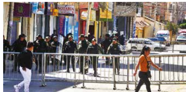
El Concejo de Sacaba con resguardo policial, ayer. D. JAMES

Denuncia. Cuatro concejales denunciaron que sufren acoso y violencia política, mientras un grupo de personas mantiene una vigilia