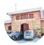
Proyecto mARTadero Arte y Cultura

La declaratoria de emergencia por el dengue se aprobará recién hoy y especificará que las OTB y distritos son responsables de la limpieza.