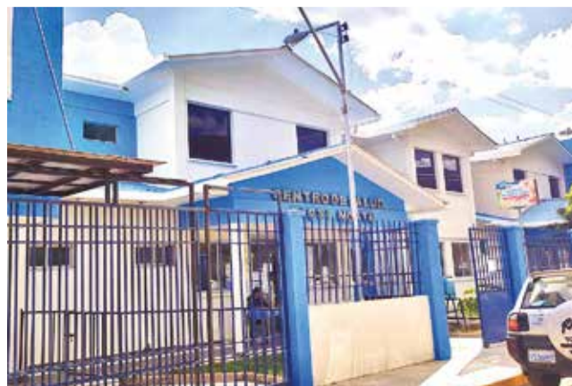
El hospital de Ticti Norte, que se halla sin ser utilizado, se ofrece para que funcione parte del pediátrico. DANIEL JAMES

Explicó que la deuda data de anteriores gestiones, des-