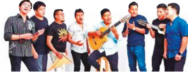
Pasión Andina. Agrupación folklórica.