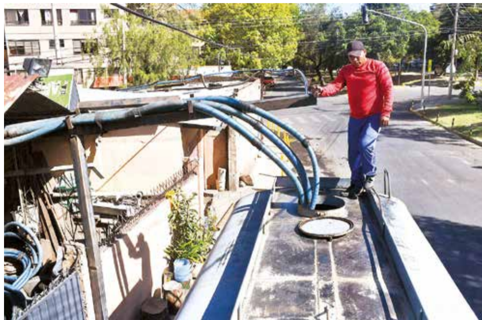
Una de las pocas cisternas que aún lleva agua a los barrios y edificios.