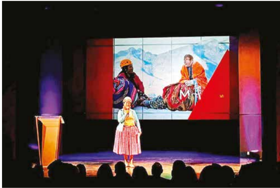
Una de la cholitas escaladoras en el evento sobre turismo.

La proyección es generar entre 3 mil y 4 mil millones de dólares anuales después de 2030 con el gasto de los turistas extranjeros, mejorando la conectividad aérea y aumentando el tiempo de permanencia de los viajeros en el país. Ante ello, Montenegro indicó que “3 mil millones de dólares no es poca cosa”. Es la misma cifra que generaron las exportaciones de oro en 2022, cuando se alcanzó una cifra récord.