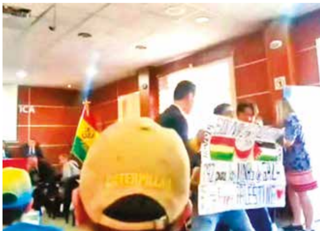
Protesta de estudiantes en un acto en la UMSA.

Un video difundido en el muro de Facebook de la red de radios RPO muestra el