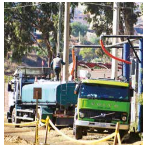
Cisternas de abastecen en un tanque de Misicuni por la venta en bloque.