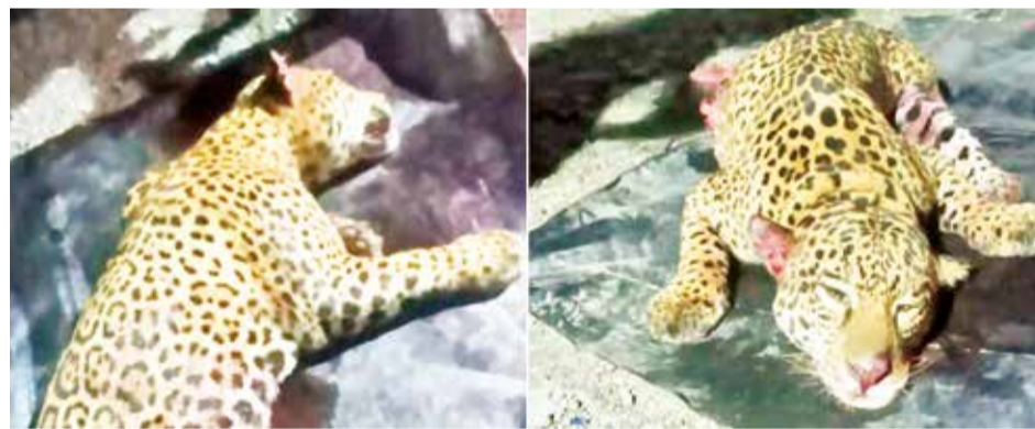
El jaguar atropellado y luego descuartizado en un campamento en El Sillar.

Comentó que ellas suscribieron un acuerdo de forma voluntaria y orgánica para después de tres años dejar que sus suplentes asuman sus cargos en el Legislativo por otros dos años.