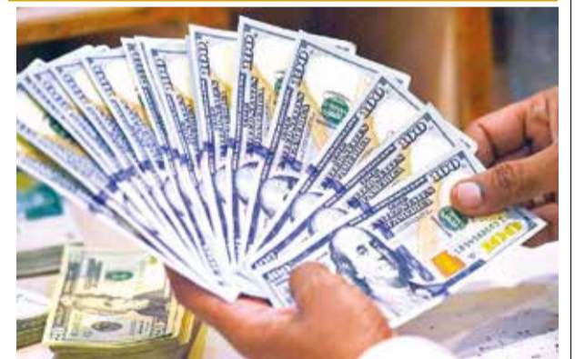
Movimiento de dólares en efectivo.

En el futuro inmediato se prevé el cierre del mercado argentino, que se autoabastecerá. Para 2030, si la tendencia al declive continúa, el mercado brasileño podría correr riesgo e incluso Bolivia pasaría a ser importador de gas natural.