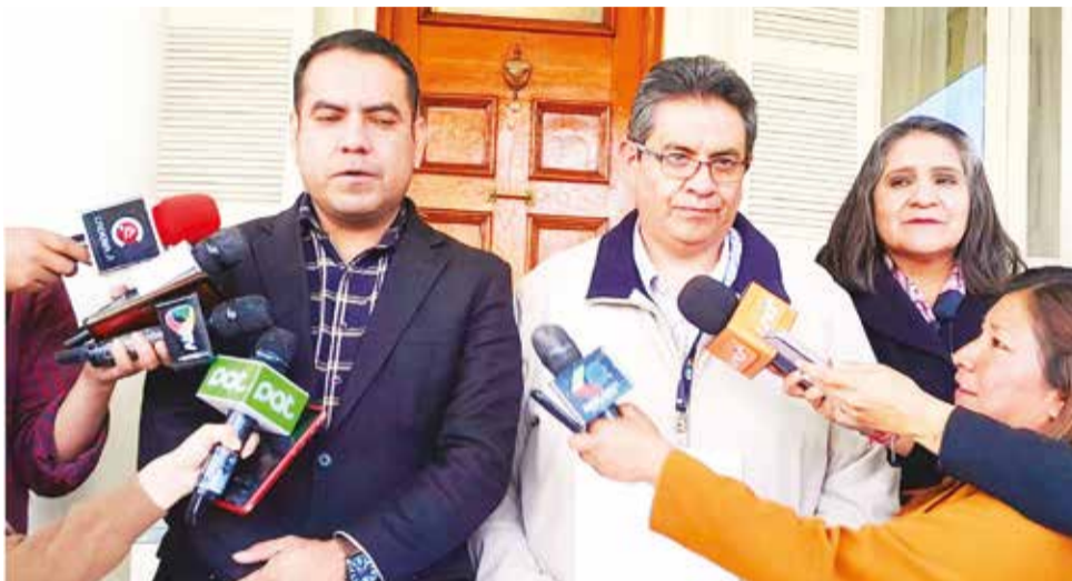
Integrantes del Tribunal Supremo Electoral en conferencia de prensa, ayer. DETRAS DE LA VERDAD

Mediante una resolución, el Tribunal Supremo Electoral (TSE) amplió, por sexta vez y por 120 días, el plazo para que las organizaciones políticas renueven sus directivas, militancia y adecuen sus estatutos. “Otorgar el plazo de 120 días calendario a las organizaciones políticas de alcance nacional, departamental, regional y municipal (cuyas directivas hubieren superado el periodo de su mandato) para que convoquen, realicen y obtengan obligatoriamente el registro de sus eventos partidarios”.