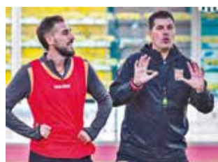
Jugadores del Tigre en entrenamiento.

para preparar el partido, pero creo que son suficientes para llegar en un nivel óptimo y po-