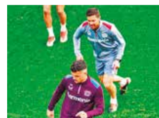
Futbolistas de Bayer Leverkusen en prácticas. @BAYER04_ES

El cotejo entre Atalanta y Olympique de Marsella se presenta como una oportunidad histórica para los ita-