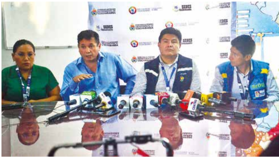
Representantes del Sedes, Cifabol y de Defensa del Consumidor, en rueda de prensa. D.J.