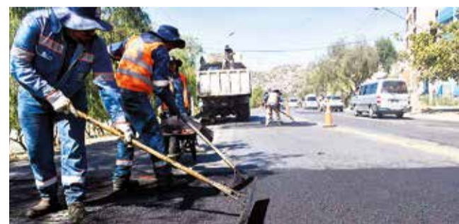
Trabajos en el Circuito Bolivia, en la laguna Alalay. C.L.

Automovilismo. Este sábado y domingo, alrededor de 160 pilotos serán parte de la competencia que se correrá en la laguna Alalay