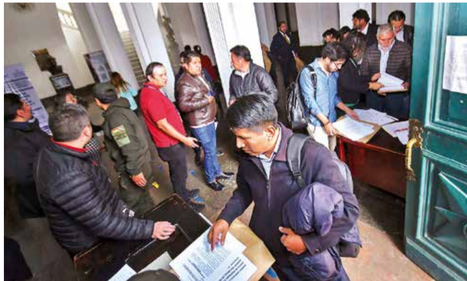
La Comisión de Constitución de la ALP recibe a los postulantes a judiciales.