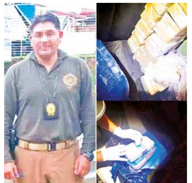
El teniente coronel acusado y la droga.