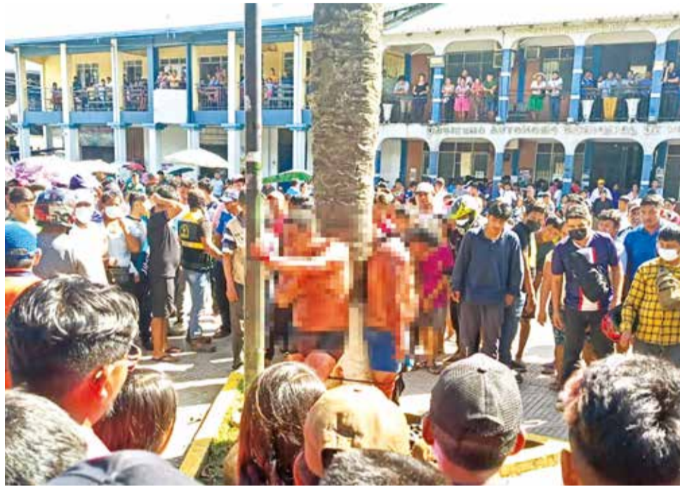
Los tres presuntos acusados de robo y secuestro son amarrados.

Inmediatamente, los funcionarios de la Policía acudieron al lugar e interceptaron dos vehículos: una camioneta gris y un automóvil de color rojo, este último estaba ocupado por cua-