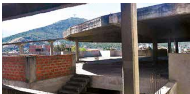
El edificio abandonado del hospital del niño. CARLOS LÓPEZ

Fracasos. Hace cinco años, las autoridades gestionaron el traslado del pediátrico al norte y en 2021, al hospital Cochabamba, sin éxito