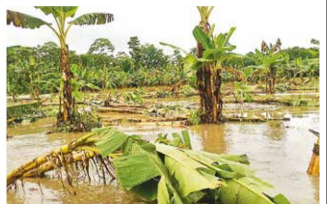
Plantaciones de banano en medio del agua. MIN DE DEFENSA

La semana pasada estaba vigente una alerta sobre elevaciones bruscas de niveles en ríos del trópico. “Esta alerta se ha cumplido”, señaló. Ahora el Senamhi evalúa la situación para determinar si es necesario emitir una nueva alerta. En tanto, las autoridades buscan mitigar y enviar ayuda humanitaria.