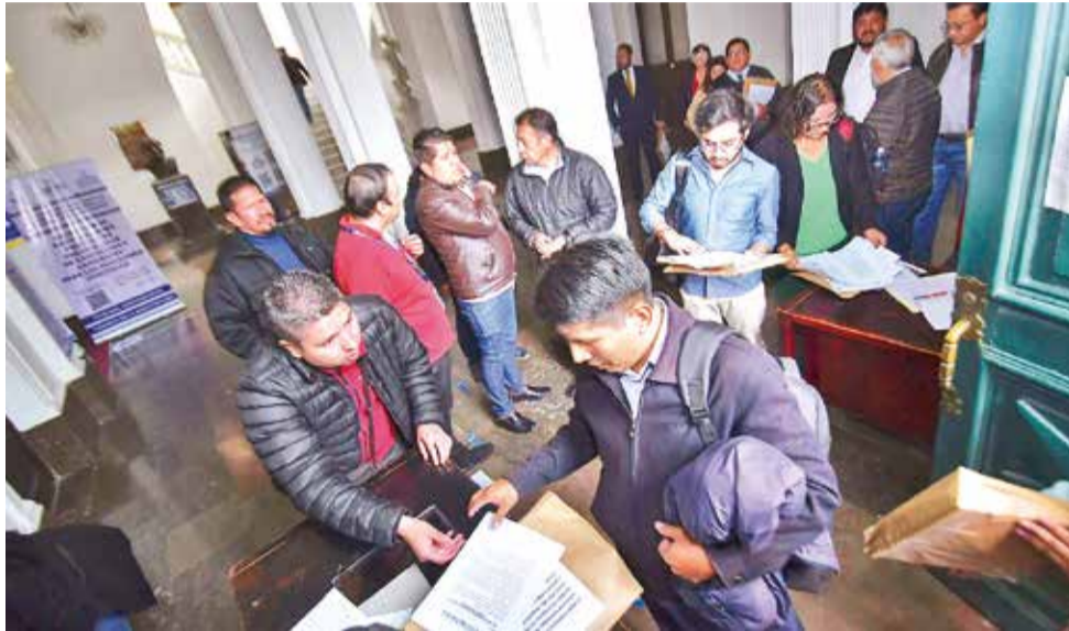
Miembros de las comisiones legislativas reciben a postulantes para las judiciales. APG

La Ley 1549 Transitoria para las Elecciones Judiciales 2024 indica que la “postulación y preselección de postulantes tendrá una duración de hasta 80 días calendario”, mientras que la “organización y realización de la votación popular, con una duración de hasta 150 días calendario”. La Sala Constitucional Primera de Pando concedió la tutela y dispuso un nuevo proceso de preselección porque se “vulneró el derecho a la igualdad tanto de las mujeres como de los pueblos indígenas originarios”.