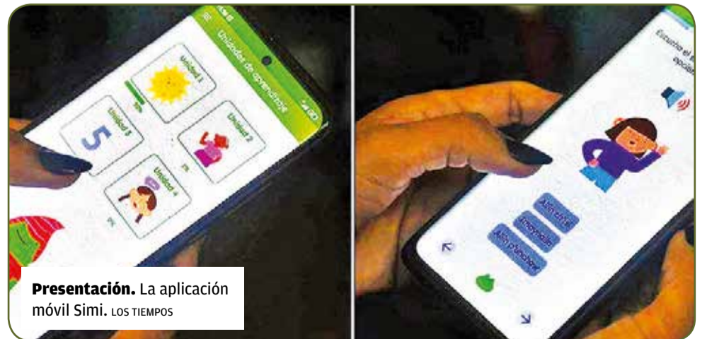
Presentación. La aplicación móvil Simi.