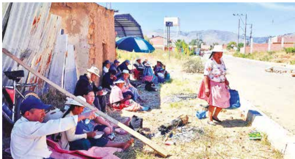
El bloqueo en el complejo de residuos sólidos de Sacaba, ayer. DANIEL JAMES

Aseveró que, desde el jueves, los legisladores no acuden a las sesiones para tratar la norma que exigen los movilizadas.