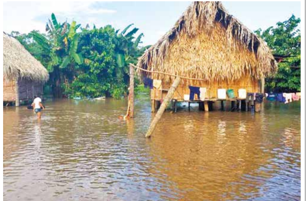
Las inundaciones en Puerto Villarroel que afectaron casas y cultivos.

“Tendremos todavía precipitaciones con láminas superiores a los 20 milímetros, como ya lo habíamos vivido