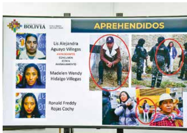
Los presuntos evistas que pretendían boicotear congreso. APG

El Gobierno denunció que estas personas tenían en su poder material explosivo con intenciones de generar violencia