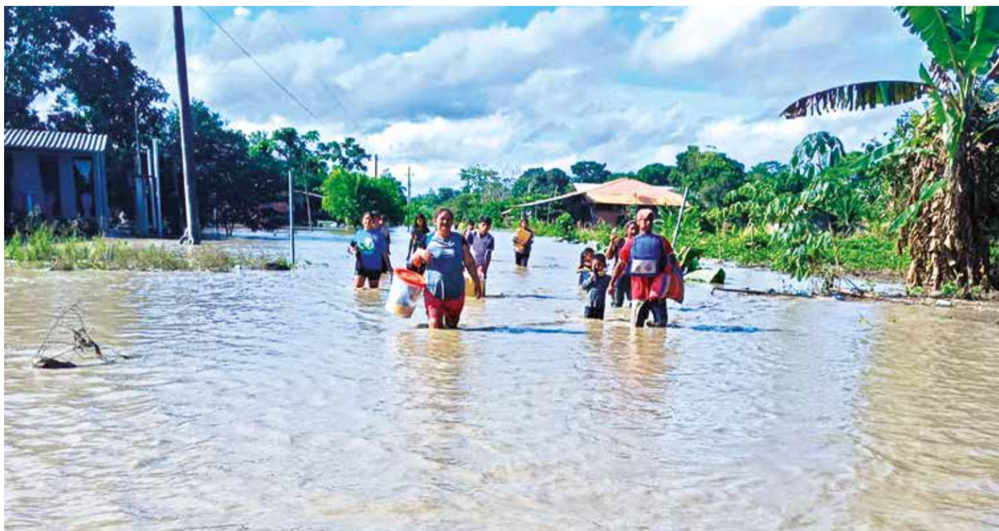
Pobladores de Puerto Villarroel transitan por calles inundadas, ayer. CORAZÓN DEL TRÓPICO

Daños. Más de 2 mil familias en 96 comunidades del municipio de Puerto Villarroel quedaron afectadas. El Senamhi prevé lluvias por los siguientes cuatro días. Pág. 8