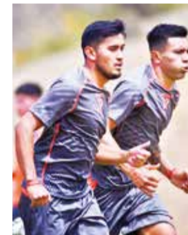
Jugadores de Always Ready en entrenamiento.

Always Ready quiere seguir en la cima a costa de Def. y Justicia