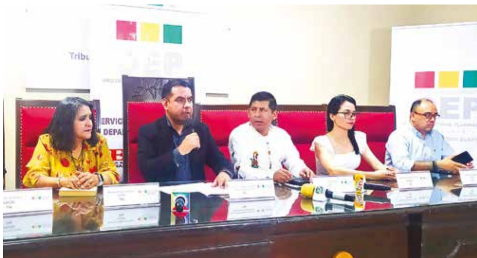
Los integrantes del Tribunal Supremo Electoral en reunión de Sala Plena.

Deben promover el principio de paridad y alternancia en la elección interna de sus dirigencias y la elección o nominación de sus candidaturas legislativas, garantizando la participación política de las mujeres en el ejercicio de la democracia interna, en igualdad de condiciones y libres de acoso y violencia política.