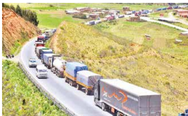
Camiones detenidos por un bloqueo en Colomi el 5 de enero de este año. JOSE ROCHA

La posible obstrucción de las vías que unen a Cochabamba con el resto del país tendría consecuencias perjudiciales para los sectores de