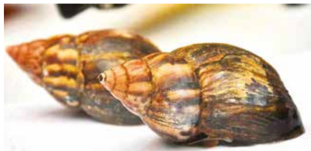
Un par de caracoles recolectados en el trópico.

El jefe departamental del Senasag explicó que se capacita a los productores para