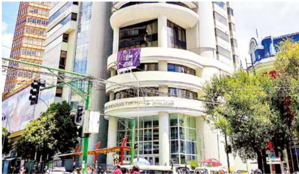
Oficinas del Ministerio de Economía, en el centro paceño.

“Seguro haremos conocer después quiénes son los deudores morosos y haremos todas las gestiones necesarias para cobrar estos montos”, declaró.