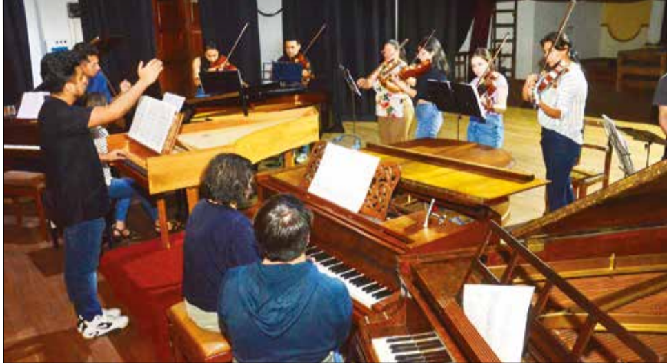
Escenario. Ensayo de los cuatro pianos de cola en el teatro Achá, ayer.

Inédito. El evento ofrece un programa variado en el que destaca la ópera Sour Angelica y el hito histórico de presentar 4 pianos de cola en el Achá.