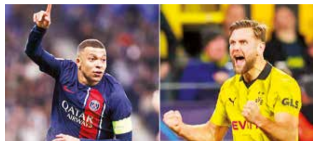
Kyllian Mbappé (izq.), del PSG, y Niclas Füllkrug, de Dortmund.

Fútbol. Borussia Dortmund visitará hoy al París Saint-Germain desde las 15:00 HB, después de haber ganado la ida por 1-0