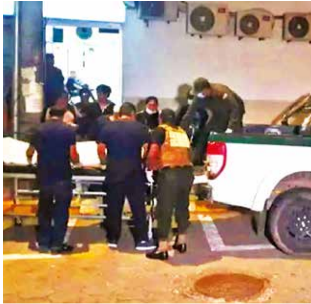
La víctima de Santa Cruz, retirada ayer de la morgue.

En el segundo caso se trata de un sargento integrante