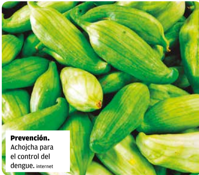
Prevención. Achojcha para el control del dengue.