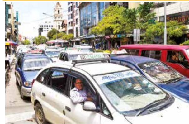
Transporte urbano en la ciudad de Cochabamba. C.L.

Los sectores que más aportaron a la recaudación fueron los del comercio (2.688 millones), servicios financieros (2.409 millones), bebidas (1.005 millones) y servicios a las empresas (987 millones).