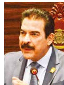
El alcalde Manfred Reyes Villa. HERNAN ANDIA