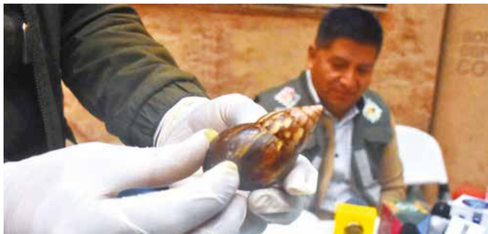
Personal del Senasag muestra un caracol africano que afecta al trópico.

En ese contexto, adelantó que se trabaja para contar con recursos económicos, humanos y logísticos para erradicarlos debido a que los animales son un riesgo porque se alimentan de todo vegetal que encuentren a su paso.