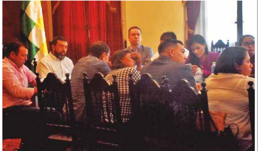
Autoridades de Beni y Santa Cruz, reunidas en Cochabamba, el lunes. JOSÉ ROCHA

Además, rechazó la desatención de la población de Piso Firme.