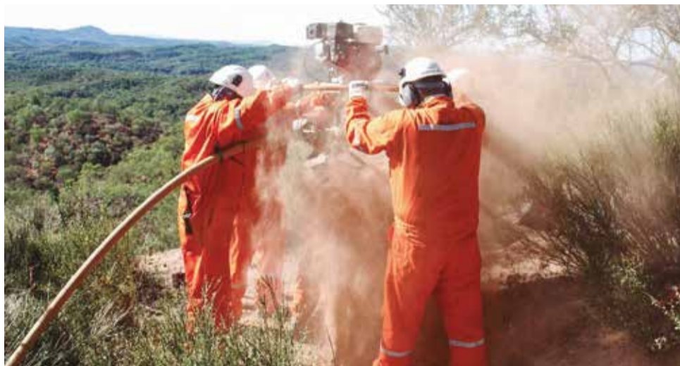
Desde 2021, Yacimientos Petrolíferos Fiscales Bolivianos lleva adelante el Plan de Reactivación del Upstream (PRU). YPFB