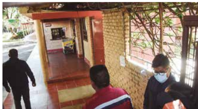
La inspección en el colegio Juan XXIII, en Cochabamba. J.R.

Denuncia. El lunes 6 de mayo se estrenará el audiovisual que muestra a los jesuitas acusados de abusos sexuales en dos países