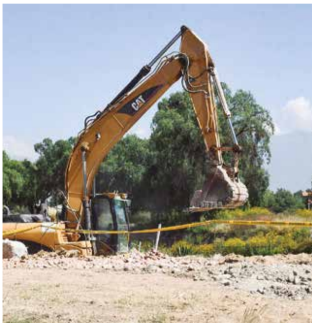
Los avances de la línea amarilla del tren metropolitano. c.l.

Santa Veracruz Chassagnez también señaló que desde ayer ya se puede trasladar desde Sipe Sipe hasta la zona de Santa Veracruz para que la población pueda