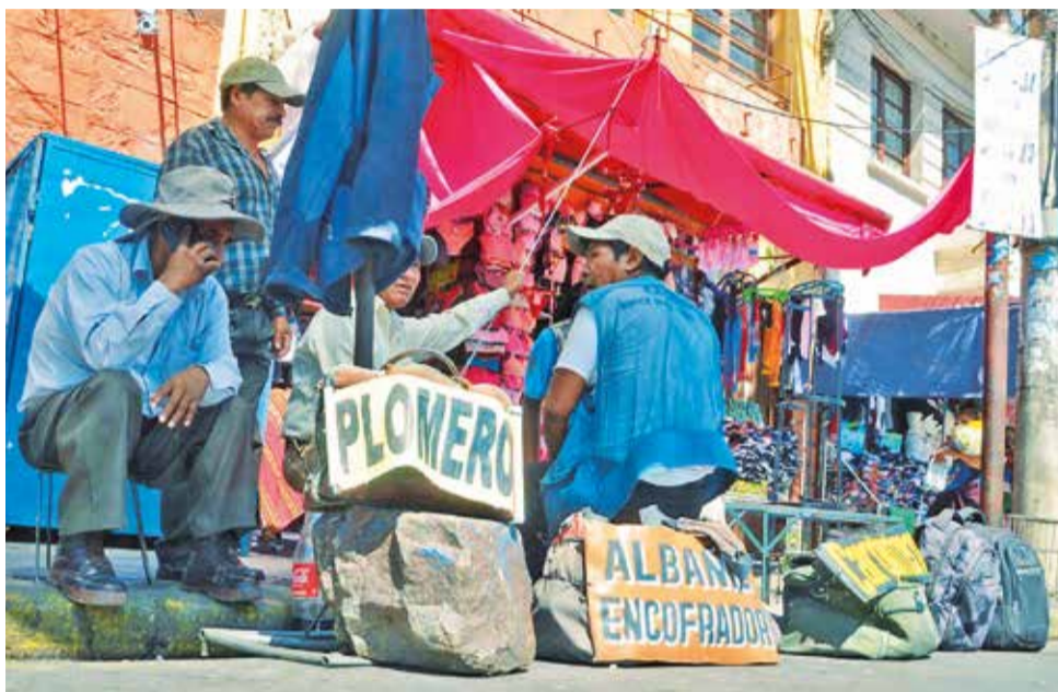
Trabajadores por cuenta propia esperan a que alguien los contrate en Cochabamba. H. ANDIA

Esto —dice el experto— tiene que ver con la calidad del empleo; es decir, muchos de los bolivianos, ante la necesidad de tener una fuente de ingresos, trabajan en diversas actividades con remuneracio-