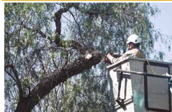
La tala de árboles, ayer en la avenida Blanco Galindo. c.l.

zona de Santa Veracruz ha establecido una tarifa única de Bs 2,50 y para los niños, adultos mayores y escolares será de 1 bolivianos”, mencionó Chassagnez.