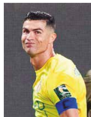
El jugador del Al Nassr, Cristiano Ronaldo.

Cristiano Ronaldo agrandó su condición decisiva para el Al Nassr, marcó dos goles para superar 3-1 al Al Khaleej, alcanzó los 38 tantos en 39 partidos en esta temporada y lideró la clasificación de su equipo para la final de la Copa del Rey de Arabia Saudí, en la que se enfrentará al Al Hilal, líder de la liga y reciente campeón de la Supercopa.