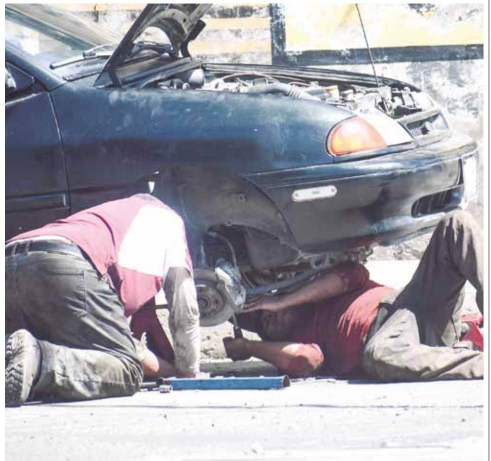
¿DESCANSO? Un par de mecánicos hacen honor al Día del Trabajo reparando un vehículo en un taller de Cochabamba.

ENVÍE SU FOTO PARA PUBLICARLA EN ESTA SECCIÓN A: fotografia@lostiempos-bolivia.com