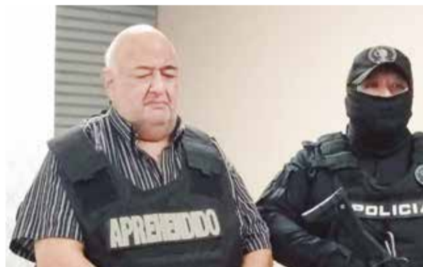
La Policía presenta al médico, abril, en Santa Cruz. P.B.

El lunes 6 de mayo se estrenará el documental que muestra a los jesuitas de la Compañía de Jesús, acusados de abusos sexuales en dos países.