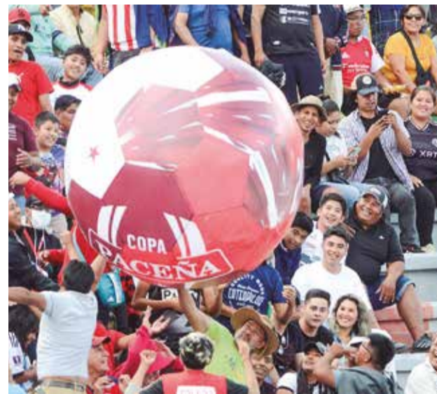
El público disfruta de la previa del encuentro.

de la defensa visitante, pero no estuvo certero para igualar la cuenta.