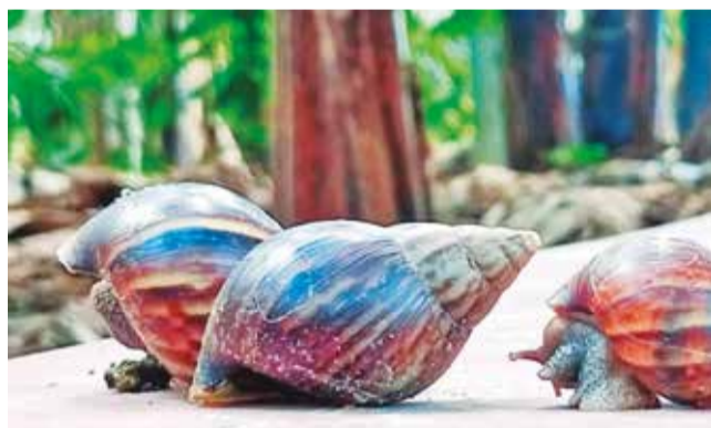
Los caracoles africanos retirados en Chimoré.