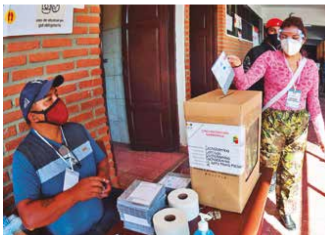
Urnas en las elecciones generales en 2020. CARLOS LÓPEZ

Hasta la fecha, hay 11 partidos políticos de alcance nacional con personería jurídica registrados en el TSE; sin embargo, no todos están al día con la adecuación de sus estatutos orgánicos ni con la renovación de sus directivas,