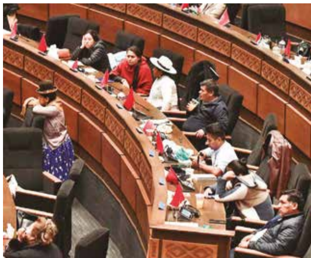
El pleno de Diputados tratará normativa del Mercosur.

tir de la fecha de entrada en vigencia del protocolo, Bolivia adquirirá la condición de Estado Parte y participará con todos los derechos y obligaciones en el Mercosur’.