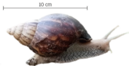
Caracol gigante africano Molusco omnívoro