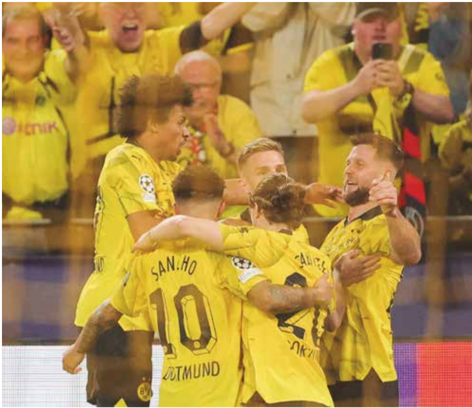
Los jugadores del Borussia Dortmund celebran el gol de la victoria, ayer.