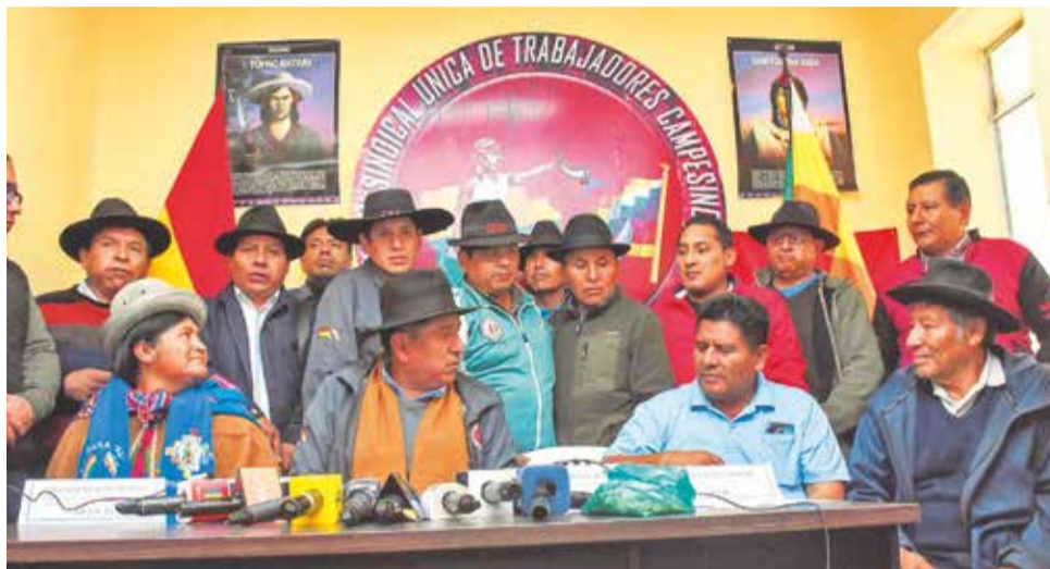
El Pacto de Unidad del ala renovadora ratificó el desarrollo de su congreso.

Refiere que los solicitantes no demostraron hechos nuevos. “Los delegados del MAS IPSP no presentaron pruebas de reciente obtención que demuestren que la Resolución (...) fue dictada erróneamente”, señala.