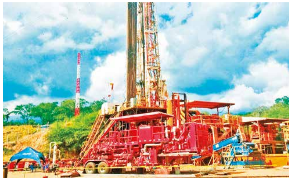
Un pozo exploratorio administrado por YPFB. YPFB

Para la presente gestión, YPFB destinará 397,67 millones de dólares a las actividades de exploración y explotación de hidrocarburos, cifra que representa el 63 por ciento de sus recursos de inversión. Lo anterior muestra que las inversiones en la exploración de hidrocarburos representan una necesidad