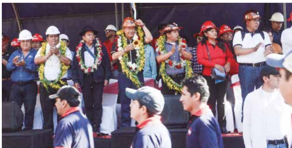
El presidente del Estado, Luis Arce Catacora, celebró el 1 de mayo con los trabajadores en Cochabamba, ayer.

“El Incremento Salarial en el sector privado será acordado entre las empleadoras y los trabajadores con las trabajadoras y los trabajadores, sobre la base del tres por ciento (3%) establecido en el presente Decreto Supremo”.