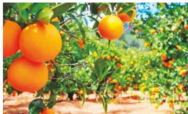
Las plantaciones de cítricos en el trópico.