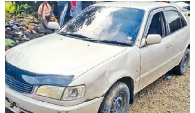
El vehículo de una de las víctimas, el sábado en el trópico cochabambino.

les que hacemos hay incomodidad en los presos. Sin embargo, esta dirección no va a claudicar y vamos a seguir con los controles”, aseveró Blanco.