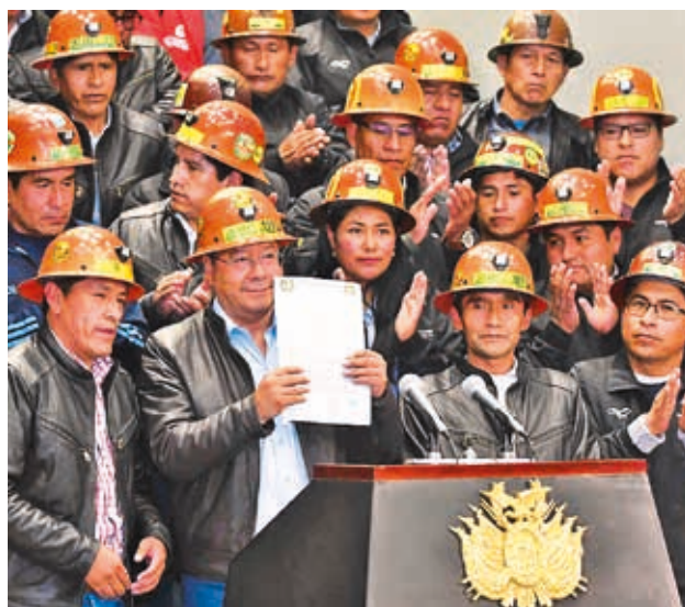
Dirigentes del Pacto de Unidad del ala arcista. APG

cumple con el artículo 7 del reglamento referido a cinco especificaciones: “El detalle de fechas de realización del congreso, los requisitos de participación según el Estatuto Orgánico del MAS, requisitos para la postulación de cargos a elegir, la modalidad de elección y la direc-