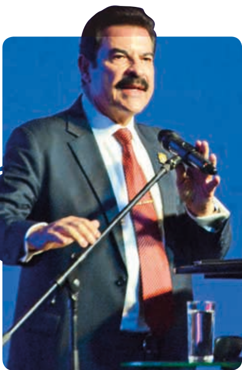
Alcalde. Manfred Reyes Villa.

Arrancó la Fexco 2024 con gala en el nuevo Pabellón Kanata