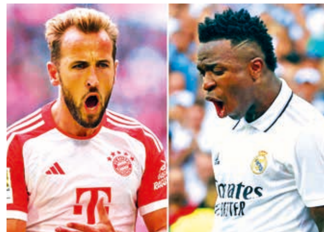
Los atacantes Harry Kane (izq.), de Bayern Múnich, y Vinicius, de Real Madrid.

A diferencia del Real Madrid, presente en doce de las catorce últimas semifinales de la Liga de Campeones, el Bayern se lo juega todo a la carta de la Champions tras perder su hegemonía en la Bundesliga después de once ligas consecutivas. Llega al