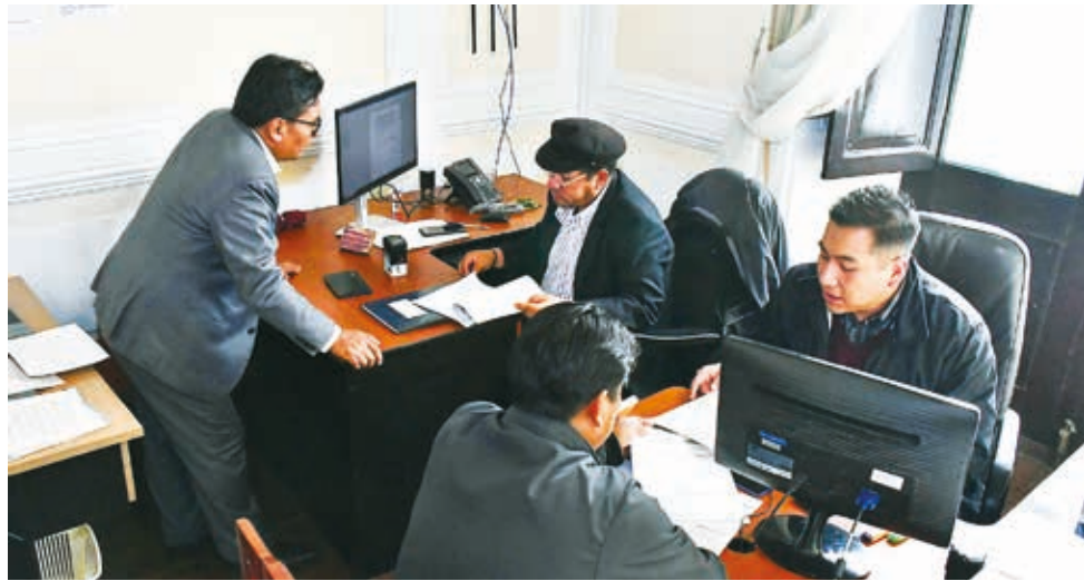
Miembros de la Comisión de la ALP reciben a postulantes para las judiciales, en febrero.