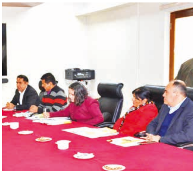
Vocales del Tribunal Supremo Electoral en Sala Plena.