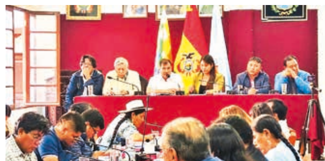
Presentan el proyecto de la Ciudadela de la Salud. L. CLAROS

Salud. Los legisladores manifestaron su intención de conformar una comisión especial para impulsar esta obra para la población