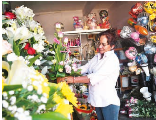
Más trabajadores por cuenta propia. XXXX

de la plaza. Por su asiento, ubicado en la esquina de la calle Sucre, han pasado diferentes personalidades. “Tener impecables los zapatos te da personalidad y las personas de antes tenían en serio este detalle”, contó.