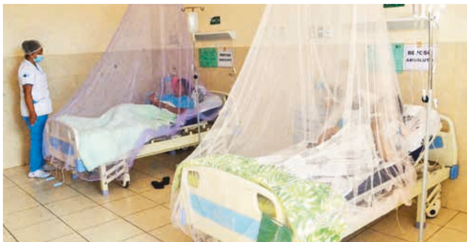
Pacientes internados con dengue en el Hospital del Sur. HERNÁN ANDÍA

Durante el fin de semana, “se atendieron bastantes casos” y las 15 camas de pediatría se ocuparon totalmente,