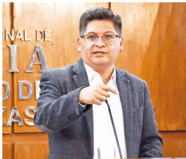
El ministro Marcelo Montenegro, ayer.

“Esta manera sistemática de generar una asfixia económica al país es un elemento que las calificadoras de riesgo están tomando en cuenta. El tema de las peleas políticas, las fricciones políticas que se están dando en la ALP, es un elemento constante que mencionan las calificadoras. Este problema político está mostrando que Bolivia no tiene un problema de solvencia sino de liquidez, porque algunos malos asambleístas no aprueban los créditos que son cercanos a los 700 millones de dólares. (Por ejemplo) se rechazó el crédito de la línea café del teleférico; cuántos créditos van a estar estancados sólo por el capricho de no aprobarlos”,