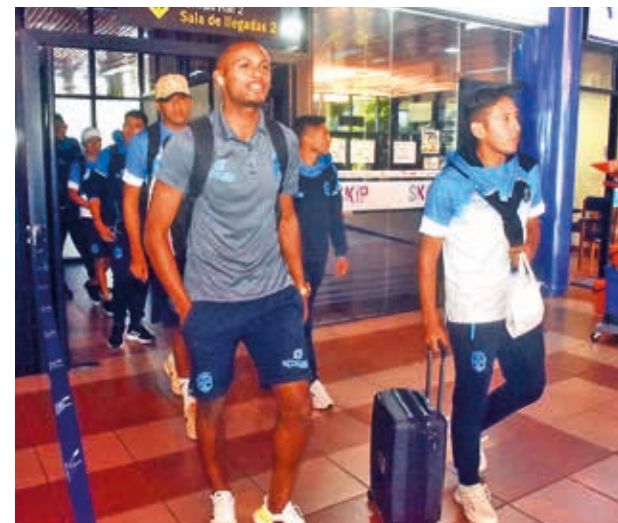
Jugadores de San Antonio llegan a Cochabamba, ayer.

Fútbol. El estratega de San Antonio pidió a la hinchada de Wilstermann, Los Gurkas, que le den su apoyo por su pasado en el Aviator