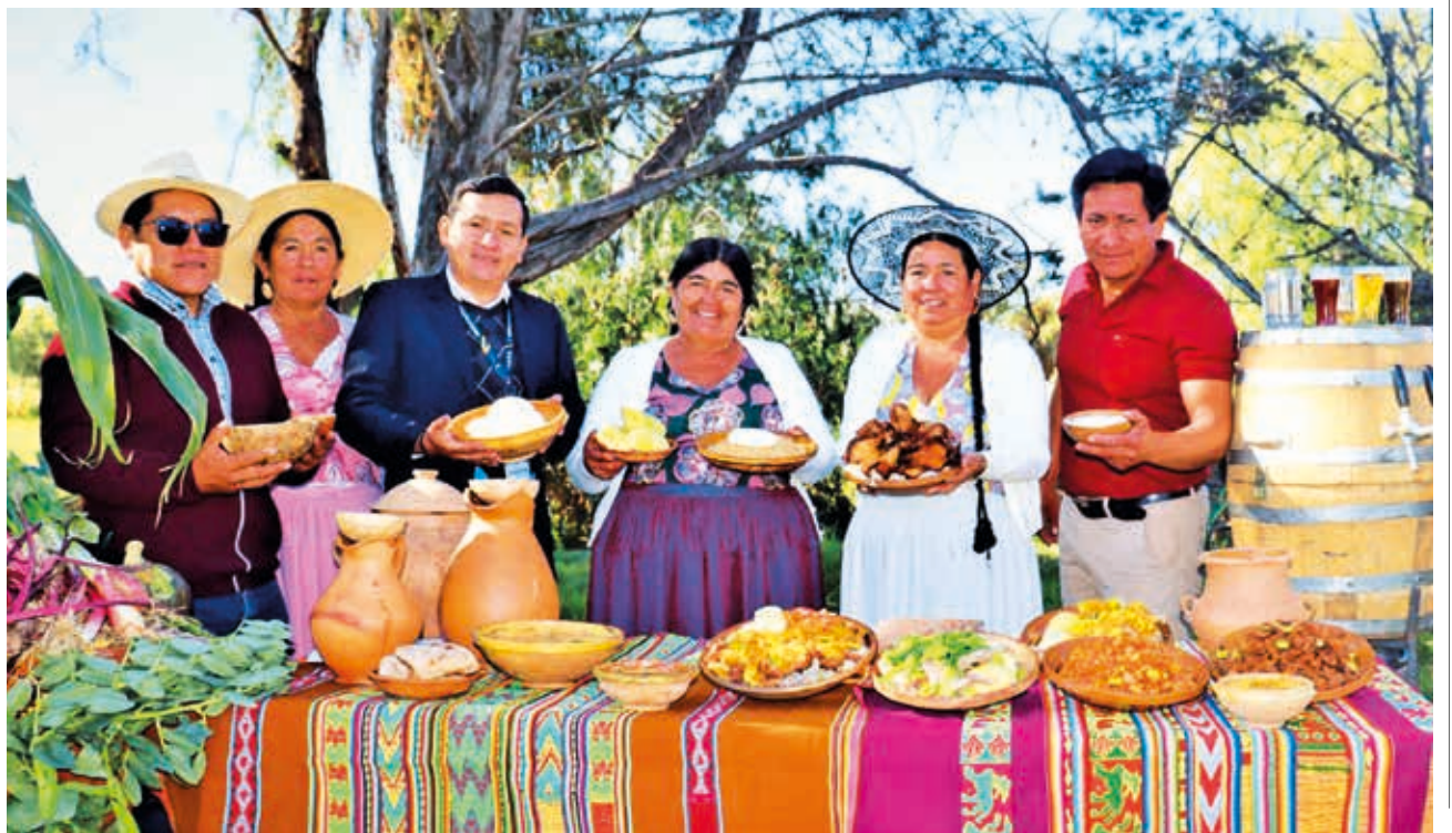
FERIA DE LA GASTRONOMÍA EN CURUBAMBA. Esta comunidad de Sacaba organiza para este feriado del 1 de Mayo una Feria Productiva Gastronómica para ofrecer a los visitantes lo mejor de sus platos típicos y cerveza artesanal, además de artesanías y fiesta con grupos musicales.

ENVÍE SU FOTO PARA PUBLICARLA EN ESTA SECCIÓN A: fotografia@lostiempos-bolivia.com