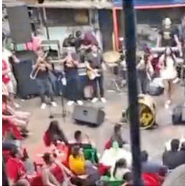
Video de la fiesta en el penal de San Sebastián.