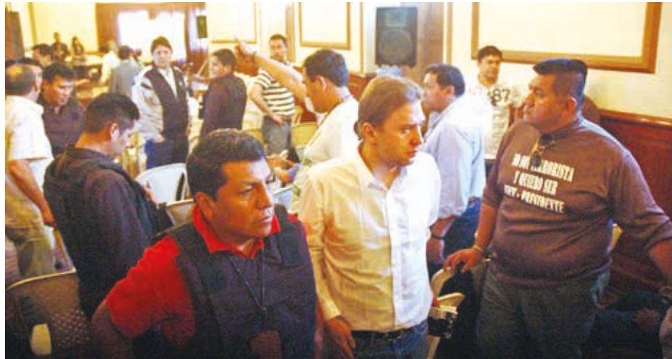
Los acusados por el caso Terrorismo en una de las audiencias.