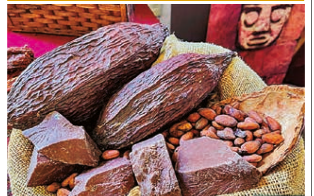
Producción de cacao nacional.

Las cuentas de depósitos llegaron a 15,1 millones, sólo 2% corresponden a personas jurídicas. El número de depósitos creció en 24% desde 2020 hasta 2023, pasando de 12,2 millones a 15,1 millones de cuentas.