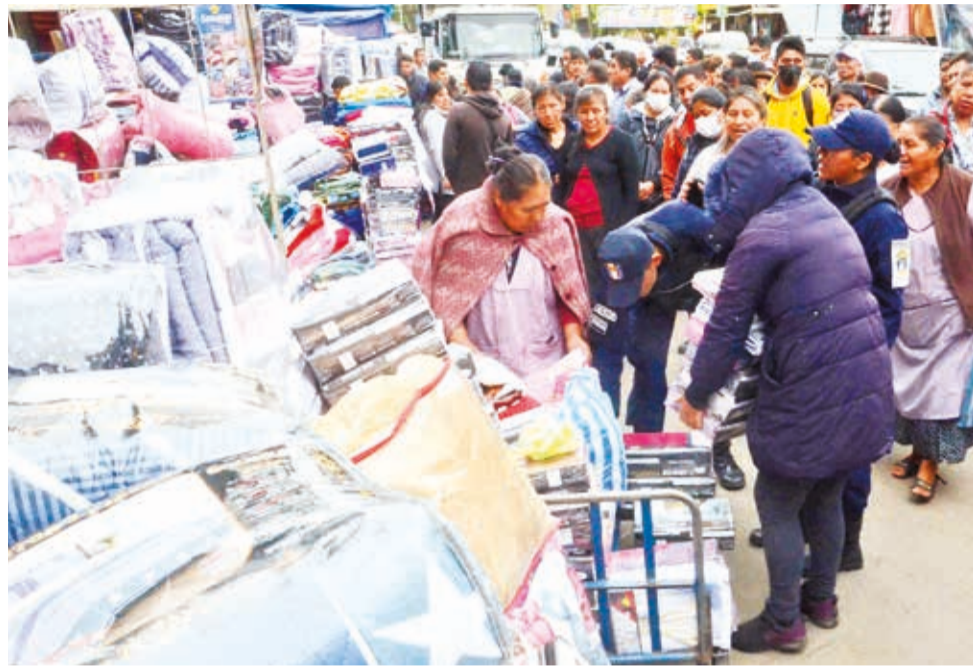
La Intendencia recorre un puesto que amplió su espacio hasta la Esteban Arze. H. ANDÍA

Los “desdobles” los hacen los mismos comerciantes, se