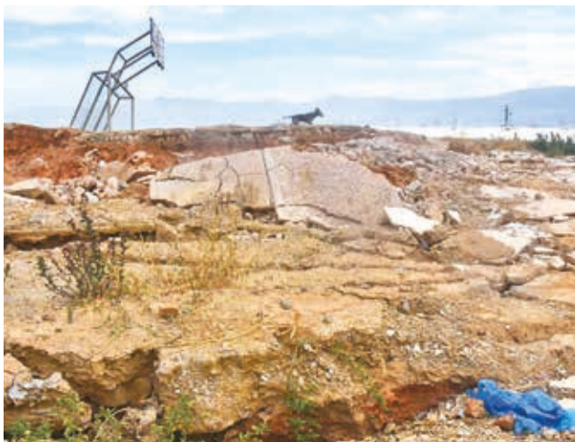
La cancha de barrio sepultada por la tierra.

Deslizamiento. Hay más de 300 viviendas afectadas en la mancomunidad y 60 son inhabitables. Los vecinos insisten con la declaratoria de emergencia para que el Gobierno gestione recursos