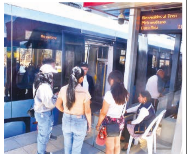
La feligresía llega en Mi Tren a Santa Vera Cruz.