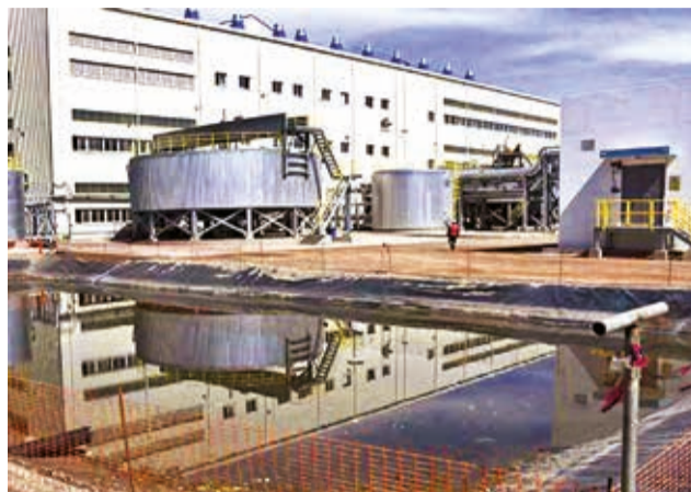
La planta de litio de YLB en Uyuni.

Dijo que también se tiene previsto nuevas inversiones para la extracción de la materia prima, pero que primero se debe cancelar el