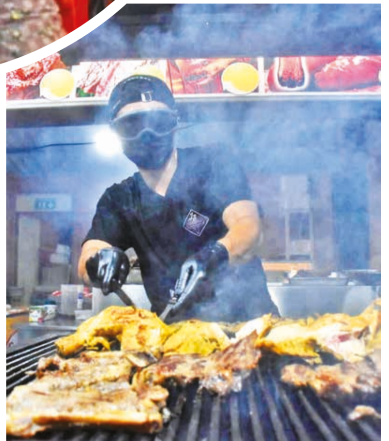
Un experto pone “toda la carne en el asador”.

es el precio más económico de la comida que se vende en la segunda versión de la Feria Exposición Internacional de Cochabamba.