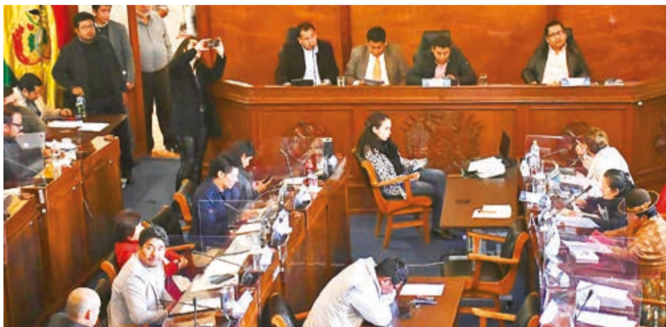
Sesión de la Comisión Mixta de Constitución por las ejecuciones judiciales.

Jáuregui advirtió que esa acción popular amenaza paralizar de “forma definitiva” el proceso de preselección. “Es un poco más complejo porque no se está hablando de un tema particular con relación a una o un postulante, se está alegando que los criterios de igualdad que contendría la Ley 1549”.