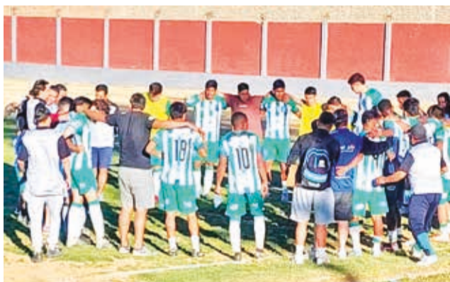
El plantel de Tiquipaya.

Por esa misma serie, Colcapirhua y Club Millonarios dividieron honores sin la apertura del marcador.