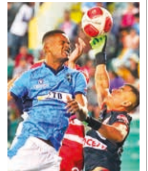
Una escena del partido Independiente vs. San Antonio.

San Antonio pierde, pero dirimirá el título ante la “U”