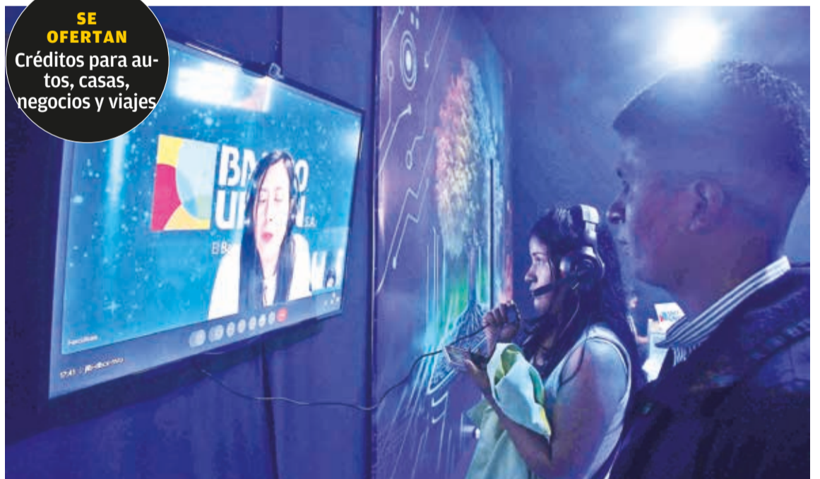
El metaverso y las novedades en el stand del Banco Unión. DANIEL JAMES

SE OFERTAN Créditos para autos, casas, negocios y viajes