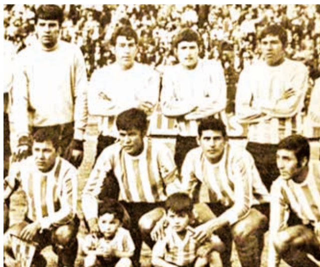
Mariscal Santa Cruz, campeón de la Recopa Sudamericana 1970 en La Paz.