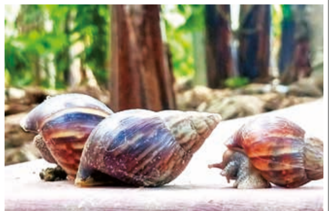
Productores y el Senasag hacen el retiro de caracoles. RRSS

"Lo que hacemos es recoger el caracol en plásticos y luego lo sepultamos. Hoy (ayer) se inició la recolección y este lunes va a ser intenso el trabajo con la ayuda de la