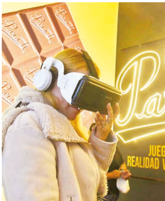
Visitantes disfrutaron de la tecnología en Fexco. DANIEL JAMES