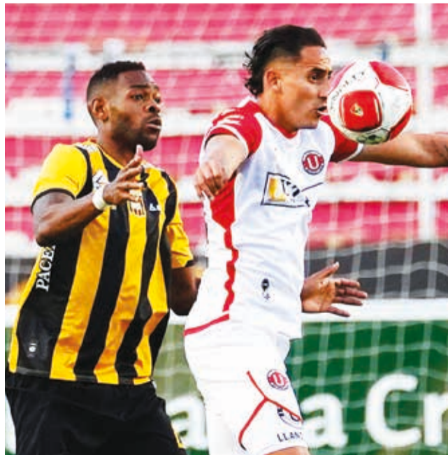
Llano, de Universitario (der.) protege el balón.

A tres minutos del final, un centro de Pinto fue conectado eficientemente por Magallanes para empujar el balón al fondo del arco, estableciendo la victoria del equipo Manzanero (1-2) y ocasionando que el pleito se dirima en la tanda de penales.