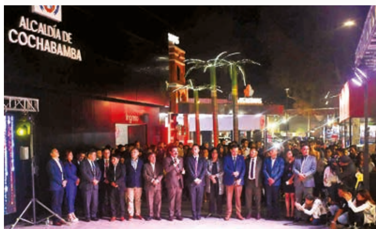
Inauguración del stand de la Alcaldía de Cochabamba. DANIEL JAMES