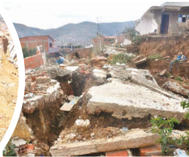
Casas desmoronada y que están a punto de caer.