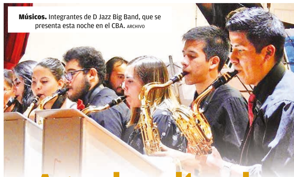
Músicos. Integrantes de D Jazz Big Band, que se presenta esta noche en el CBA.