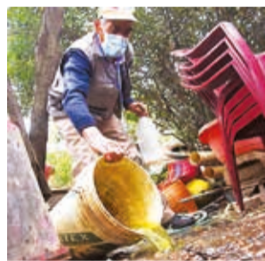
Dstrucción de criaderos del mosquito Aedes aegypti . DANIEL JAMES

Además, el Secretario de Salud indicó que los mosquitos que están en las lagunas y en los charcos son los 'culex' y