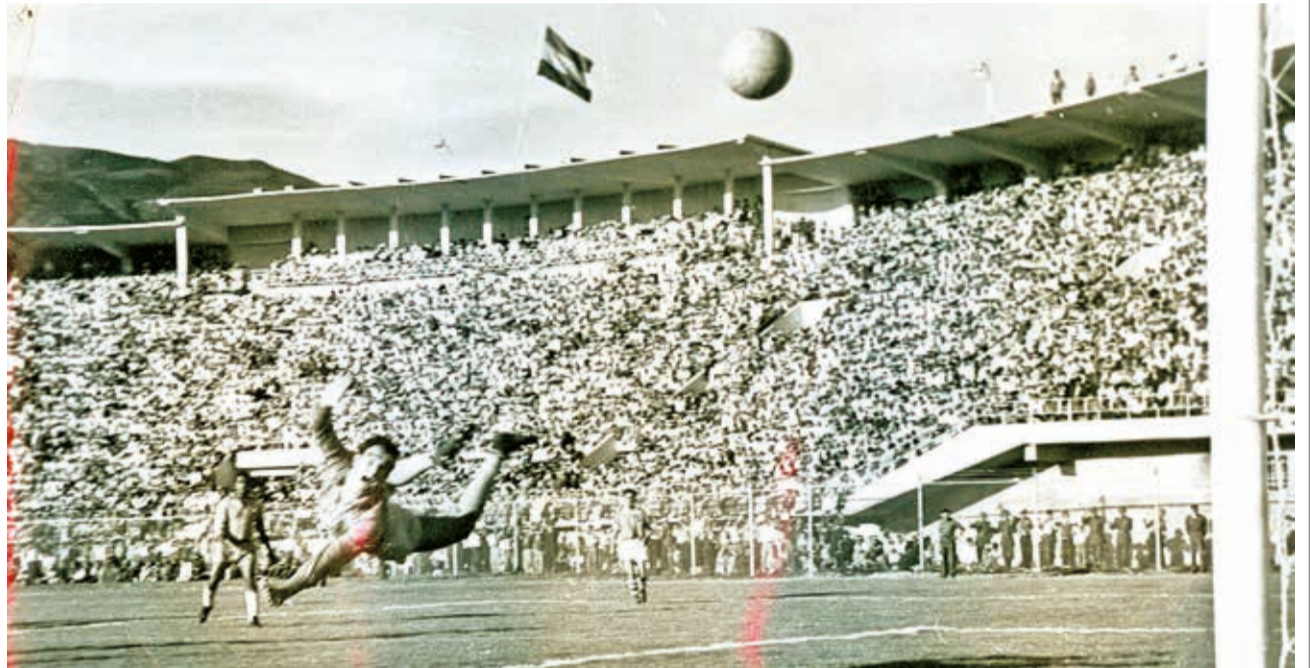
Celebración de Bolivia en el estadio Félix Capriles de Cochabamba, tras ganar el Sudamericano (hoy Copa América) de 1963. HISTORIA DEL FÚTBOL BOLIVIANO

El 8 de diciembre de ese año, Bolívar jugó la final de ida ante Boca Juniors en el estadio Hernando Siles, con victoria 1-0. Una semana después, Boca ganó el título en Buenos Aires al ganar 2-0.