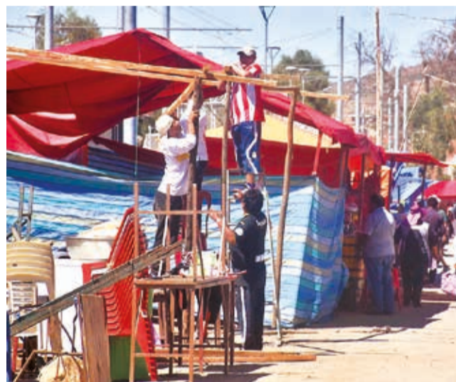
Armado de puestos para la venta de miniaturas.