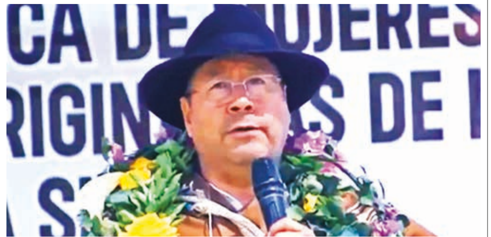
El presidente Luis Arce en el acto de inauguración del congreso de las bartolinas.

“Miren lo que la derecha y los evistas vienen diciendo, que estamos bajando de calificación porque manejamos la economía, parece que no leen ni siquiera los informes que salen de afuera, porque Bolivia no ha dejado de pagar