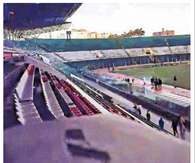
El estadio Tahuichi Aguilera, sede de la final de la Copa Sudamericana 2025.