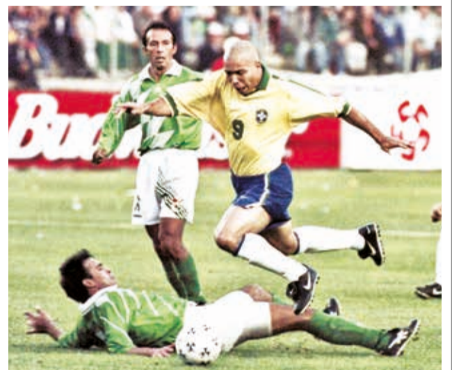
Bolivia 1-3 Brasil, en la final de la Copa América 1997, en duelo decisivo jugado en el Hernando Siles.