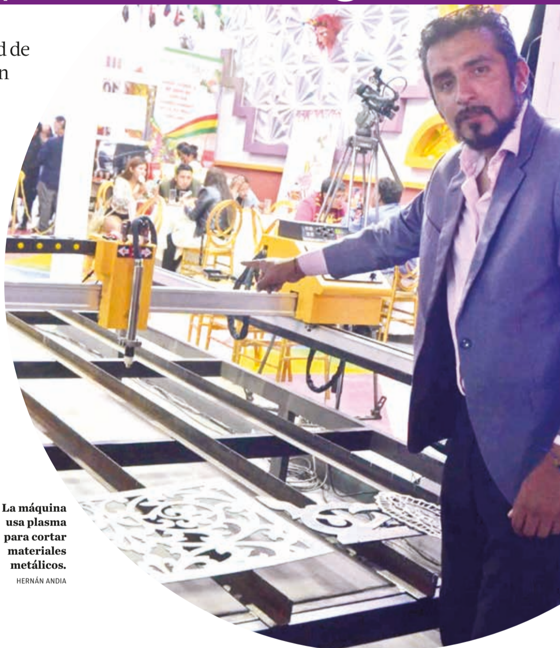
La máquina usa plasma para cortar materiales metálicos.

El corte con plasma es más preciso y fácil de usar