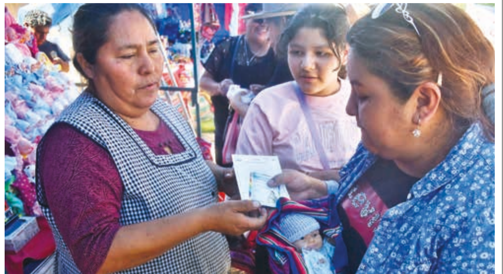
Feligreses llegan al santuario del Señor de Santa Vera Cruz.

"La gallina negra representa a la mujer viuda, la blanca a una soltera y la roja a una soltera alegre. Es lo mismo con los gallos, para las mujeres que buscan pareja", explicó una artesana.