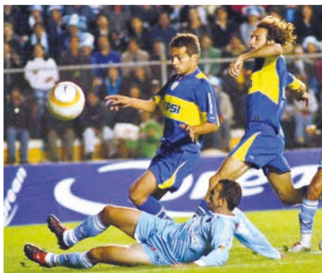
Bolívar vs. Boca Juniors, por la final de ida de la Copa Sudamericana 2004. LA PRENSA