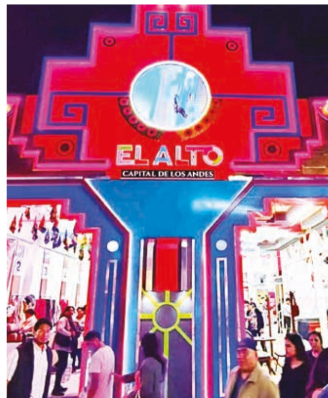
Frontis del stand de El Alto en su inauguración. GAMEA