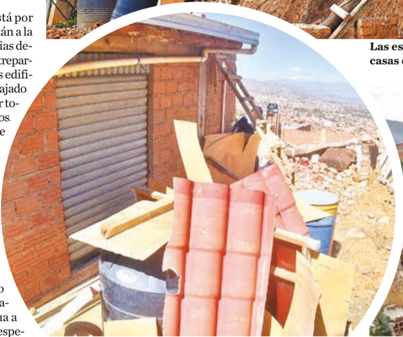
Los tanques de agua de las familias afectadas.