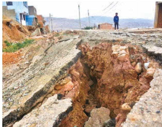
Las calles intransitables en Takoloma.