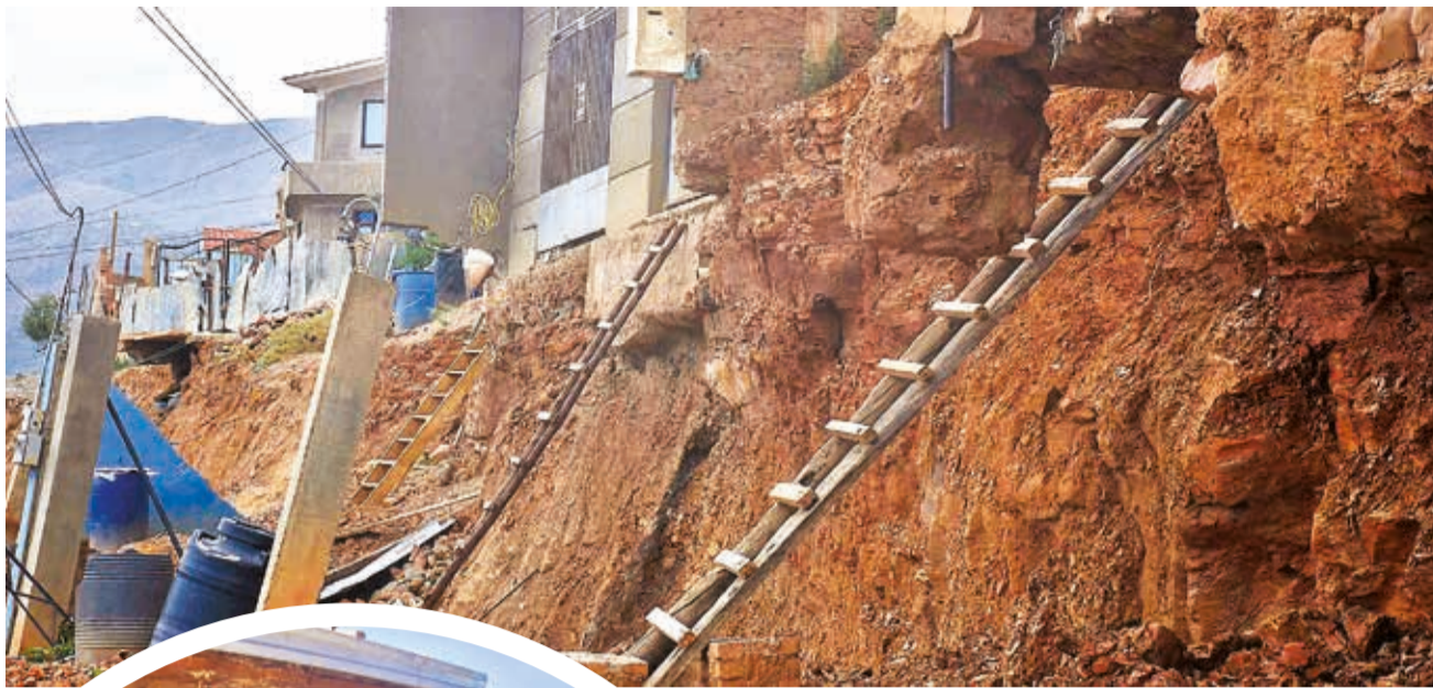
Las escaleras que usan las familias para ingresar a sus casas en Takoloma por los deslizamientos.

El drama de las familias se agudizó desde junio de 2023,