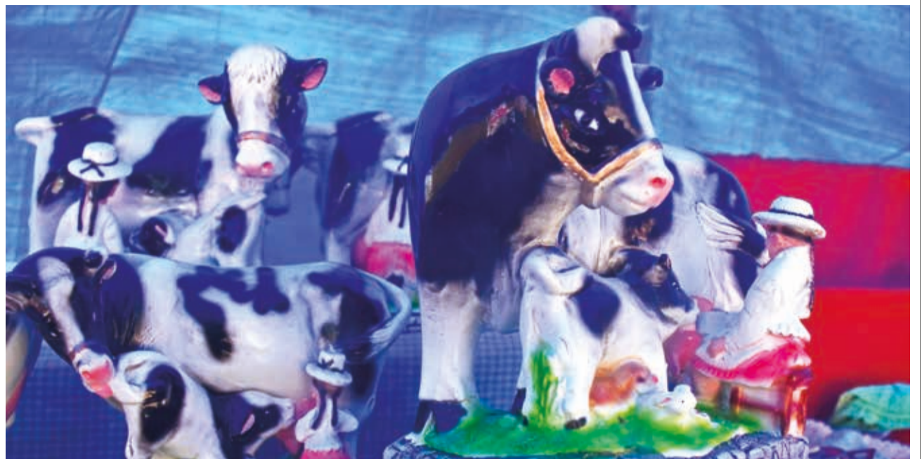
FIESTA DE LA FERTILIDAD. Artesanías que representan la granja y la producción del valle, una de las alegorías presentadas en vísperas de la fiesta de Santa Vera Cruz, en la que también se pueden pedir hijos, mejor cosecha o más ganado.

ENVÍE SU FOTO PARA PUBLICARLA EN ESTA SECCIÓN A: fotografia@lostiempos-bolivia.com