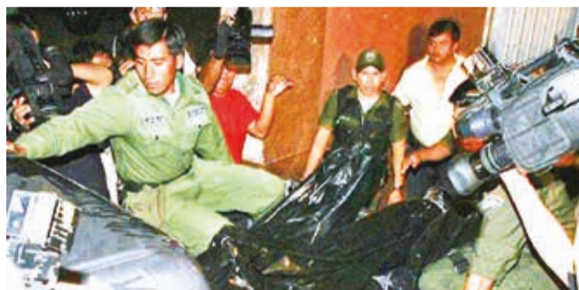
Operativo en el hotel Las Américas, en 2009.

Asalto. El organismo amplió tres meses el plazo para que Bolivia cumpla con el informe final sobre el caso Hotel Las Américas