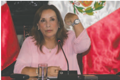
La presidenta de Perú, Dina Boluarte, quien muestra sus joyas en una rueda de prensa en Lima