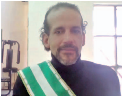
El gobernador Luis Fernando Camacho, en una audiencia virtual desde el penal de Chonchocoro

El representante de HRF afirmó: “HRF pudo comprobar de primera mano las duras condiciones carcelarias en las que se encuentra detenido ar-