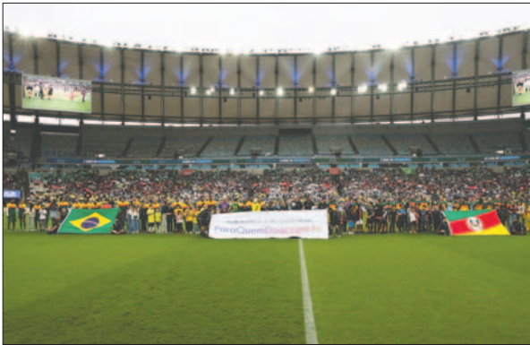
Hubo bastante expectativa por el partido benéfico que se jugó en el Maracanã

el clima de armonía aficionados que, pese a las rivalidades históricas, lucían camisetas de los grandes cuatro clubes de Río de Janeiro: Flamengo, Fluminense, Vasco da Gama y Botafogo.