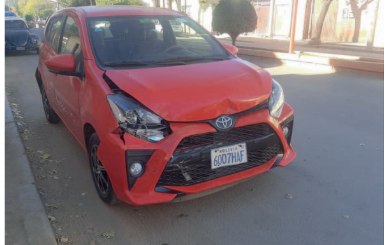
Vehículos sufrieron daños materiales