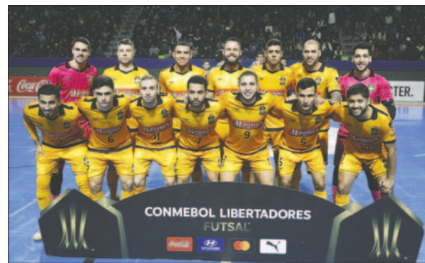
Magnus el mejor de la Copa Libertadores de Futsal 2024

to sin barrera les dieron la victoria a los argentinos por 2-0.