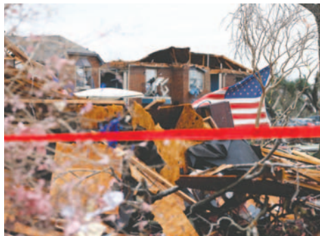
Fotografía de archivo de los destrozos causados por tormentas en Texas (Estados Unidos)

“Estamos atravesando una pérdida de vidas desgarradora, incluida la