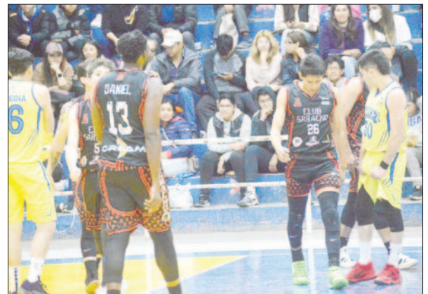
Ambos equipos obligados a ganar para escalar en la tabla