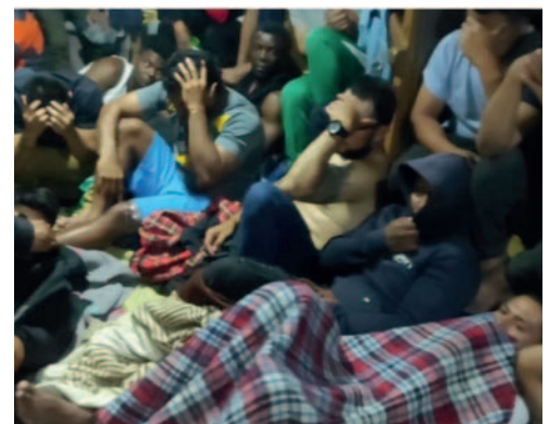
Crisis carcelaria se vive en toda Bolivia

La delicada situación carcelaria no solo se vive en Oruro, ya que según informó Juan Carlos Limpías, director general de Régimen Penitenciario, la problemática del hacinamiento en las cárceles del país se ha agravado con