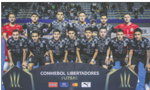
Fantasmas Morales Moralitos no pudo mejorar la campaña del pasado año

Ante San Lorenzo de Argentina, el panorama fue similar, ya que en momentos el partido parecía destinado al empate. Sin embargo, un desvío de balón y un tiro libre direc-