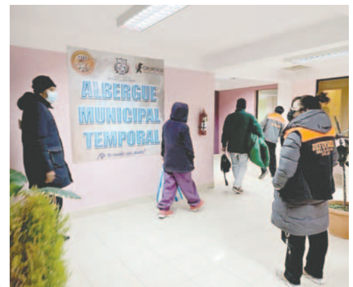
Personas vulnerables tendrán un lugar donde pasar la noche / DIO