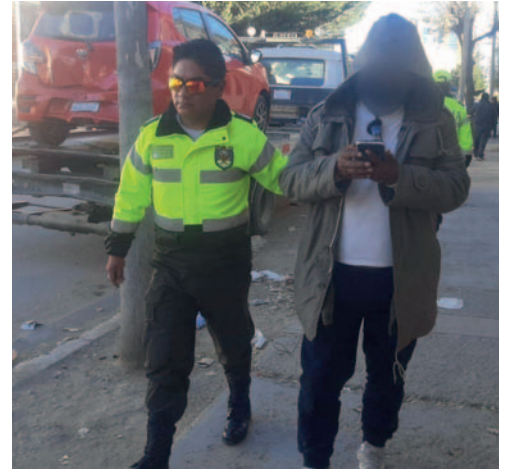
Conductor fue aprehendido por Tránsito

El caso se encuentra en proceso de investigación por la División Accidentes de Tránsito para determinar las causas directas del hecho. El informe fue remitido al Ministerio Público.