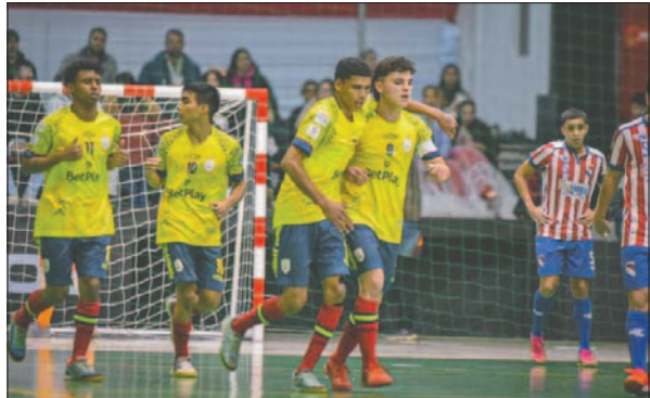
Colombia terminó coronándose campeón del certamen /AMF