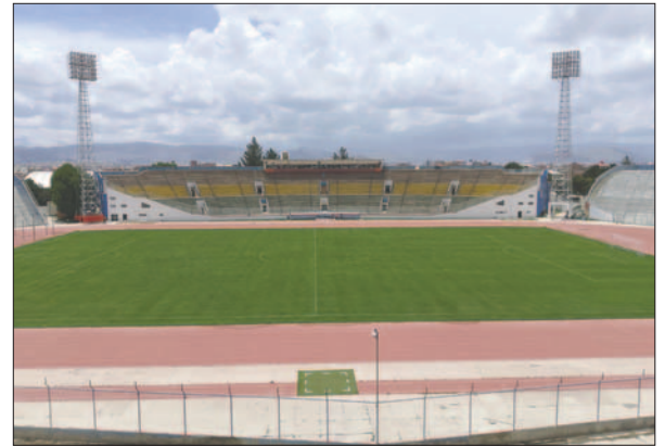
El estadio "Jesús Bermúdez" necesita más atención de las autoridades

Al hacer las averiguaciones correspondientes, se conoció que aún no se han desembolsado los recursos necesarios para las obras. Esto se debe a que en la institución departamental se presentan diferentes trabas que