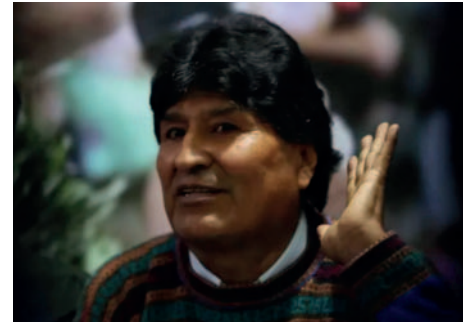
Evo Morales busca postularse a la presidencia en 2025