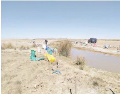
Los árboles del lago Uru Uru prenden su raíz y crecen /FRUTICULTORES

“Nuestro plantines están creciendo a todo dar, llevamos agua y a más tutores, palos y demás para que sean de protección a los plantines y nuestros árboles se prendieron en ambos la-