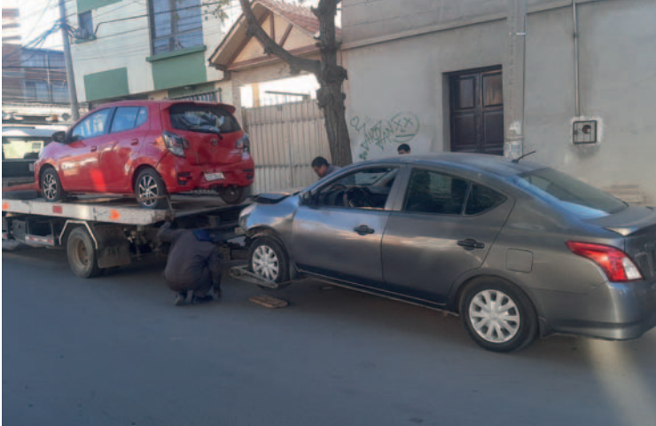
Conductor en estado de ebriedad ocasionó un choque múltiple