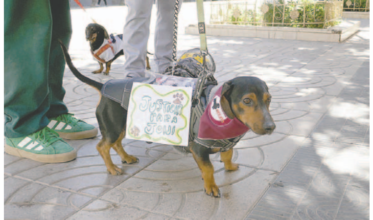
Club rechaza enfáticamente el maltrato animal / LA PATRIA

Mediante la protesta y marcha, el Club Salchicha Oruro exigió el respeto a los animales y rechazó cualquier acto de violencia y maltrato hacia ellos. Esperan que más asociaciones defensoras de animales y clubes alcen la voz y repliquen el pedido de justicia para que las autoridades tomen medidas contra los responsables de este hecho de maltrato animal.