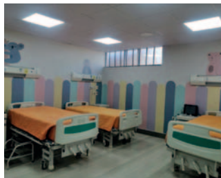
Pacientes pediátricos reciben atención por cuadros respiratorios

“La mayoría de los pacientes con este cuadro de neumonía son lactantes, también tenemos escolares, pero lo que hemos notado en la población es el descenso de las temperaturas, lo cual ha provocado una