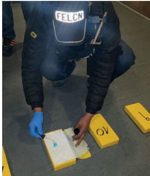
La prueba de narcotest dio positivo a cocaína

El caso aún se encuentra en investigación y se espera información adicional por parte de las autoridades policiales para esclarecer los detalles y determinar posibles implicados en esta actividad ilícita.