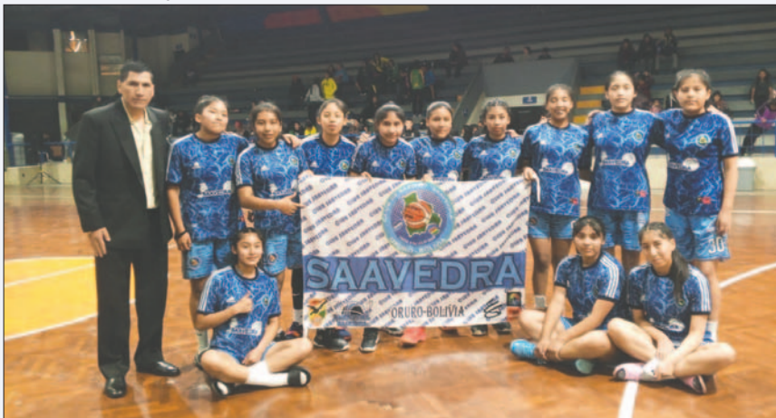
El cuadro de Saavedra tuvo una buena participación en la capital valluna