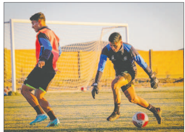
San Antonio llegó con anticipación, entrenó ayer en la cancha de CDT Real Oruro / SAN ANTONIO