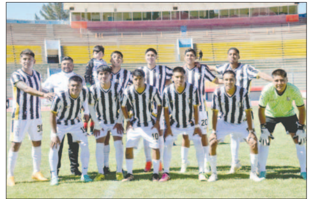
Actualmente Oruro Royal participa en la Copa "Simón Bolívar"

El pasado 20 de mayo, en una asamblea realizada en el Sindicato Mixto de Trabajadores Fabriles de Oruro, el bando de Canavoni llevó a cabo una elección en la que participaron alrededor de 30 personas, entre socios, simpatizantes, exjugadores y exentrenadores. En dicha