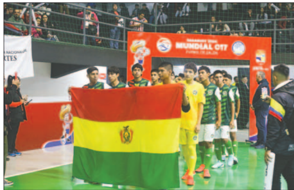
Séptimo lugar para los jóvenes jugadores bolivianos en este mundial

La campaña de Bolivia tuvo momentos importantes en este certamen mundial, pero se debe seguir trabajando para conseguir objetivos mayores e ingresar a las "ins-