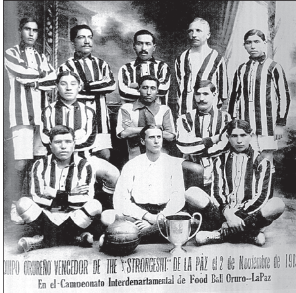
128 años de una rica historia del decano del fútbol boliviano

En cuanto al ámbito deportivo, las cosas tampoco van del todo bien. El club participa después de muchos años en la Copa "Simón Bolívar" y lucha por clasificarse a la segunda etapa, pero el sueño de muchos royalistas de ver al decano en la División Profesional parece bastante lejano.