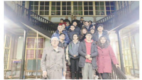
Durante dos jornadas estudiantes se capacitaron con miras al Día de Museos