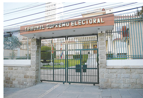
Frontis del Tribunal Supremo Electoral

La autoridad electoral afirmó que, para continuar con el proceso de preselección, lo primero que debe hacer la ALP es aprobar una nueva ley que dé continuidad a la Ley 1549 transitoria para las elecciones judiciales. Esta norma otorgaba al Legislativo un plazo de 80 días para completar la selección de candidatos,