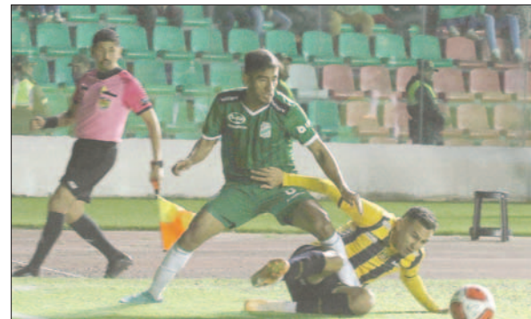
El partido se jugó con mucha intensidad, pero con un solo gol