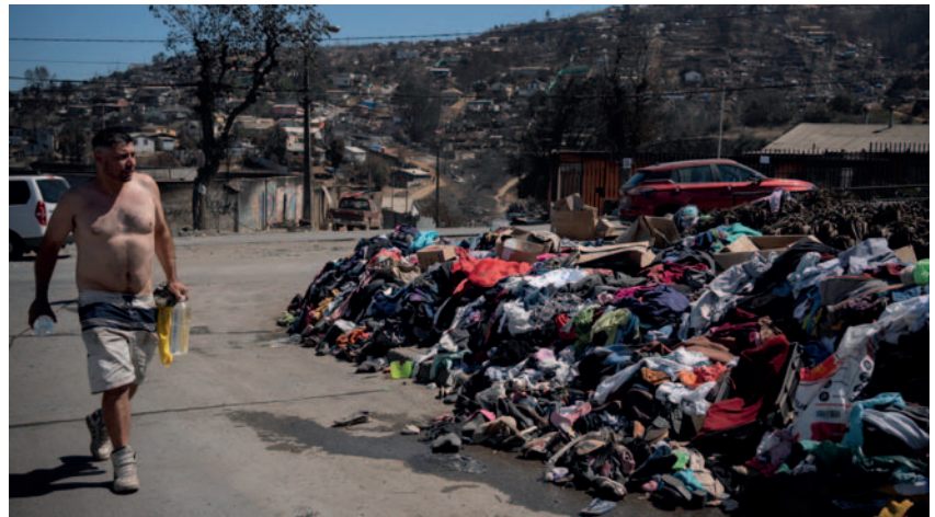
Según la Policía chilena, 137 personas fallecieron por los incendios