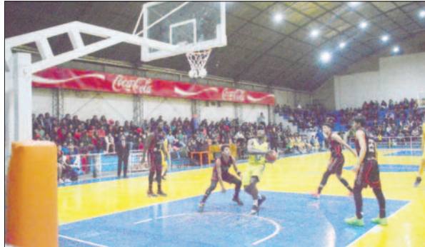
En la ida ganó Saracho 88-85 el 4 de abril reciente, hoy se juega la revancha / LA PATRIA

Por el momento, tras finalizar la undécima fecha, con 20 puntos están igualados, Nacional Potosí y Pichincha, detrás está Leones con 19 unidades y Tarija Básquetbol tiene 18 puntos en la tabla. Después marchan CAN, Universitario, Saracho, Carl A-Z, Kinwa y Básquetbol La Paz.