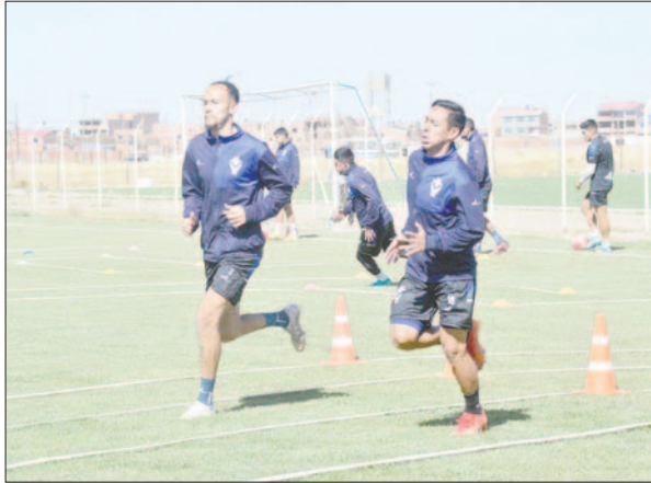
El equipo orureño entrenó estos días pensando en ganar a San Antonio

El partido se llevará a cabo este lunes 27 de mayo desde las 18:00 horas en el estadio "Jesús Bermúdez".