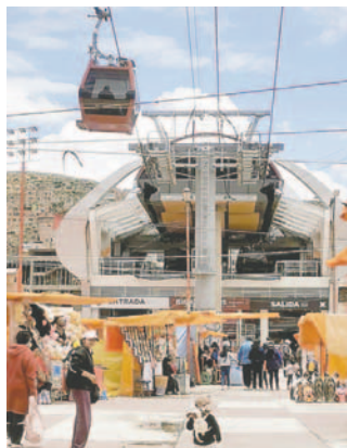
Teleférico Turístico Virgen del Socavón de Oruro

Según convocatoria hay dos categorías y tres premios económicos