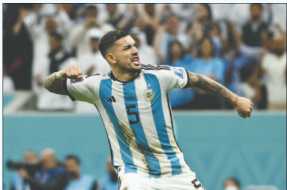
Leandro Paredes jugador de la selección argentina de fútbol

Alexis Mac Allister, Gonzalo Montiel y Gerónimo Rulli se encuentran en Argentina desde el martes pasado para sumar más días de descanso tras cumplir las respectivas temporadas con sus clubes.