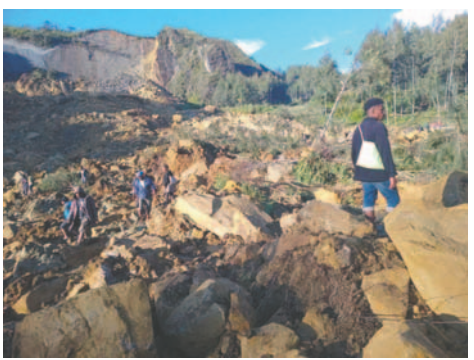
Lugareños caminan con sus enseres en la zona donde una avalancha golpeó la aldea de Kaokalam, provincia de Enga, Papúa Nueva Guinea / EFE

LA PATRIA / EFE Una agencia de Naciones Unidas estimó este domingo que más de 670 personas murieron en la avalancha de tierra que en la madrugada del viernes sepultó una aldea remota al norte de Papúa Nueva Guinea (Oceanía), aunque hasta el momento se han recuperado solo cinco cadáveres.