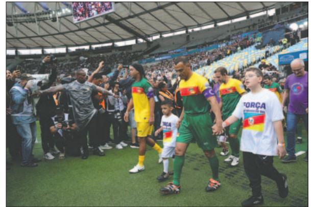
Salen los equipos a la cancha encabezados por Ronaldinho y Cafú