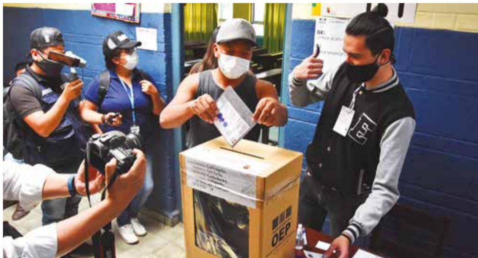
Ciudadanos acuden a las urnas en las elecciones generales en 2020. DANIEL JAMES

Si bien hay nuevas organizaciones políticas interesadas en participar en las elecciones, éstas no cuentan con personería jurídica y tendrían que acudir a los comicios en alianza con alguno de los 11 partidos políticos.