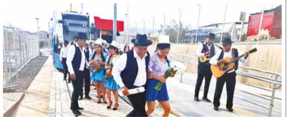
El Ministro y un grupo musical filman el video para Santa Vera Cruz. CRISTINA COTARI

Los municipios con problemas en sus límites deben resolverlos en la Unidad de Límites de la Gobernación, que actúa como entidad mediadora. De acuerdo a los datos, la mayoría llega a firmas de actas de conciliación y resuelven sus conflictos. Sin embargo, la última instancia es el referendo, fase en la que la población decidirá a qué lugar pertenece.