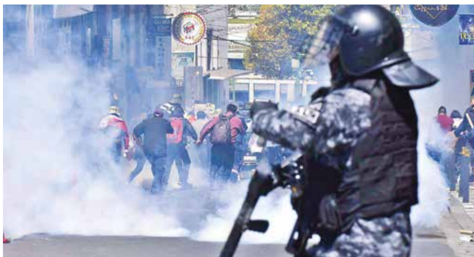
Gasifican una movilización social en La Paz.

En el caso del Magisterio Urbano, hubo movilizaciones en todos los departamentos, pero esta semana concentraron las protestas en la sede de gobierno en demanda de un pliego petitorio sectorial.