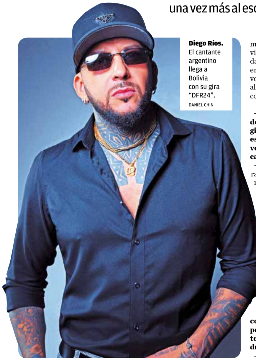
Diego Ríos. El cantante argentino llega a Bolivia con su gira “DFR24”.

Concierto. Este año, en el marco de su gira “DFR24”, el cantante argentino regresa una vez más al escenario de la Fexco para cautivar al público con su energía y talento este sábado 27 de abril.