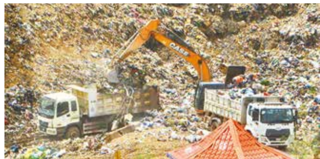
El botadero de K'ara K'ara, que debe cerrar en 2024. D.J.

Control. La nueva concesionaria ingresará tras finalizar el contrato, en septiembre, con Colina SRL, que opera el relleno sanitario