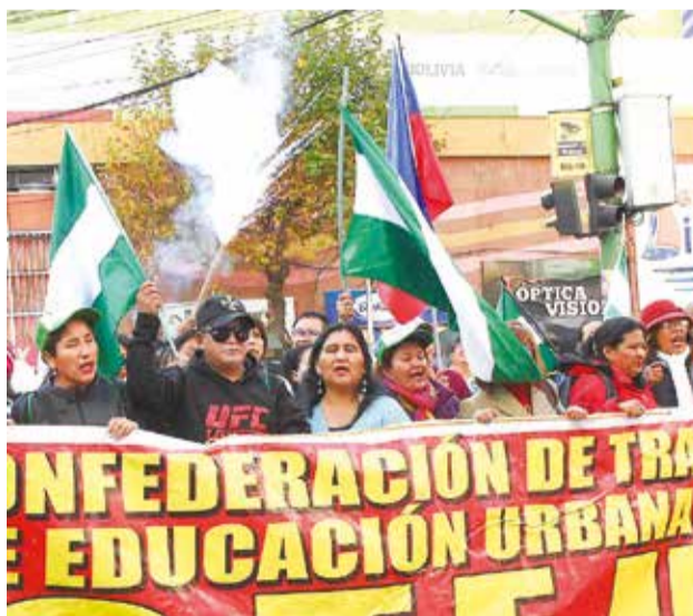
Maestros y trabajadores en salud movilizados, ayer.

En horas de la tarde de ayer, tras el desarrollo de la marcha, “el magisterio y la Comisión de Planificación de la Cámara de Diputados suscribieron un acuerdo para instalar mesa