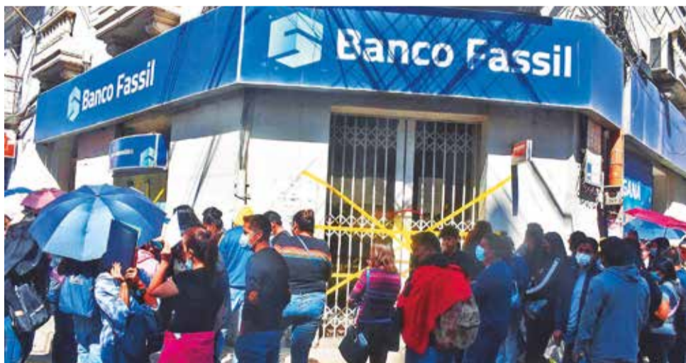
Oficinas del Banco Fassil precintadas después de la intervención. JOSE ROCHA

no voy a poder o no voy a rendir igual y me dicen que me llamarán después. Mientras tanto, estoy conduciendo un taxi para generar ingresos”, contó a Los Tiempos .