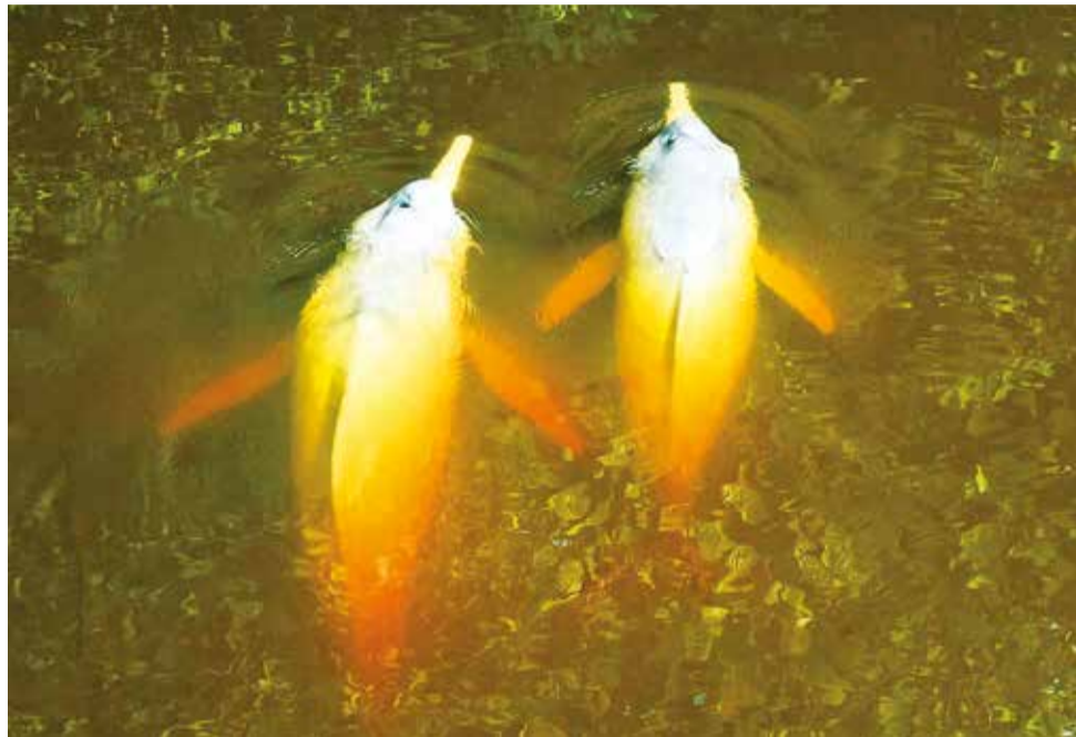
La pareja de bufeos atrapada en un arroyo en Villa Tunari a causa de una riada. D. JAMES

bufeos Enzo Aliaga añadió que, al tratarse de una cría, es aún más vulnerable.