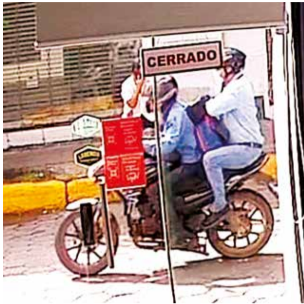
Los antisociales filmados por las cámaras, ayer en Santa Cruz.

Este hecho fue registrado por las cámaras de seguridad de los negocios ubicados alrededor. En las imágenes se puede observar que uno de los delincuen-