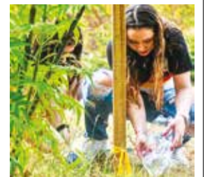
La plantación en la laguna Alalay. LOS TIEMPOS