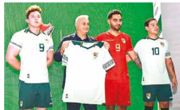
Presentación de las camisetas de Bolivia para la Copa América, ayer.