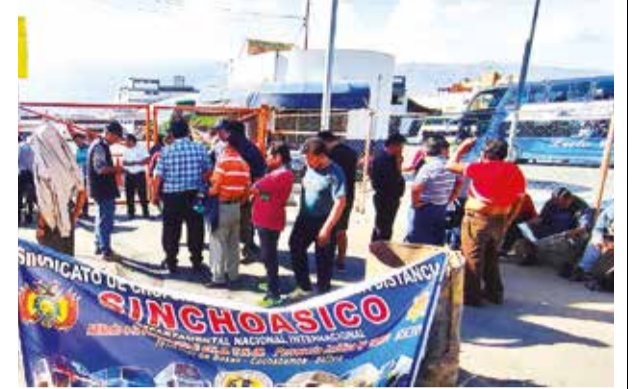
Los choferes en el bloqueo, ayer en la terminal. D.JAMES

(Dirección de Análisis Criminal e Inteligencia) está investigando y tenemos la certeza de que en las próximas horas esclarezcamos el asalto”, añadió Holguín.