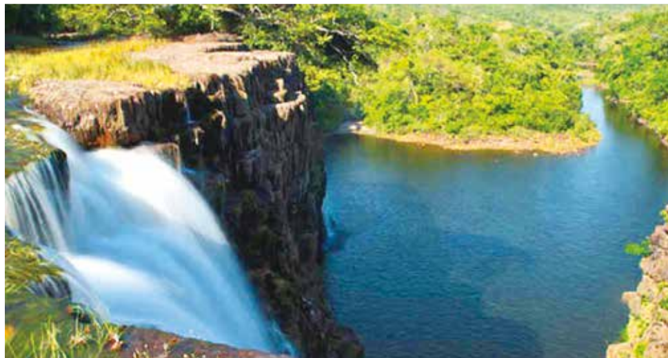
Reserva natural en Bolivia. MMAA

Ilegal. El Comité de Gestión mencionó aprovechamiento ilegal de los recursos forestales y el archivo de las denuncias contra la exautoridad.