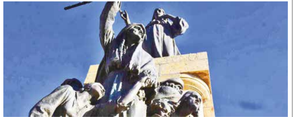
El monumento a las Heroínas de la Coronilla, en la colina de San Sebastián. D.JAMES

El proceso de contratación es una licitación pública internacional con un concepto de concesión de 25 años. La firma del contrato está prevista para mediados de julio. Más de 40 empresas, incluyendo proponentes de España, Canadá, México, Alemania y Bolivia, mostraron interés en el proyecto.