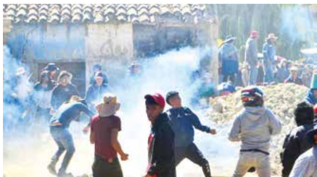
La pelea en Chulla Jayata, la anterior semana. DANIEL JAMES

Conflicto. Los municipios del valle bajo se enfrentaron la anterior semana por la ejecución de obras en Chulla Jayata