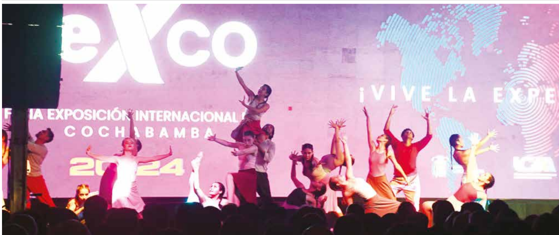
Coreografías en la Fexco 2024, en el acto de inauguración realizado anoche en el pabellón Kanata. DANIEL JAMES