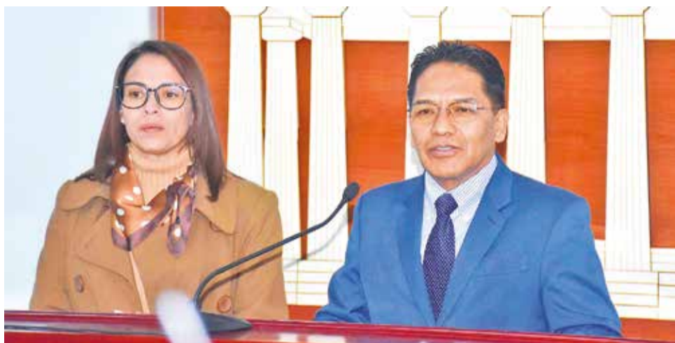
El viceministro de Defensa del Consumidor, Jorge Silva, ayer.

“La contaminación de la propiedad privada con el Gobierno nacional se encuentra en el DS 5143, que establece la aplicación de herramientas de gobierno electrónico. (...) Establece que el Consejo de la Magistratura, en coordinación con la Agetic, implementará el Sistema Único del Registro de Derechos Reales”.