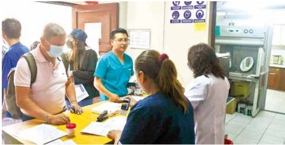
La atención en el laboratorio de referencia del Sedes, ayer. CARLOS LÓPEZ

MULTIMEDIA: Escanee este QR para ver el video de la nota. www.lostiempos.com