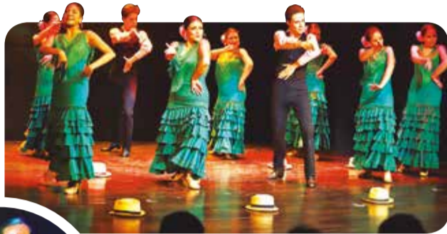
Baile. Presentación de A ComPás Bolivia.

La compañía y escuela de Danzas Españolas y Flamenco A ComPás Bolivia, de La Paz, se prepara para deslumbrar al público cochabambino con su espectáculo concierto de danza “Andalucía de punta a punta”. En el marco de sus 20 años de trayectoria, este evento ejecutará diferentes palos del flamenco, propios y tradicionales de las diversas regiones de Andalucía.