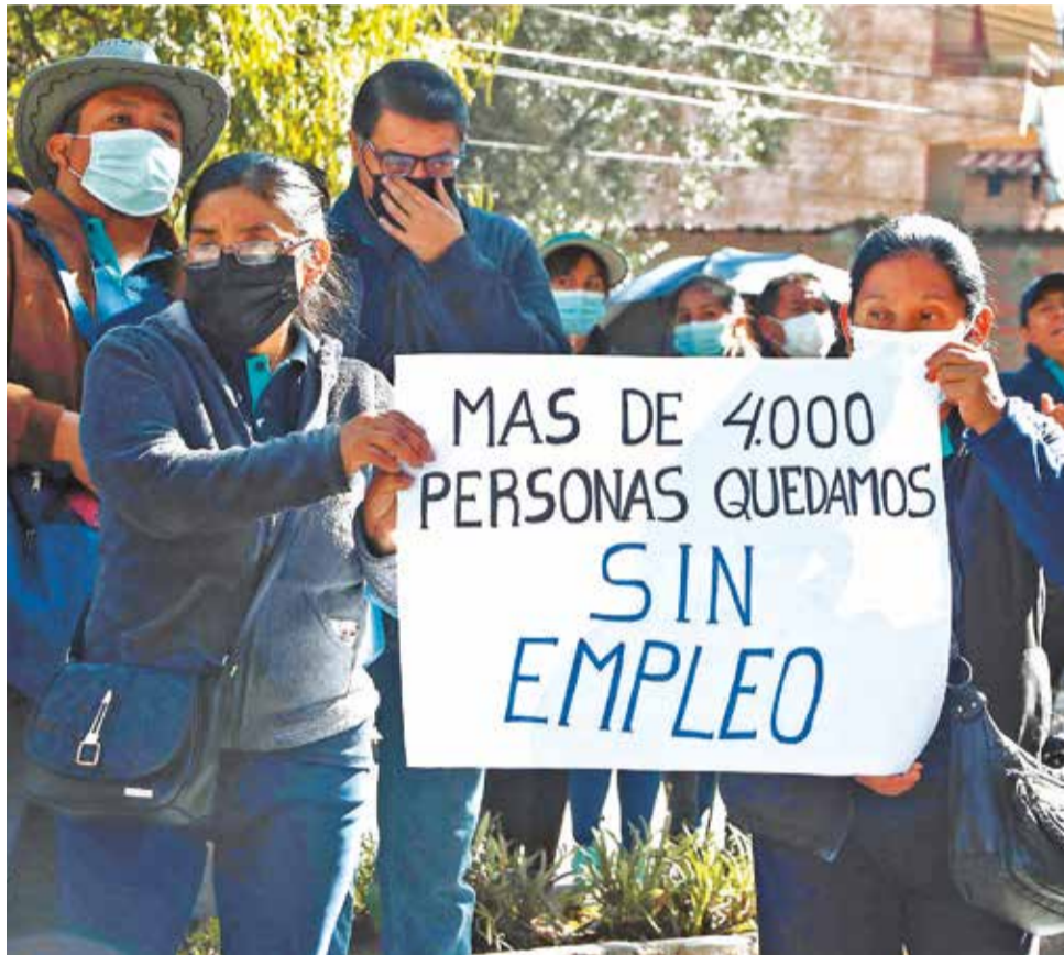
Extrabajadores de Fassil protestan por el cierre del banco en mayo de 2023.

“En mi caso, no encuentro trabajo. Cuando en las entrevistas menciono mi discapacidad, parece que piensan que