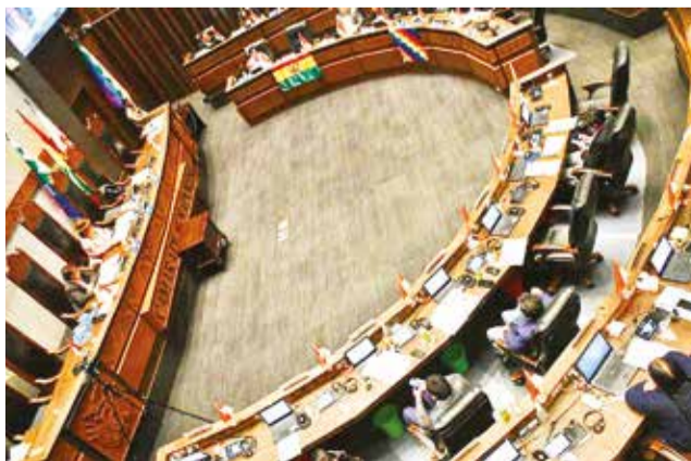
El Senado debe tratar los contratos en próximos días.

“Se pone en evidencia un patrón de incumplimientos con las disposiciones constitucionales y legales vigentes, principalmente de la AJAM, al no aprobar reglamentos críticos y demorar años en la aprobación de contratos”, se lee en el informe emitido por esta comisión.